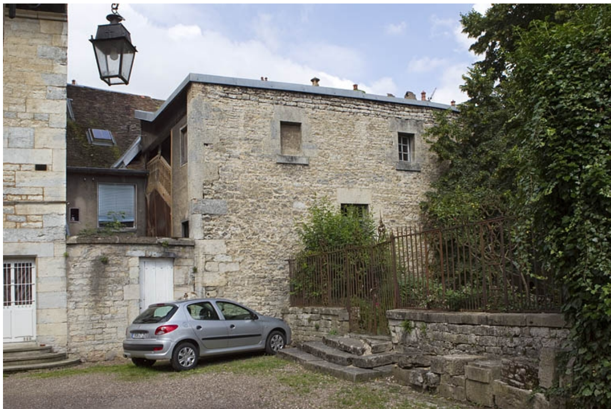
Vue d'ensemble de l'arrière de la maison depuis la cour de l'hôtel Alviset.

25, Besançon, 21 rue des Martelots, lieudit : îlot des Martelots