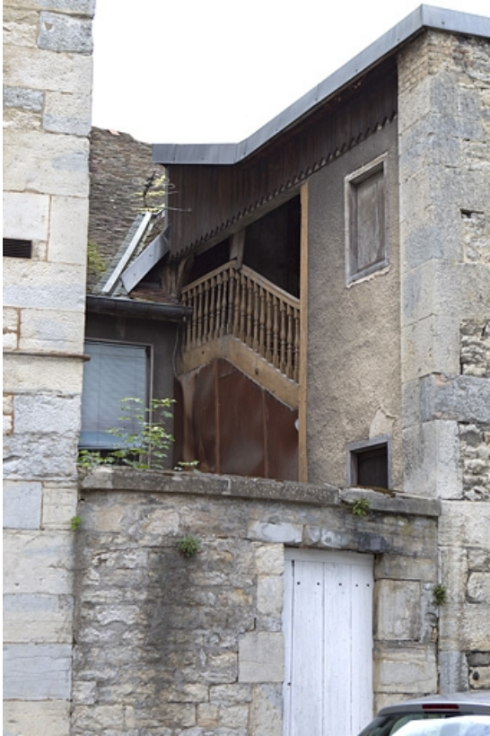
Détail de l'escalier à cage ouverte depuis la cour de l'hôtel Alviset.

25, Besançon, 21 rue des Martelots, lieudit : îlot des Martelots