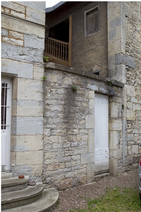
Détail du mur de clôture de la cour depuis celle de l'hôtel Alviset.

25, Besançon, 21 rue des Martelots, lieudit : îlot des Martelots