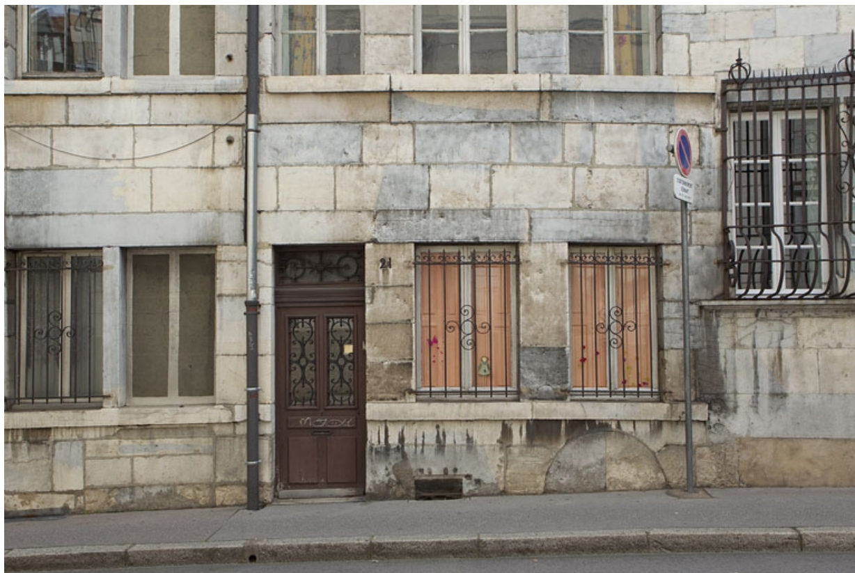
Façade antérieure du logis : détail du rez-de-chaussée.

25, Besançon, 21 rue des Martelots, lieudit : îlot des Martelots