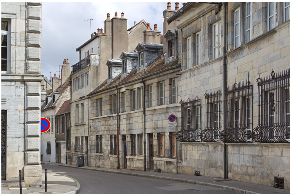
Vue d'ensemble du logis principal depuis la rue de trois quarts droit.

25, Besançon, 21 rue des Martelots, lieudit : îlot des Martelots