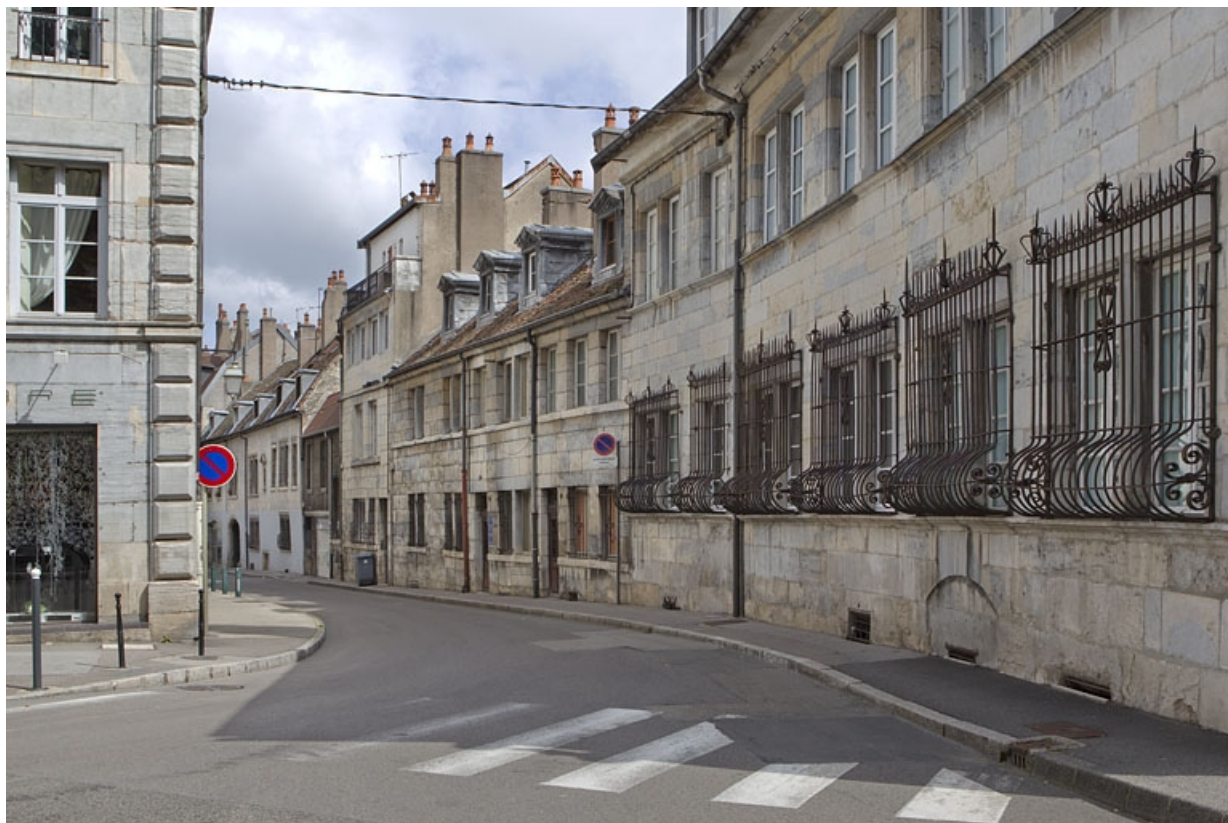
Vue d'ensemble du logis principal dans l'alignement de la rue.

25, Besançon, 21 rue des Martelots, lieudit : îlot des Martelots