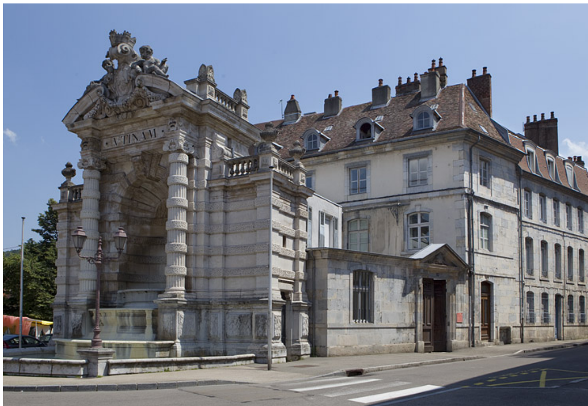
Vue d'ensemble de l'hôtel et de la fontaine monumentale de trois quarts droit depuis la rue.

25, Besançon, 1 rue des Martelots, lieudit : îlot des Martelots