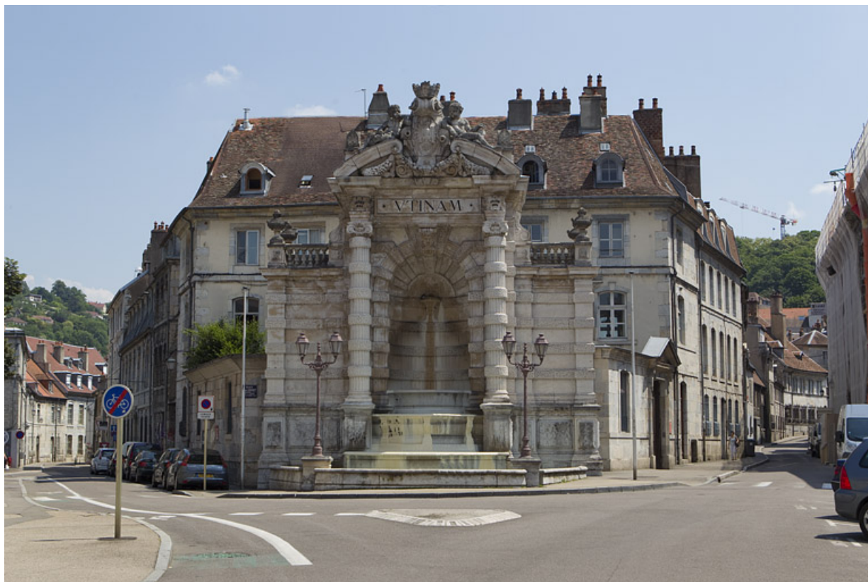
Vue d'ensemble de l'hôtel et de la fontaine monumentale de face depuis la place.

25, Besançon, 1 rue des Martelots, lieudit : îlot des Martelots