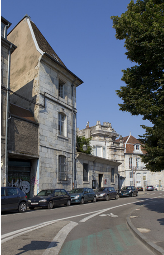
Façade latérale gauche : vue d'ensemble.

25, Besançon, 1 rue des Martelots, lieudit : îlot des Martelots