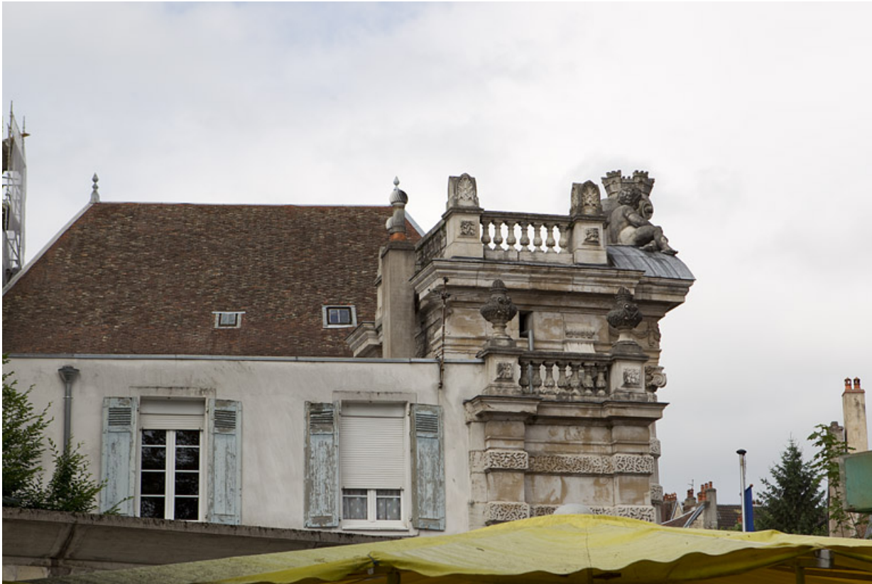
Façade latérale gauche : détail de la partie supérieure.

25, Besançon, 1 rue des Martelots, lieudit : îlot des Martelots