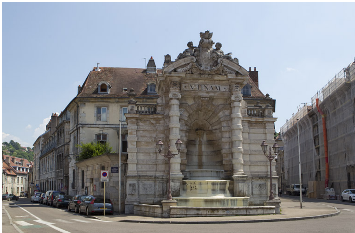
Vue d'ensemble de l'hôtel de trois quarts gauche depuis la rue.

25, Besançon, 1 rue des Martelots, lieudit : îlot des Martelots