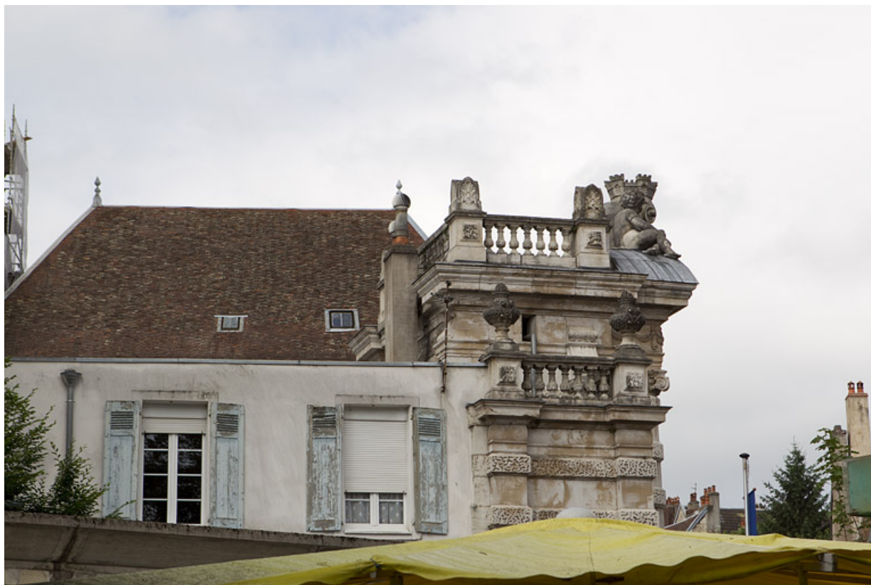
Façade latérale gauche : détail de la partie supérieure.

25, Besançon, 1 rue des Martelots, lieudit : îlot des Martelots