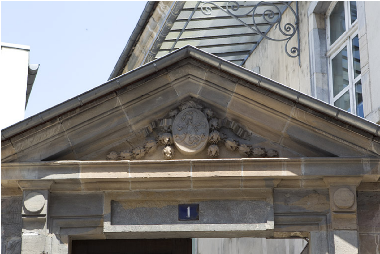
Détail du fronton du portail d'entrée avec le monogramme du propriétaire.

25, Besançon, 1 rue des Martelots, lieudit : îlot des Martelots