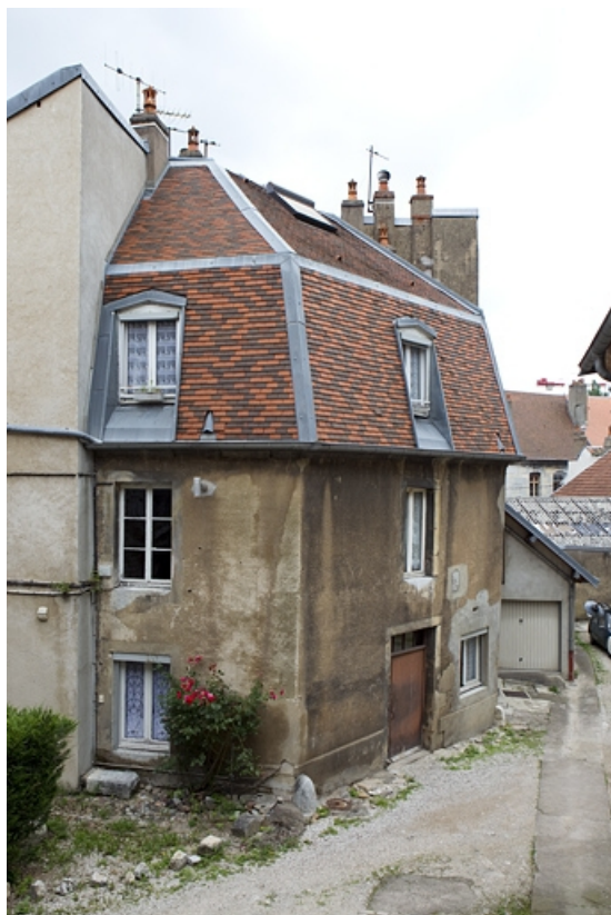
Vue d'ensemble du logis secondaire à gauche de la cour. 25, Besançon, 13 rue des Martelots, lieudit : îlot des Martelots