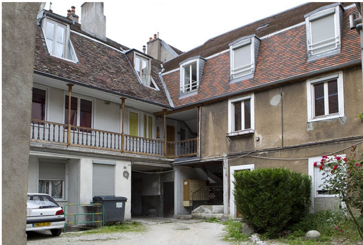
Vue des façades sur cour du logis principal, de trois quarts gauche. 25, Besançon, 13 rue des Martelots, lieudit : îlot des Martelots