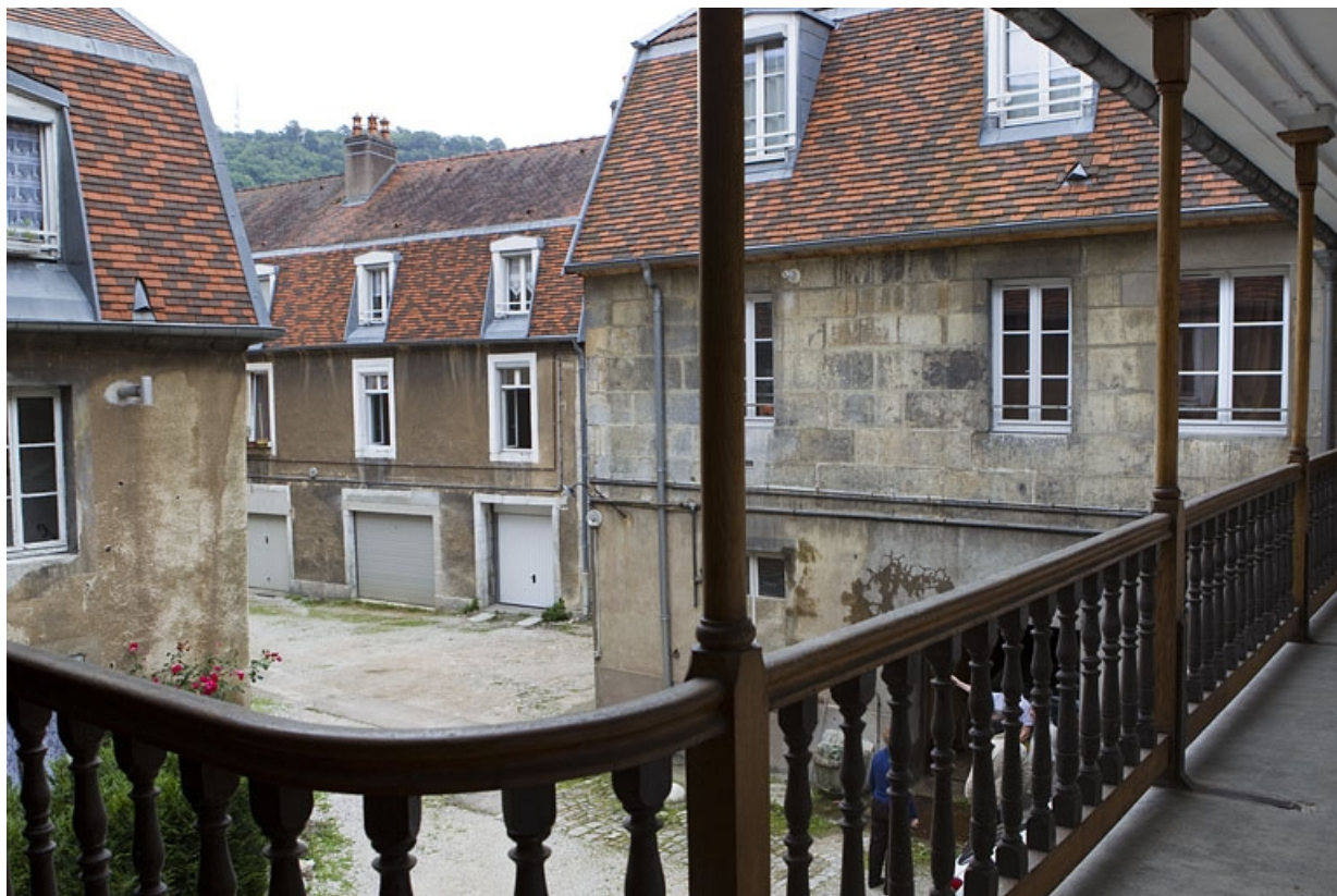
Vue d'ensemble des logis sur cour depuis la galerie du logis principal.

25, Besançon, 13 rue des Martelots, lieudit : îlot des Martelots