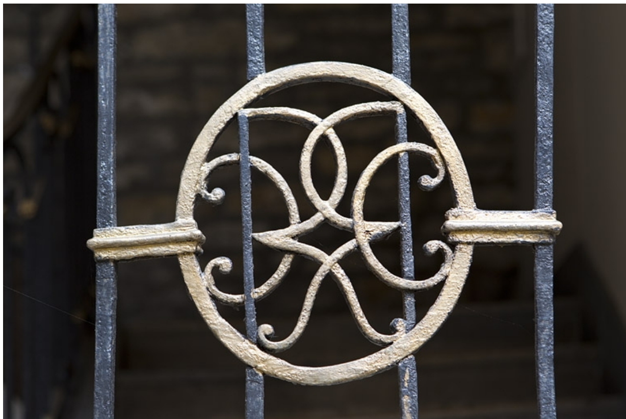
Détail du médaillon en ferronnerie de la rampe de l'escalier principal.

25, Besançon, 13 rue des Martelots, lieudit : îlot des Martelots