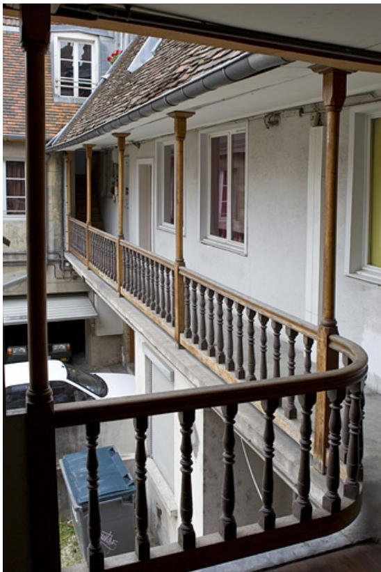
Détail de galerie sur cour du logis principal depuis le haut de l'escalier. 25, Besançon, 13 rue des Martelots, lieudit : îlot des Martelots