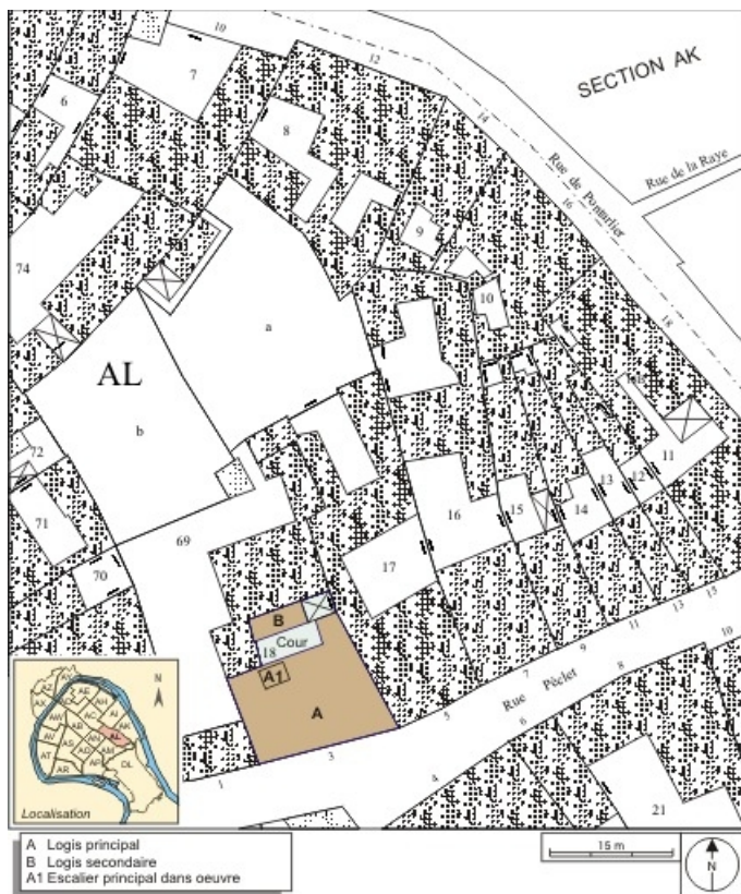
Plan masse et de situation. Extrait du plan cadastral, 1974, section AL. 25, Besançon, 3 rue Pécelet, lieudit : îlot des Martelots