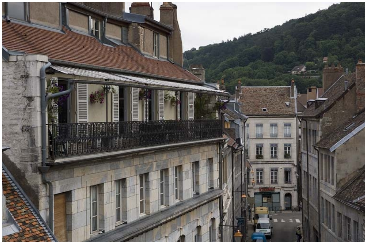
Vue du deuxième étage sur rue et de la surélévation.

25, Besançon, 3 rue Péclet, lieu dit : îlot des Martelots