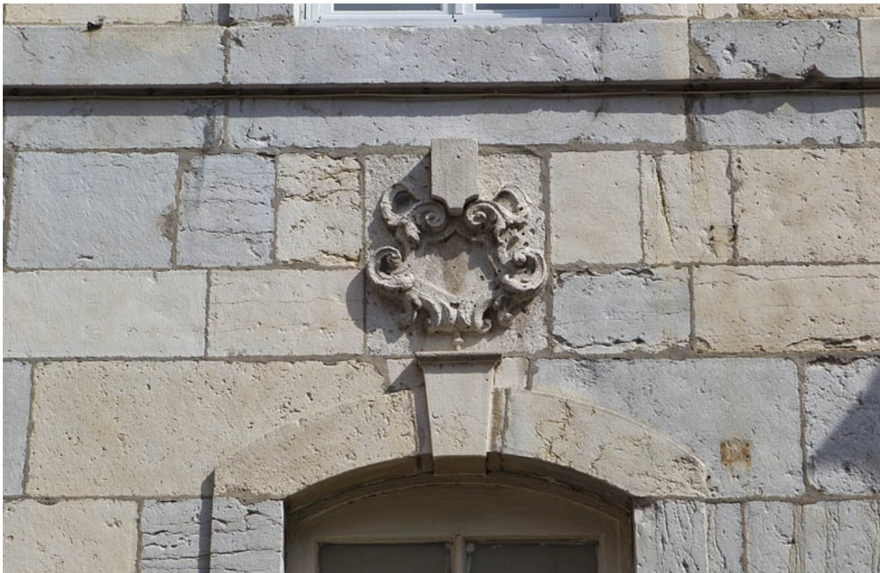
Détail du décor au-dessus d'une baie du rez-de-chaussée.

25, Besançon, 3 rue Péclet, lieudit : îlot des Martelots