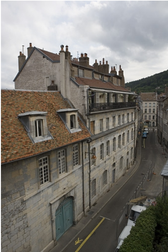
Vue d'ensemble de l'édifice de trois quarts gauche. 25, Besançon, 3 rue Péclet, lieudit : îlot des Martelots