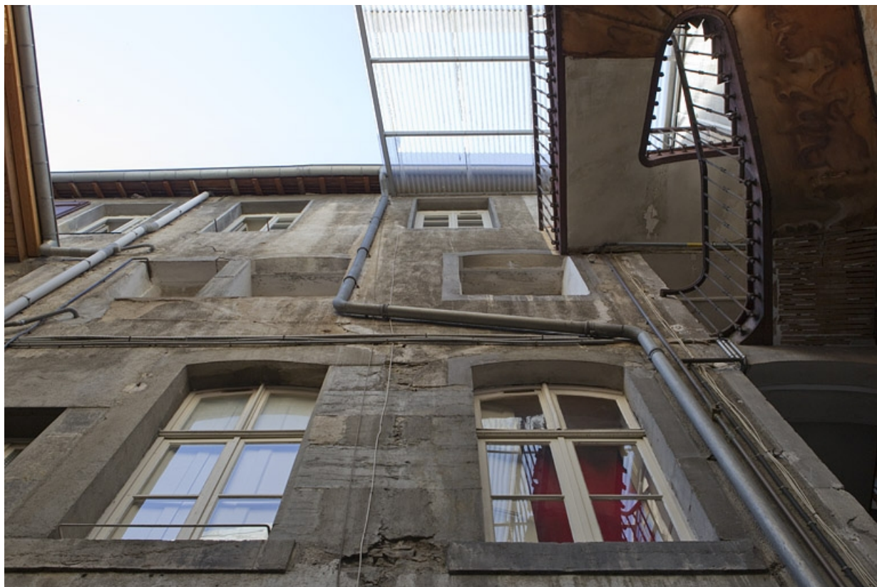
Détail de la façade postérieure du logis principal. 25, Besançon, 3 rue Péclet, lieudit : îlot des Martelots