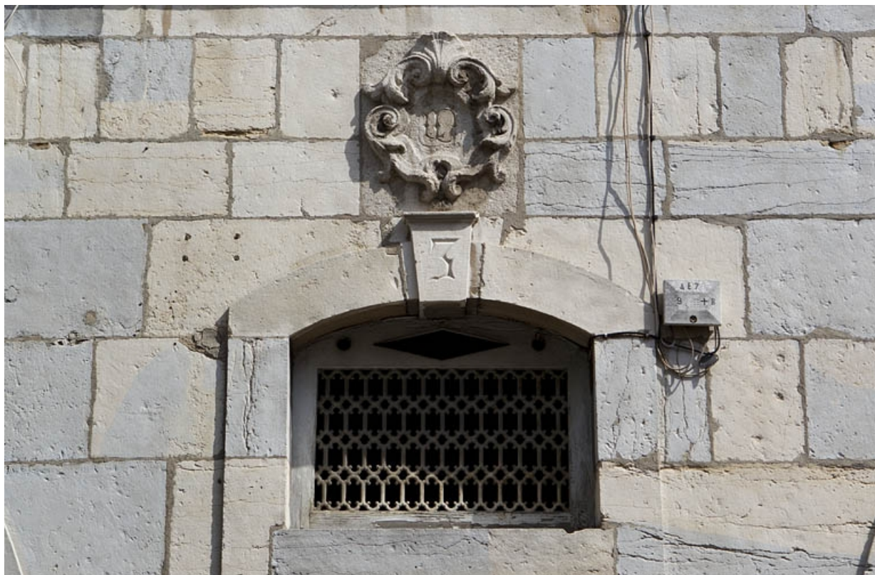
Détail du décor au-dessus de la porte d'entrée.

25, Besançon, 3 rue Péclet, lieudit : îlot des Martelots