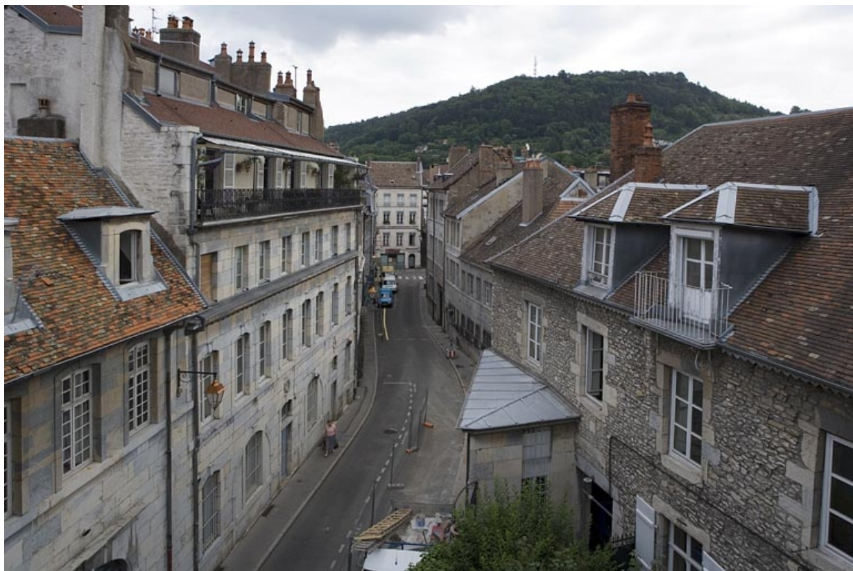
Vue d'ensemble de l'édifice sur la partie gauche de la rue.

25, Besançon, 3 rue Péclet, lieudit : îlot des Martelots