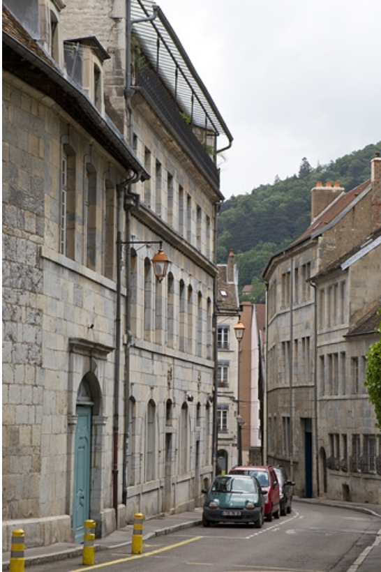
Vue d'ensemble de la façade sur rue de trois quarts gauche.

25, Besançon, 3 rue Péclet, lieudit : îlot des Martelots