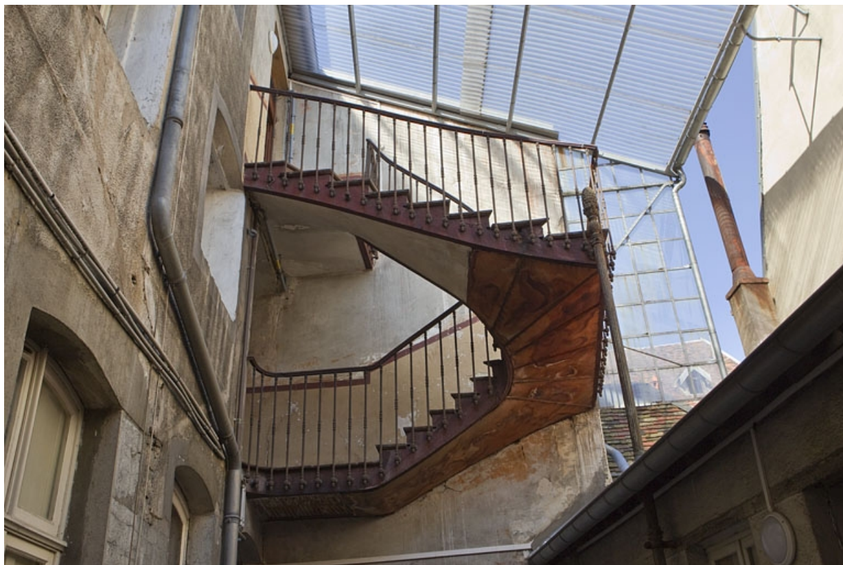
Détail sur cour de l'escalier extérieur en métal entre le premier et le dernier étage : vue rapprochée.

25, Besançon, 3 rue Péclet, lieudit : îlot des Martelots