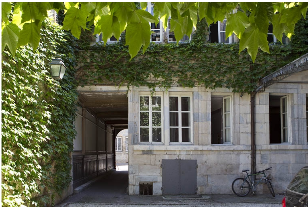
Façade postérieure du logis principal : détail du rez-de-chaussée.

25, Besançon, 5 rue Pécelet, lieudit : îlot des Martelots