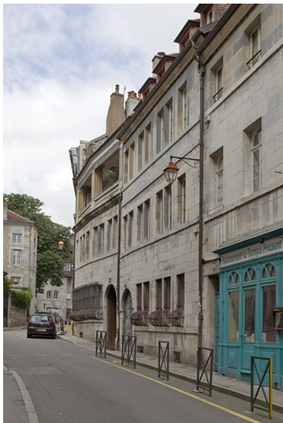
Vue d'ensemble du logis principal depuis la rue de trois quarts droit : vue éloignée.

25, Besançon, 5 rue Pécelet, lieudit : îlot des Martelots