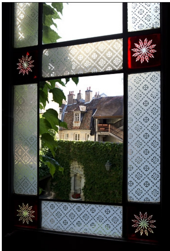
Détail de la borne fontaine depuis la cage de l'escalier.

25, Besançon, 5 rue Pécelet, lieudit : îlot des Martelots