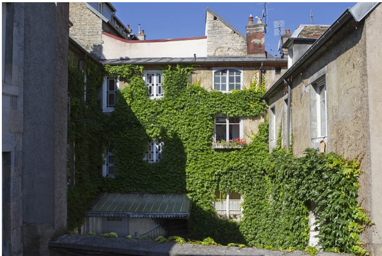
Vue d'ensemble de l'aile contenant l'escalier principal.

25, Besançon, 5 rue Pécelet, lieudit : îlot des Martelots