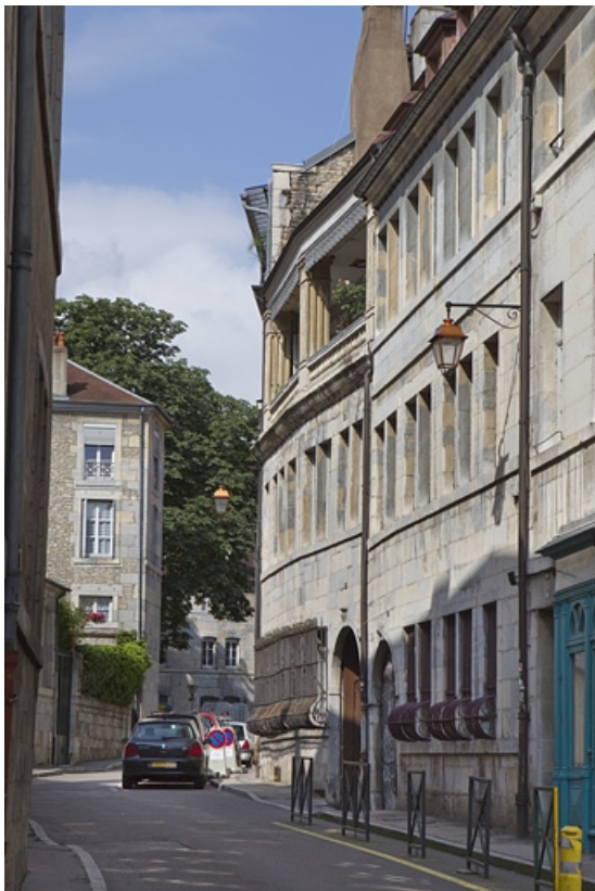
Vue d'ensemble du logis principal depuis la rue de trois quarts droit. 25, Besançon, 5 rue Pécelet, lieudit : îlot des Martelots