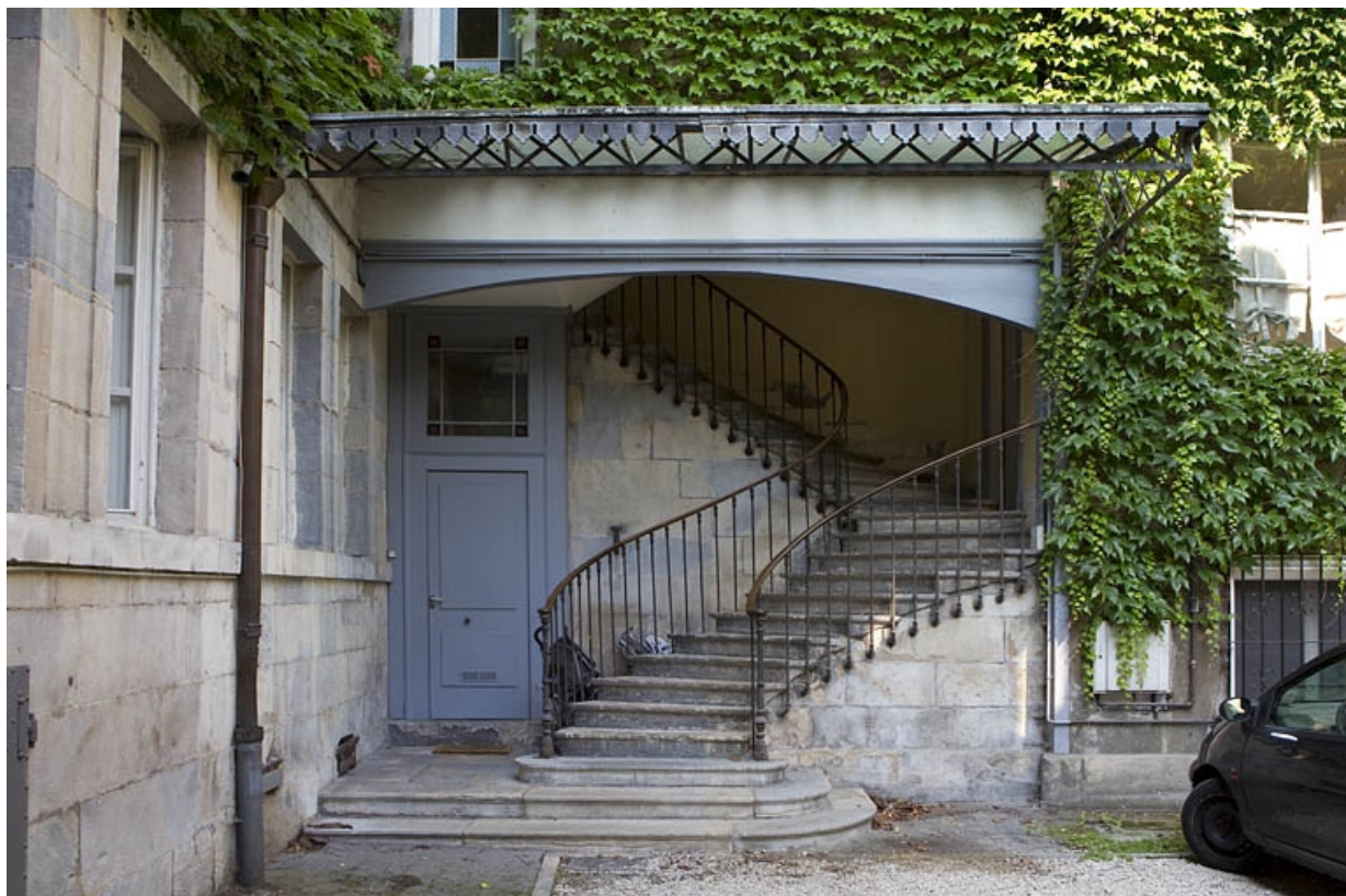
Aile sur la première cour : détail du départ de l'escalier.

25, Besançon, 5 rue Pécelet, lieudit : îlot des Martelots