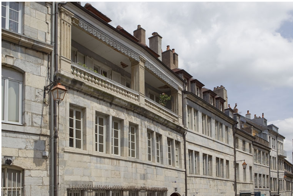
Façade sur rue du logis principal : détail de l'étage de surélévation, de trois quarts gauche. 25, Besançon, 5 rue Pécelet, lieudit : îlot des Martelots