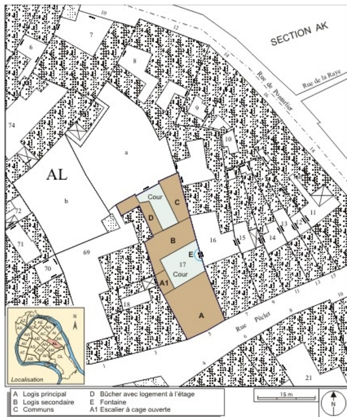
Plan masse et de situation. Extrait du plan cadastral, 1974, section AL. 25, Besançon, 5 rue Pécelet, lieudit : îlot des Martelots