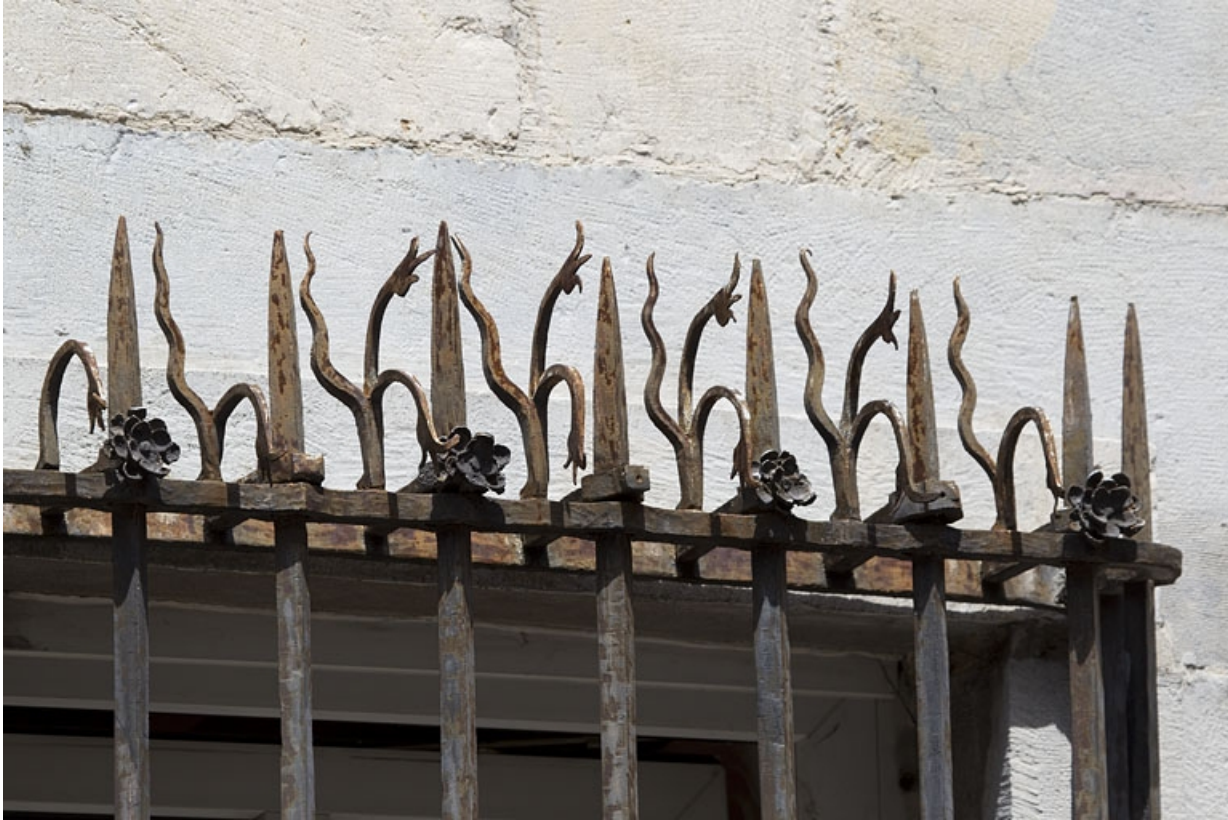
Façade sur rue du logis principal : détail de la partie supérieure des grilles devant les fenêtres du rez-de-chaussée. 25, Besançon, 5 rue Péclet, lieudit : îlot des Martelots