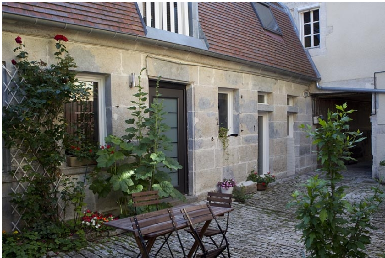
Vue d'ensemble du bâtiment des communs dans la deuxième cour.

25, Besançon, 5 rue Pécelet, lieudit : îlot des Martelots