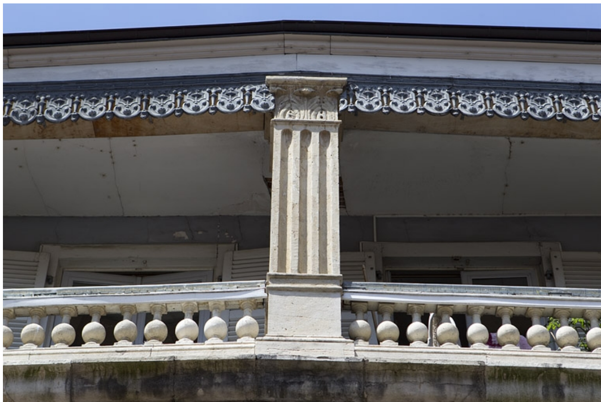
Façade sur rue du logis principal : détail de l'étage de surélévation, vue rapprochée, de face. 25, Besançon, 5 rue Péclet, lieudit : îlot des Martelots