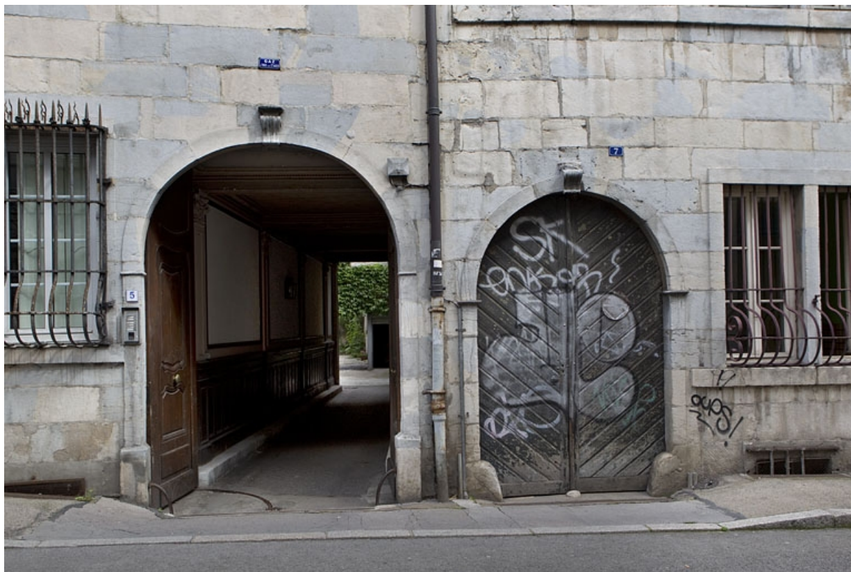
Façade sur rue du logis principal : détail de l'entrée cochère.

25, Besançon, 5 rue Pécelet, lieudit : îlot des Martelots