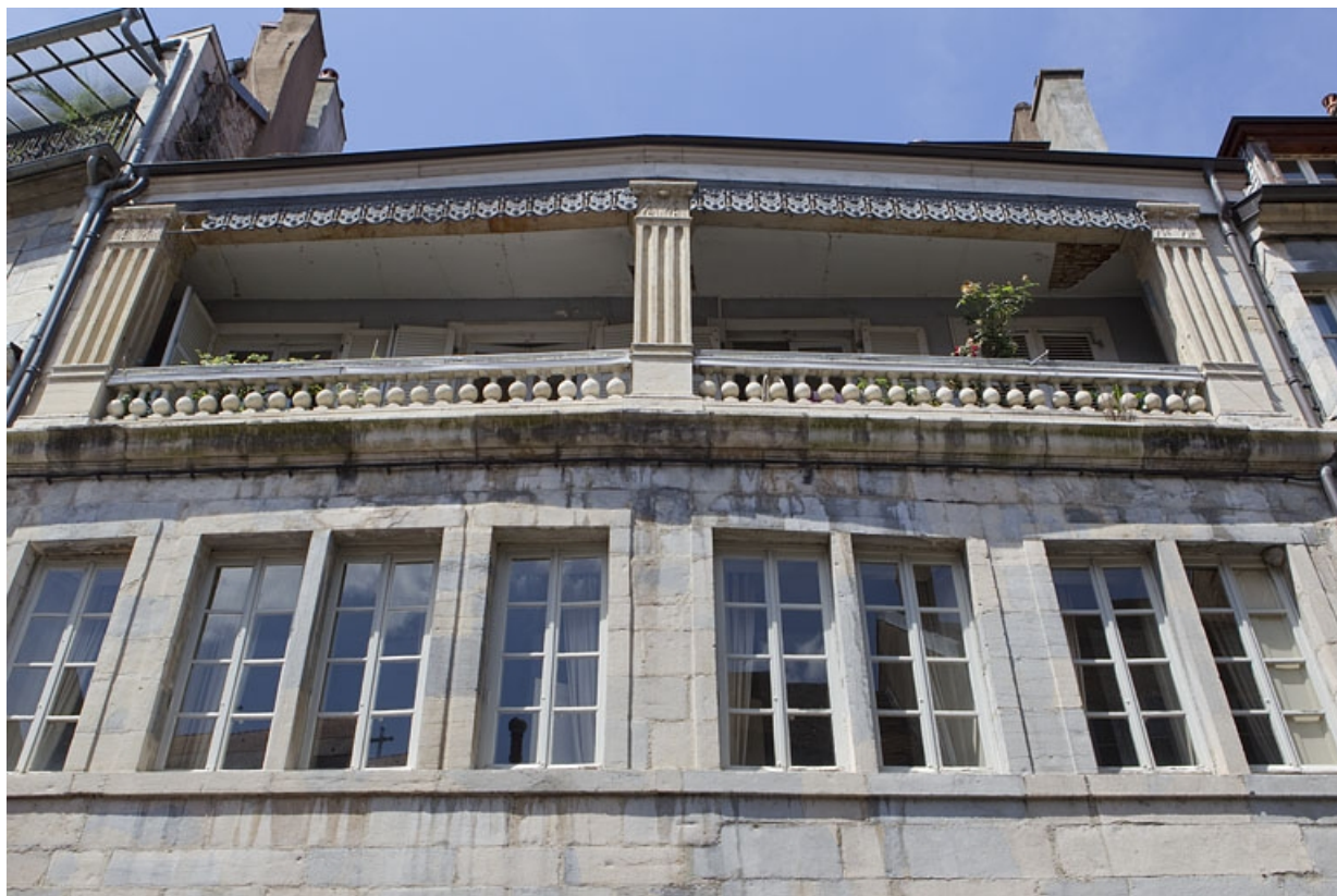
Façade sur rue du logis principal : détail de l'étage de surélévation, de face.

25, Besançon, 5 rue Pécelet, lieudit : îlot des Martelots