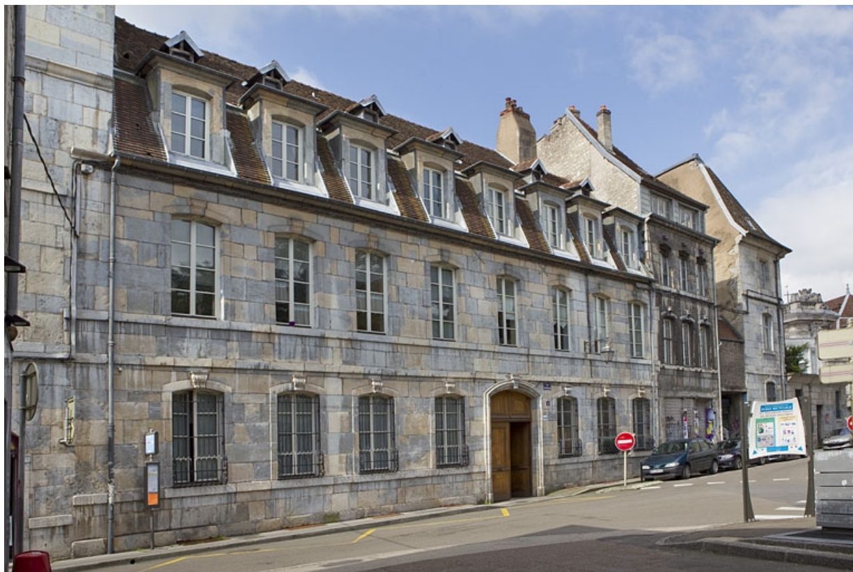
Vue d'ensemble de la façade sur rue du logis principal : des trois quarts gauche.

25, Besançon, 4 rue de Pontarlier, lieudit : îlot des Martelots