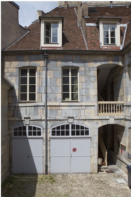
Vue d'ensemble du logis secondaire droit et de l'escalier à cage ouverte sur cour. 25, Besançon, 4 rue de Pontarlier, lieudit : îlot des Martelots