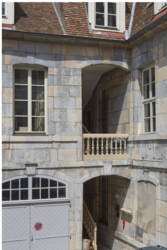
Détail de l'escalier à cage ouverte droit depuis celui de gauche.

25, Besançon, 4 rue de Pontarlier, lieudit : îlot des Martelots