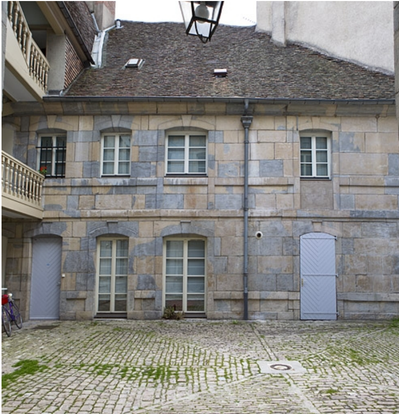
Vue d'ensemble de la façade antérieure du logis secondaire en fond de cour. 25, Besançon, 4 rue de Pontarlier, lieudit : îlot des Martelots