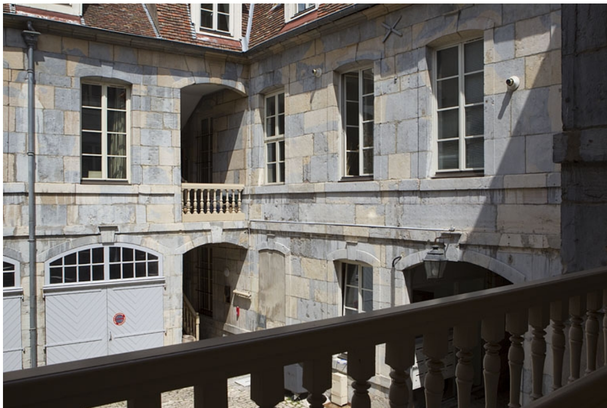
Vue d'ensemble des façades sur cour du logis principal et et du logis secondaire droit depuis l'escalier gauche. 25, Besançon, 4 rue de Pontarlier, lieudit : îlot des Martelots