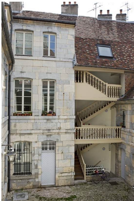
Vue d'ensemble du logis secondaire gauche et de l'escalier à cage ouverte sur cour. 25, Besançon, 4 rue de Pontarlier, lieudit : îlot des Martelots