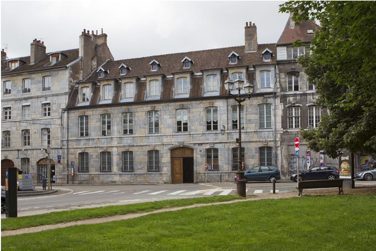
Vue d'ensemble de la façade sur rue du logis principal : des trois quarts droit.

25, Besançon, 4 rue de Pontarlier, lieudit : îlot des Martelots