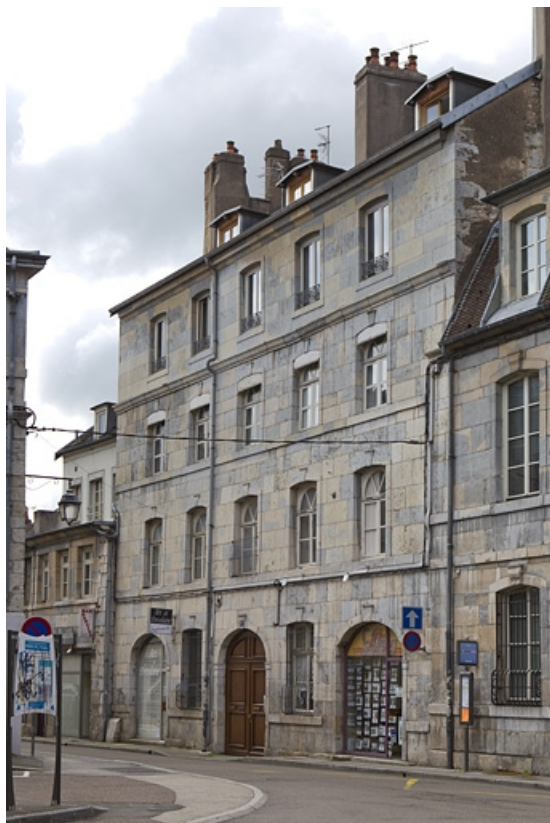
Vue d'ensemble de la façade sur rue du logis principal, de trois quarts droit. 25, Besançon, 6 rue de Pontarlier, lieudit : îlot des Martelots