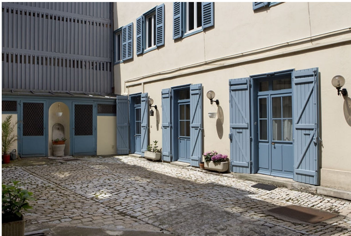
Détail du rez-de-chaussée du logis secondaire droit et d'une partie du séchoir.

25, Besançon, 6 rue de Pontarlier, lieudit : îlot des Martelots