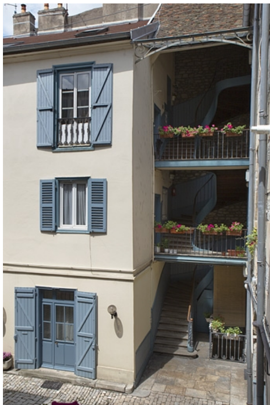
Vue d'ensemble de l'escalier à cage ouverte à droite de la cour.

25, Besançon, 6 rue de Pontarlier, lieudit : îlot des Martelots