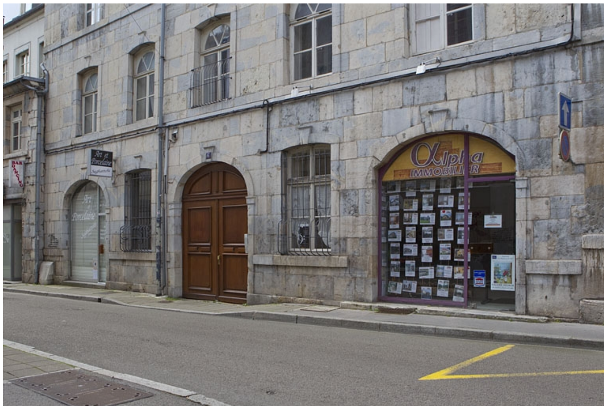
Détail du rez-de-chaussée de la façade sur rue du logis principal, de trois quarts droit. 25, Besançon, 6 rue de Pontarlier, lieudit : îlot des Martelots