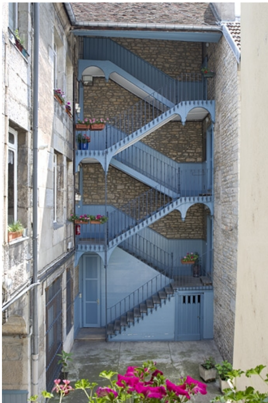
Vue d'ensemble de l'escalier à cage ouverte à gauche de la cour. 25, Besançon, 6 rue de Pontarlier, lieudit : îlot des Martelots