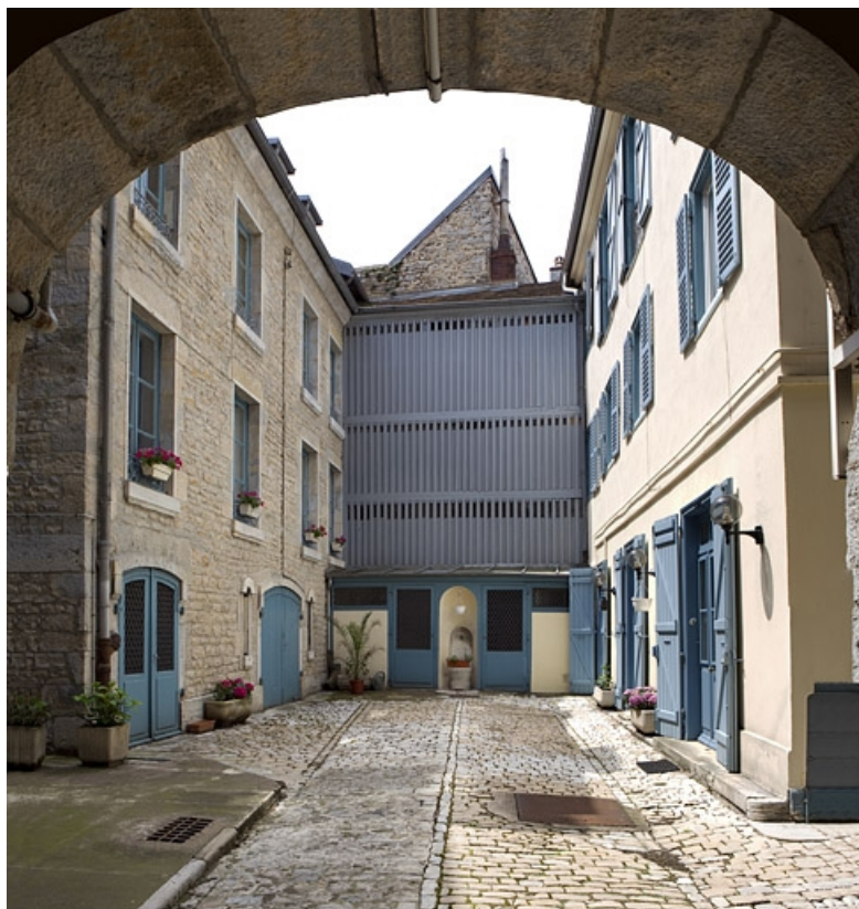
Vue d'ensemble de la cour depuis le portail d'entrée.

25, Besançon, 6 rue de Pontarlier, lieu dit : îlot des Martelots