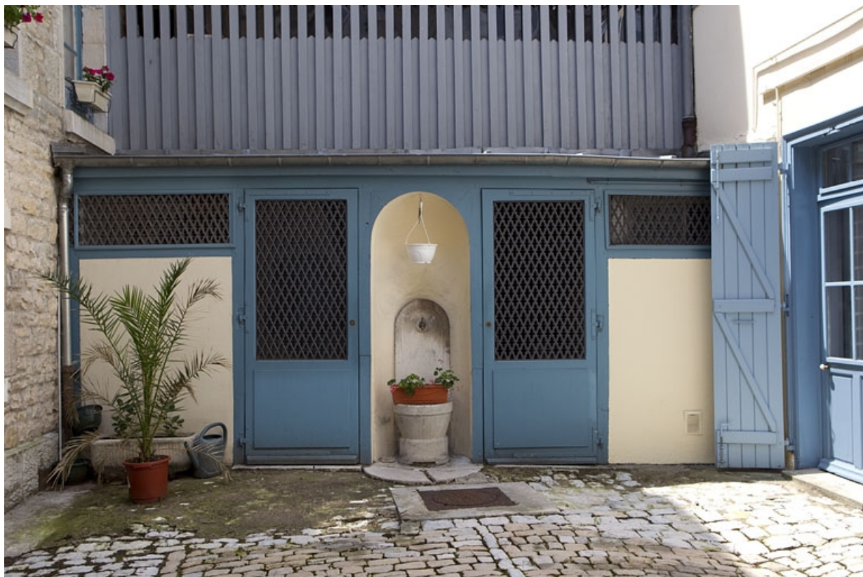
Détail de la borne fontaine et du rez-de-chaussée du séchoir.

25, Besançon, 6 rue de Pontarlier, lieudit : îlot des Martelots