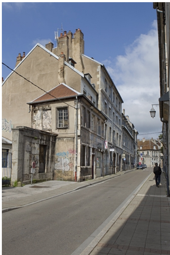
Vue d'ensemble éloignée du logis principal dans l'alignement de la rue, de trois quarts gauche. 25, Besançon, 6 rue de Pontarlier, lieudit : îlot des Martelots