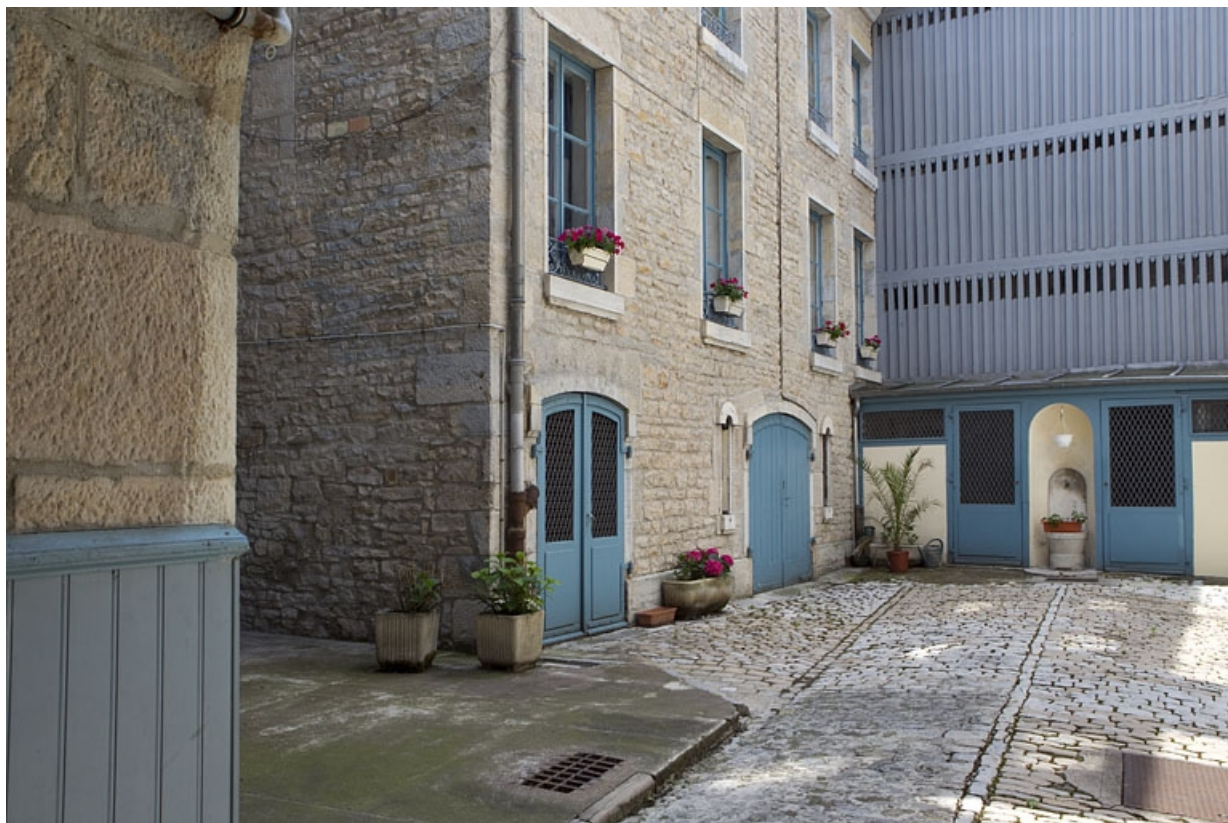
Détail du rez-de-chaussée du logis secondaire gauche. 25, Besançon, 6 rue de Pontarlier, lieudit : îlot des Martelots