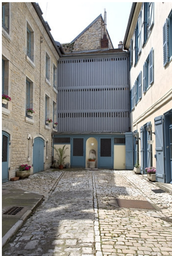
Vue d'ensemble du séchoir au fond de la cour.

25, Besançon, 6 rue de Pontarlier, lieudit : îlot des Martelots