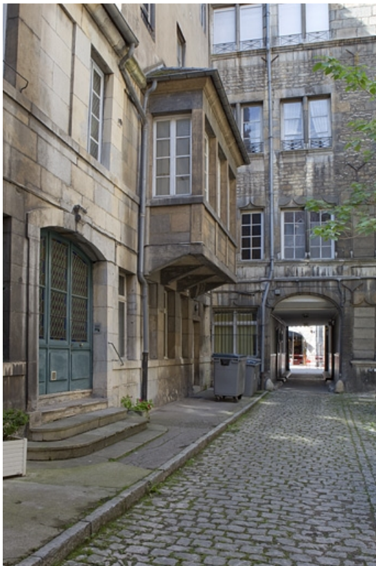
Vue des façades de l'immeuble depuis le fond de la cour, avec le bow-window. 25, Besançon, 92 rue des Granges, lieudit : îlot Saint-Maurice