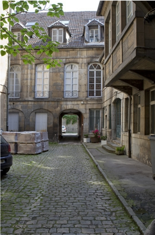
Vue de l'aile de l'hôtel au fond de la première cour.

25, Besançon, 123 Grande Rue, lieudit : îlot Saint-Maurice