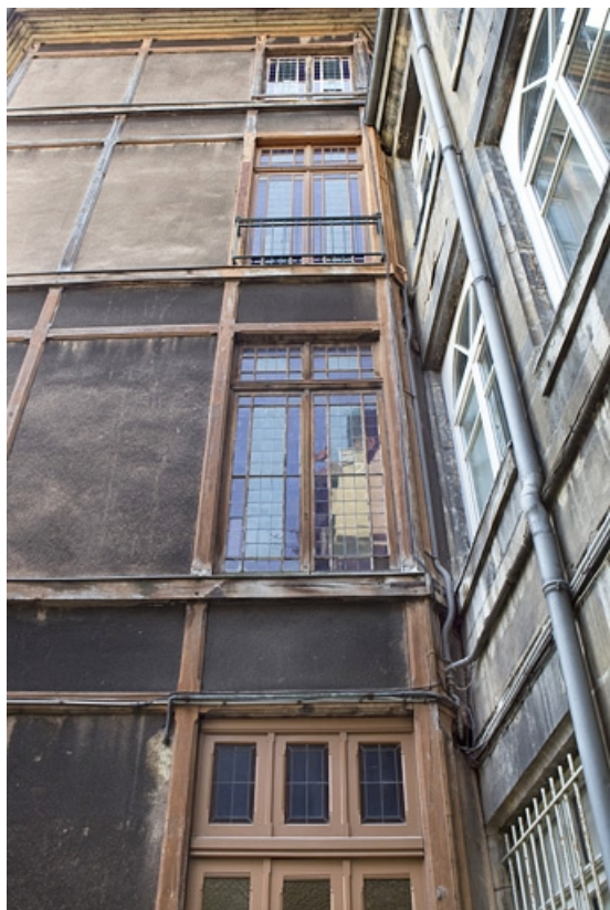
Détail de la paroi de la cage d'escalier en pan de bois. 25, Besançon, 133 Grande Rue, lieudit : îlot Saint-Maurice