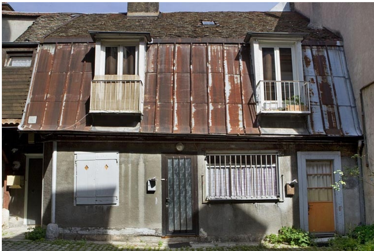
Logis secondaire à gauche de la cour : vue d'ensemble.

25, Besançon, 133 Grande Rue, lieudit : îlot Saint-Maurice