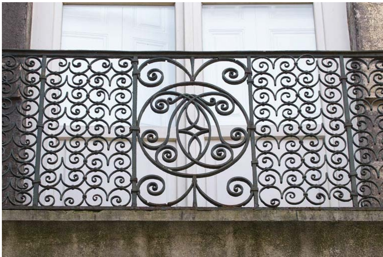
Logis principal, façade sur cour : détail de la ferronnerie d'un garde-corps. 25, Besançon, 133 Grande Rue, lieudit : îlot Saint-Maurice