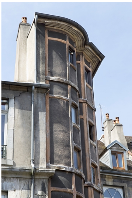
Détail de la partie supérieure de la cage d'escalier en pan de bois.

25, Besançon, 133 Grande Rue, lieudit : îlot Saint-Maurice