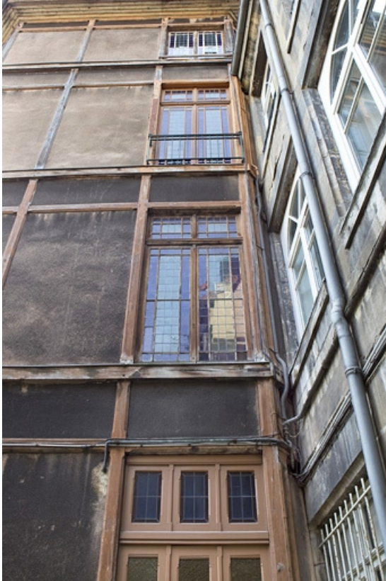
Détail de la paroi de la cage d'escalier en pan de bois. 25, Besançon, 133 Grande Rue, lieudit : îlot Saint-Maurice