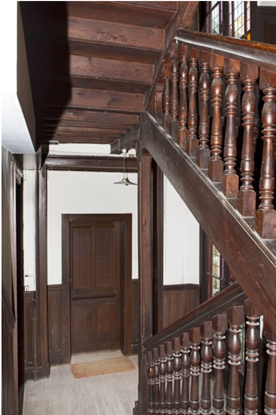
Cage d'escalier en pan de bois : détail de l'escalier.

25, Besançon, 133 Grande Rue, lieudit : îlot Saint-Maurice