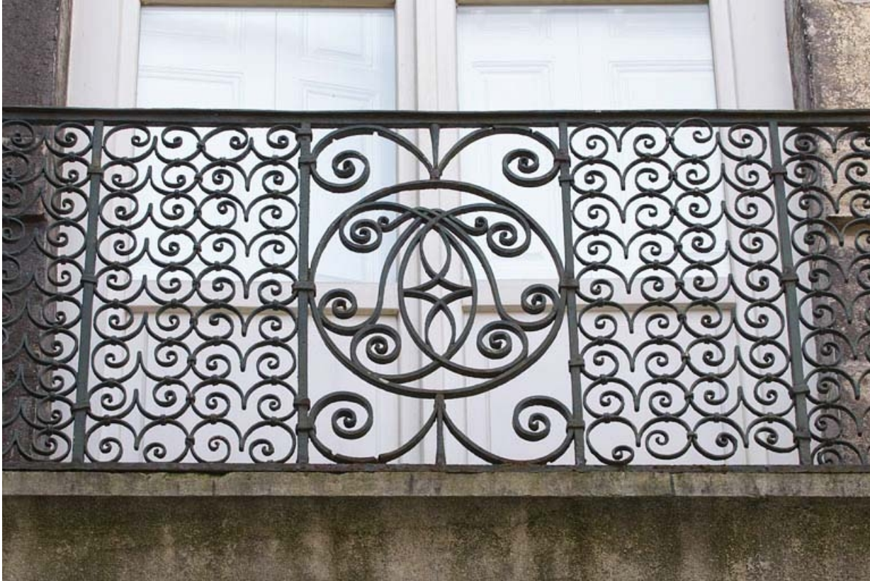
Logis principal, façade sur cour : détail de la ferronnerie d'un garde-corps.

25, Besançon, 133 Grande Rue, lieudit : îlot Saint-Maurice