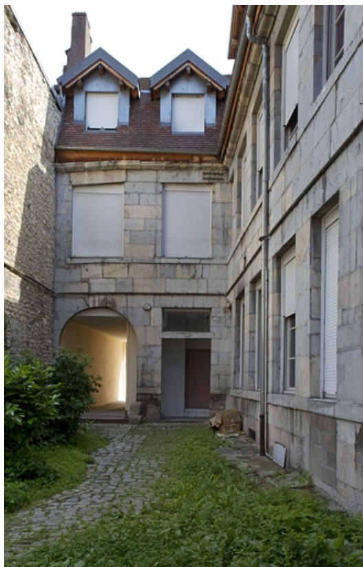
Logis secondaire en L : détail de l'aile en fond de cour. 25, Besançon, 133 Grande Rue, lieudit : îlot Saint-Maurice