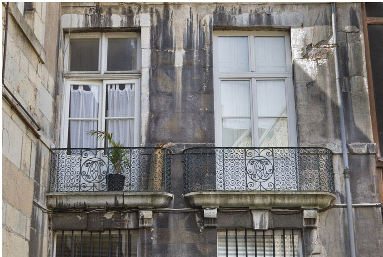
Logis principal, façade sur cour : détail des deux garde-corps.

25, Besançon, 133 Grande Rue, lieudit : îlot Saint-Maurice