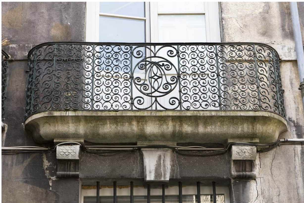
Logis principal, façade sur cour : détail d'un garde-corps.

25, Besançon, 133 Grande Rue, lieudit : îlot Saint-Maurice