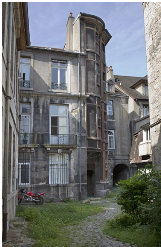
Vue d'ensemble du logis principal depuis le fond de la cour.

25, Besançon, 133 Grande Rue, lieudit : îlot Saint-Maurice