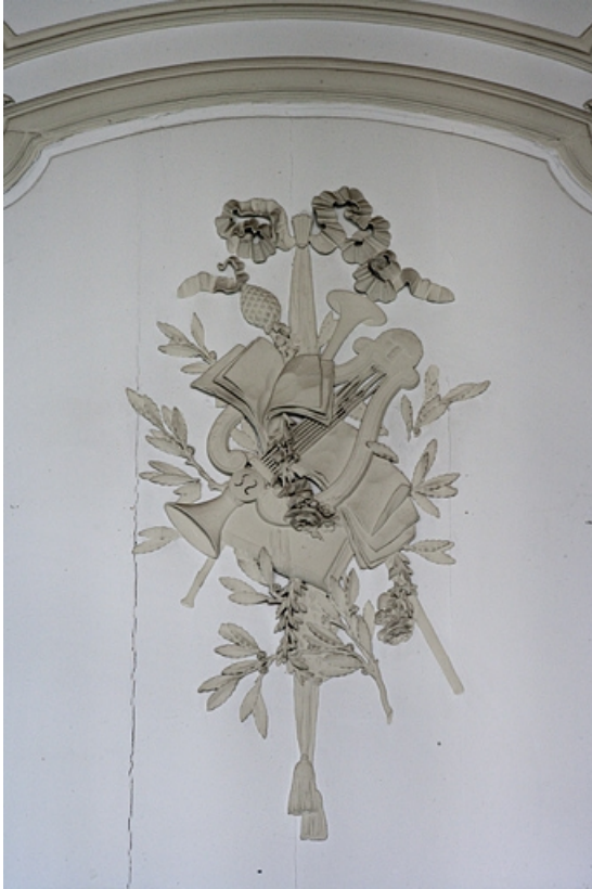
Intérieur, premier étage, pièce donnant sur la cour : détail d'un décor de lambris avec une lyre. 25, Besançon, 127 Grande Rue, lieudit : îlot Saint-Maurice