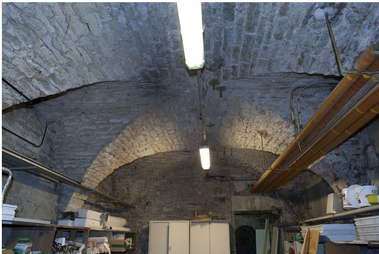
Intérieur, sous-sol : détail de la voûte d'une cave.

25, Besançon, 127 Grande Rue, lieudit : îlot Saint-Maurice