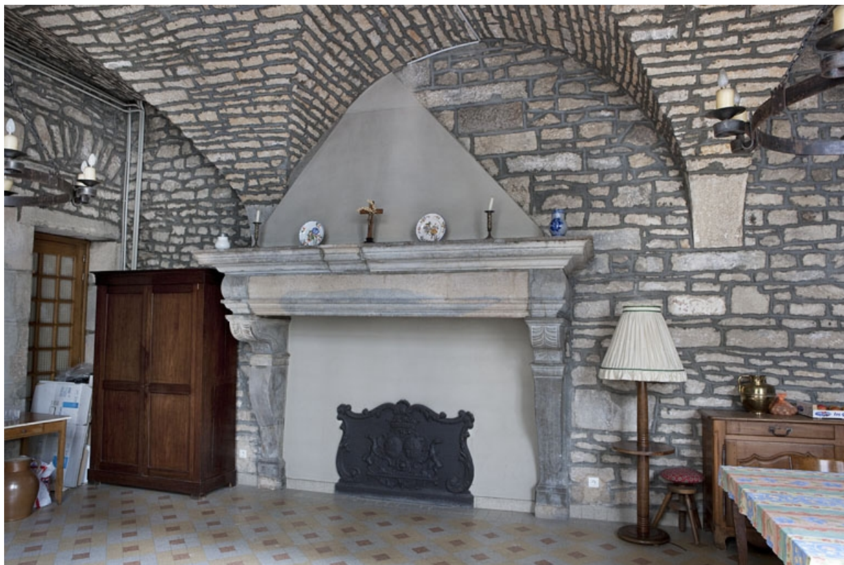
Intérieur, cuisine : vue d'ensemble de la cheminée.

25, Besançon, 127 Grande Rue, lieudit : îlot Saint-Maurice