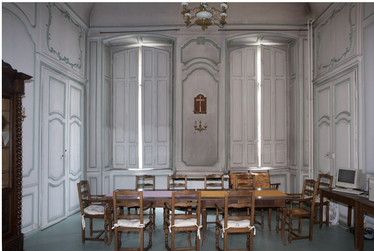
Intérieur, premier étage : vue d'ensemble de la pièce donnant sur la rue avec les volets fermés.

25, Besançon, 127 Grande Rue, lieudit : îlot Saint-Maurice