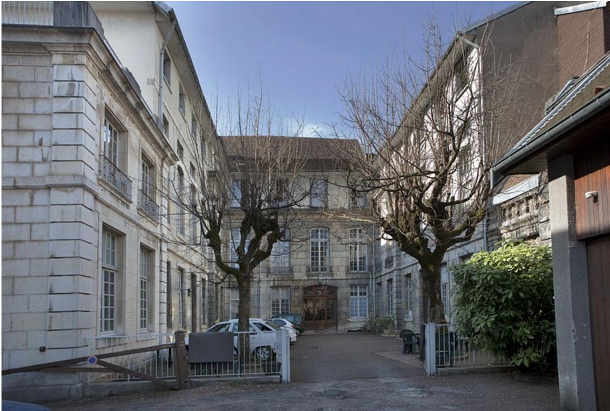
Vue d'ensemble de la cour depuis le fond.

25, Besançon, 127 Grande Rue, lieudit : îlot Saint-Maurice