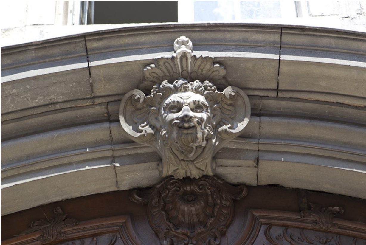
Façade antérieure sur rue, détail de la clé sur l'arc du portail d'entrée.

25, Besançon, 127 Grande Rue, lieudit : îlot Saint-Maurice