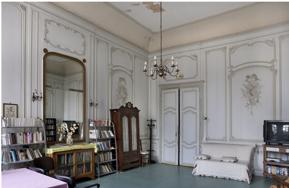
Intérieur, premier étage, pièce donnant sur la cour : vue depuis le fond de trois quarts gauche.

25, Besançon, 127 Grande Rue, lieudit : îlot Saint-Maurice