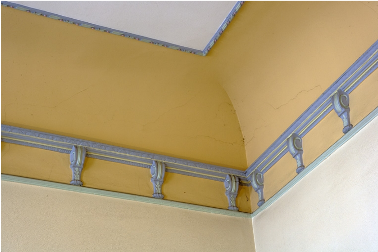
Intérieur, escalier : détail du plafond à voussures de la cage d'escalier.

25, Besançon, 127 Grande Rue, lieudit : îlot Saint-Maurice