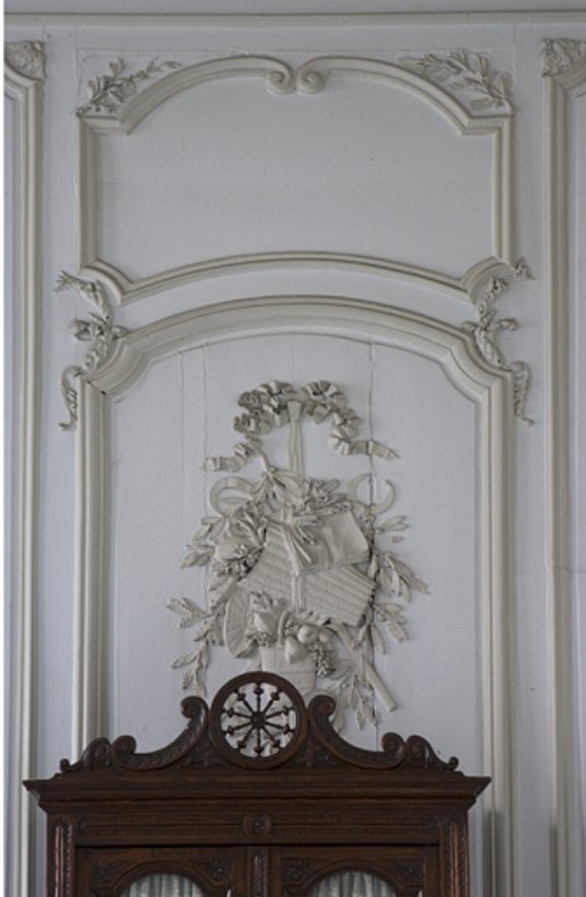
Intérieur, premier étage, pièce donnant sur la cour : détail d'un décor de lambris à panneau large. 25, Besançon, 127 Grande Rue, lieudit : îlot Saint-Maurice