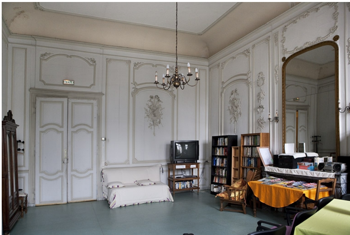
Intérieur, premier étage, pièce donnant sur la cour : vue d'ensemble depuis le fond.

25, Besançon, 127 Grande Rue, lieudit : îlot Saint-Maurice