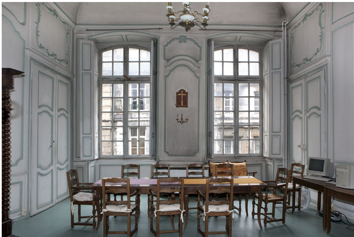
Intérieur, premier étage : vue d'ensemble de la pièce donnant sur la rue avec les volets ouverts.

25, Besançon, 127 Grande Rue, lieudit : îlot Saint-Maurice