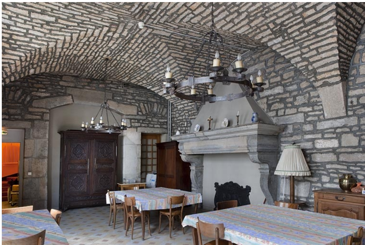
Intérieur, vue d'ensemble de la cuisine depuis le fond de la pièce.

25, Besançon, 127 Grande Rue, lieudit : îlot Saint-Maurice