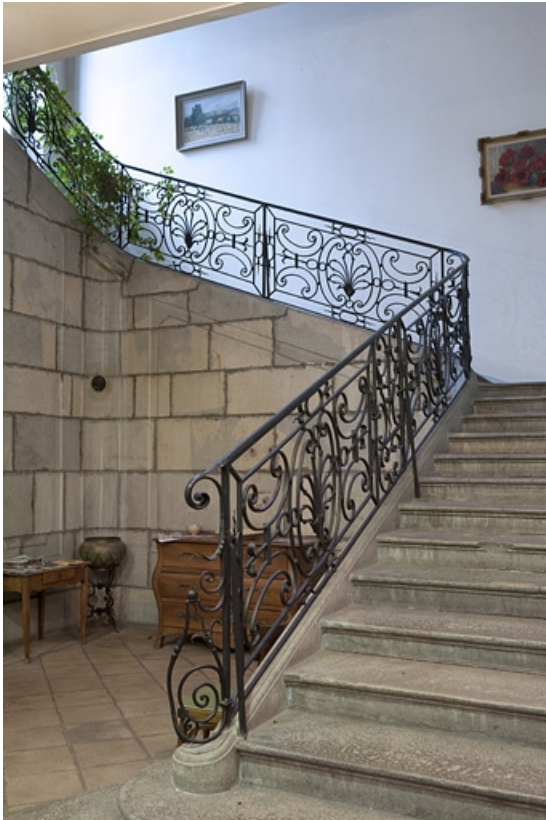
Intérieur, escalier : détail de la rampe en fer forgé.

25, Besançon, 127 Grande Rue, lieudit : îlot Saint-Maurice