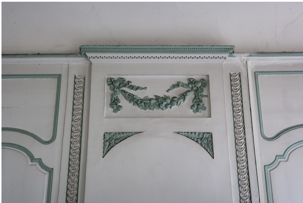
Intérieur, premier étage, pièce donnant sur la rue : détail du décor du dessus de cheminée.

25, Besançon, 127 Grande Rue, lieudit : îlot Saint-Maurice