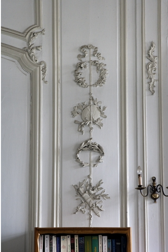
Intérieur, premier étage, pièce donnant sur la cour : détail d'un décor de lambris à panneau étroit. 25, Besançon, 127 Grande Rue, lieudit : îlot Saint-Maurice