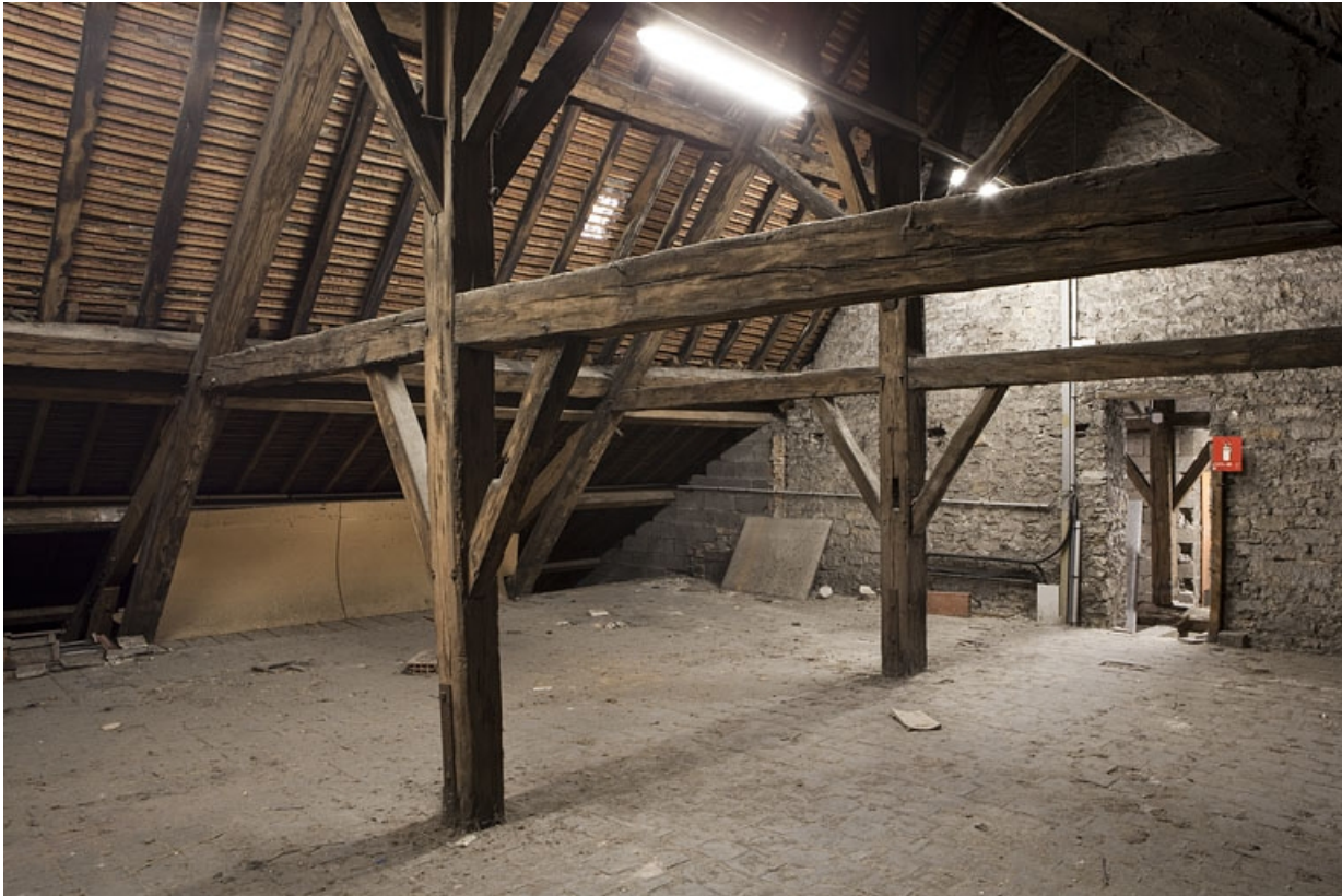
Intérieur, comble : détail de la charpente.

25, Besançon, 127 Grande Rue, lieudit : îlot Saint-Maurice