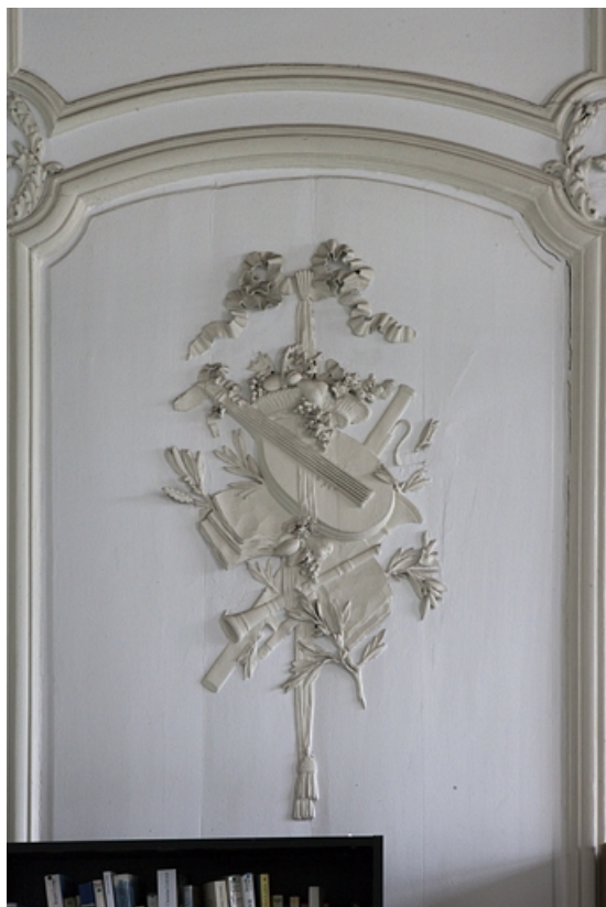
Intérieur, premier étage, pièce donnant sur la cour : détail d'un décor de lambris avec une mandoline. 25, Besançon, 127 Grande Rue, lieudit : îlot Saint-Maurice