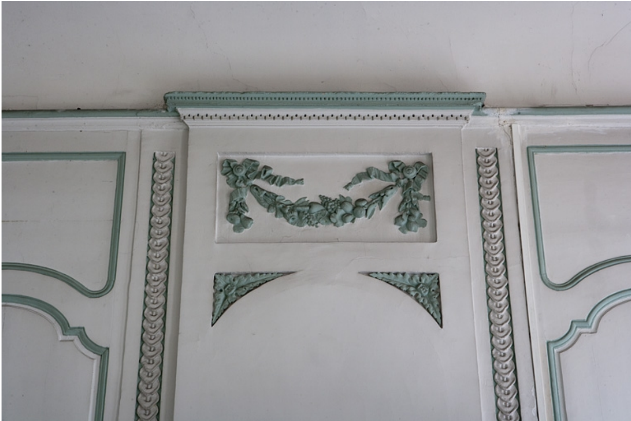
Intérieur, premier étage, pièce donnant sur la rue : détail du décor du dessus de cheminée.

25, Besançon, 127 Grande Rue, lieudit : îlot Saint-Maurice