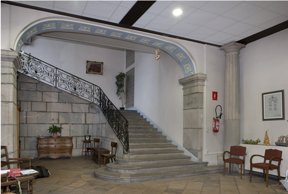
Intérieur, vue d'ensemble de l'escalier de trois quarts gauche.

25, Besançon, 127 Grande Rue, lieudit : îlot Saint-Maurice