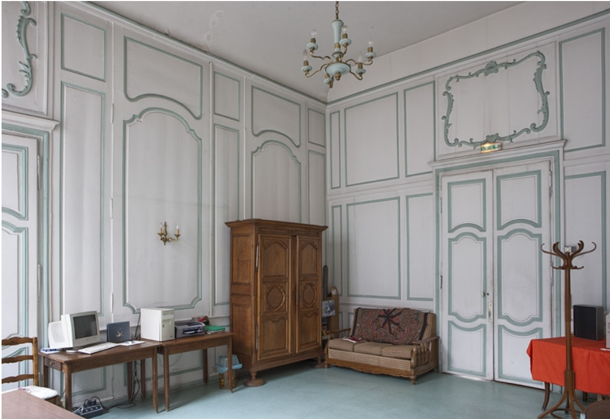
Intérieur, premier étage, pièce donnant sur la rue : vue de trois quarts droit depuis le fond.

25, Besançon, 127 Grande Rue, lieudit : îlot Saint-Maurice