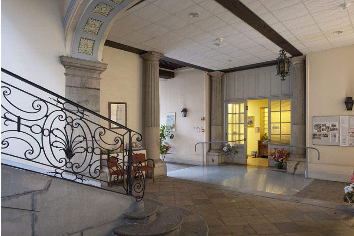
Intérieur, vue de l'ancien passage cocher depuis l'escalier, de trois quarts droit.

25, Besançon, 127 Grande Rue, lieudit : îlot Saint-Maurice