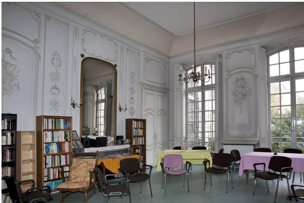
Intérieur, premier étage, pièce donnant sur la cour : vue d'ensemble depuis l'entrée.

25, Besançon, 127 Grande Rue, lieudit : îlot Saint-Maurice