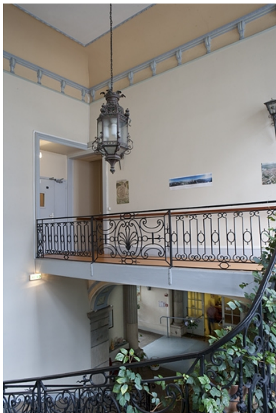
Intérieur, escalier : détail du grand palier au premier étage. 25, Besançon, 127 Grande Rue, lieudit : îlot Saint-Maurice