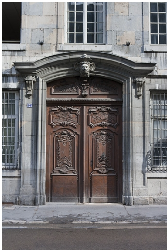
Façade antérieure sur rue : vue d'ensemble du portail d'entrée.

25, Besançon, 127 Grande Rue, lieudit : îlot Saint-Maurice