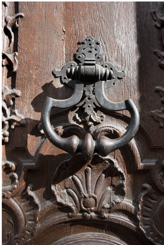
Façade antérieure sur rue, portail d'entrée : détail du heurtour.

25, Besançon, 127 Grande Rue, lieudit : îlot Saint-Maurice