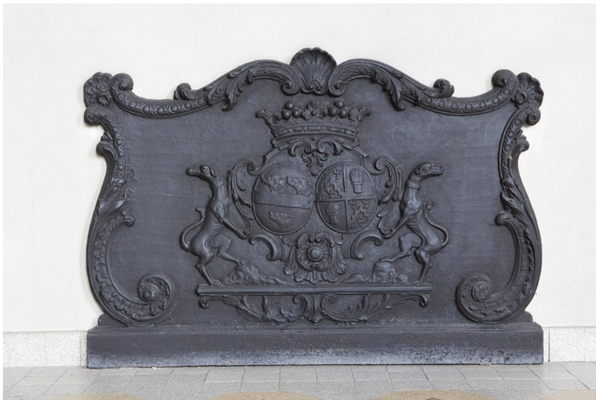
Intérieur, cuisine : détail de la plaque de cheminée.

25, Besançon, 127 Grande Rue, lieudit : îlot Saint-Maurice