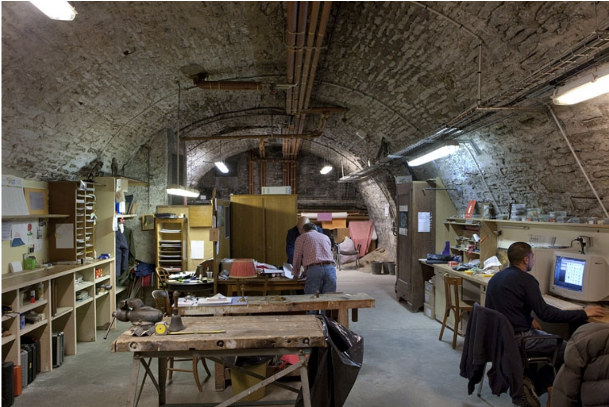
Intérieur, sous-sol : vue d'ensemble d'une cave.

25, Besançon, 127 Grande Rue, lieudit : îlot Saint-Maurice