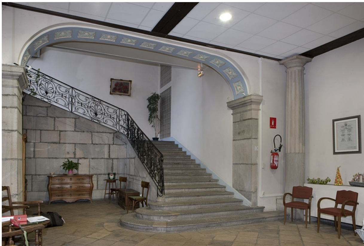
Intérieur, vue d'ensemble de l'escalier de trois quarts gauche.

25, Besançon, 127 Grande Rue, lieudit : îlot Saint-Maurice