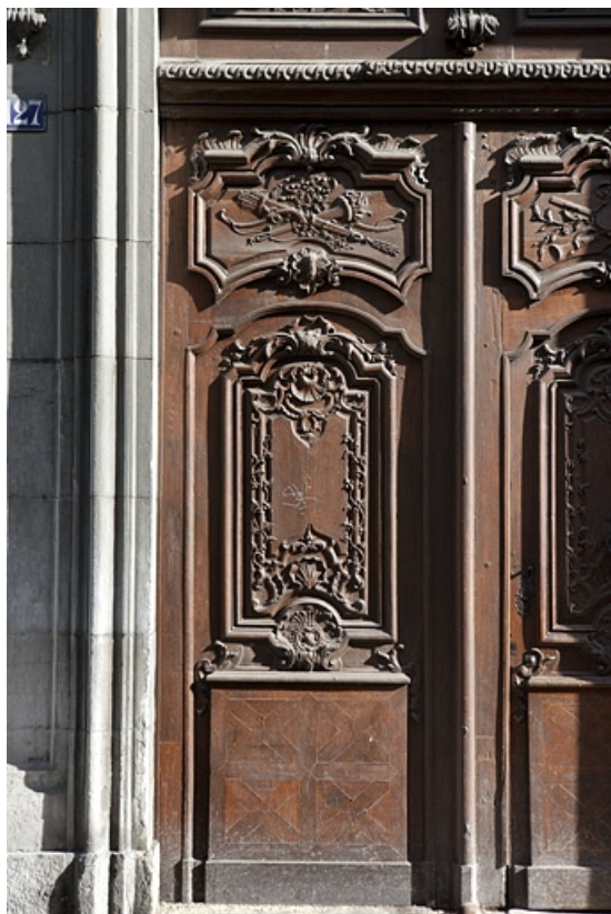
Façade antérieure sur rue, portail d'entrée : détail d'un vantaill de la porte.

25, Besançon, 127 Grande Rue, lieudit : îlot Saint-Maurice