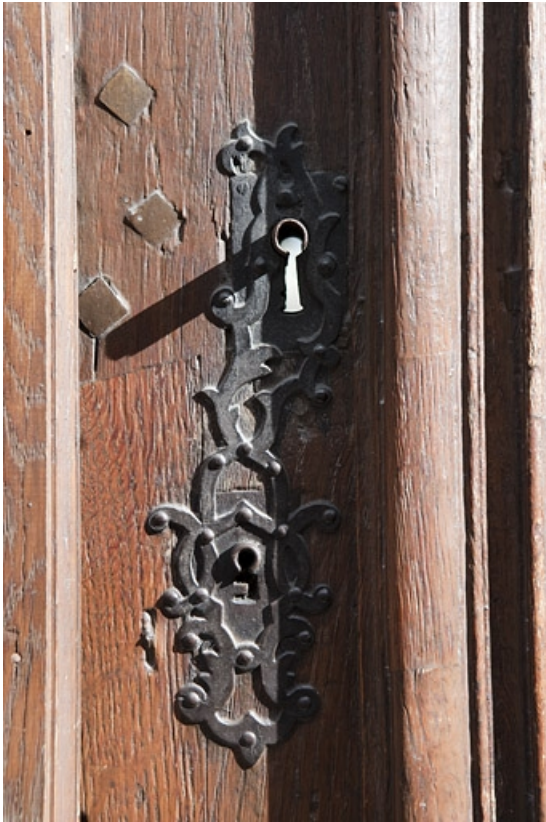
Façade antérieure sur rue, portail d'entrée : détail du décor d'une serrure.

25, Besançon, 127 Grande Rue, lieudit : îlot Saint-Maurice