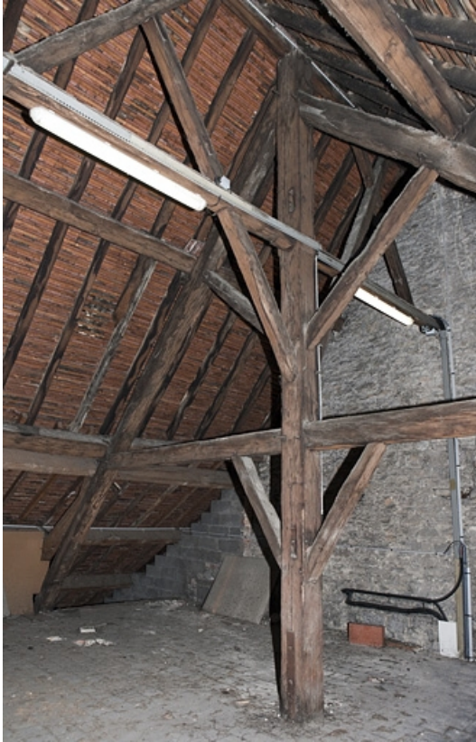
Intérieur, comble : détail de la charpente.

25, Besançon, 127 Grande Rue, lieudit : îlot Saint-Maurice