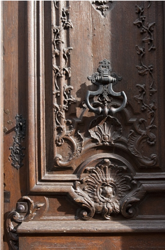
Façade antérieure sur rue, portail d'entrée : détail d'un décor sur un vantaill de la porte. 25, Besançon, 127 Grande Rue, lieudit : îlot Saint-Maurice