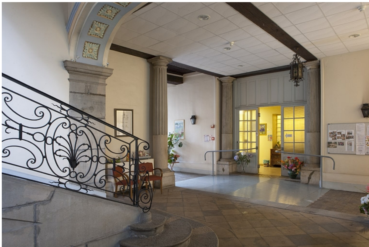
Intérieur, vue de l'ancien passage cocher depuis l'escalier, de trois quarts droit.

25, Besançon, 127 Grande Rue, lieu-dit : îlot Saint-Maurice