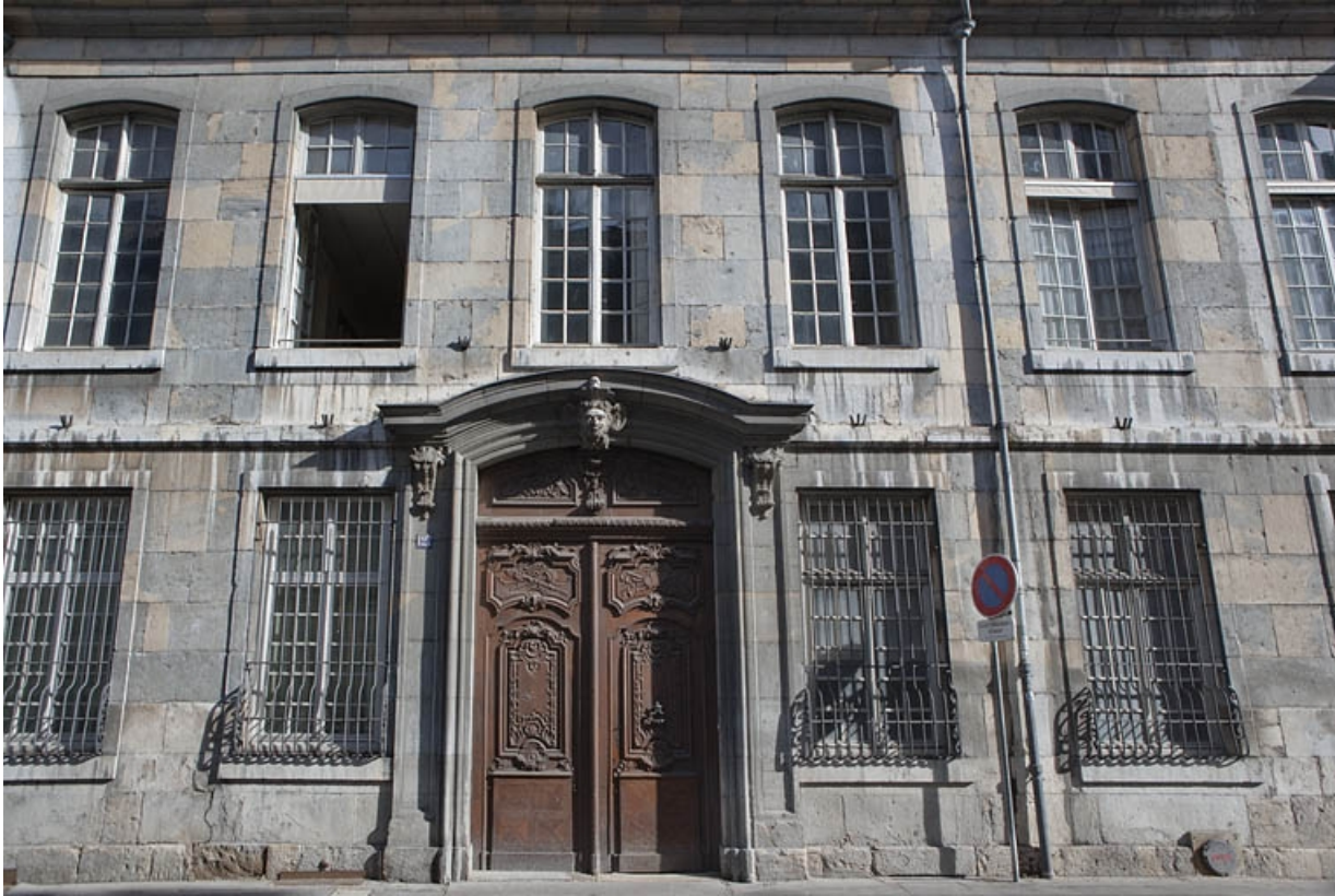
Façade antérieure sur rue : vue de face.

25, Besançon, 127 Grande Rue, lieudit : îlot Saint-Maurice