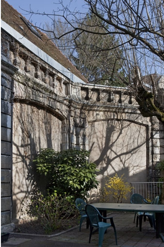
Cour : vue des anciennes remises.

25, Besançon, 127 Grande Rue, lieudit : îlot Saint-Maurice