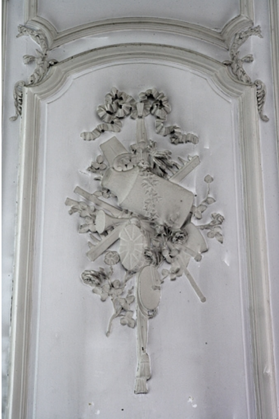
Intérieur, premier étage, pièce donnant sur la cour : détail d'un décor de lambris à panneau large. 25, Besançon, 127 Grande Rue, lieudit : îlot Saint-Maurice