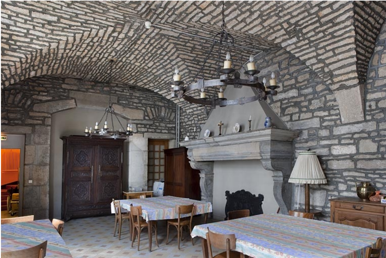
Intérieur, vue d'ensemble de la cuisine depuis le fond de la pièce.

25, Besançon, 127 Grande Rue, lieudit : îlot Saint-Maurice