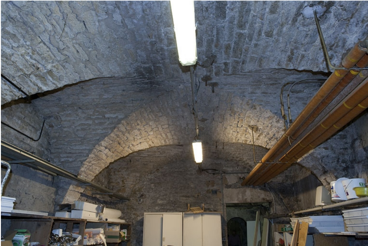
Intérieur, sous-sol : détail de la voûte d'une cave.

25, Besançon, 127 Grande Rue, lieudit : îlot Saint-Maurice