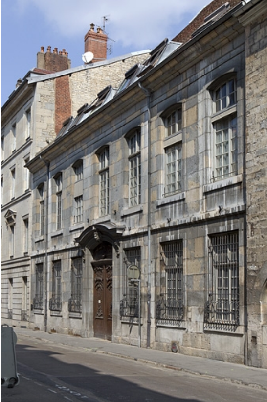
Façade antérieure sur rue, de trois quart droit.

25, Besançon, 127 Grande Rue, lieudit : îlot Saint-Maurice