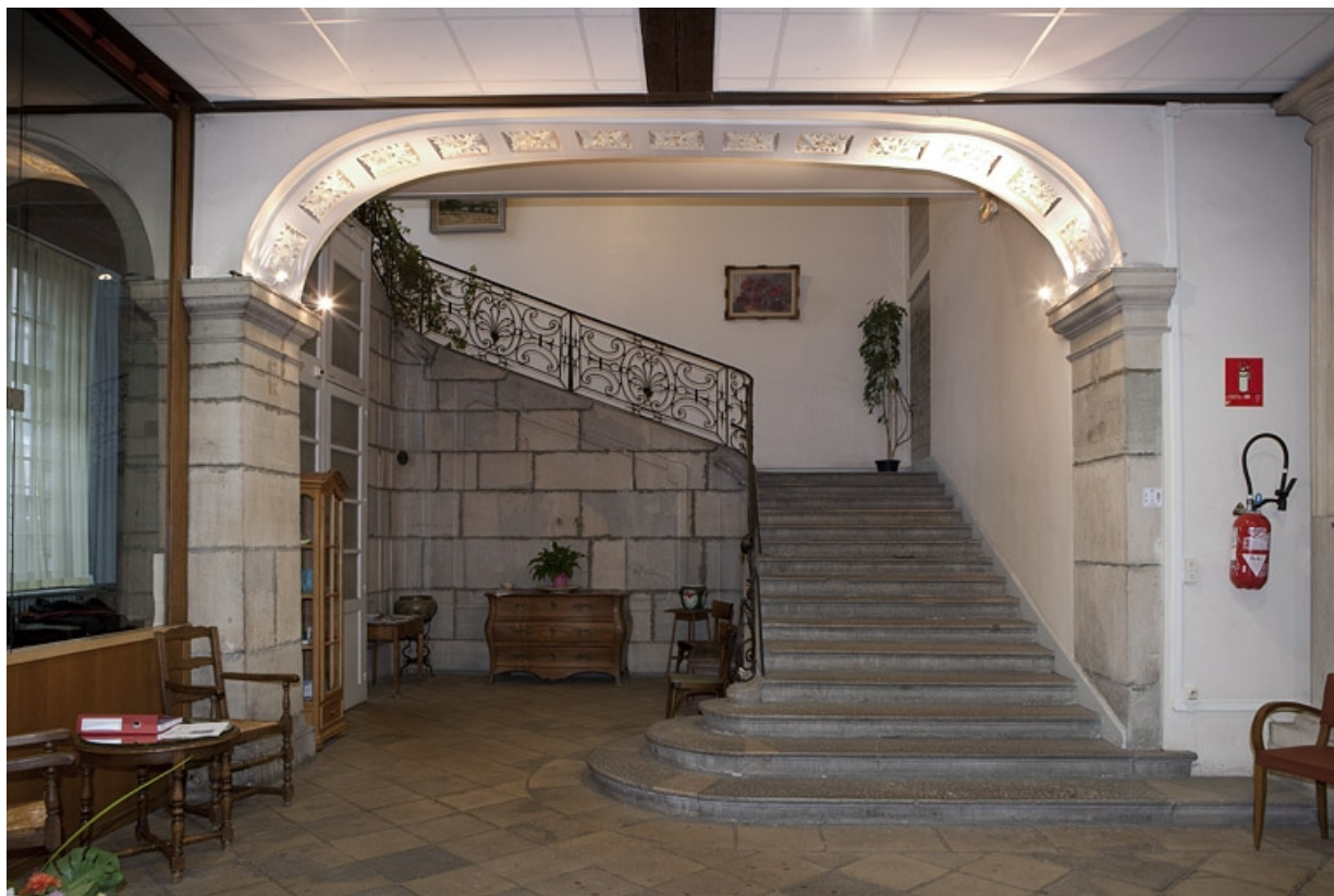
Intérieur : vue d'ensemble de l'escalier à gauche de l'ancien passage cocher. 25, Besançon, 127 Grande Rue, lieudit : îlot Saint-Maurice