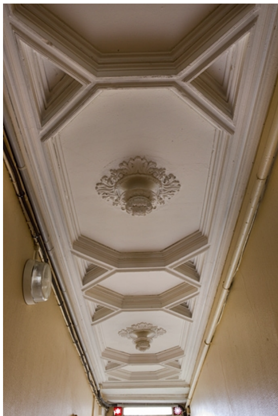
Logis principal : détail du plafond du couloir d'entrée. 25, Besançon, 137 Grande Rue, lieudit : îlot Saint-Maurice