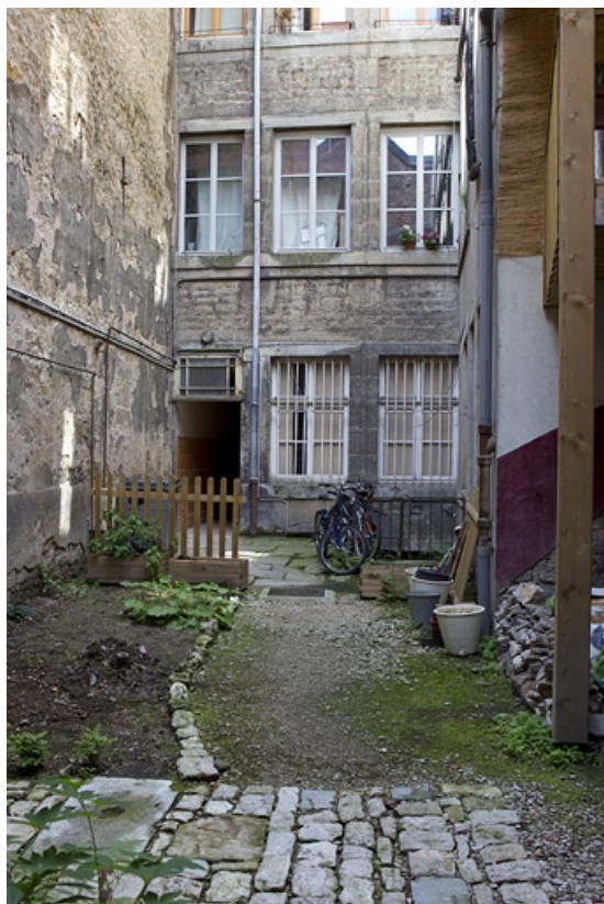
Logis principal, façade sur cour : détail du rez-de-chaussée et du premier étage. 25, Besançon, 137 Grande Rue, lieudit : îlot Saint-Maurice