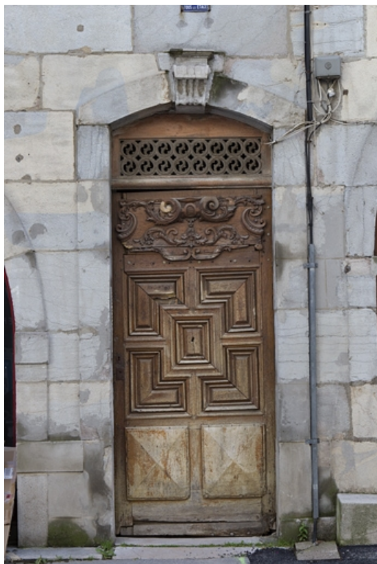
Logis principal : détail de la porte d'entrée.

25, Besançon, 137 Grande Rue, lieudit : îlot Saint-Maurice