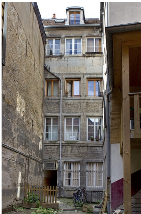
Logis principal, façade sur cour : vue d'ensemble.

25, Besançon, 137 Grande Rue, lieudit : îlot Saint-Maurice