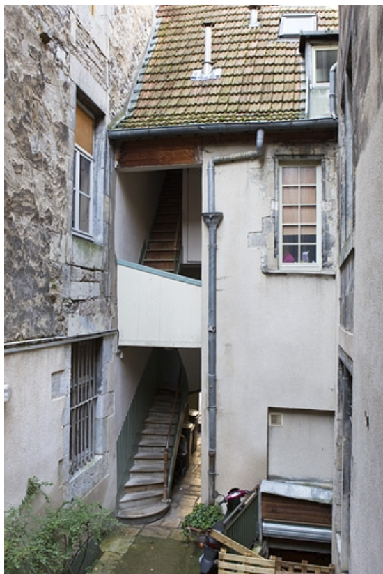
Logis principal : vue d'ensemble de la façade sur cour. 25, Besançon, 135 Grande Rue, lieudit : îlot Saint-Maurice