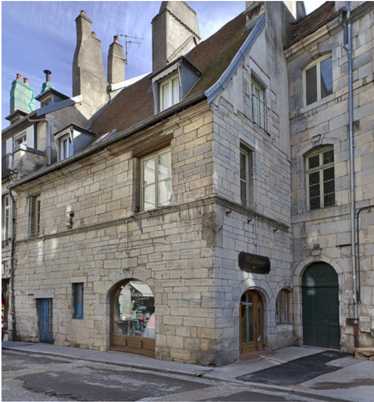
Logis principal : vue d'ensemble depuis la rue.

25, Besançon, 135 Grande Rue, lieudit : îlot Saint-Maurice