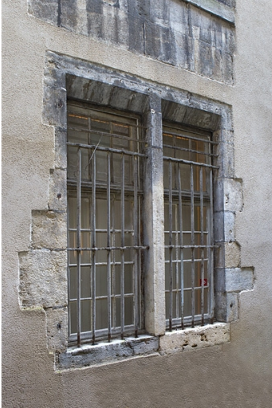
Logis principal : détail d'une baie.

25, Besançon, 135 Grande Rue, lieudit : îlot Saint-Maurice