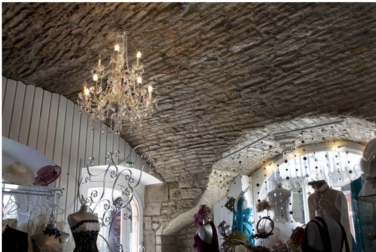
Logis principal, intérieur : détail de la voûte de la boutique.

25, Besançon, 135 Grande Rue, lieudit : îlot Saint-Maurice