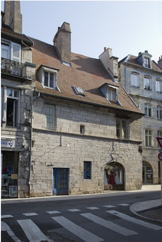
Façade sur rue, de trois quarts gauche.

25, Besançon, 135 Grande Rue, lieudit : îlot Saint-Maurice