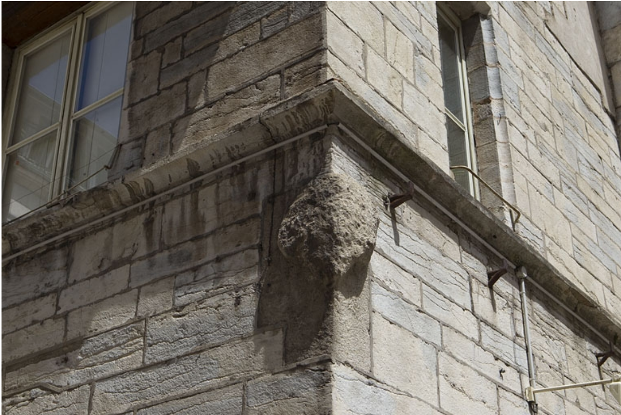
Logis principal, façade sur rue : détail des armoiries bûchées.

25, Besançon, 135 Grande Rue, lieudit : îlot Saint-Maurice