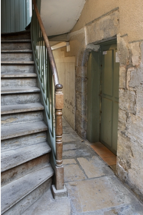
Logis principal : détail de l'escalier.

25, Besançon, 135 Grande Rue, lieudit : îlot Saint-Maurice