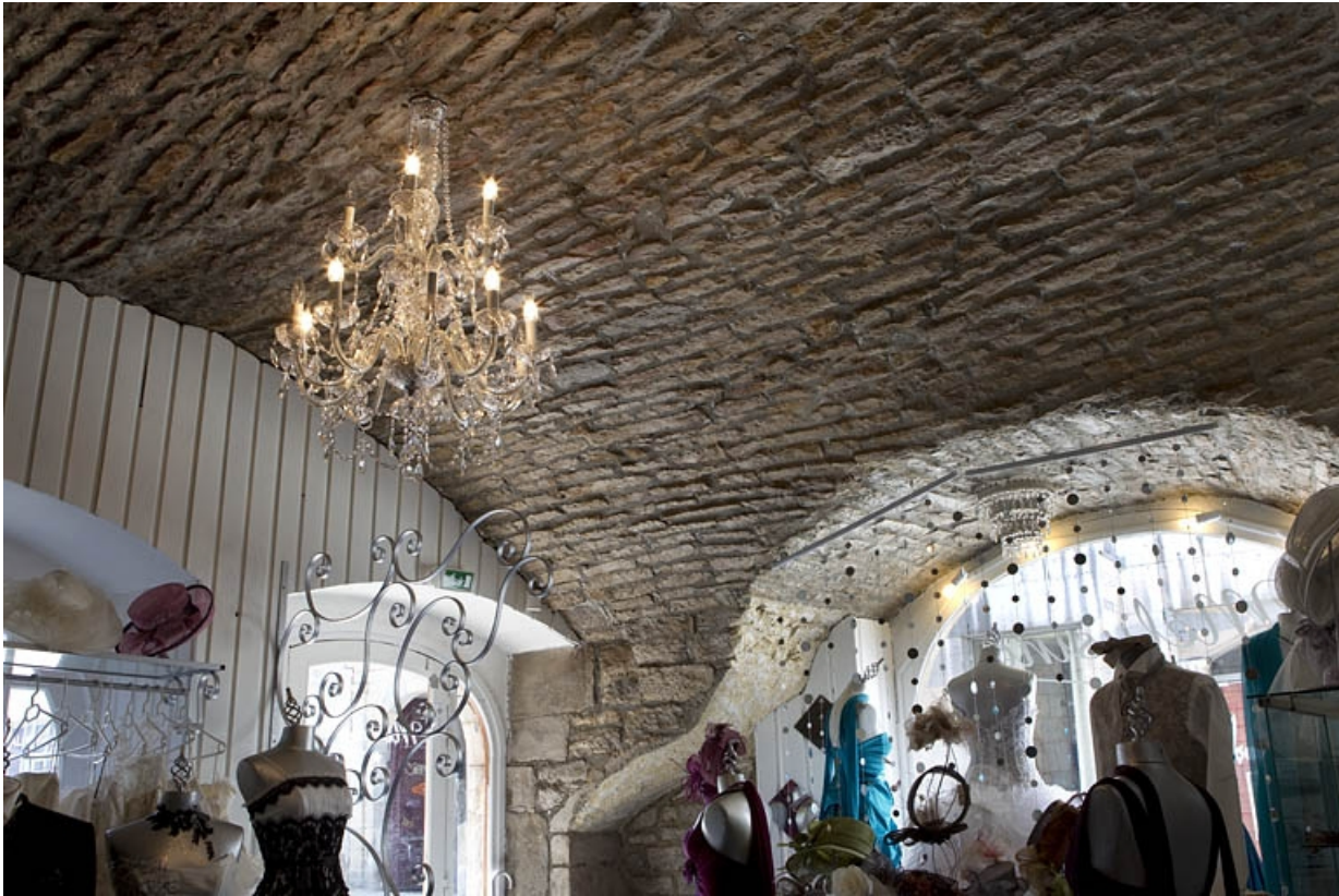
Logis principal, intérieur : détail de la voûte de la boutique.

25, Besançon, 135 Grande Rue, lieudit : îlot Saint-Maurice