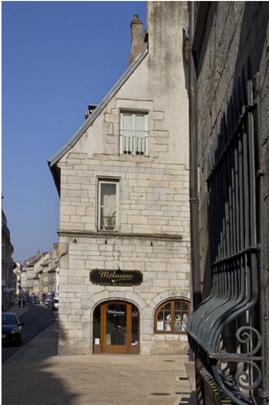
Façade latérale droite, de face.

25, Besançon, 135 Grande Rue, lieudit : îlot Saint-Maurice