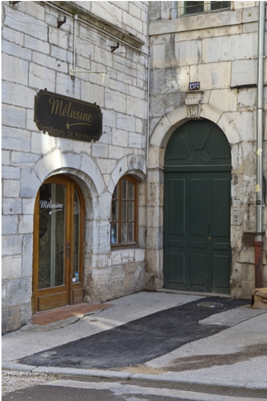
Logis principal, façade sur rue : détail des baies du rez-de-chaussée dans l'angle du bâtiment. 25, Besançon, 135 Grande Rue, lieudit : îlot Saint-Maurice