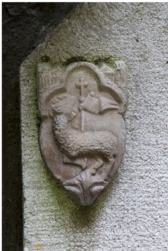
Borne fontaine : à gauche, détail du décor appliqué représentant un agneau pascal. 25, Besançon, 121 Grande Rue, lieudit : îlot Saint-Maurice