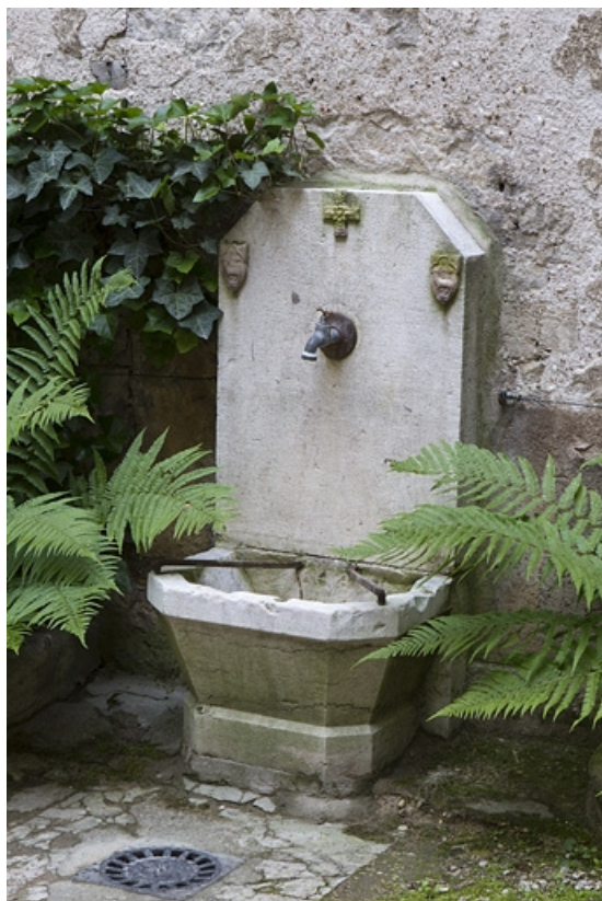
Cour : vue d'ensemble de la borne fontaine.

25, Besançon, 121 Grande Rue, lieudit : îlot Saint-Maurice