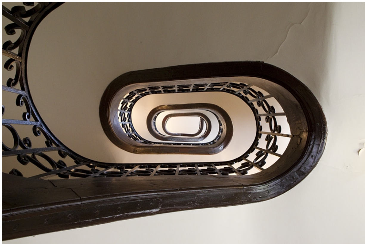
Intérieur, vue de l'escalier à jour central situé dans l'une des ailes, depuis le bas.

25, Besançon, 121 Grande Rue, lieudit : îlot Saint-Maurice