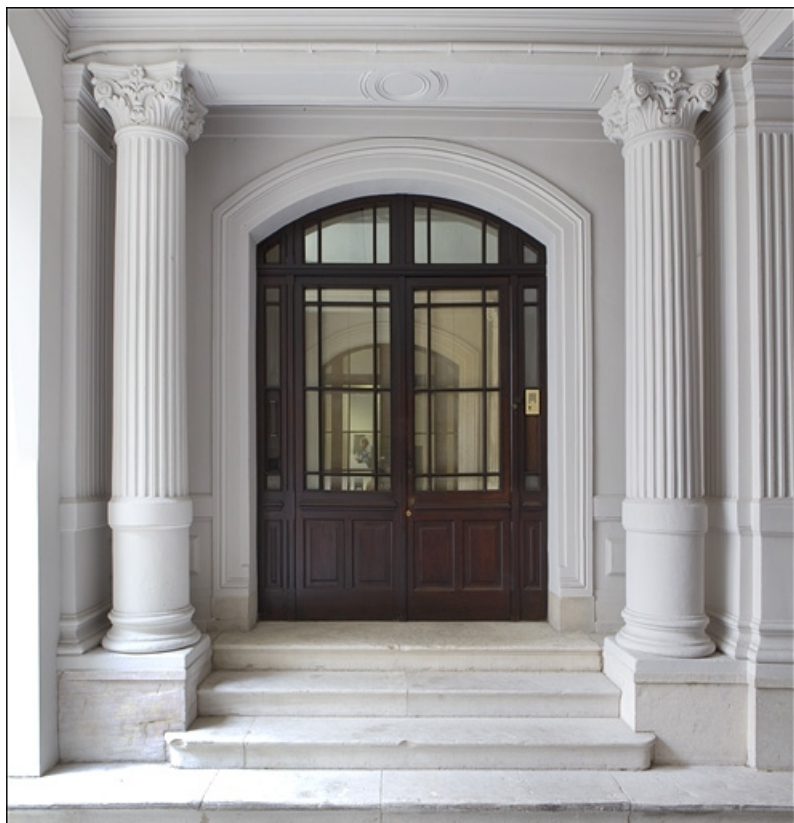
Détail de la porte d'entrée, à droite du passage cocher, permettant d'accéder à l'appartement du premier étage. 25, Besançon, 121 Grande Rue, lieudit : îlot Saint-Maurice