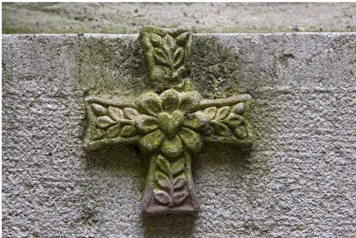
Borne fontaine : en haut, détail du décor appliqué représentant une croix grecque.

25, Besançon, 121 Grande Rue, lieudit : îlot Saint-Maurice