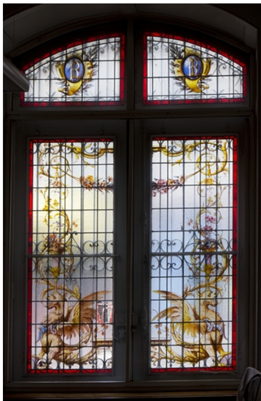
Intérieur : vue d'ensemble d'un vitrail dans une fenêtre du rez-de-chaussée. 25, Besançon, 121 Grande Rue, lieudit : îlot Saint-Maurice