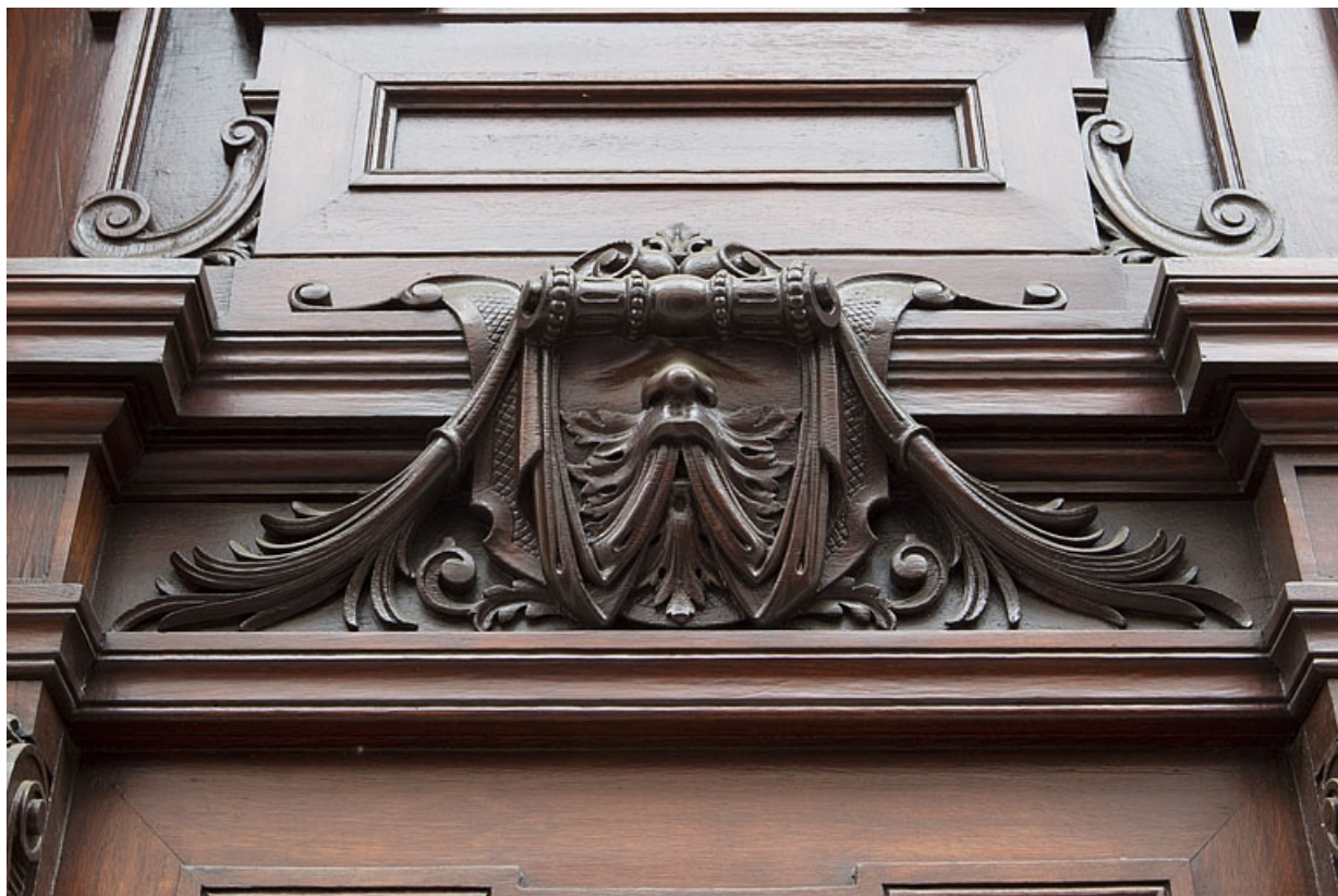
Façade antérieure, vantaux du portail d'entrée : détail du décor situé à la partie supérieure d'un vantail. 25, Besançon, 121 Grande Rue, lieudit : îlot Saint-Maurice