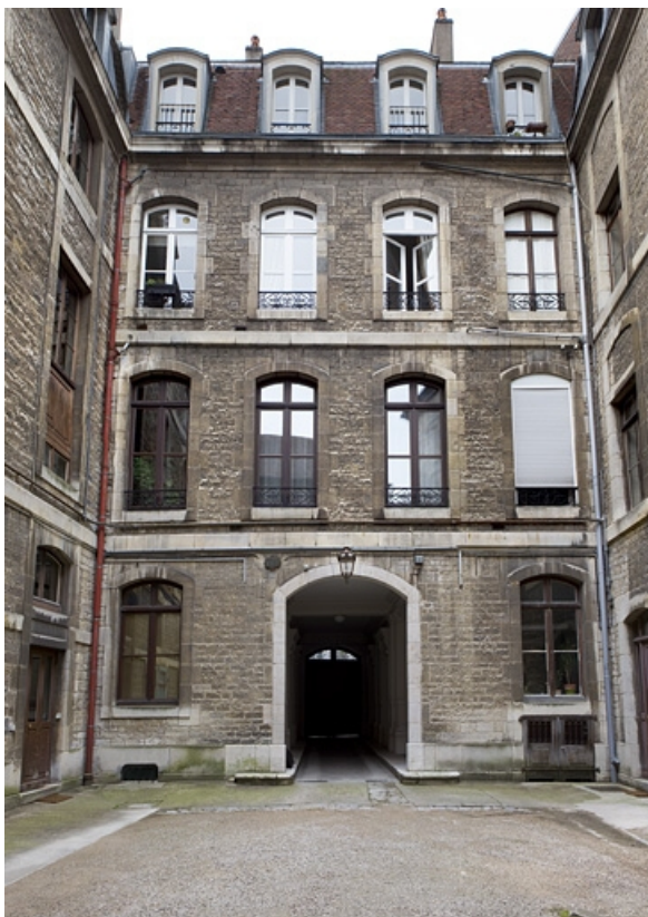
Façade postérieure sur cour : vue d'ensemble de face. 25, Besançon, 121 Grande Rue, lieudit : îlot Saint-Maurice