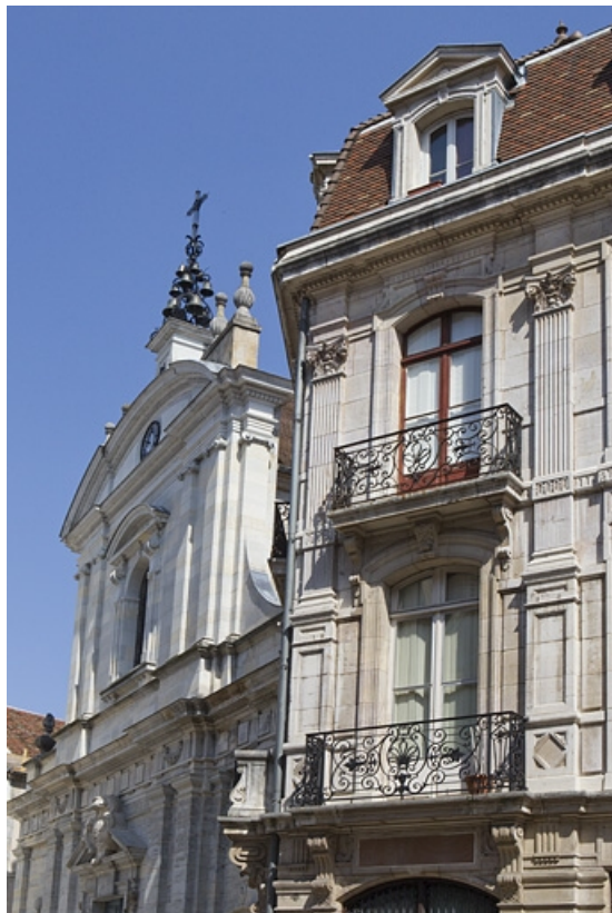
Détail de de deux balcons à gauche de la façade antérieure.

25, Besançon, 121 Grande Rue, lieudit : îlot Saint-Maurice