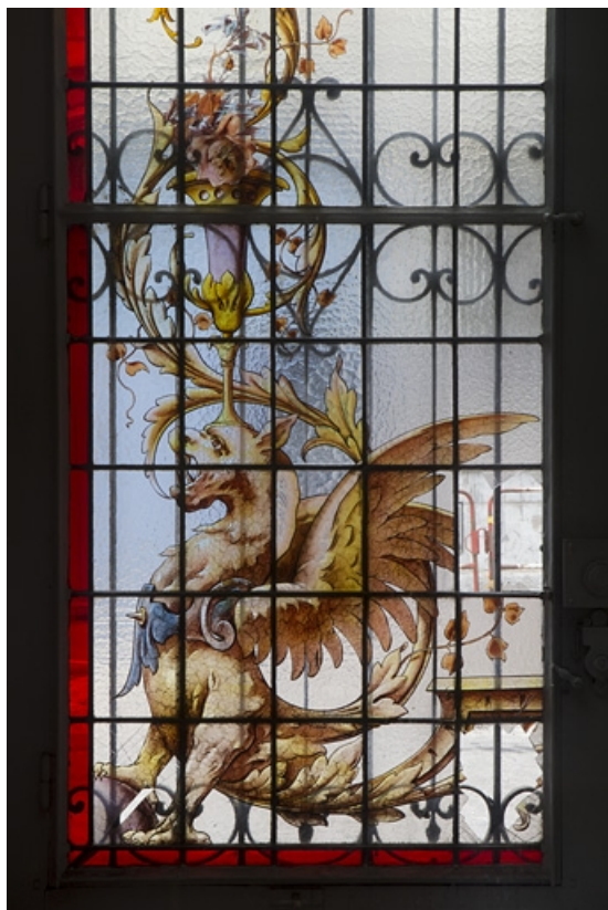
Intérieur, vitrail dans une fenêtre du rez-de-chaussée : détail du motif droit représentant un dragon ailé. 25, Besançon, 121 Grande Rue, lieudit : îlot Saint-Maurice