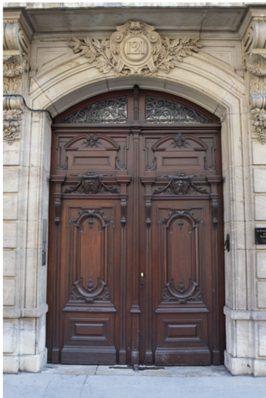
Façade antérieure, vue d'ensemble du portail d'entrée. 25, Besançon, 121 Grande Rue, lieudit : îlot Saint-Maurice