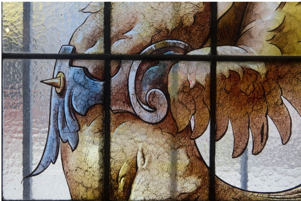
Intérieur, vitrail dans une fenêtre du rez-de-chaussée : détail rapproché de la cuirasse d'un dragon.

25, Besançon, 121 Grande Rue, lieudit : îlot Saint-Maurice