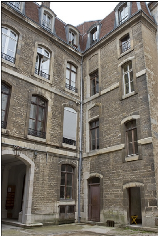
Façade postérieure sur cour : détail de l'aile gauche.

25, Besançon, 121 Grande Rue, lieudit : îlot Saint-Maurice