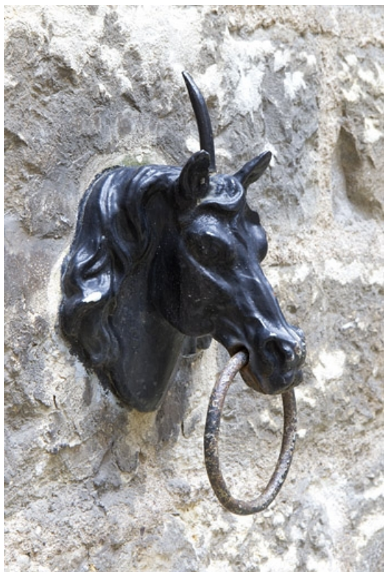
Cour : détail d'un anneau d'attache décoré d'une tête de cheval.

25, Besançon, 121 Grande Rue, lieudit : îlot Saint-Maurice