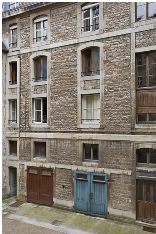
Façade postérieure sur cour : détail de l'aile droite.

25, Besançon, 121 Grande Rue, lieudit : îlot Saint-Maurice