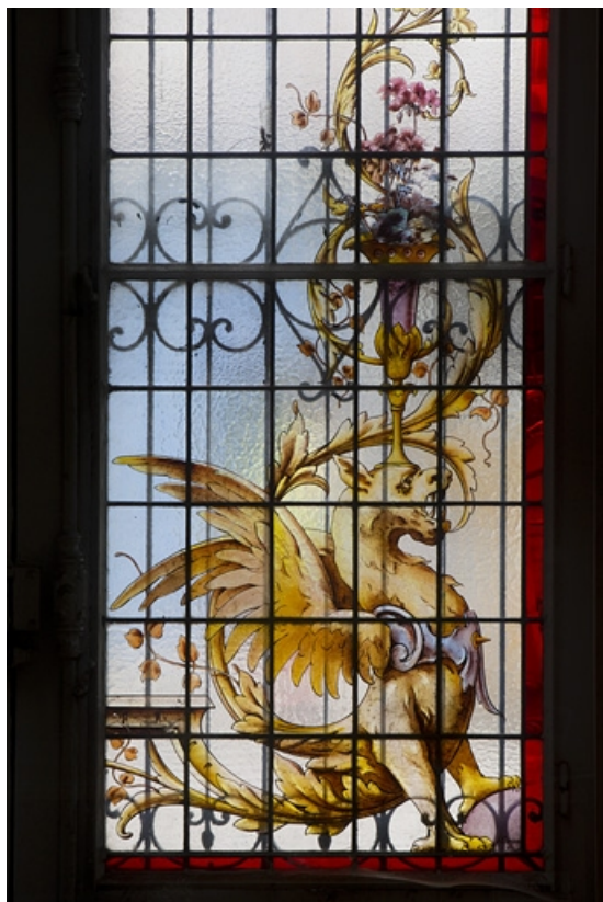
Intérieur, vitrail dans une fenêtre du rez-de-chaussée : détail du motif gauche représentant un dragon ailé. 25, Besançon, 121 Grande Rue, lieudit : îlot Saint-Maurice