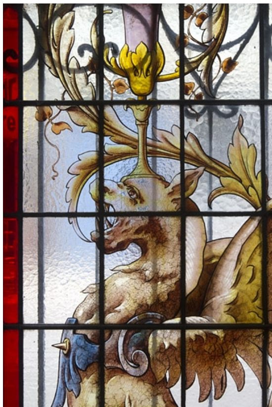
Intérieur, vitrail dans une fenêtre du rez-de-chaussée : détail rapproché d'une tête de dragon. 25, Besançon, 121 Grande Rue, lieudit : îlot Saint-Maurice