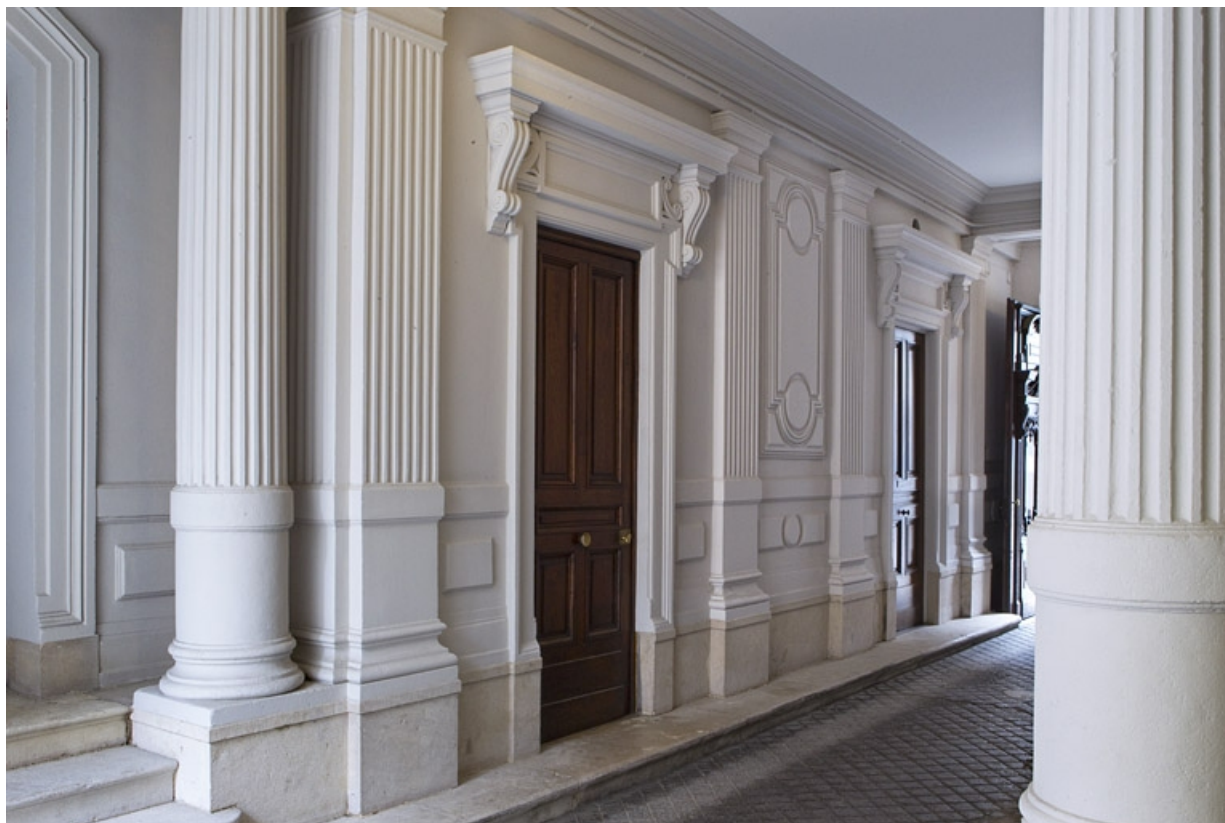
Passage cocher : détail du mur droit de trois quarts gauche.

25, Besançon, 121 Grande Rue, lieudit : îlot Saint-Maurice