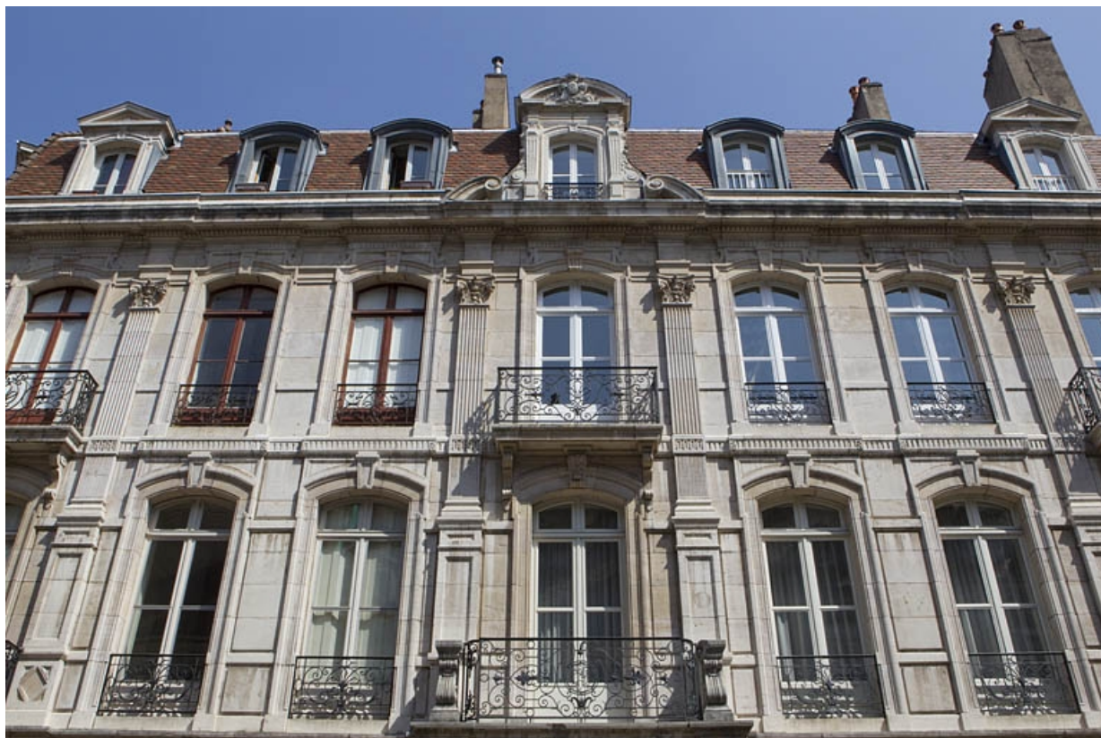
Détail de la travée centrale de la façade antérieure : partie supérieure.

25, Besançon, 121 Grande Rue, lieudit : îlot Saint-Maurice