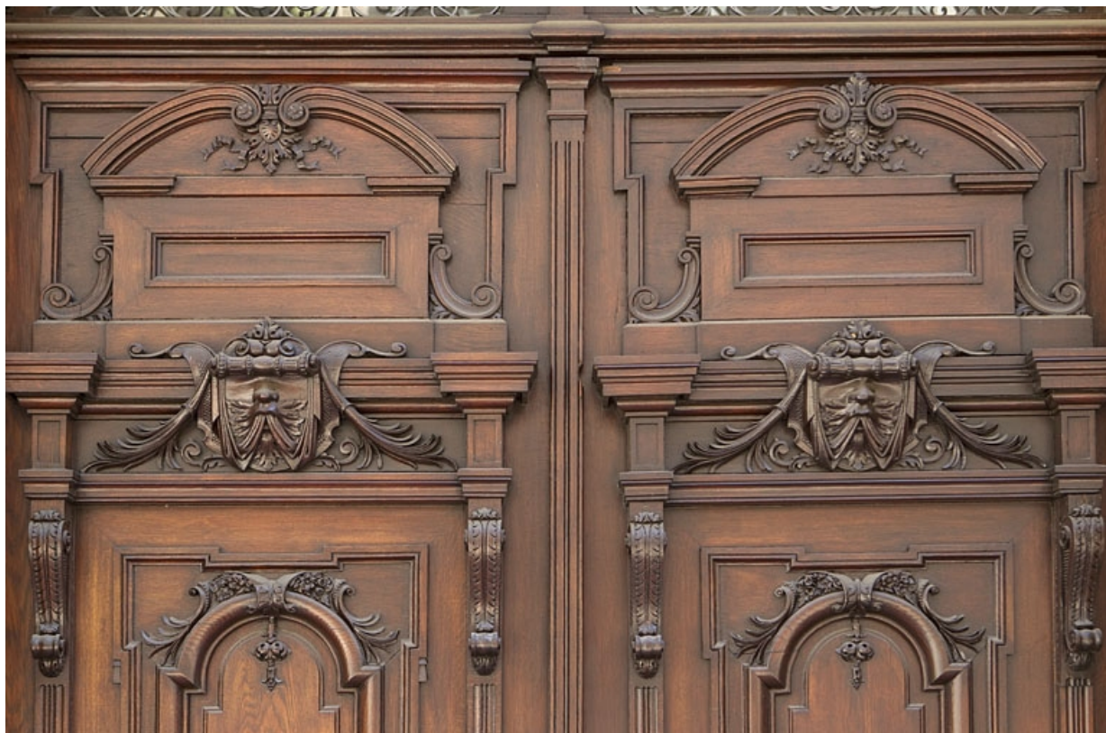
Façade antérieure, vantaux du portail d'entrée : décor de la partie supérieure.

25, Besançon, 121 Grande Rue, lieudit : îlot Saint-Maurice