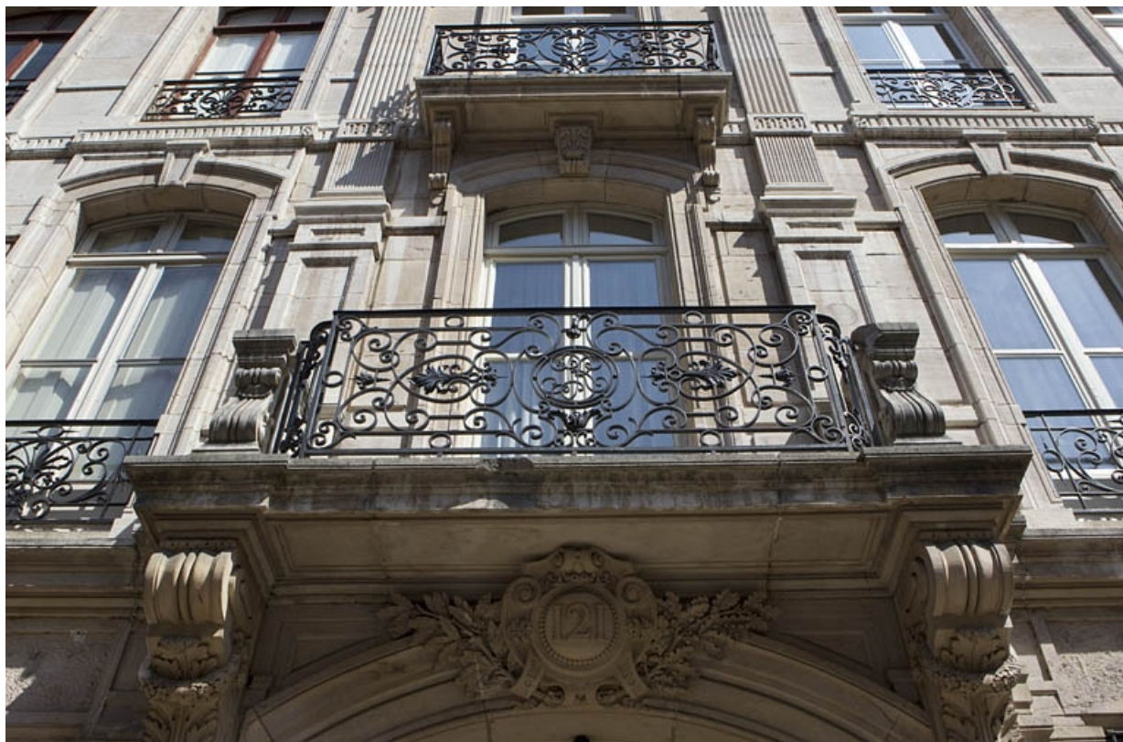
Détail de de deux balcons au dessus du portail d'entrée.

25, Besançon, 121 Grande Rue, lieudit : îlot Saint-Maurice