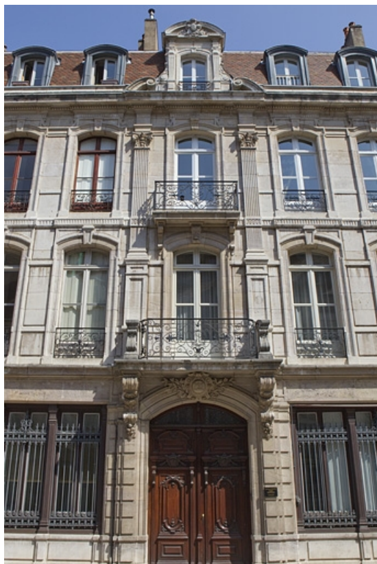
Détail de la travée centrale de la façade antérieure avec le portail d'entrée.

25, Besançon, 121 Grande Rue, lieudit : îlot Saint-Maurice