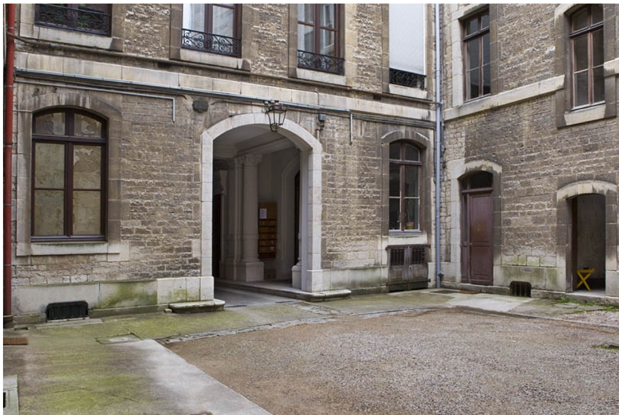
Façade postérieure sur cour : détail du rez-de-chaussée de trois quarts gauche. 25, Besançon, 121 Grande Rue, lieudit : îlot Saint-Maurice