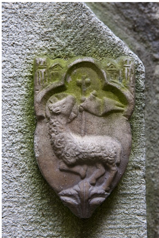
Borne fontaine : à droite, détail du décor appliqué représentant un agneau pascal.

25, Besançon, 121 Grande Rue, lieudit : îlot Saint-Maurice