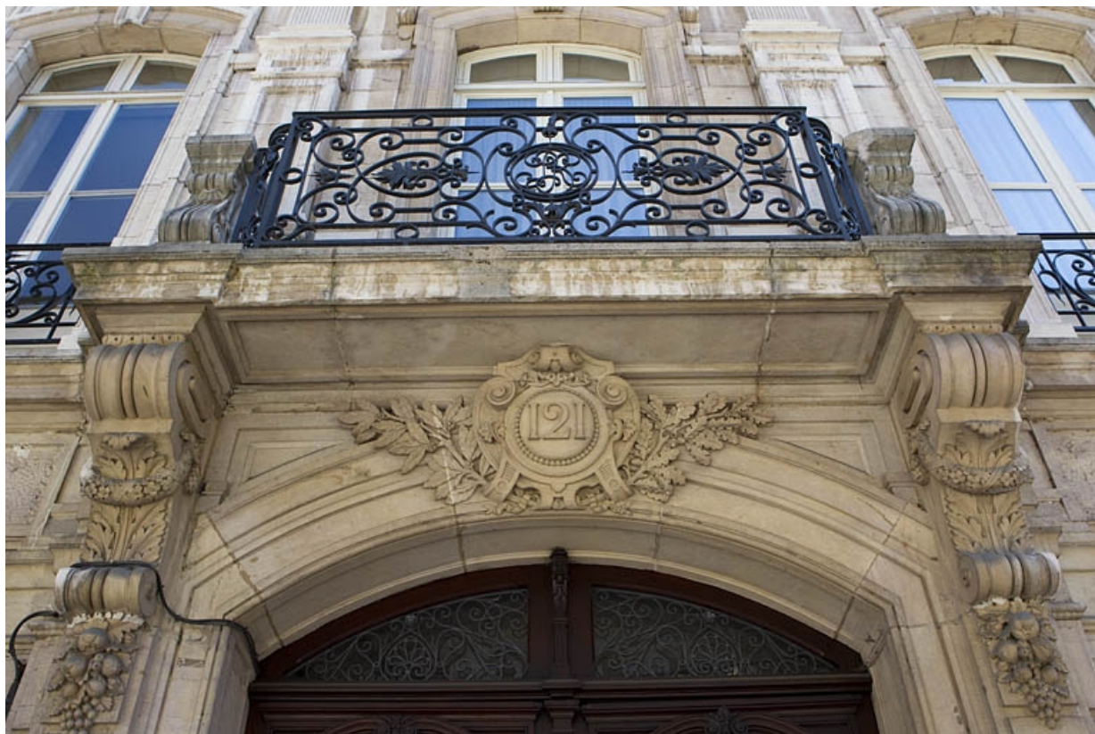
Façade antérieure, détail de l'arc du portail d'entrée et du balcon au-dessus.

25, Besançon, 121 Grande Rue, lieudit : îlot Saint-Maurice