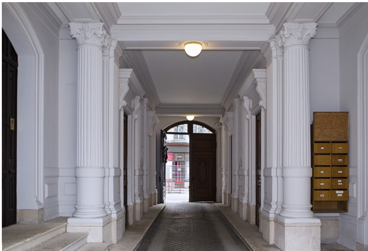
Passage cocher :vue d'ensemble rapprochée depuis la cour.

25, Besançon, 121 Grande Rue, lieudit : îlot Saint-Maurice