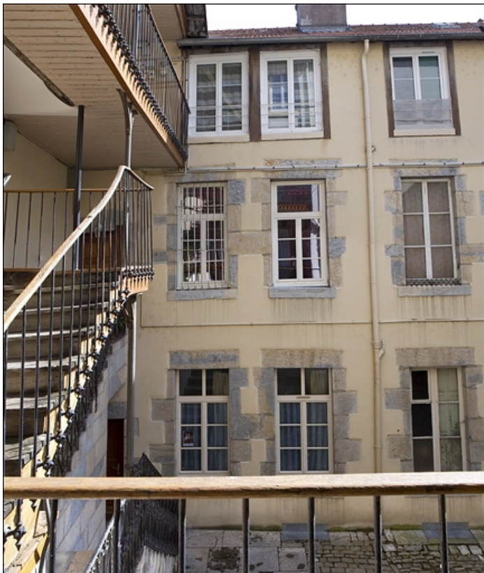
Vue d'ensemble de la façade antérieure du logis secondaire à droite de la première cour. 25, Besançon, 3 place Victor Hugo, lieudit : îlot Saint-Maurice