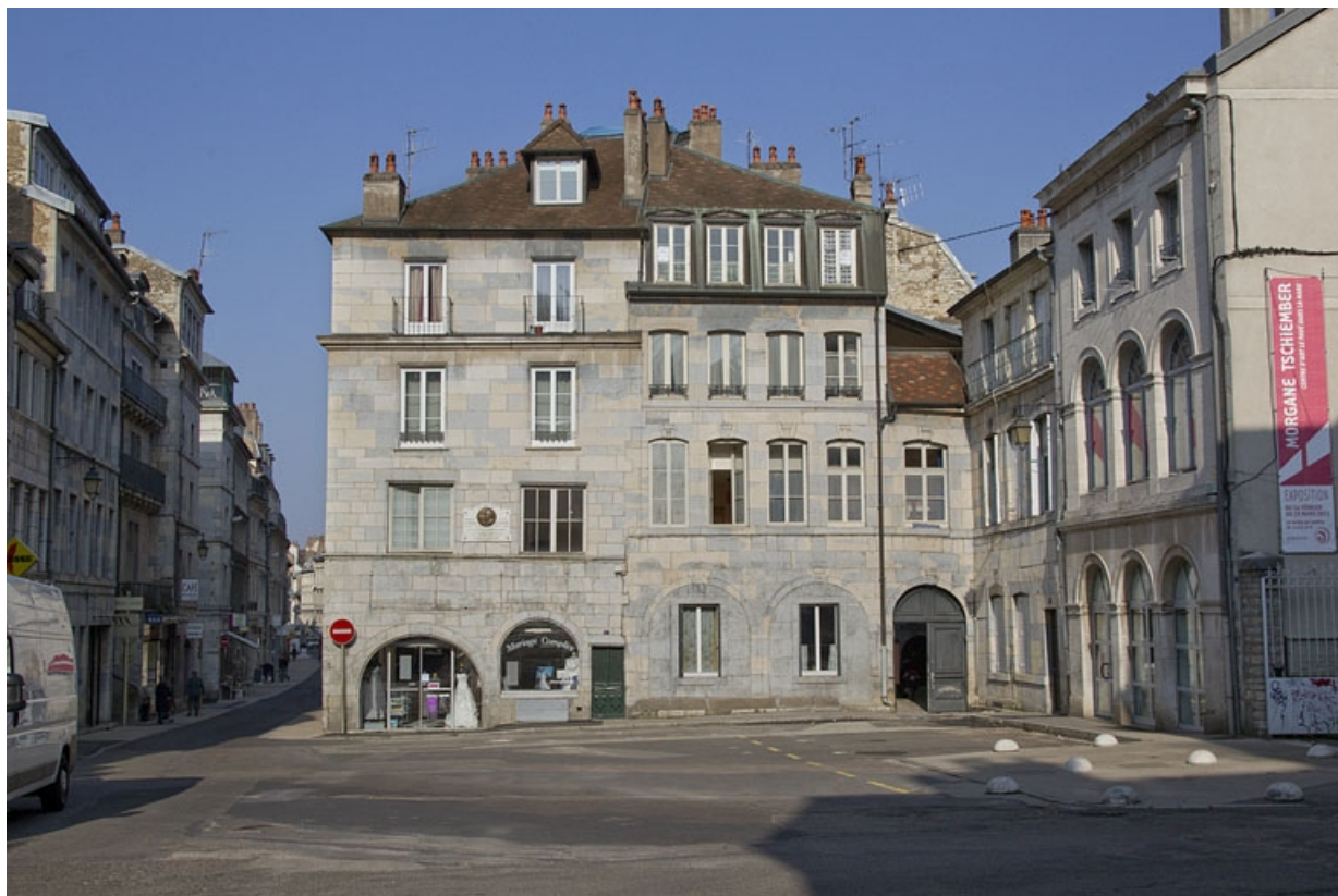
Vue d'ensemble depuis la place, de face.

25, Besançon, 3 place Victor Hugo, lieudit : îlot Saint-Maurice