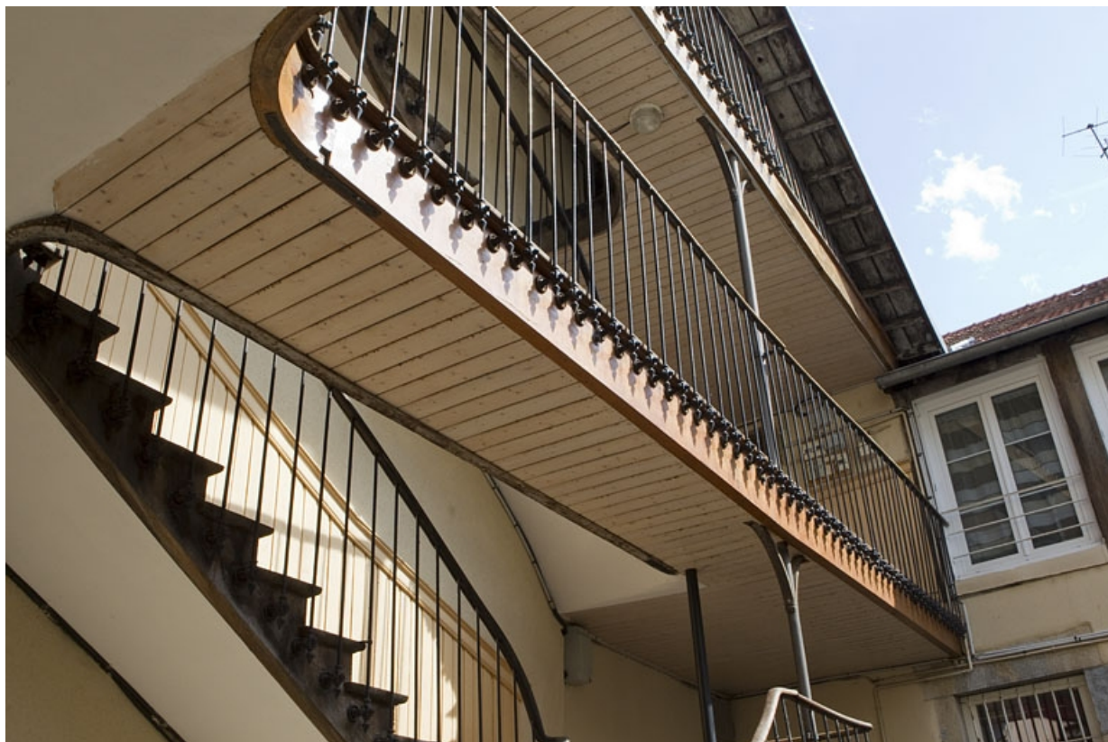
Escalier à cage ouverte sur cour : détail de la partie supérieure.

25, Besançon, 3 place Victor Hugo, lieudit : îlot Saint-Maurice