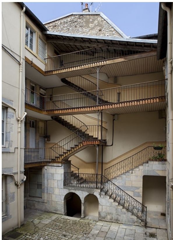
Vue d'ensemble de l'escalier à cage ouverte sur cour.

25, Besançon, 3 place Victor Hugo, lieudit : îlot Saint-Maurice