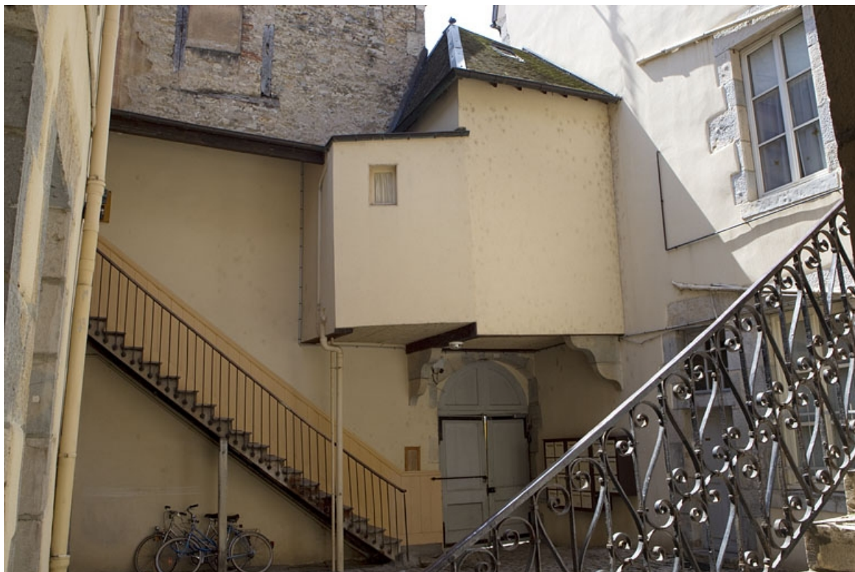
Vue d'ensemble de l'escalier extérieur secondaire situé dans la première cour.

25, Besançon, 3 place Victor Hugo, lieudit : îlot Saint-Maurice