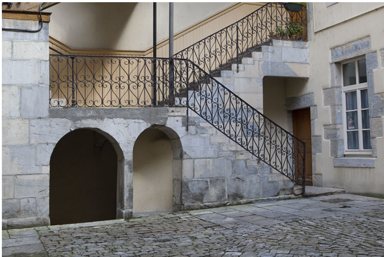
Escalier à cage ouverte sur cour : détail des deux premières volées.

25, Besançon, 3 place Victor Hugo, lieudit : îlot Saint-Maurice