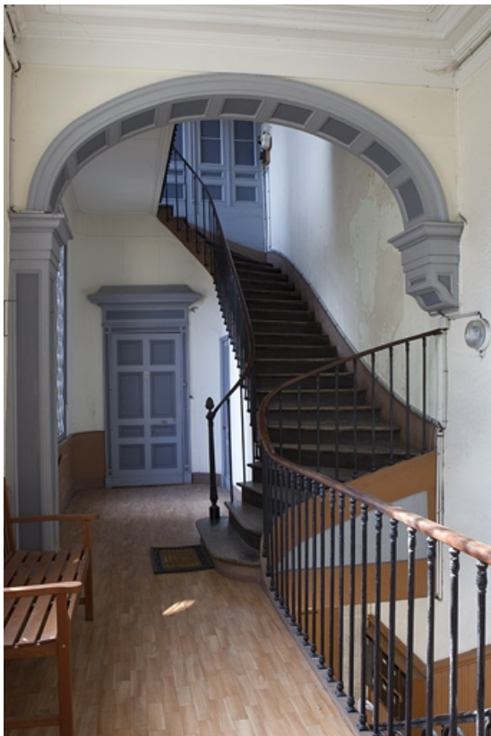
Vue des volées supérieures de l'escalier, de face.

25, Besançon, 8 rue des Martelots, lieudit : îlot Saint-Maurice