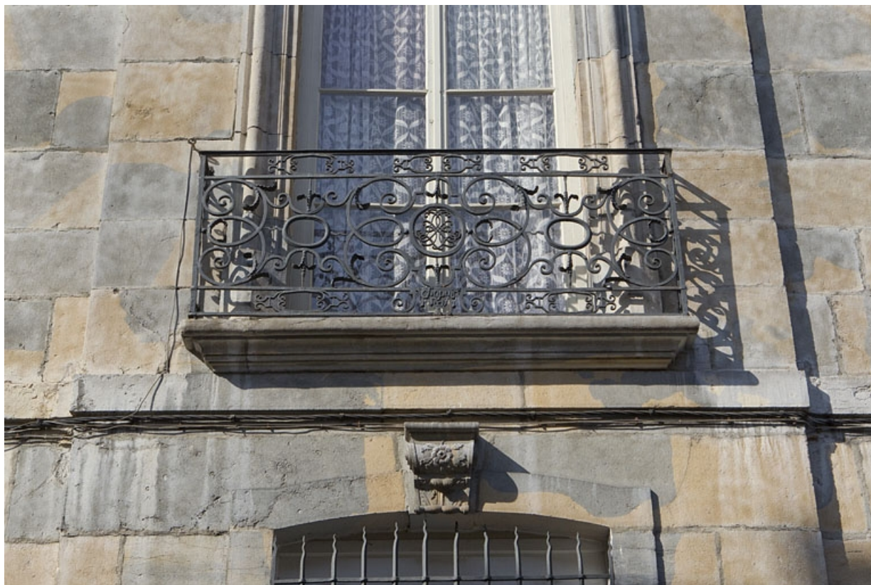
Aile droite : détail d'un garde-corps d'une fenêtre du premier étage.

25, Besançon, 8 rue des Martelots, lieudit : îlot Saint-Maurice