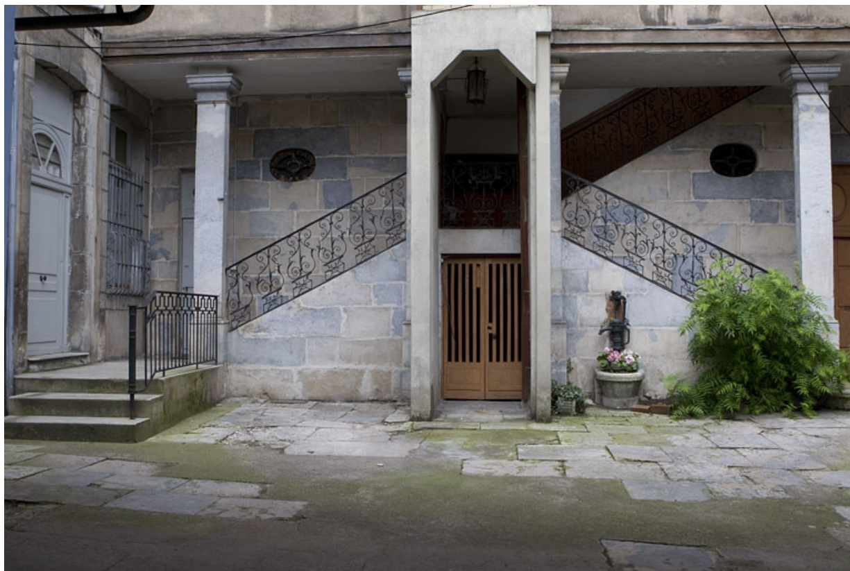
Vue du départ de l'escalier en fond de cour, de face.

25, Besançon, 8 rue des Martelots, lieudit : îlot Saint-Maurice