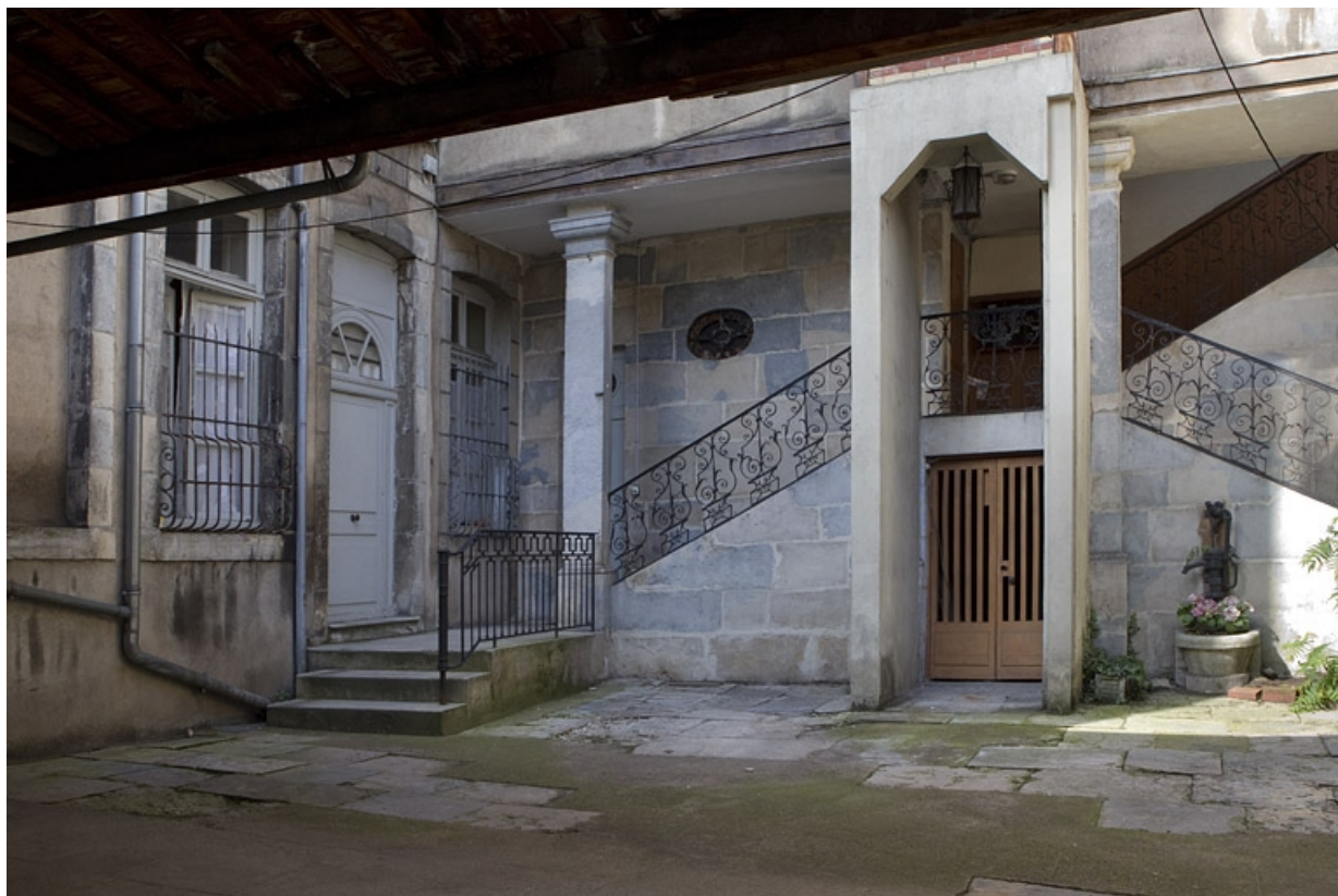
Vue du départ de l'escalier en fond de cour, de trois quarts droit.

25, Besançon, 8 rue des Martelots, lieudit : îlot Saint-Maurice