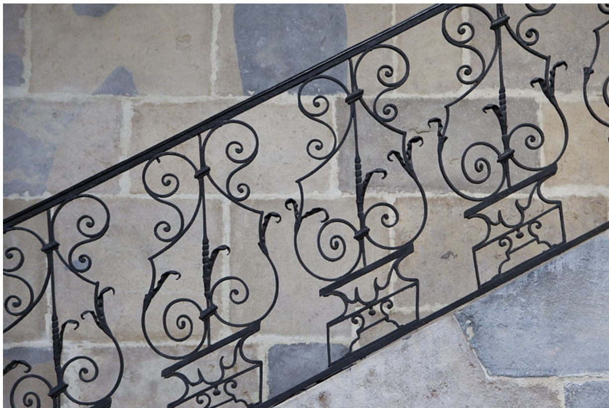
Escalier, première volée : détail de la rampe en ferronnerie.

25, Besançon, 8 rue des Martelots, lieudit : îlot Saint-Maurice