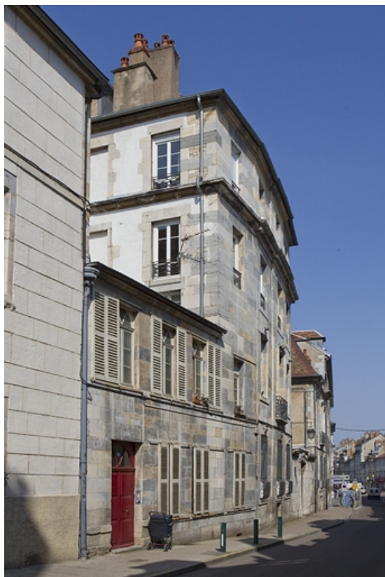
Vue d'ensemble depuis la rue, de trois quarts gauche. 25, Besançon, 8 rue des Martelots, lieudit : îlot Saint-Maurice