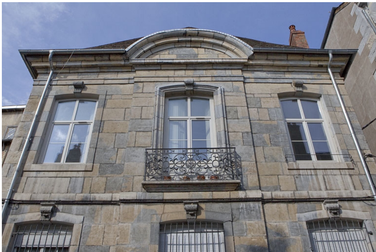
Aile droite : partie supérieure de la façade sur rue surmontée d'un fronton cintré. 25, Besançon, 8 rue des Martelots, lieudit : îlot Saint-Maurice