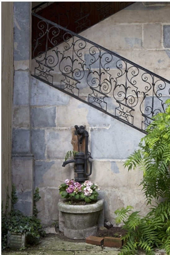
Escalier, première volée : détail de la rampe en ferronnerie et de la borne fontaine.

25, Besançon, 8 rue des Martelots, lieudit : îlot Saint-Maurice