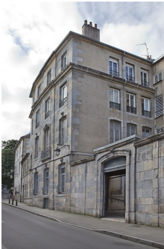
Vue d'ensemble de l'aile gauche depuis la rue, de trois quarts droit.

25, Besançon, 8 rue des Martelots, lieudit : îlot Saint-Maurice