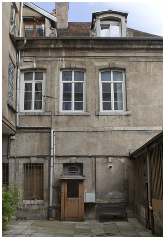
Vue d'ensemble de l'aile droite sur cour.

25, Besançon, 8 rue des Martelots, lieudit : îlot Saint-Maurice