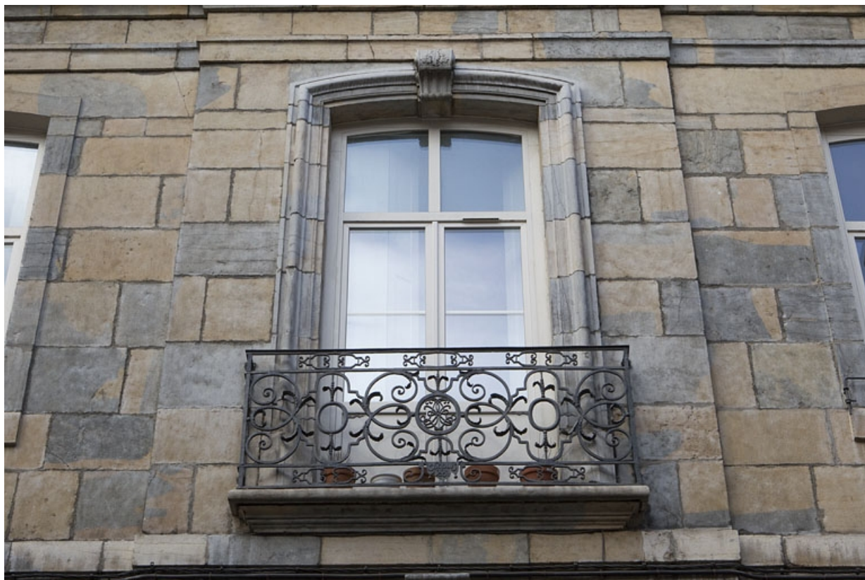
Aile droite : détail d'une fenêtre du premier étage.

25, Besançon, 8 rue des Martelots, lieudit : îlot Saint-Maurice