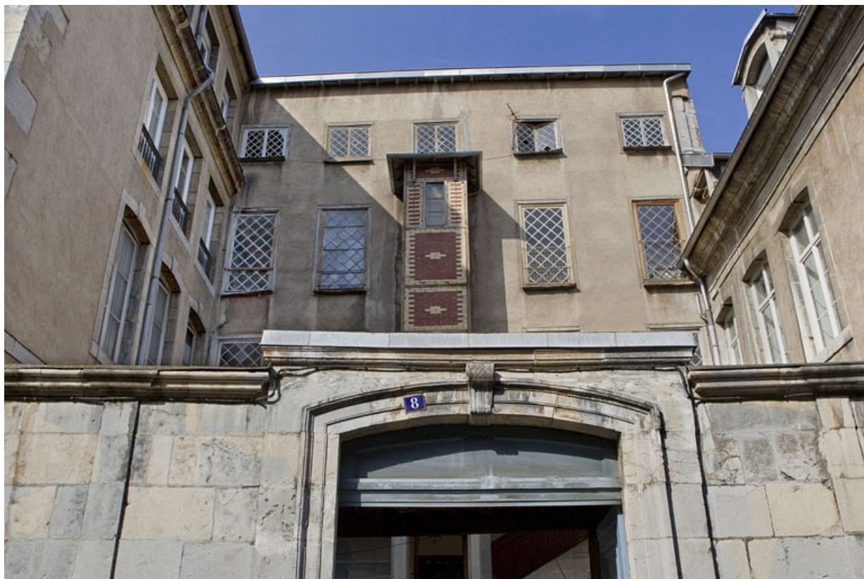
Vue d'ensemble de la clôture sur rue et de l'aile de l'escalier en fond de cour. 25, Besançon, 8 rue des Martelots, lieudit : îlot Saint-Maurice