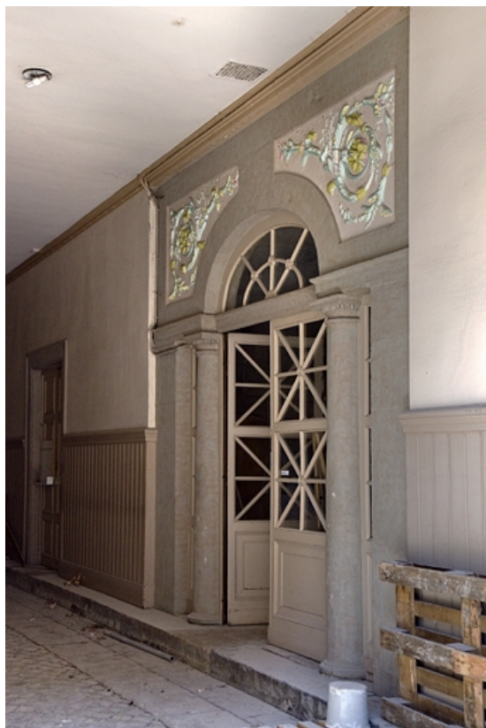
Passage cocher : détail de la porte d'entrée de l'escalier. 25, Besançon, 2 rue des Martelots, lieudit : îlot Saint-Maurice