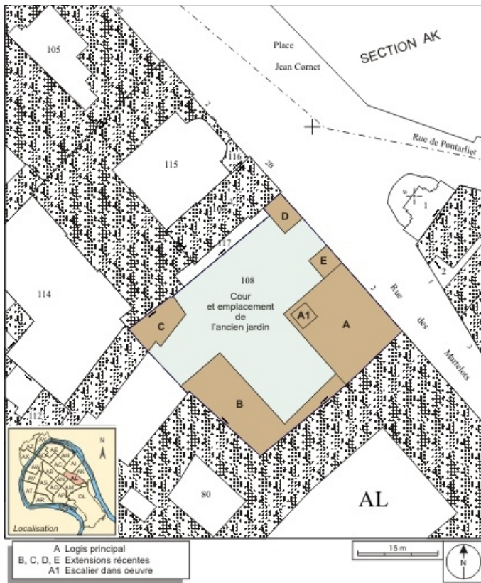
Plan masse et de situation. Extrait du plan cadastral, 1974, section AL. 25, Besançon, 2 rue des Martelots, lieudit : îlot Saint-Maurice