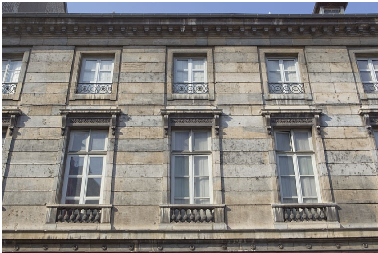
Façade antérieure : détail des premier et deuxième étages.

25, Besançon, 2 rue des Martelots, lieudit : îlot Saint-Maurice