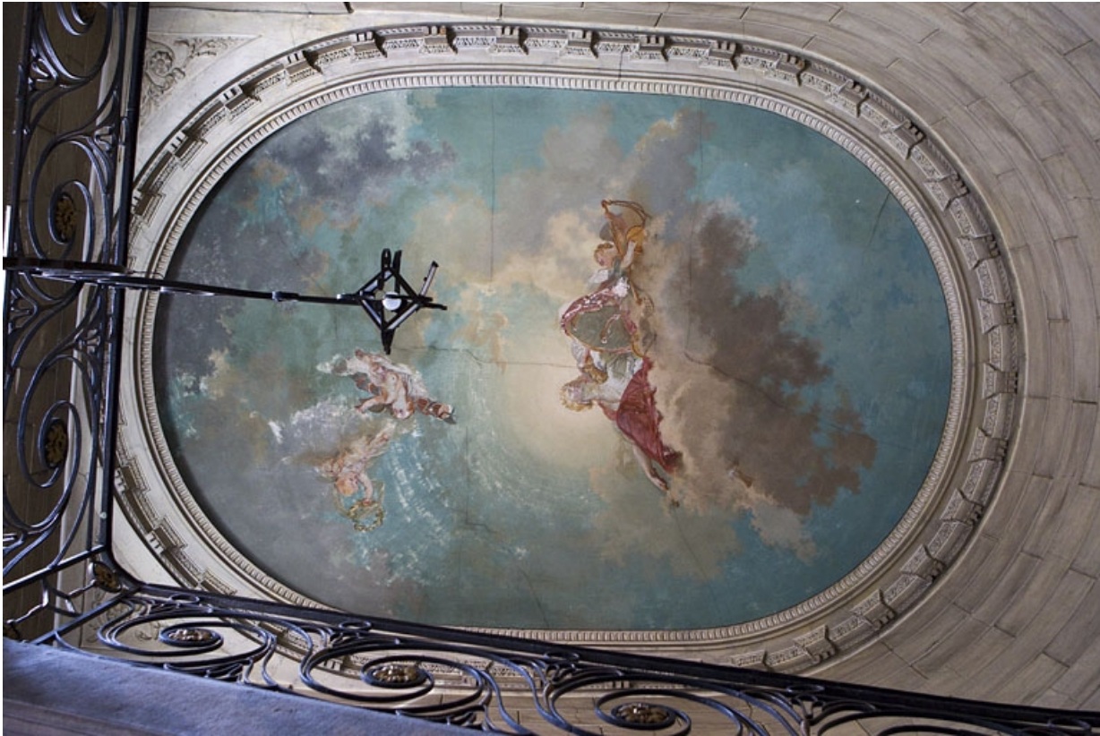
Intérieur : vue d'ensemble du plafond de la cage d'escalier.

25, Besançon, 2 rue des Martelots, lieudit : îlot Saint-Maurice