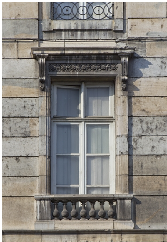
Façade antérieure : détail d'une fenêtre du premier étage. 25, Besançon, 2 rue des Martelots, lieudit : îlot Saint-Maurice