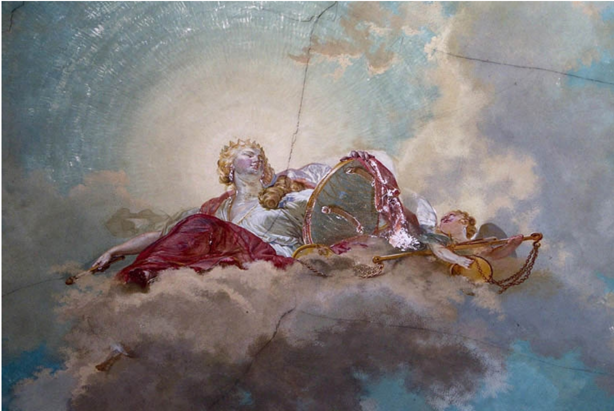
Intérieur, plafond de la cage d'escalier : détail du personnage féminin.

25, Besançon, 2 rue des Martelots, lieudit : îlot Saint-Maurice