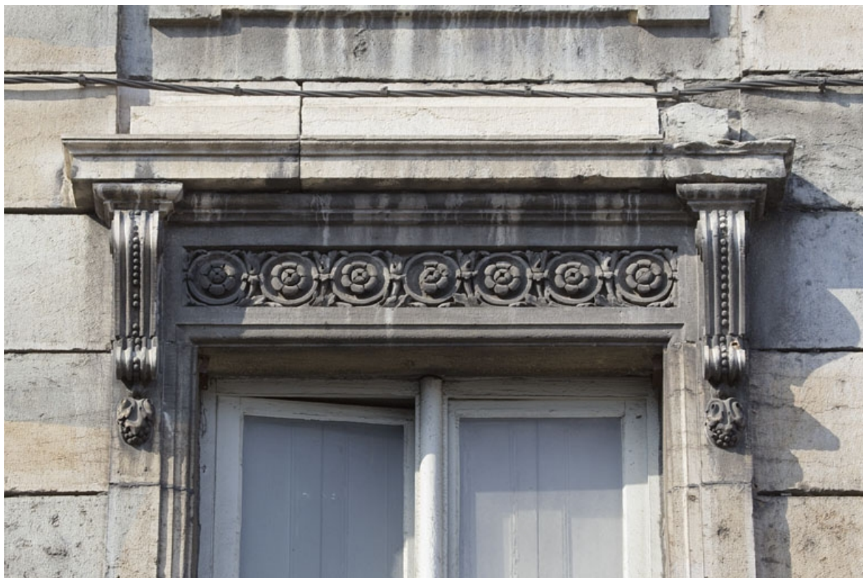
Façade antérieure, fenêtre du premier étage : détail du linteau décoré de fleurons.

25, Besançon, 2 rue des Martelots, lieudit : îlot Saint-Maurice