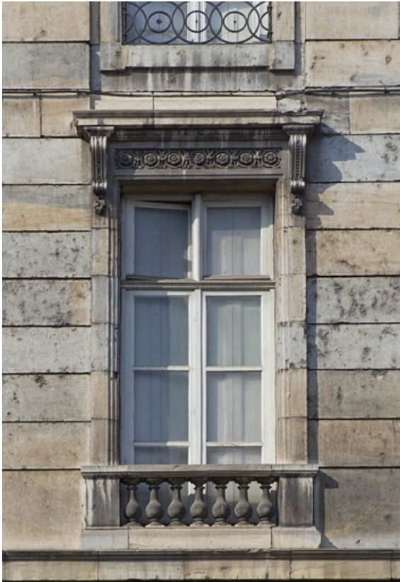
Façade antérieure : détail d'une fenêtre du premier étage. 25, Besançon, 2 rue des Martelots, lieudit : îlot Saint-Maurice