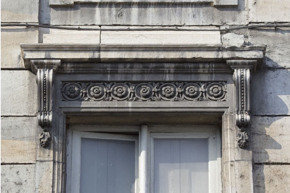
Façade antérieure, fenêtre du premier étage : détail du linteau décoré de fleurons.

25, Besançon, 2 rue des Martelots, lieudit : îlot Saint-Maurice