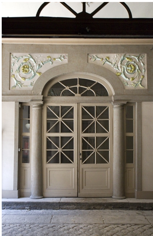
Passage cocher : détail de la porte d'entrée de l'escalier, de face.

25, Besançon, 2 rue des Martelots, lieudit : îlot Saint-Maurice