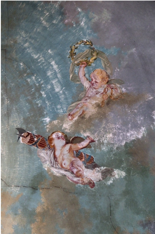
Intérieur, plafond de la cage d'escalier : détail des putti. 25, Besançon, 2 rue des Martelots, lieudit : îlot Saint-Maurice