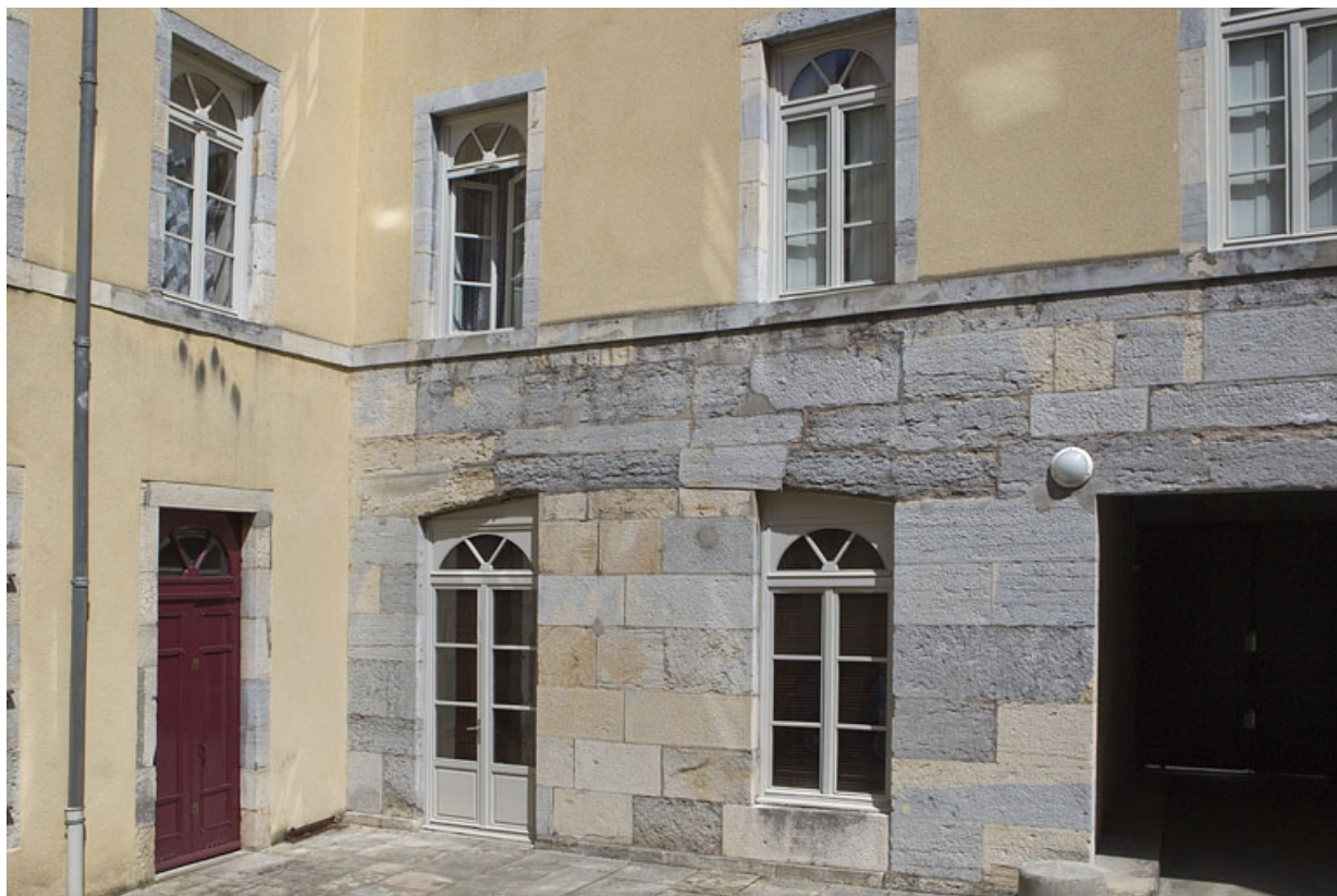
Immeuble : vue des façades sur la première cour à droite du passage cocher. 25, Besançon, 92 rue des Granges, lieudit : îlot Saint-Maurice