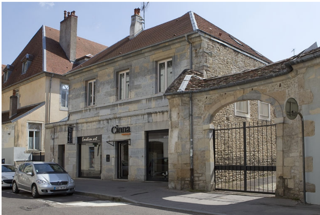
Façade sur la rue de la Bibliothèque du bâtiment en U bordant la deuxième cour. 25, Besançon, 92 rue des Granges, lieudit : îlot Saint-Maurice