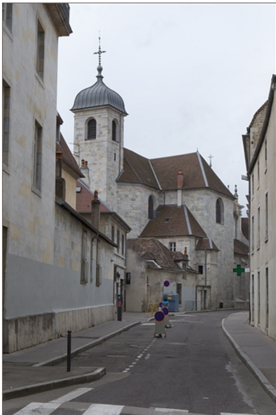
Vue d'ensemble des bâtiments depuis l'entrée de la rue de la Bibliothèque, vue rapprochée. 25, Besançon, 92 rue des Granges, lieudit : îlot Saint-Maurice