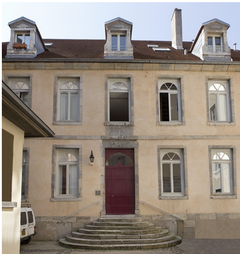
Maison entre les deux cours : façade postérieure, de face. 25, Besançon, 92 rue des Granges, lieudit : îlot Saint-Maurice