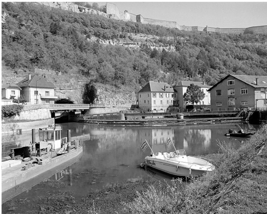
Vue d'ensemble depuis l'ouest (île de la maison d'éclusier n° 51).

25, Besançon Faubourg Tarragnoz, lieudit : îlot Tarragnoz