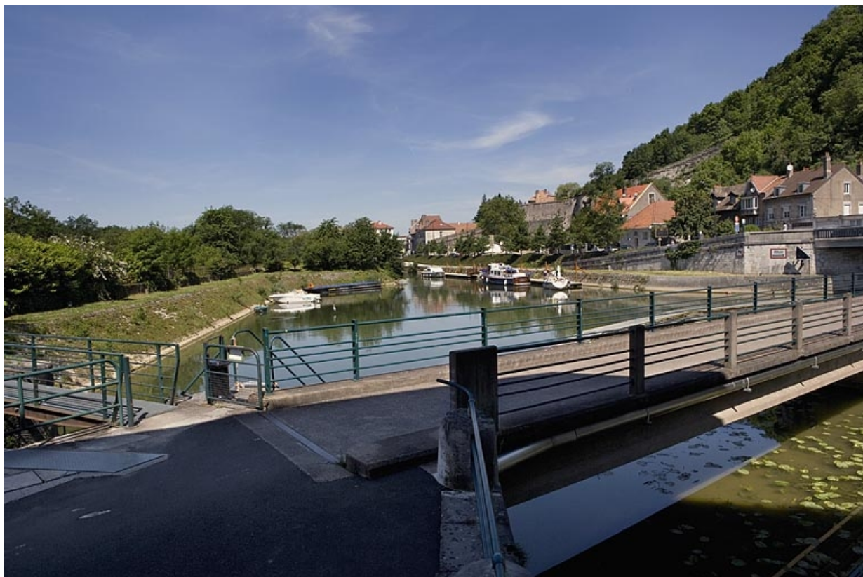
Vue d'ensemble depuis l'écluse n° 51.

25, Besançon Faubourg Tarragnoz, lieudit : îlot Tarragnoz