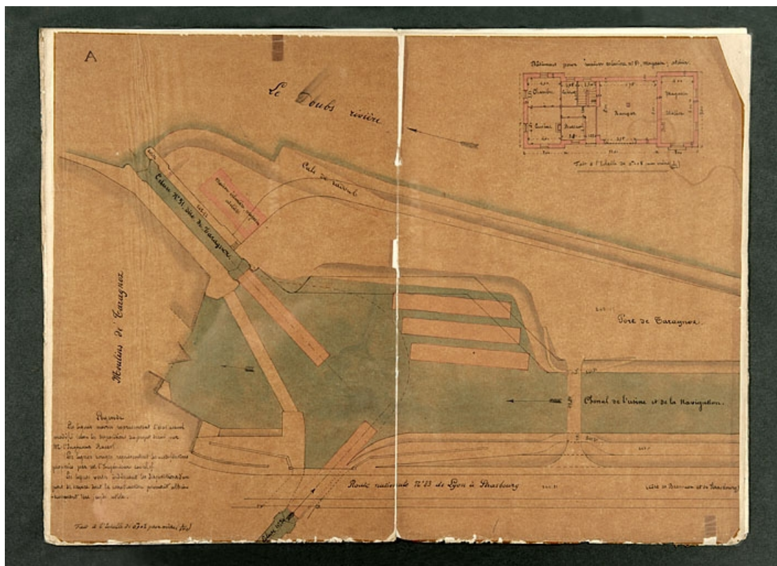
Dessin du bassin de Taragnoz, 1877.

25, Besançon Faubourg Tarragnoz, lieudit : îlot Tarragnoz