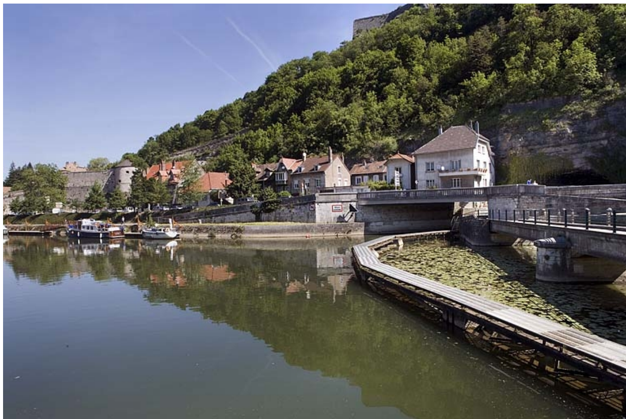
Debouché de l'écluse n° 50, pont routier et estacade, depuis l'écluse n° 51. 25, Besançon Faubourg Tarragnoz, lieudit : îlot Tarragnoz