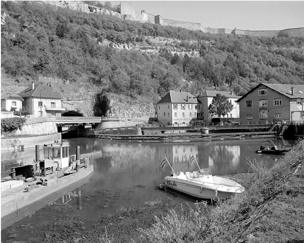
Vue d'ensemble depuis l'ouest (île de la maison d'éclusier n° 51).

25, Besançon Faubourg Tarragnoz, lieudit : îlot Tarragnoz