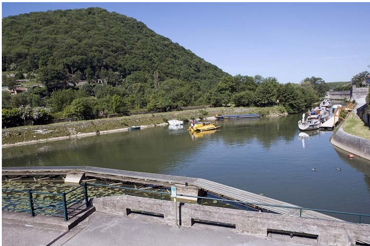
Bassin, depuis la route à l'est.