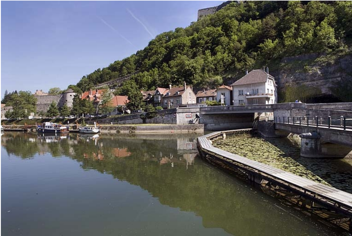
Debouché de l'écluse n° 50, pont routier et estacade, depuis l'écluse n° 51. 25, Besançon Faubourg Tarragnoz, lieudit : îlot Tarragnoz