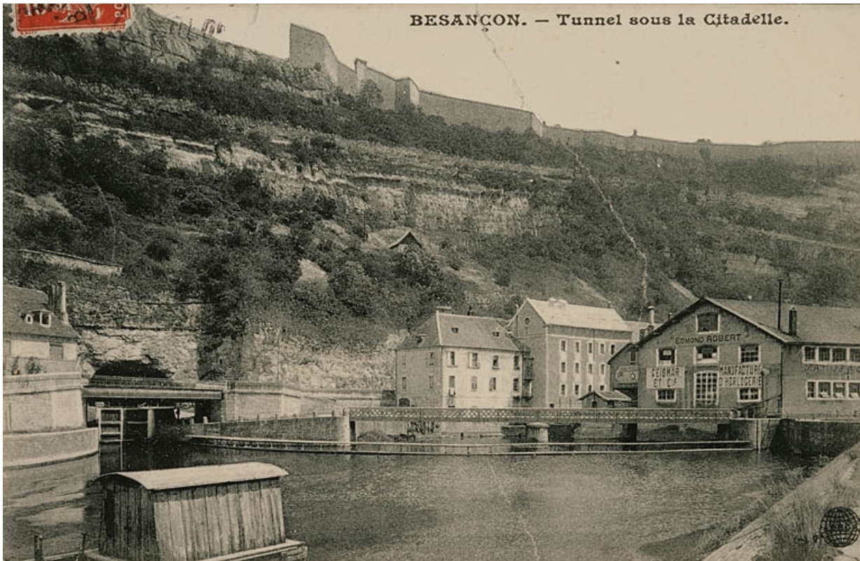
Besançon. - Tunnel sous la Citadelle [depuis l'île de la maison d'éclusier n° 51], décennie 1890 ou 1900.

25, Besançon Faubourg Tarragnoz, lieudit : îlot Tarragnoz