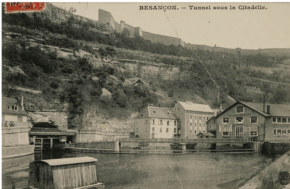
Besançon. - Tunnel sous la Citadelle [depuis l'île de la maison d'éclusier n° 51], décennie 1890 ou 1900.

25, Besançon Faubourg Tarragnoz, lieudit : îlot Tarragnoz