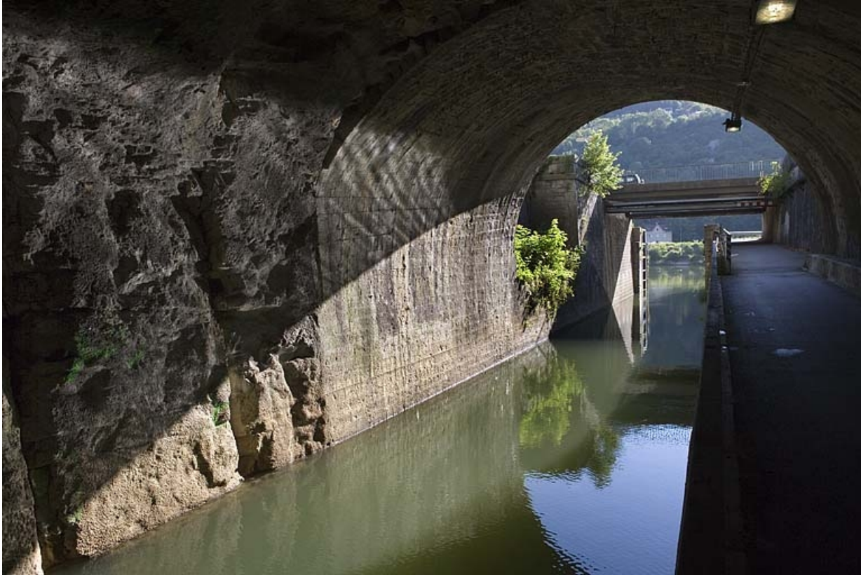
Vue d'ensemble depuis le tunnel.