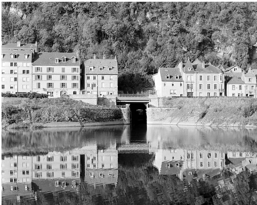
Vue d'ensemble de la porte de garde et de l'extrémité amont du tunnel.

25, Besançon Faubourg Rivotte, lieudit : îlot Faubourg Rivotte