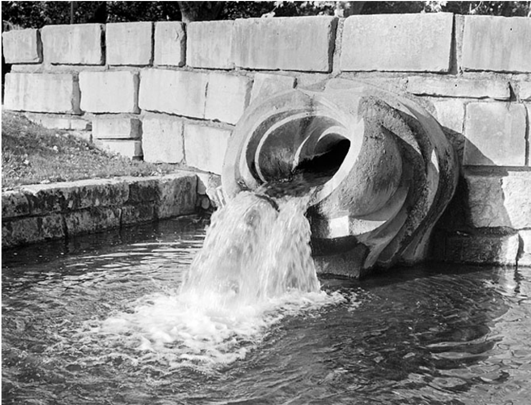
Fontaine de trois quarts droite.

25, Besançon avenue de la Gare d'Eau, lieudit : îlot Préfecture