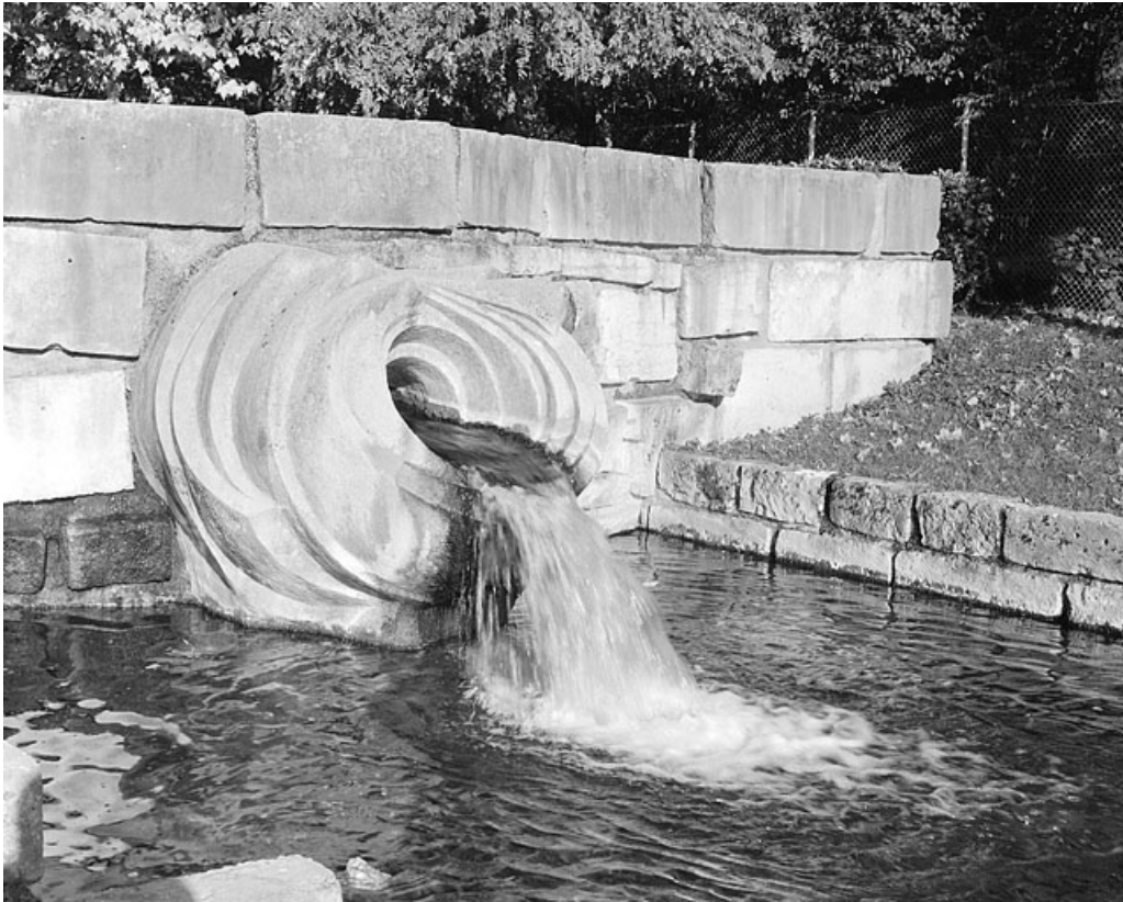
Fontaine de trois quarts gauche.

25, Besançon avenue de la Gare d'Eau, lieudit : îlot Préfecture