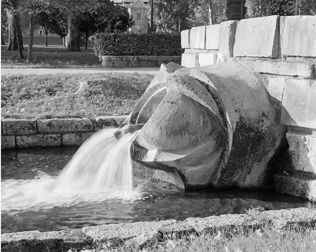
Fontaine de profil, à droite.

25, Besançon avenue de la Gare d'Eau, lieudit : îlot Préfecture