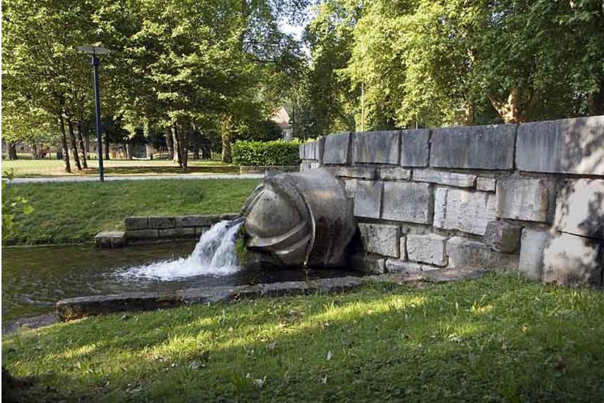
Vue d'ensemble de profil, à droite.

25, Besançon avenue de la Gare d'Eau, lieudit : îlot Préfecture