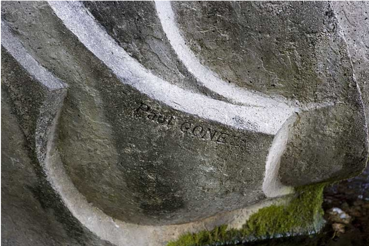
Signature, sur le côté gauche de la fontaine.

25, Besançon avenue de la Gare d'Eau, lieudit : îlot Préfecture