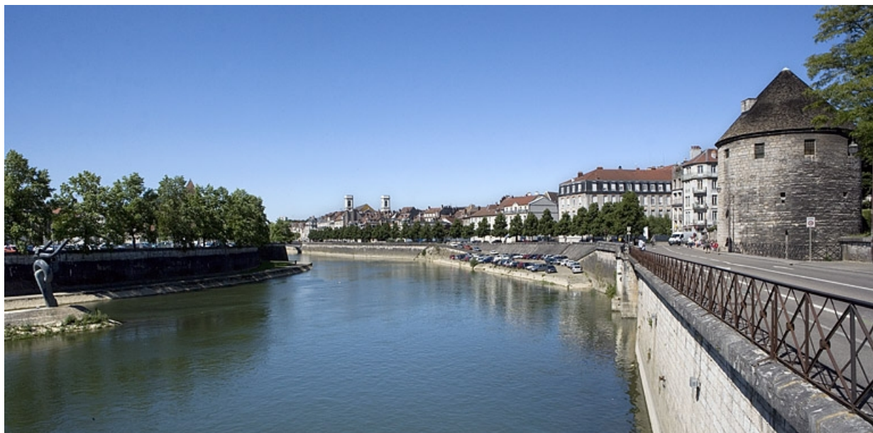
Vue d'ensemble depuis la rive droite, en amont. 25, Besançon quai de Strasbourg, lieudit : îlot Pelotte