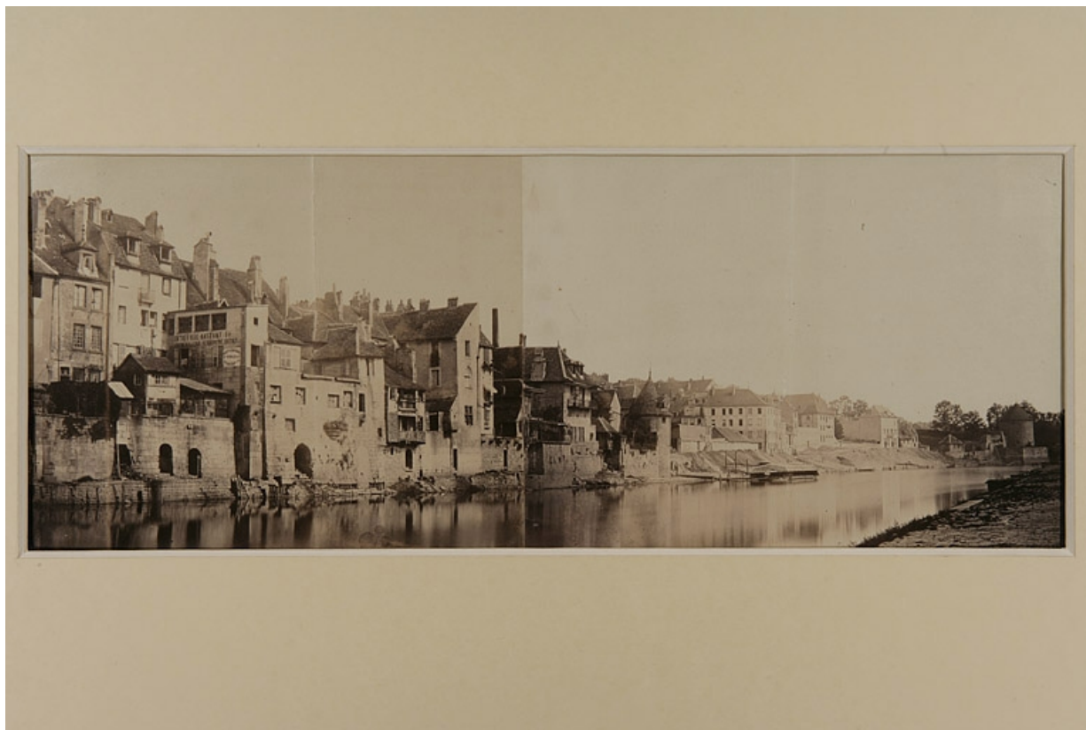
[Le quartier Battant et la rive droite du Doubs en amont du pont Battant, avant la construction du quai de Strasbourg], milieu 19e siècle.