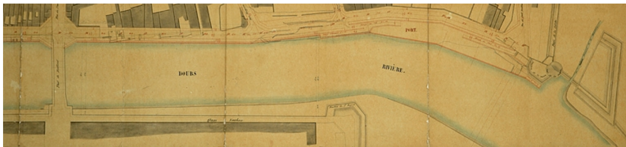
Avant-projet de travaux préservatifs des inondations. Ville de Besançon (rive droite du Doubs). Plan d'ensemble des travaux [partie droite], 1861.

25, Besançon quai de Strasbourg, lieudit : îlot Pelotte