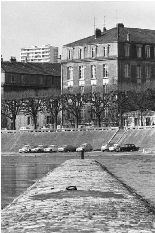
Le port de Strasbourg depuis la digue de l'île Saint-Pierre, en 1975.

25, Besançon quai de Strasbourg, lieudit : îlot Pelotte