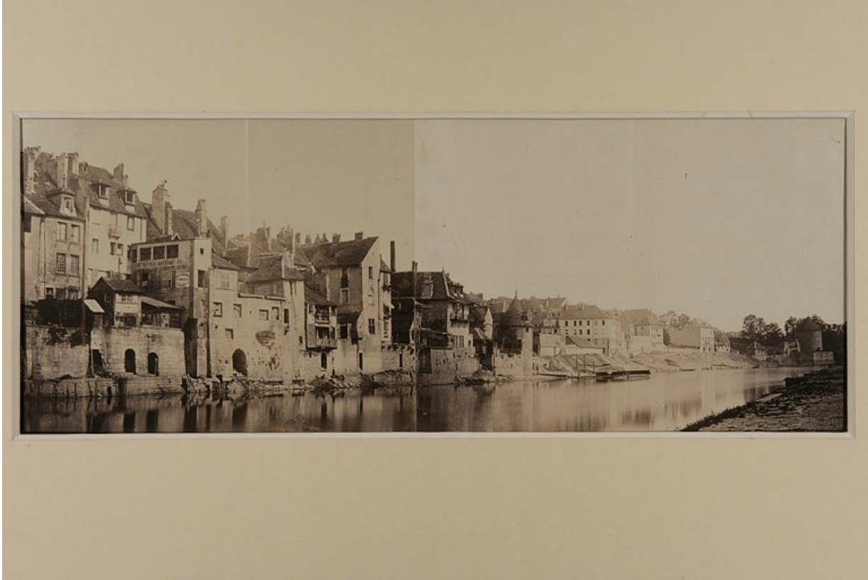
[Le quartier Battant et la rive droite du Doubs en amont du pont Battant, avant la construction du quai de Strasbourg], milieu 19e siècle.