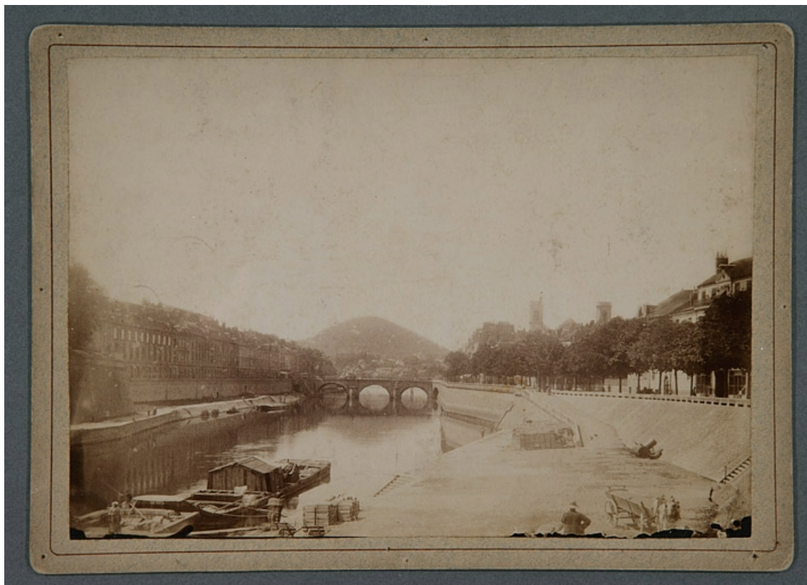
[Vue d'ensemble du port de Strasbourg, du pont Battant et du chemin de halage], limite 19e siècle 20e siècle. 25, Besançon quai de Strasbourg, lieudit : îlot Pelotte