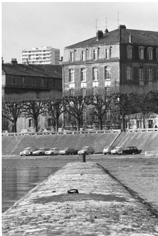
Le port de Strasbourg depuis la digue de l'île Saint-Pierre, en 1975.

25, Besançon quai de Strasbourg, lieudit : îlot Pelotte