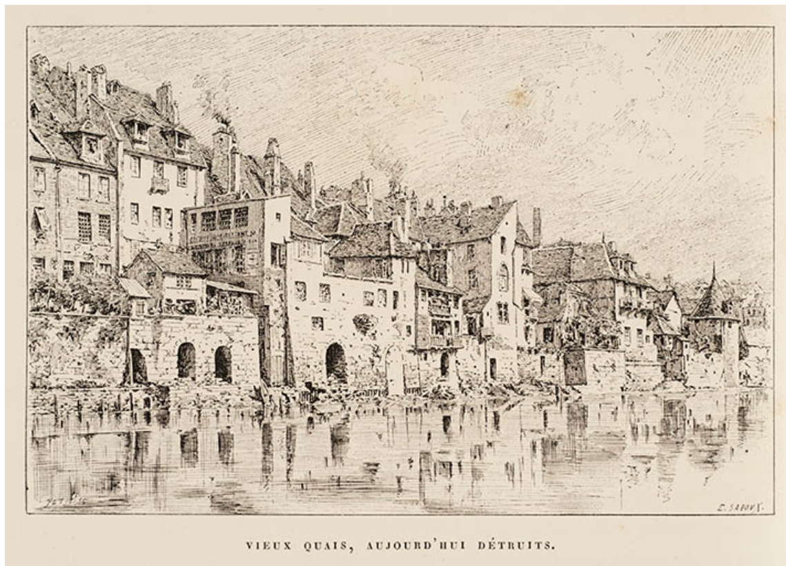
Vieux quais, aujourd'hui détruits [état avant 1864 de l'emplacement du quai de Strasbourg], décennie 1880 25, Besançon quai de Strasbourg, lieudit : îlot Pelotte