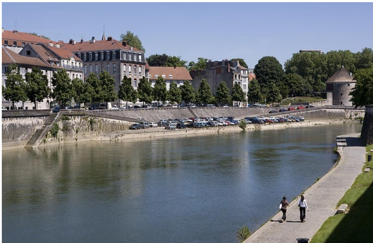
Vue d'ensemble depuis la rive gauche, en aval.