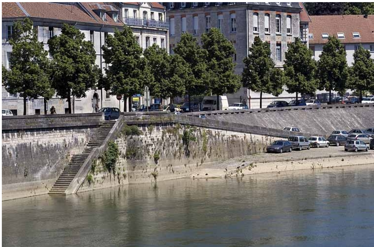
Escalier et rampes d'accès au port et au Doubs. 25, Besançon quai de Strasbourg, lieudit : îlot Pelotte