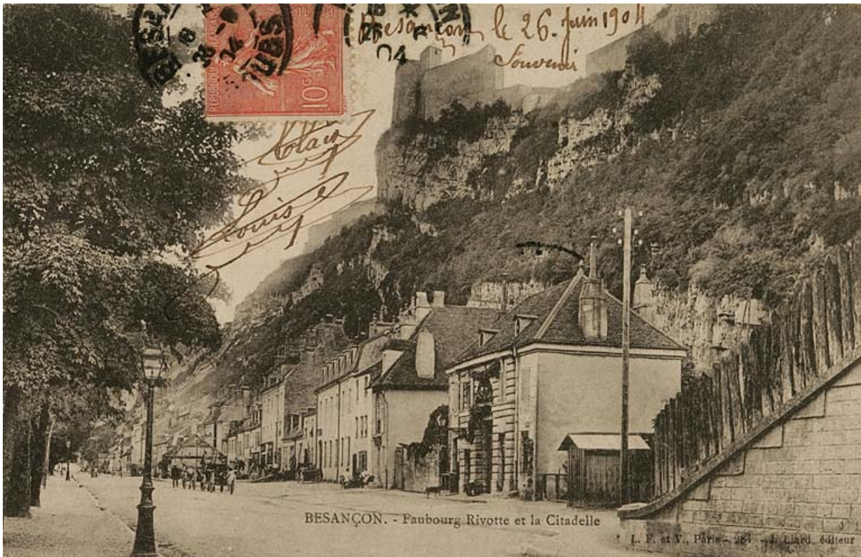
Besançon. - Faubourg Rivotte et la Citadelle [depuis la route sous le pont du chemin de fer], avant le 26 juin 1904. 25, Besançon Faubourg Rivotte 2, lieudit : îlot Porte Rivotte