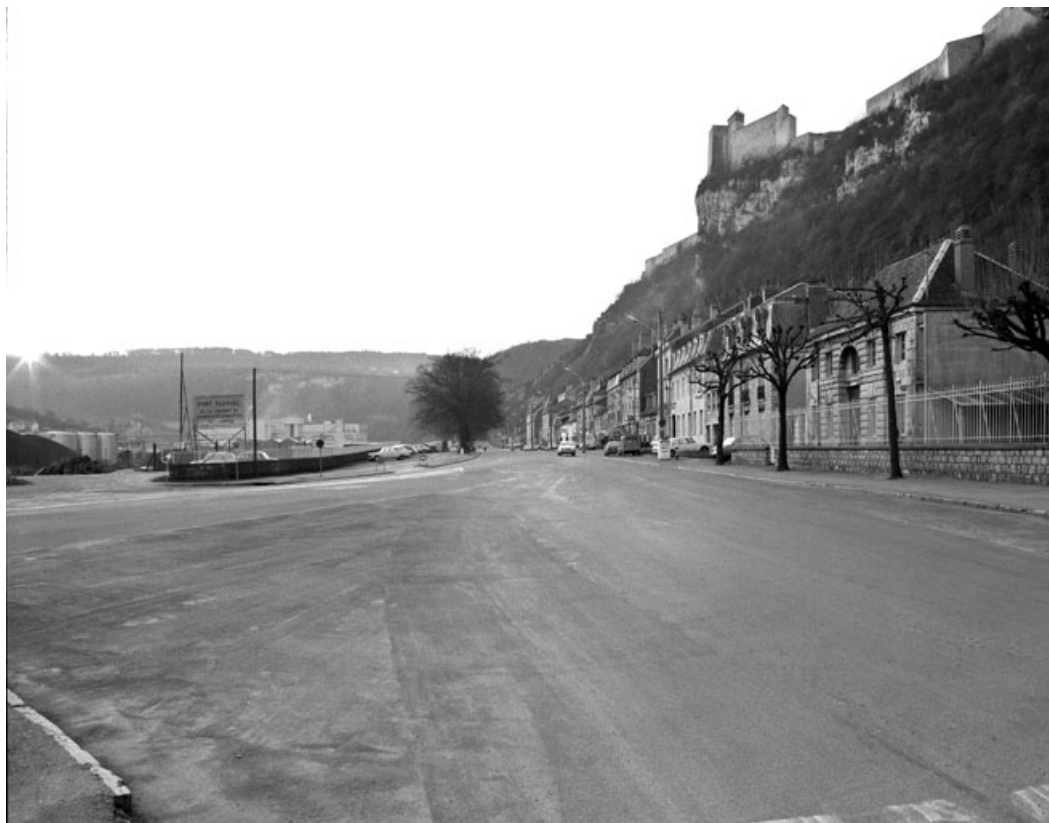
Le faubourg Rivotte depuis le nord (passage sous la voie ferrée) en 1975, avec à gauche l'extension du Port fluvial et à droite l'ancien magasin.

25, Besançon Faubourg Rivotte 2, lieudit : îlot Porte Rivotte