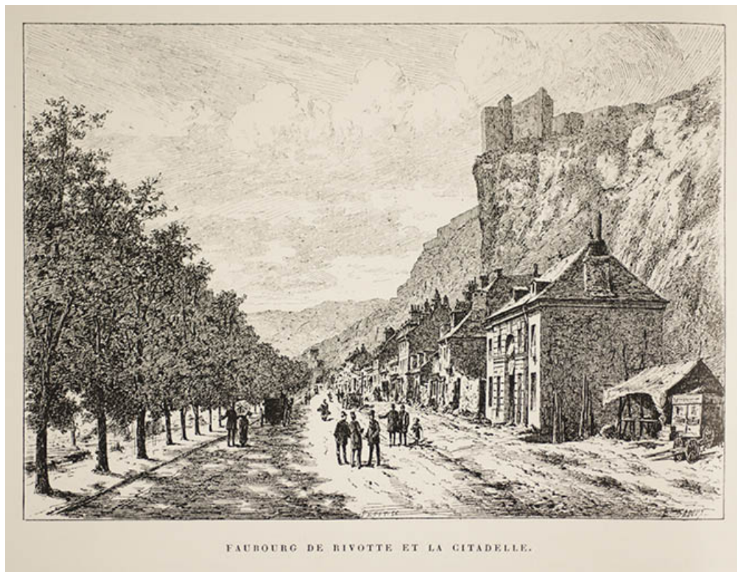
FAUBOURG DE RIVOTTE ET LA CITADELLE.