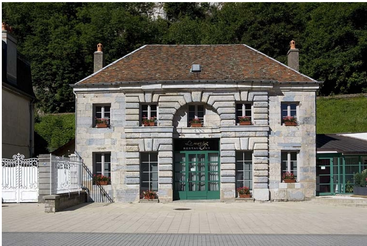
Vue d'ensemble, de face.