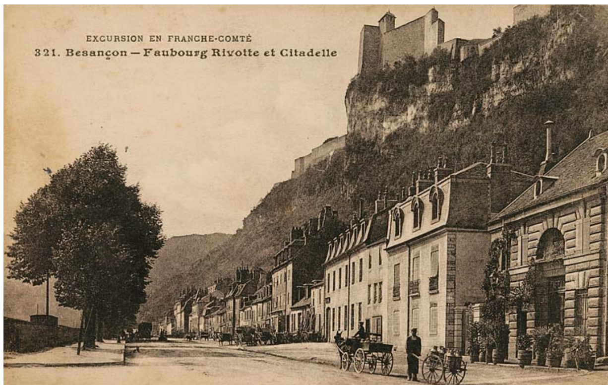
Excursion en Franche-Comté. 321. Besançon - Faubourg Rivotte et Citadelle, avant le 13 décembre 1916.

25, Besançon Faubourg Rivotte 2, lieudit : îlot Porte Rivotte