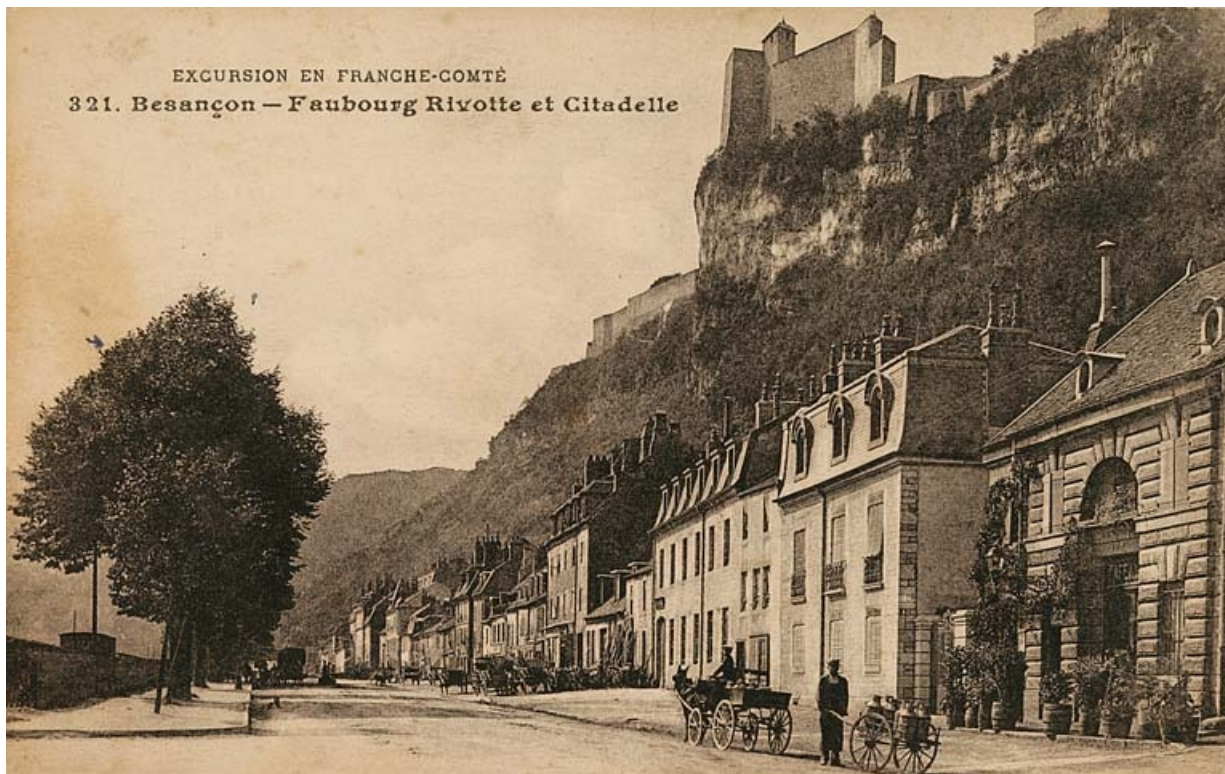
Excursion en Franche-Comté. 321. Besançon - Faubourg Rivotte et Citadelle, avant le 13 décembre 1916.

25, Besançon Faubourg Rivotte 2, lieudit : îlot Porte Rivotte