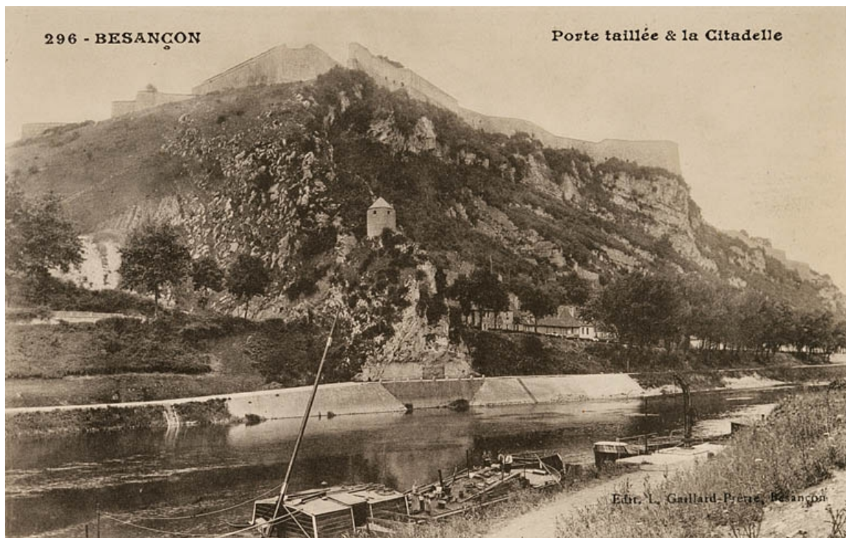
Besançon. Porte taillée & la Citadelle, 1ère moitié 20e siècle.