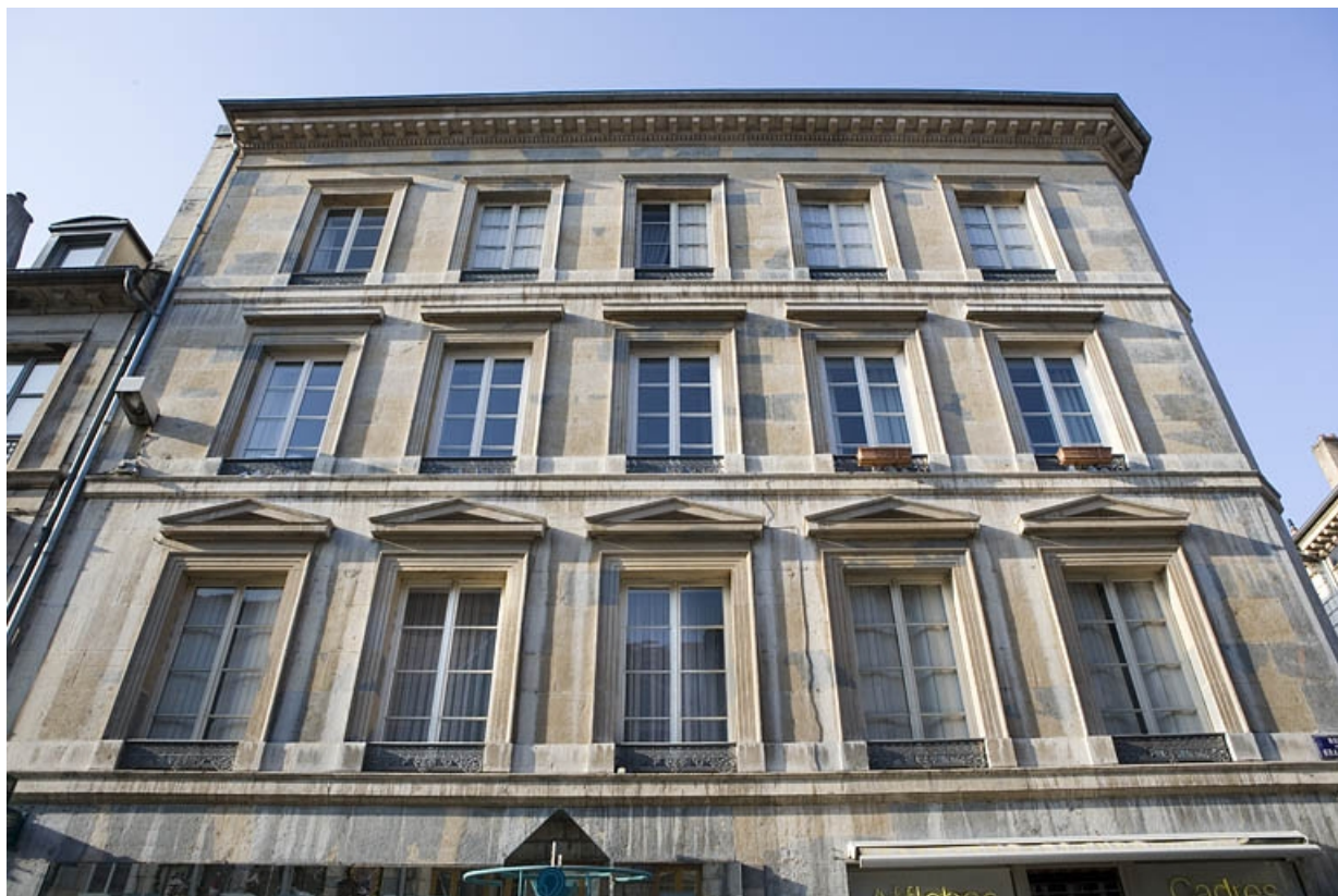
Détail de la façade située rue des Granges, de face.

25, Besançon, 12 rue Moncey, lieu-dit : îlot Forum