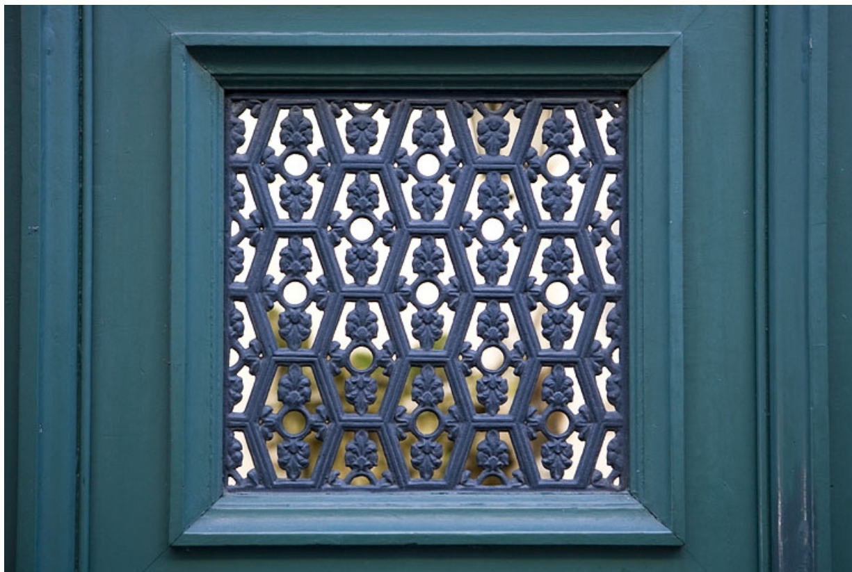
Portail d'entrée : détail du décor en fonte d'un vantaux de la porte.

25, Besançon, 12 rue Moncey, lieudit : îlot Forum