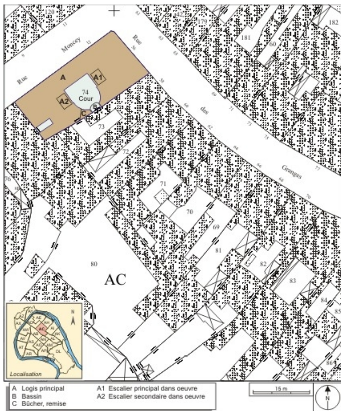
Plan masse et de situation. Extrait du plan cadastral, 1974, section AC. 25, Besançon, 12 rue Moncey, lieudit : îlot Forum