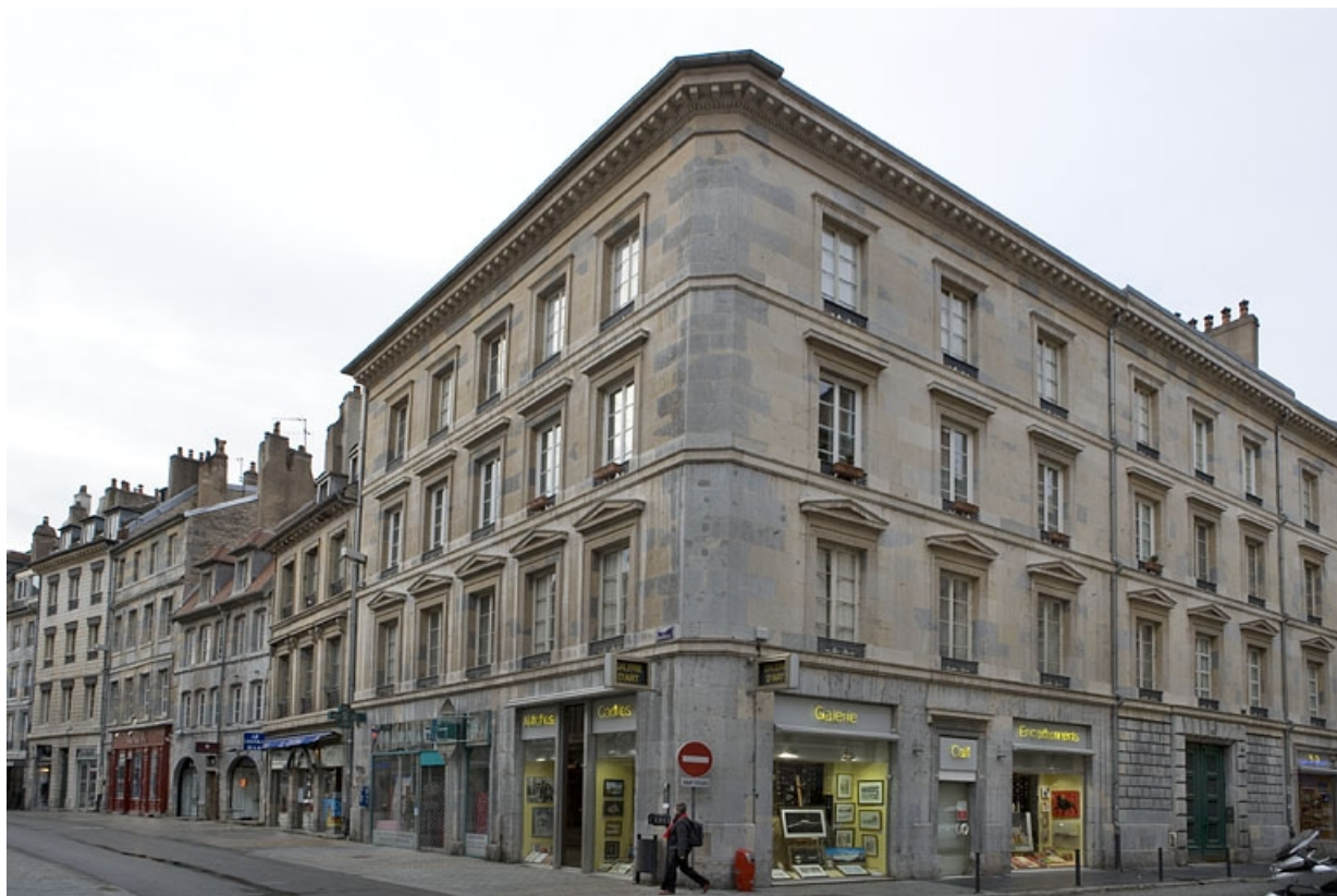
Vue d'ensemble de l'immeuble au carrefour des rues Moncey et des Granges.

25, Besançon, 12 rue Moncey, lieu-dit : îlot Forum