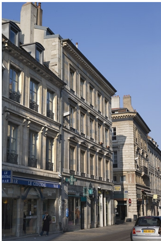
Vue d'ensemble de l'immeuble depuis la rue des Granges, de trois quarts gauche.

25, Besançon, 12 rue Moncey, lieu-dit : îlot Forum