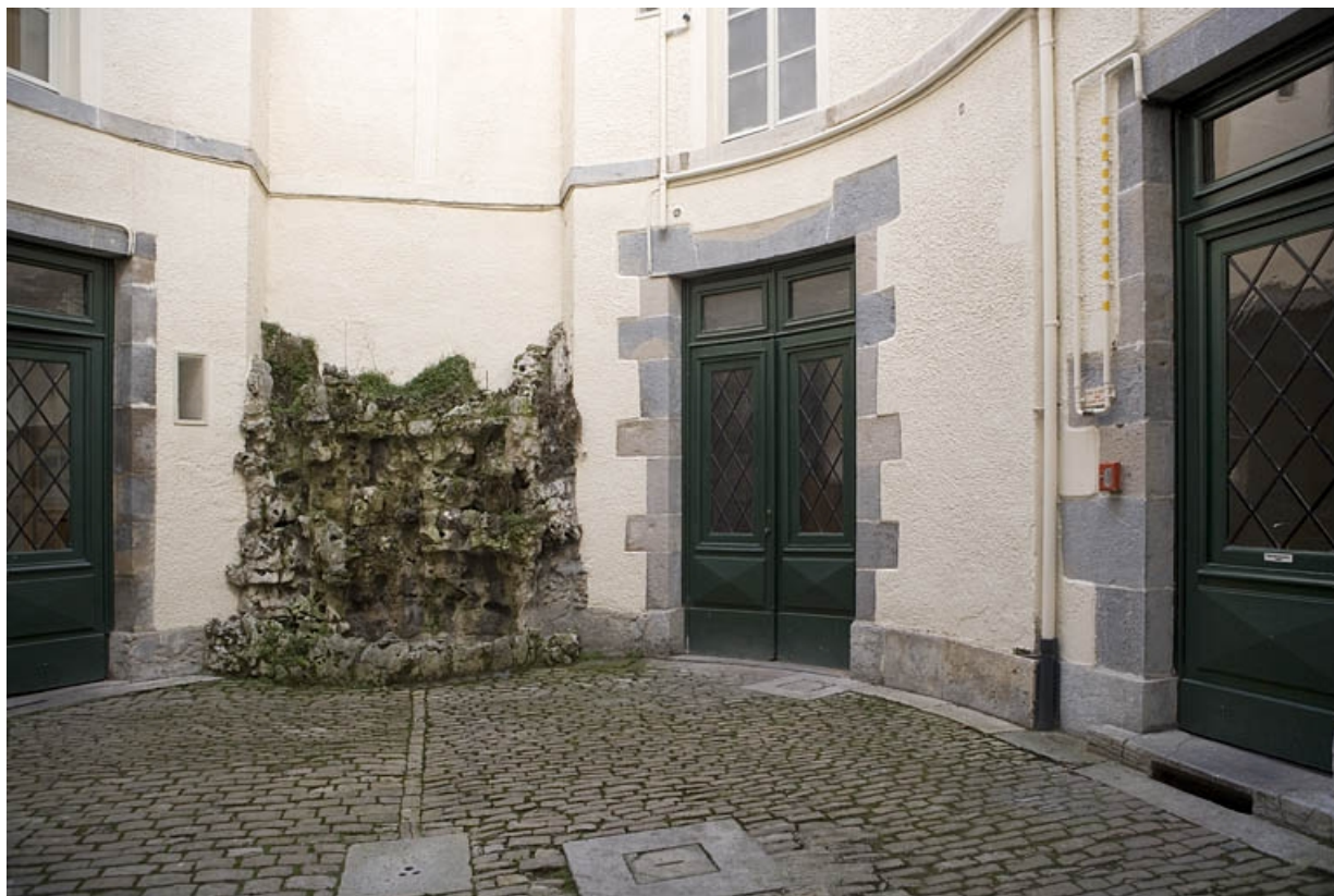
Vue du fond de la cour avec le bassin, depuis l'entrée.

25, Besançon, 12 rue Moncey, lieudit : îlot Forum