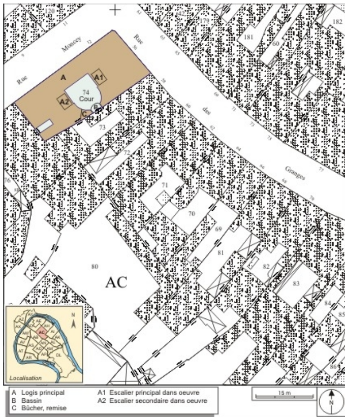
Plan masse et de situation. Extrait du plan cadastral, 1974, section AC. 25, Besançon, 12 rue Moncey, lieudit : îlot Forum