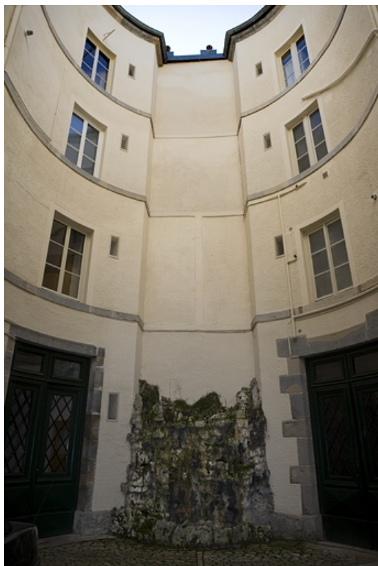
Vue des bâtiments situés au fond de la cour, depuis l'entrée.

25, Besançon, 12 rue Moncey, lieudit : îlot Forum