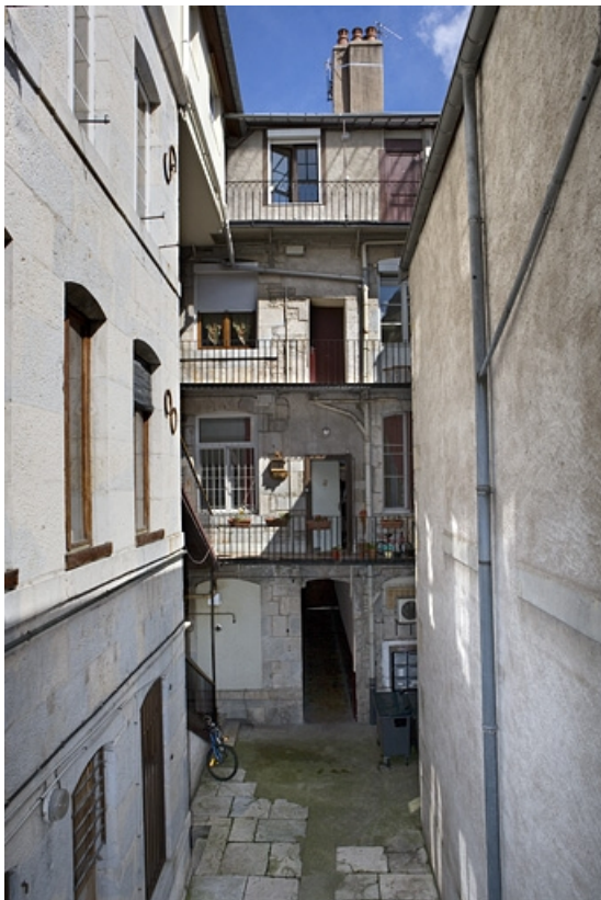
Vue d'ensemble de la façade postérieure du logis principal depuis le fond de la cour. 25, Besançon, 90 rue des Granges, lieudit : îlot Forum