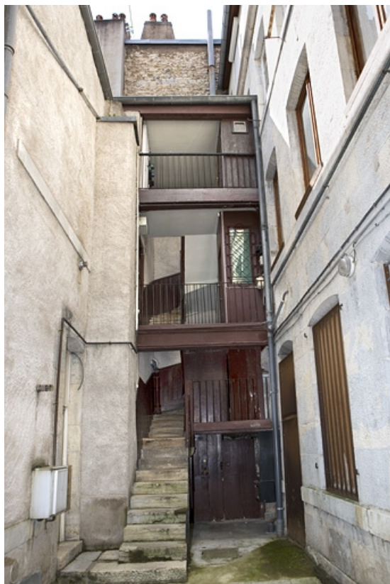
Vue d'ensemble des logis secondaires depuis l'entrée de la cour.

25, Besançon, 90 rue des Granges, lieudit : îlot Forum