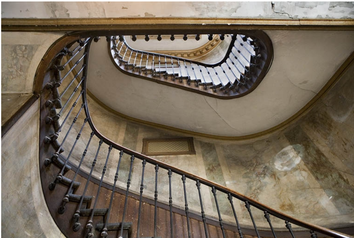
Vue d'ensemble de la cage de l'escalier principal depuis le bas.

25, Besançon, 88 rue des Granges, lieudit : îlot Forum