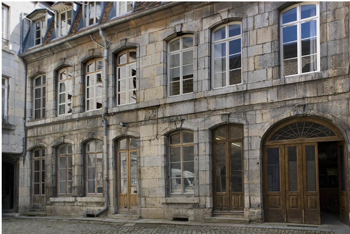
Vue d'ensemble de l'aile gauche sur cour.

25, Besançon, 88 rue des Granges, lieudit : îlot Forum