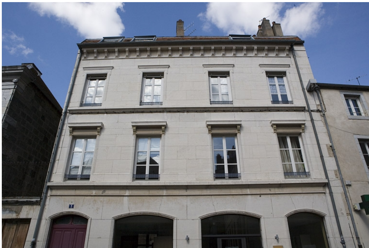
Vue d'ensemble du logis secondaire situé rue de la Bibliothèque, de face.

25, Besançon, 88 rue des Granges, lieudit : îlot Forum