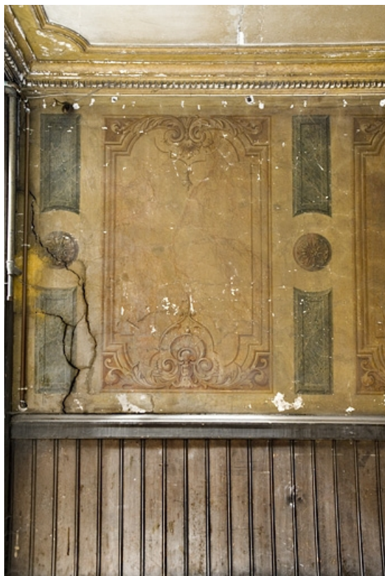
Peintures murales du passage cocher : détail du décor d'un panneau.

25, Besançon, 88 rue des Granges, lieudit : îlot Forum