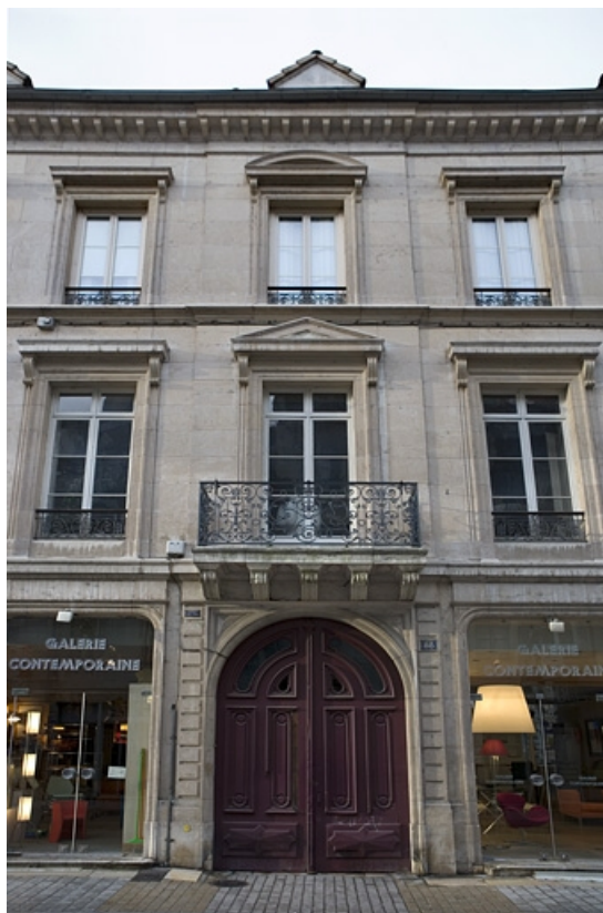
Vue rapprochée de la façade sur rue, de face.

25, Besançon, 88 rue des Granges, lieudit : îlot Forum