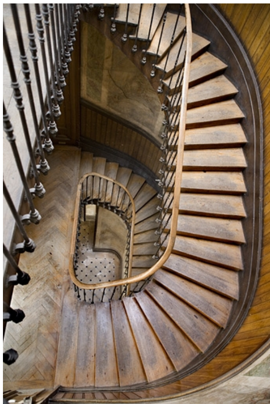
Vue d'ensemble de l'escalier principal depuis le dernier palier.

25, Besançon, 88 rue des Granges, lieudit : îlot Forum