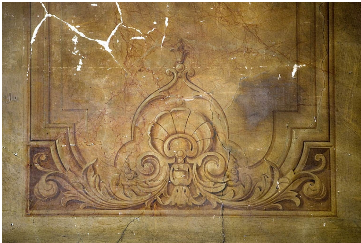
Peintures murales du passage cocher : détail du décor à la partie inférieure d'un panneau.

25, Besançon, 88 rue des Granges, lieu-dit : îlot Forum