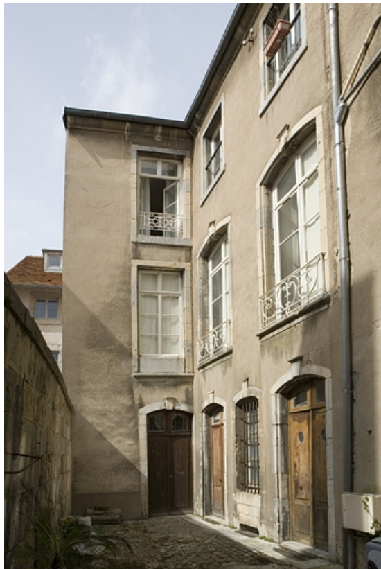
Vue d'ensemble de la cour secondaire donnant sur la rue de la Bibliothèque. 25, Besançon, 88 rue des Granges, lieudit : îlot Forum