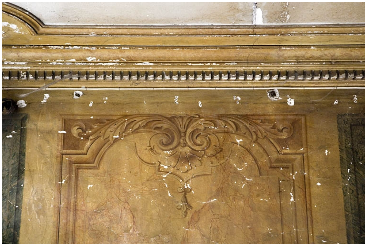
Peintures murales du passage cocher : détail du décor à la partie supérieure d'un panneau.

25, Besançon, 88 rue des Granges, lieudit : îlot Forum