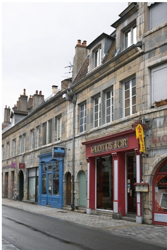
Vue d'ensemble depuis la rue de trois quarts droit. 25, Besançon, 80 rue des Granges, lieudit : îlot Forum