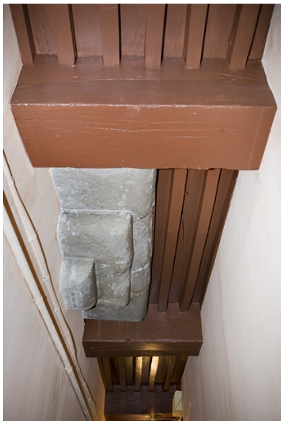
Détail de l'encorbellement en pierre de taille situé dans le premier couloir.

25, Besançon, 80 rue des Granges, lieudit : îlot Forum