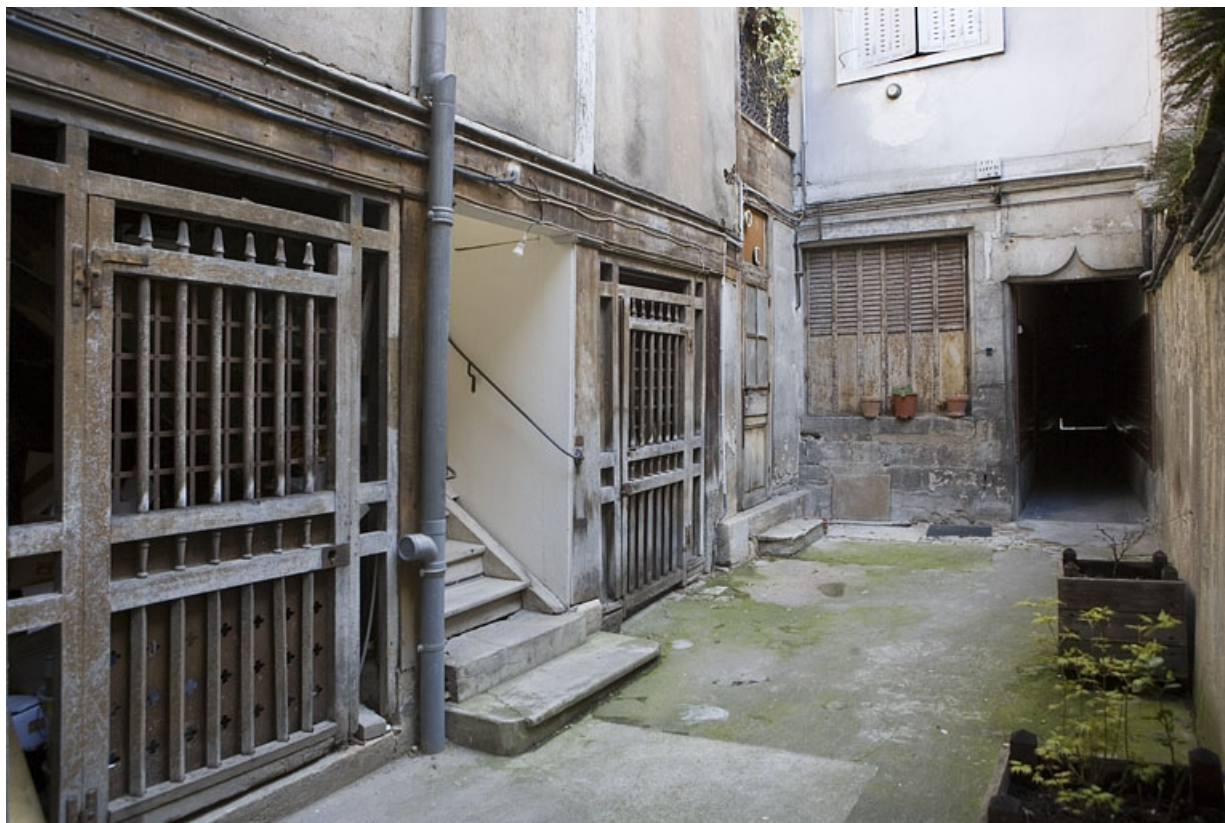
Détail des bûchers et du rez-de-chaussée de la façade postérieure du logis principal.

25, Besançon, 80 rue des Granges, lieudit : îlot Forum