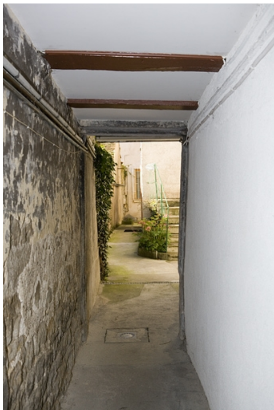
Détail du couloir à gauche du logis secondaire donnant accès à la deuxième cour. 25, Besançon, 80 rue des Granges, lieudit : îlot Forum