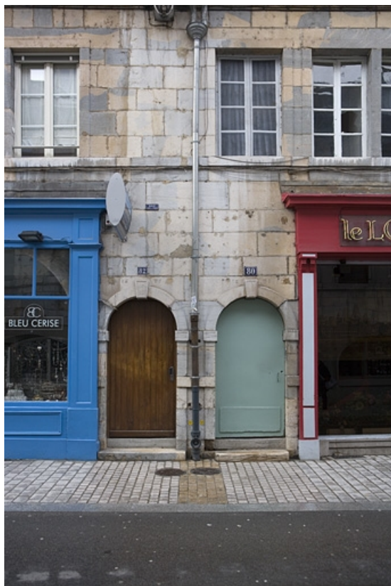
Façade sur rue : détail de la porte d'entrée du couloir.

25, Besançon, 80 rue des Granges, lieudit : îlot Forum