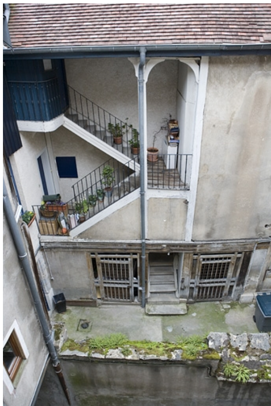
Vue plongeante sur l'escalier à cage ouverte depuis la parcelle voisine.

25, Besançon, 80 rue des Granges, lieu-dit : îlot Forum