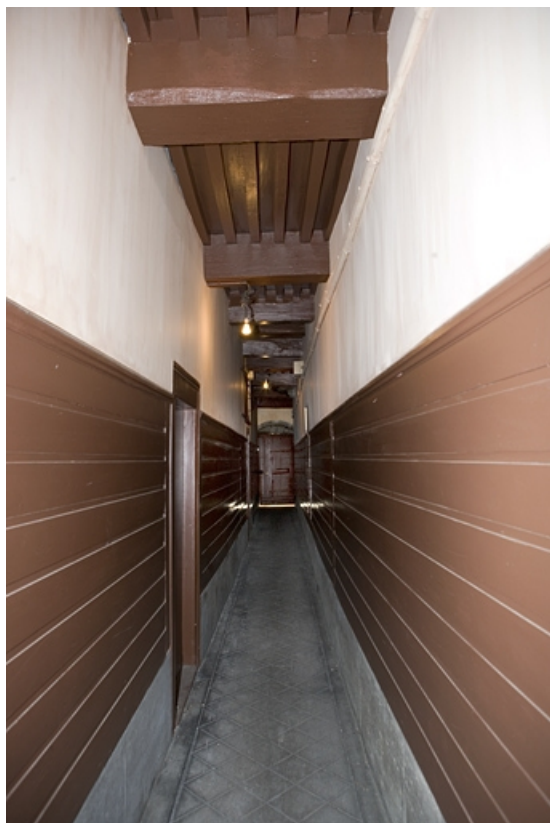
Détail du couloir à gauche du logis principal donnant accès à la première cour. 25, Besançon, 80 rue des Granges, lieudit : îlot Forum