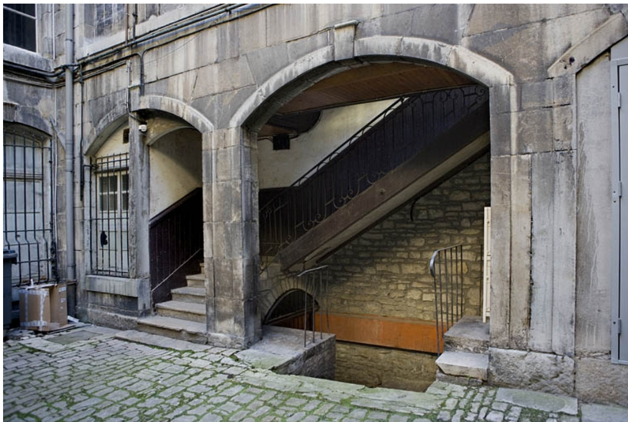
Détail des arcades situées au rez-de-chaussée de l'aile gauche dans la première cour.

25, Besançon, 72 rue des Granges, lieudit : îlot Forum