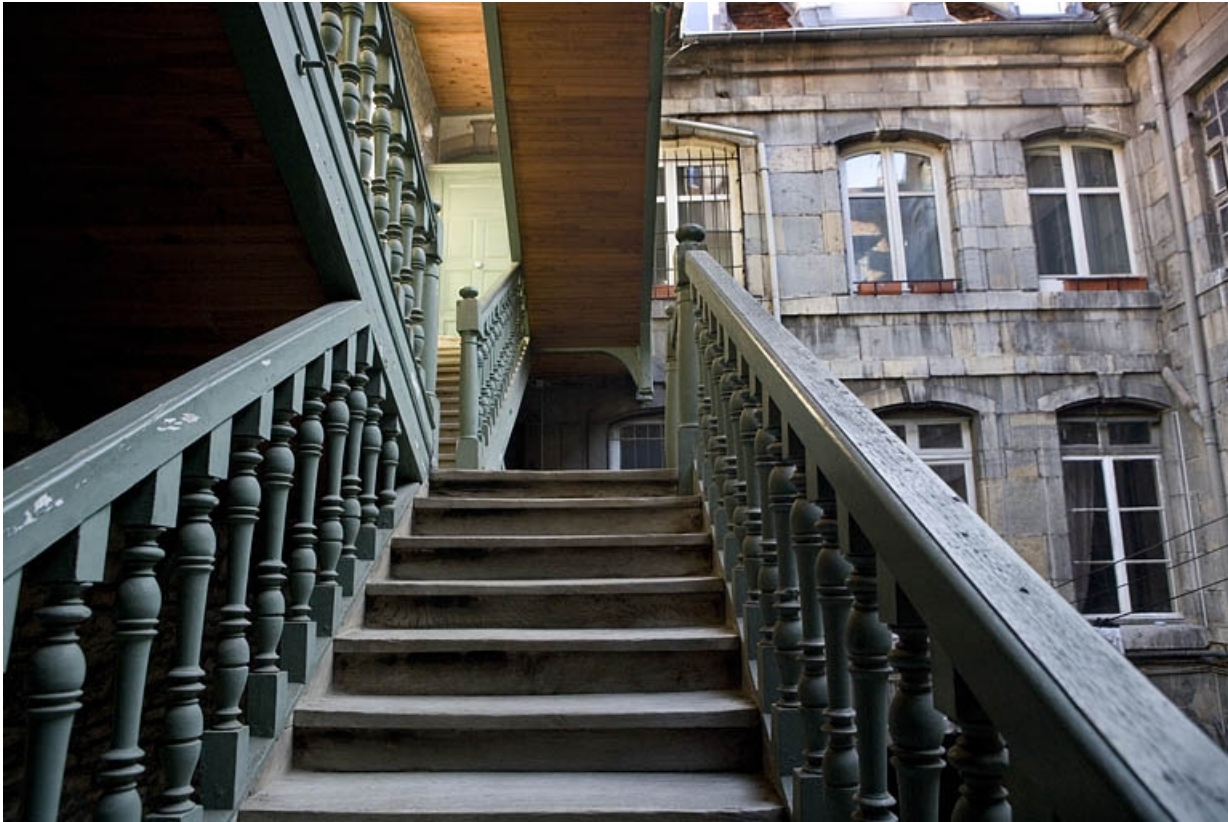
Détail de l'intérieur de l'escalier à cage ouverte.

25, Besançon, 72 rue des Granges, lieudit : îlot Forum