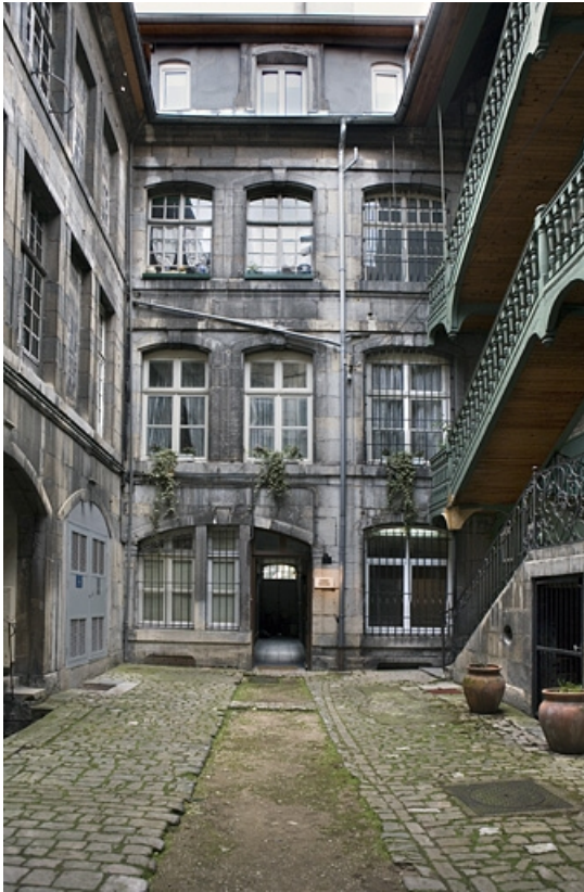
Vue d'ensemble de la façade antérieure du logis secondaire.

25, Besançon, 72 rue des Granges, lieudit : îlot Forum