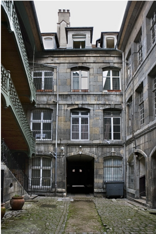
Vue d'ensemble de la façade postérieure du logis principal.

25, Besançon, 72 rue des Granges, lieudit : îlot Forum