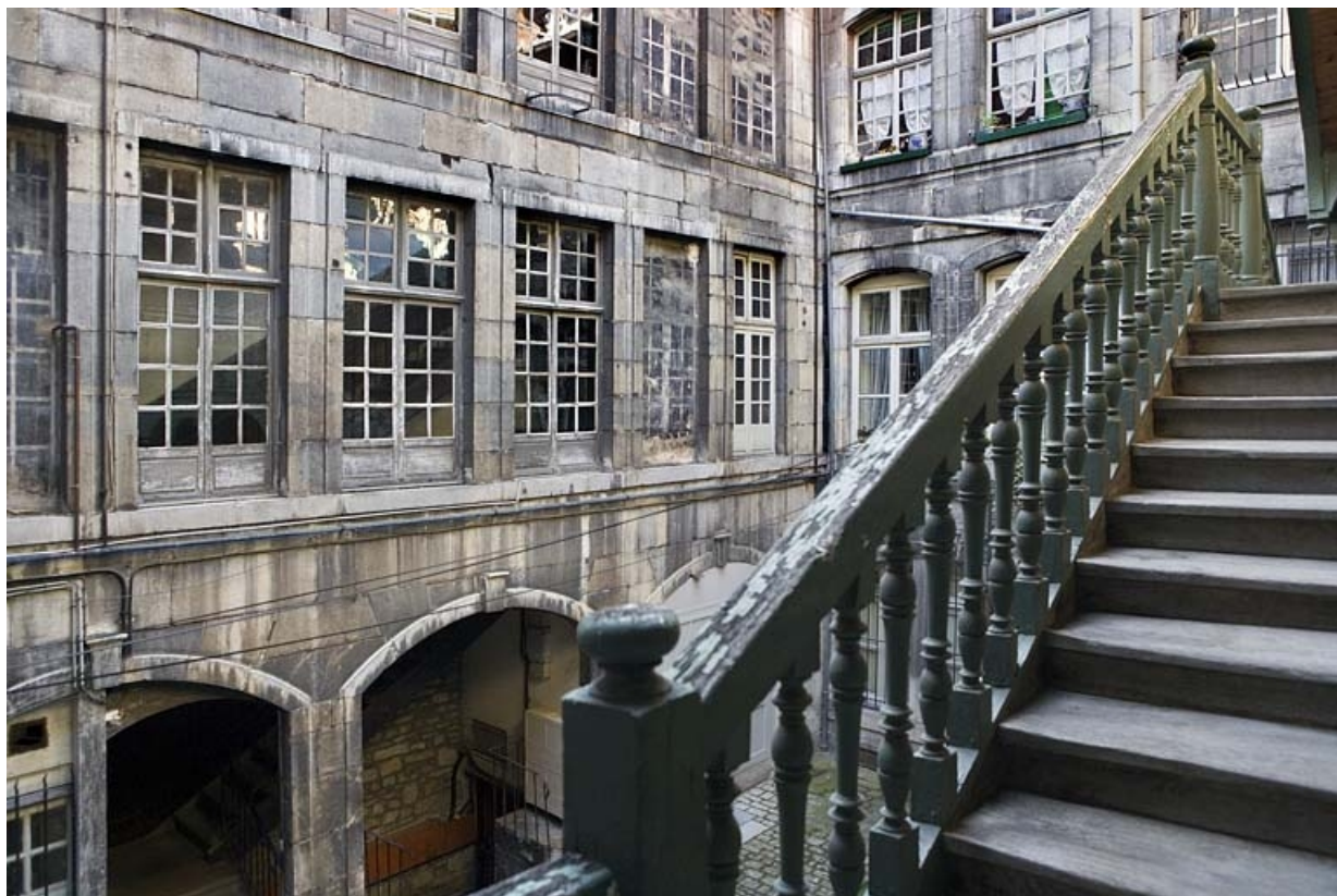
Aile gauche dans la première cour : détail du rez-de-chaussée et du premier étage.

25, Besançon, 72 rue des Granges, lieudit : îlot Forum