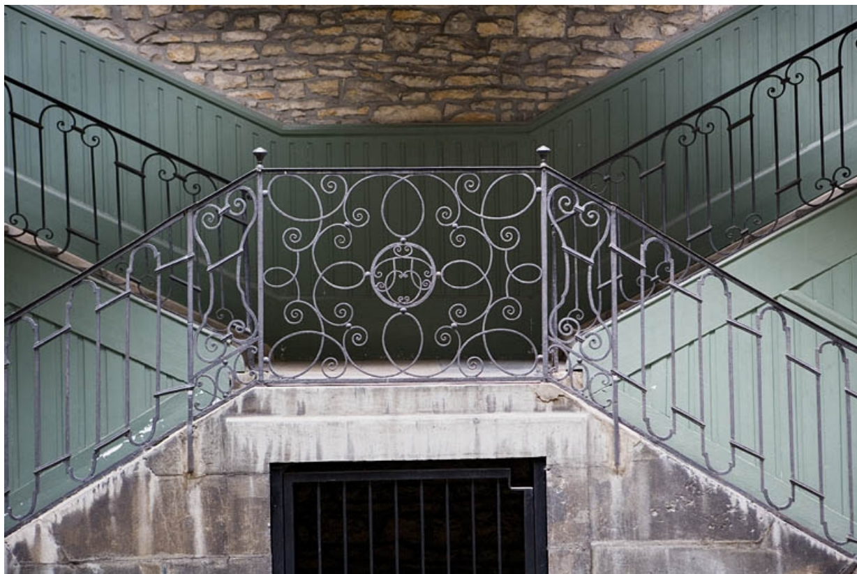
Escalier à cage ouverte à droite de la première cour : détail de la grille en ferronnerie.

25, Besançon, 72 rue des Granges, lieudit : îlot Forum