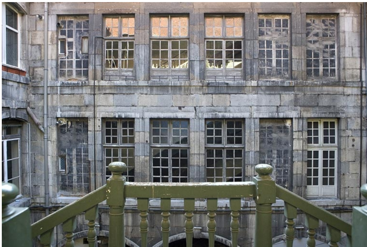
Aile gauche dans la première cour : détail des étages au-dessus du rez-de-chaussée.

25, Besançon, 72 rue des Granges, lieudit : îlot Forum