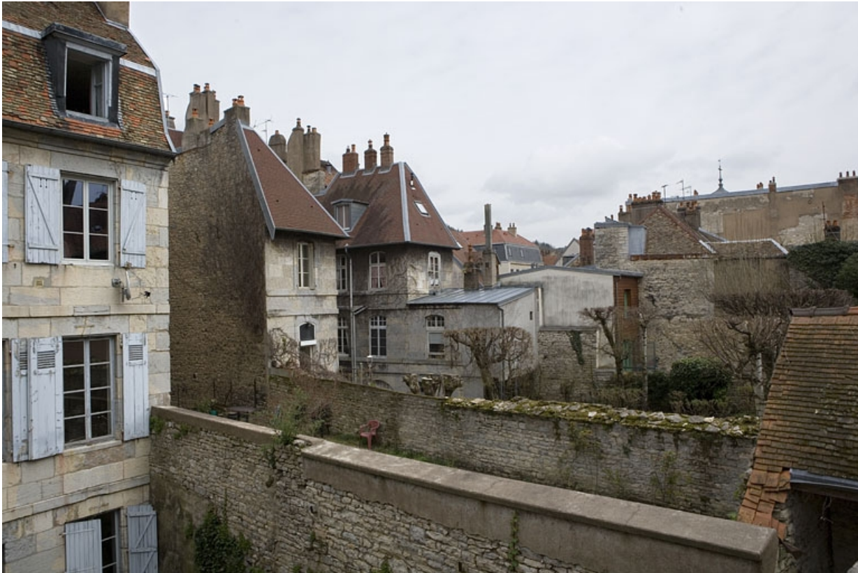
Vue éloignée de la façade postérieure du logis secondaire.

25, Besançon, 72 rue des Granges, lieudit : îlot Forum