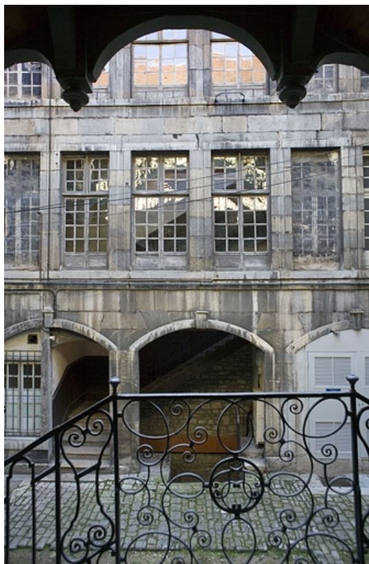
Aile gauche dans la première cour depuis le premier repos de l'escalier à cage ouverte.

25, Besançon, 72 rue des Granges, lieudit : îlot Forum