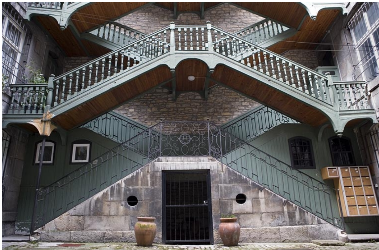
Escalier à cage ouverte à droite de la première cour : vue d'ensemble, de face, des premières volées en maçonnerie. 25, Besançon, 72 rue des Granges, lieu dit : îlot Forum