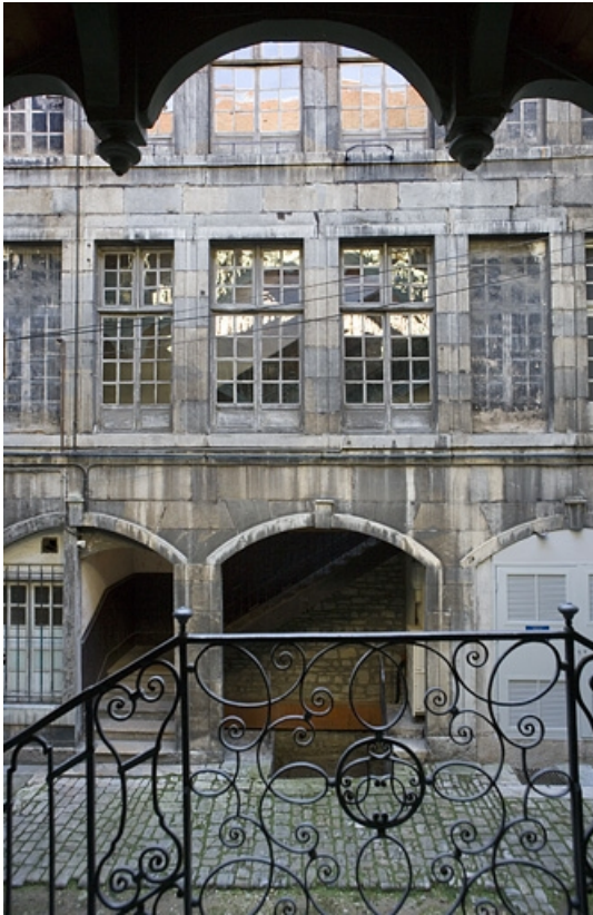
Aile gauche dans la première cour depuis le premier repos de l'escalier à cage ouverte.

25, Besançon, 72 rue des Granges, lieudit : îlot Forum