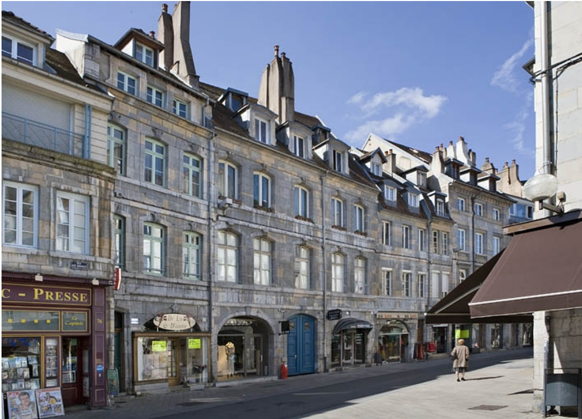
Vue éloignée de la maison dans l'alignement de la rue.

25, Besançon, 72 rue des Granges, lieudit : îlot Forum