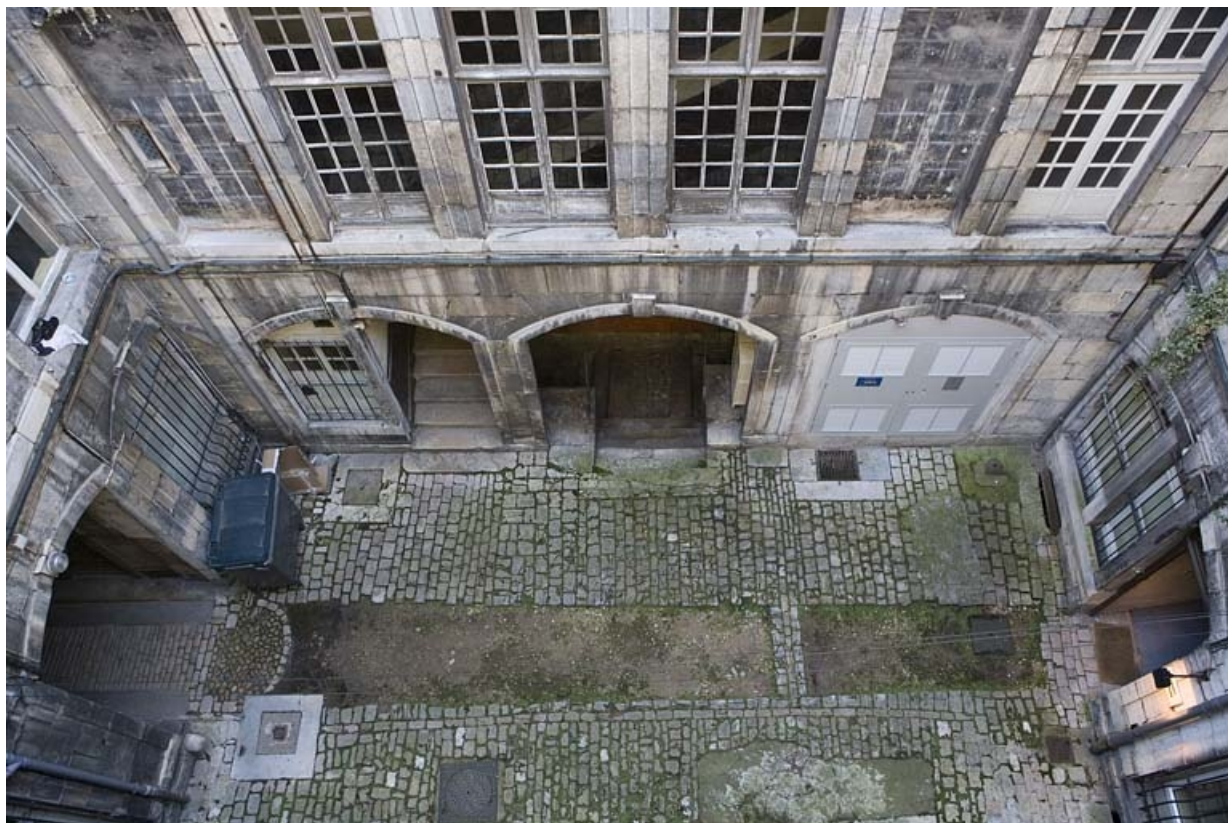
Aile gauche dans la première cour : détail du rez-de-chaussée, vue en plongée.

25, Besançon, 72 rue des Granges, lieudit : îlot Forum