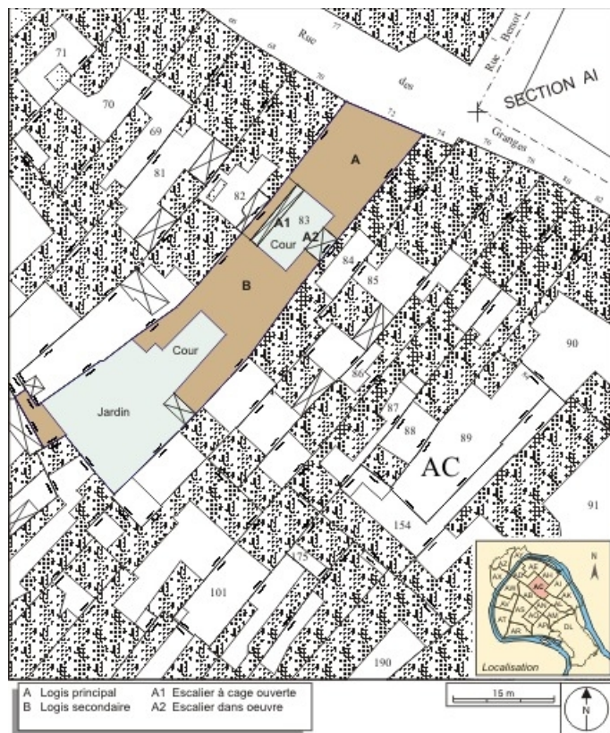
Plan masse et de situation. Extrait du plan cadastral, 1974, section AC. 25, Besançon, 72 rue des Granges, lieudit : îlot Forum