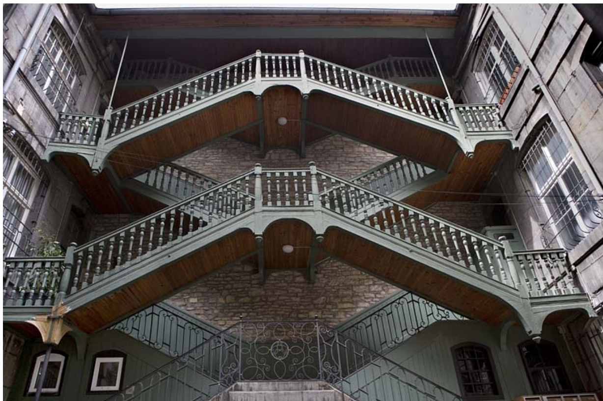
Escalier à cage ouverte à droite de la première cour : vue d'ensemble, de face, des volées suspendues en charpente. 25, Besançon, 72 rue des Granges, lieudit : îlot Forum