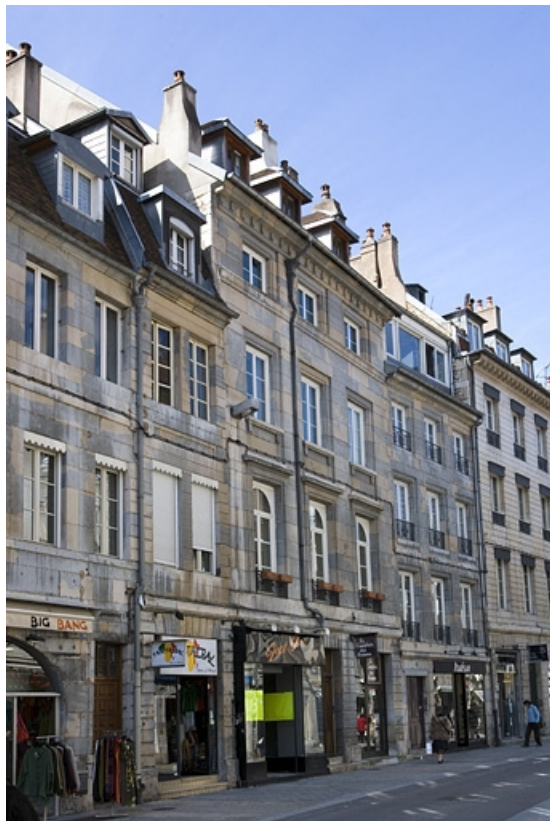
Vue d'ensemble de la façade sur rue de trois quarts gauche.

25, Besançon, 68 rue des Granges, lieudit : îlot Forum