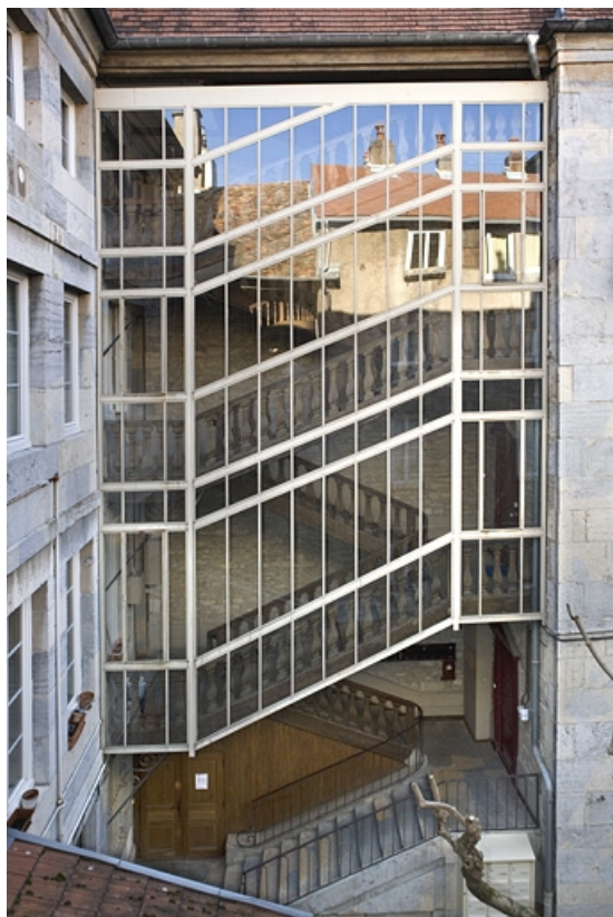
Vue d'ensemble premier escalier à cage ouverte, de face.

25, Besançon, 68 rue des Granges, lieudit : îlot Forum