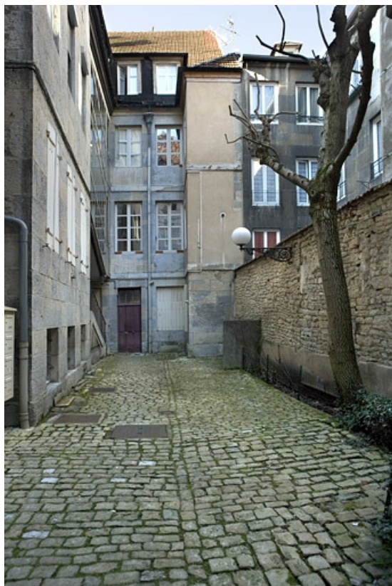
Vue d'ensemble de la façade antérieure du logis secondaire.

25, Besançon, 68 rue des Granges, lieudit : îlot Forum