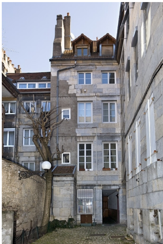
Vue d'ensemble de la façade postérieure du logis principal.

25, Besançon, 68 rue des Granges, lieudit : îlot Forum