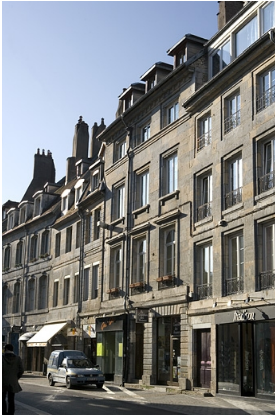
Vue éloignée de la maison dans l'alignement de la rue.

25, Besançon, 68 rue des Granges, lieudit : îlot Forum