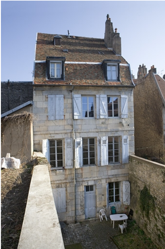
Vue d'ensemble de la façade postérieure du logis secondaire.

25, Besançon, 68 rue des Granges, lieudit : îlot Forum