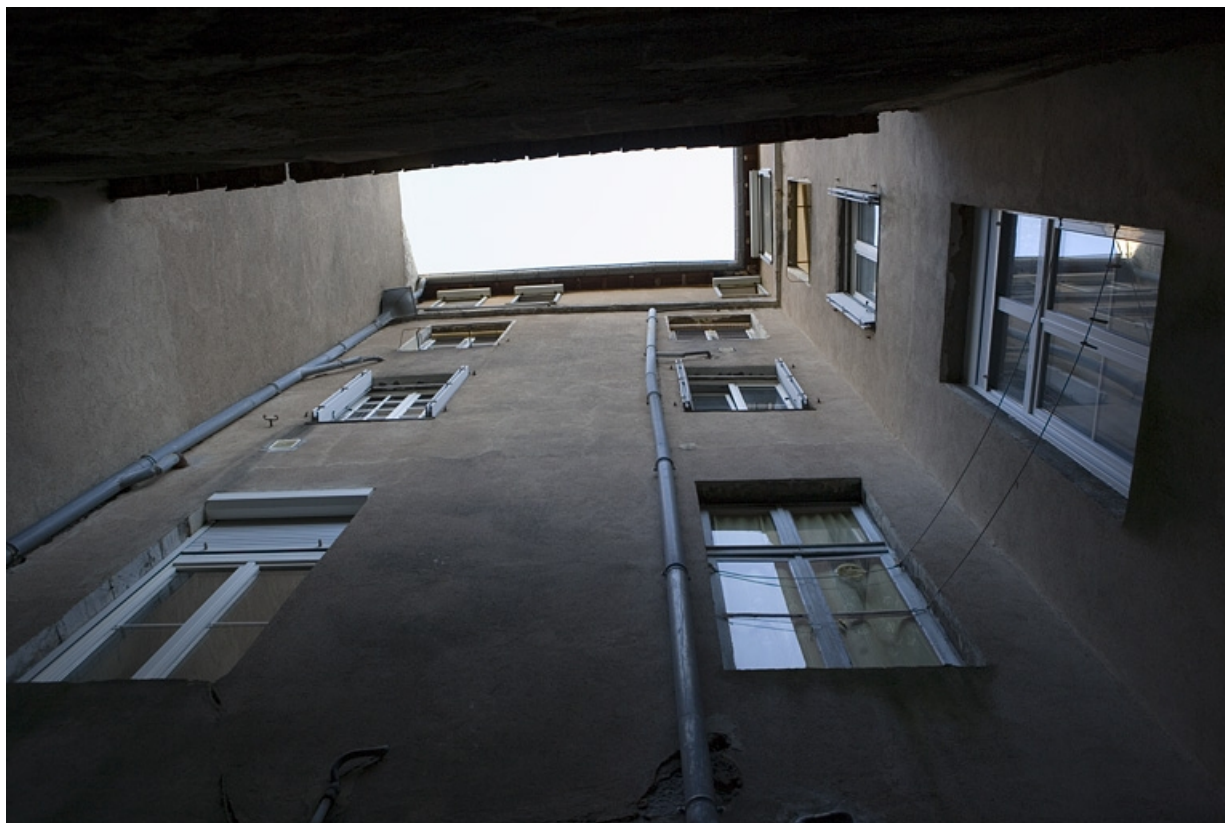
Vue des bâtiments en contre-plongée situés dans la deuxième cour.

25, Besançon, 64 rue des Granges, lieudit : îlot Forum