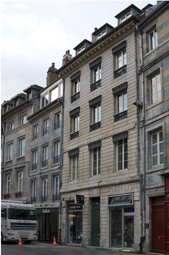
Façade sur rue, de trois quarts droit.

25, Besançon, 64 rue des Granges, lieudit : îlot Forum