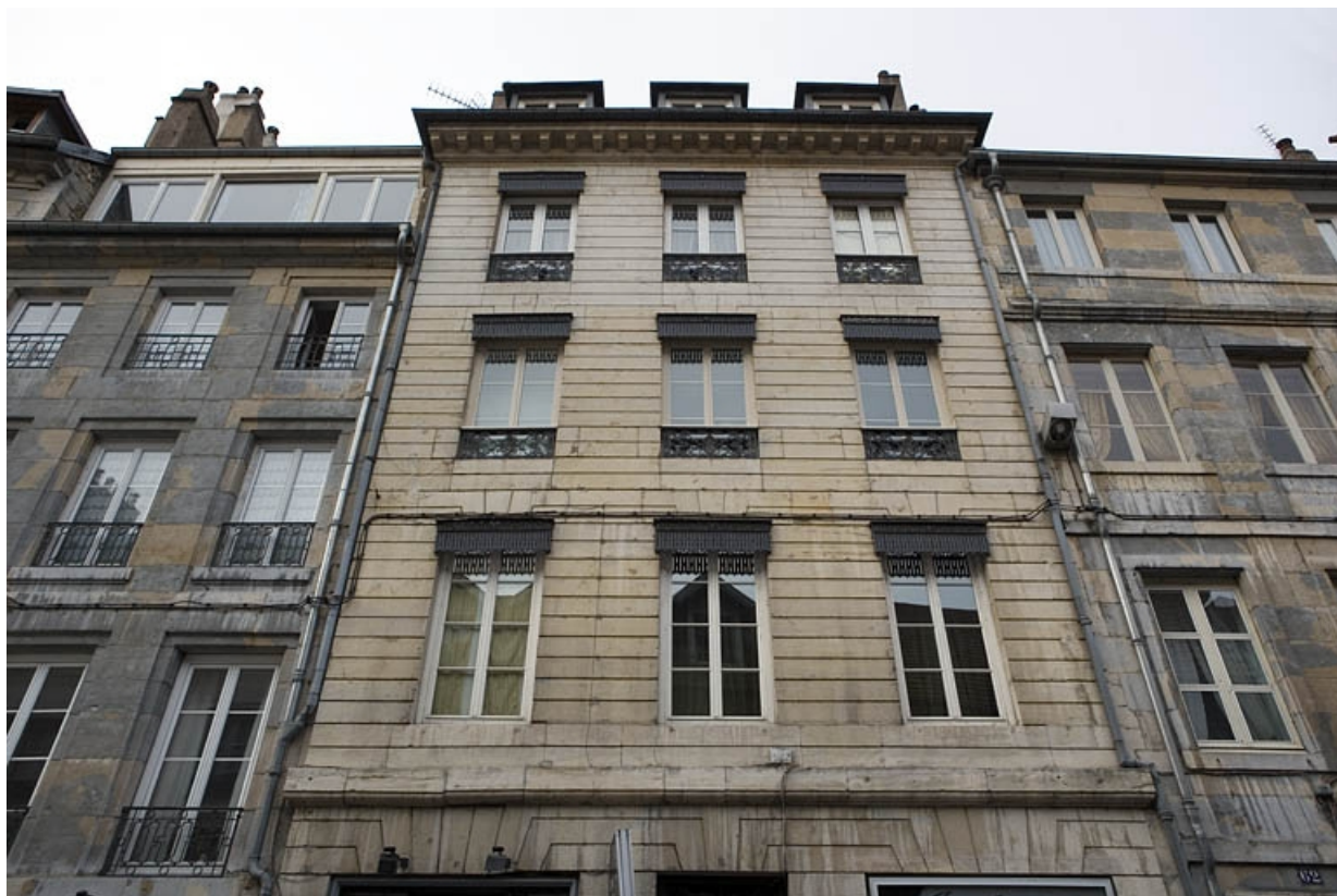
Détail de la façade sur rue au-dessus du rez-de-chaussée.

25, Besançon, 64 rue des Granges, lieudit : îlot Forum