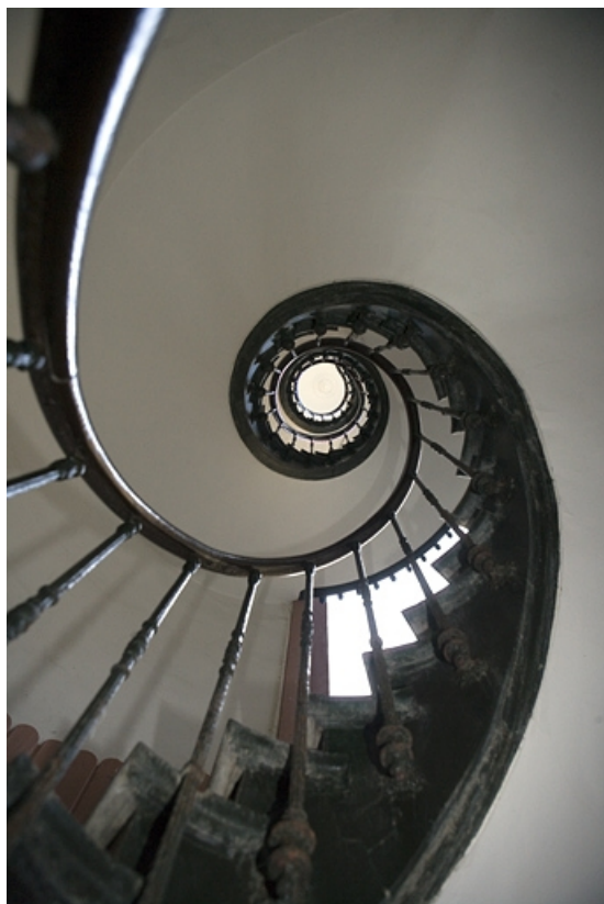
Détail de l'intérieur de l'escalier à cage ouverte.

25, Besançon, 64 rue des Granges, lieu-dit : îlot Forum