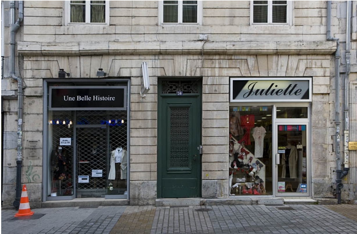
Détail du rez-de-chaussée de la façade sur rue.

25, Besançon, 64 rue des Granges, lieudit : îlot Forum