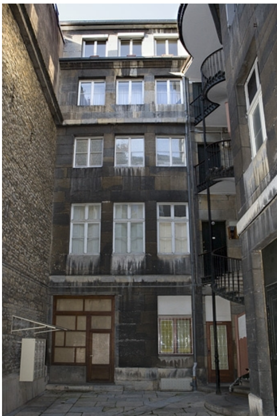
Vue d'ensemble de la façade antérieure du logis secondaire.

25, Besançon, 64 rue des Granges, lieudit : îlot Forum