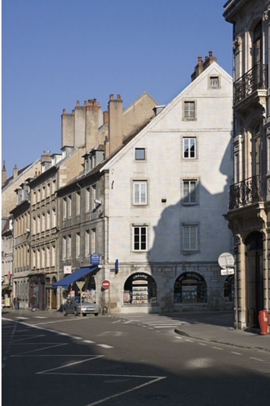
Vue d'ensemble du logis principal de trois quarts droit.

25, Besançon Grande Rue 119, lieudit : îlot Forum