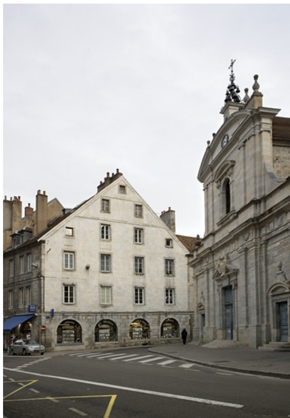
Vue d'ensemble de la façade latérale du logis principal de trois quarts droit. 25, Besançon Grande Rue 119, lieudit : îlot Forum