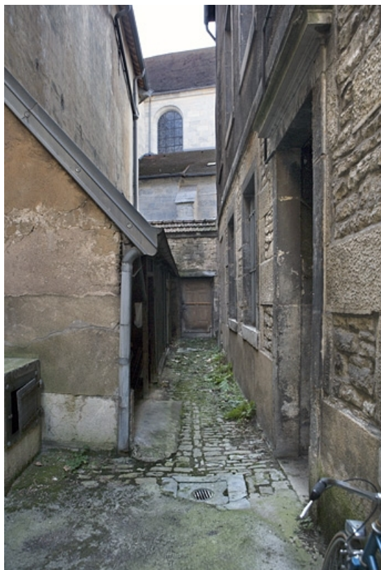
Détail des bâtiments autour de la deuxième cour. 25, Besançon Grande Rue 119, lieudit : îlot Forum