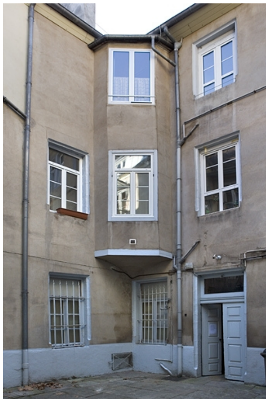
Détail des façades depuis le fond de la première cour.

25, Besançon Grande Rue 119, lieudit : îlot Forum