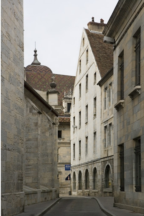
Vue d'ensemble de la façade sur pignon du logis principal depuis la rue de la Bibliothèque. 25, Besançon Grande Rue 119, lieudit : îlot Forum