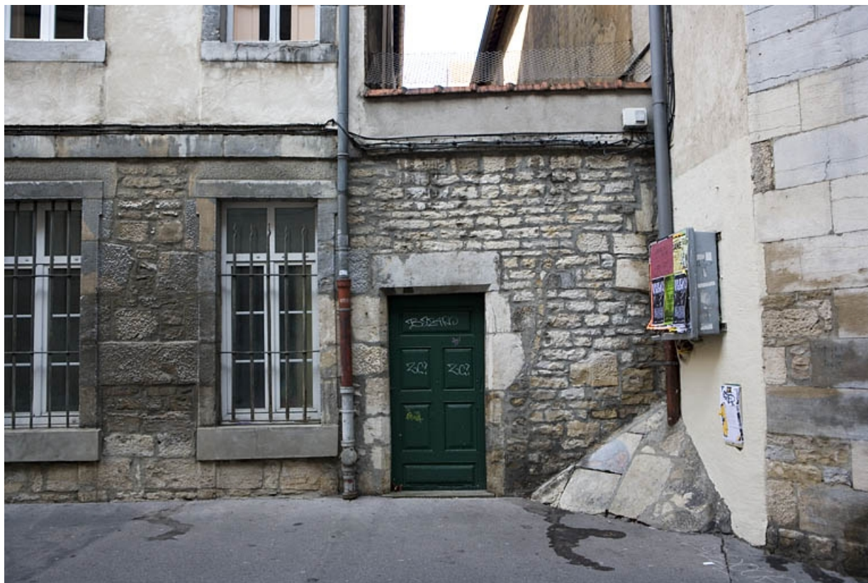
Détail de la porte secondaire située rue de la Bibliothèque.

25, Besançon Grande Rue 119, lieudit : îlot Forum