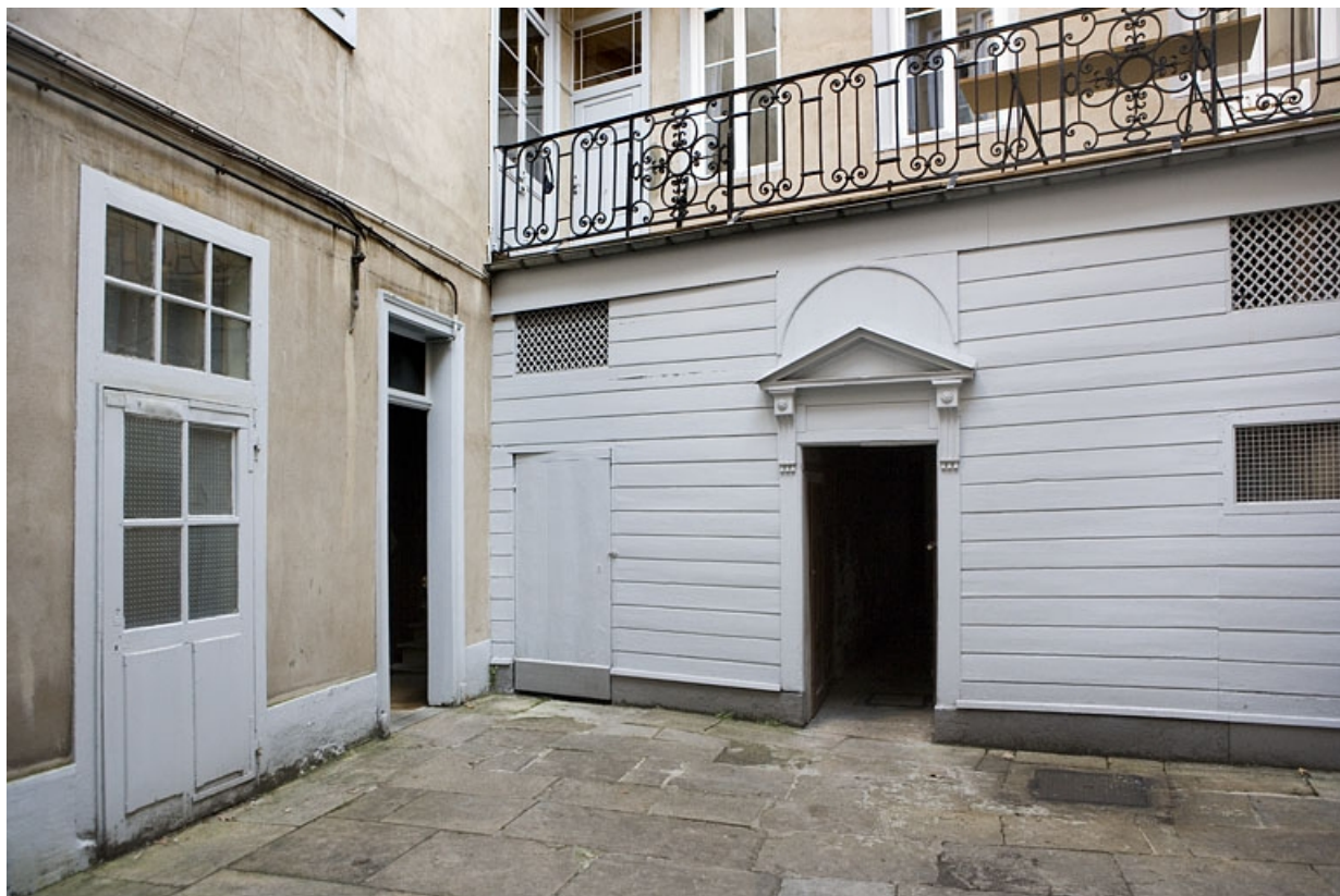
Vue du rez-de-chaussée des bâtiments au fond de la première cour : de trois quarts gauche.

25, Besançon Grande Rue 119, lieudit : îlot Forum