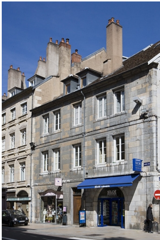
Vue d'ensemble de la façade principale du logis sur rue de trois quarts droit. 25, Besançon Grande Rue 119, lieudit : îlot Forum