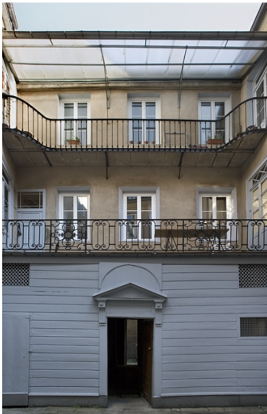
Première cour : détail de la façade principale du logis secondaire.

25, Besançon Grande Rue 119, lieudit : îlot Forum