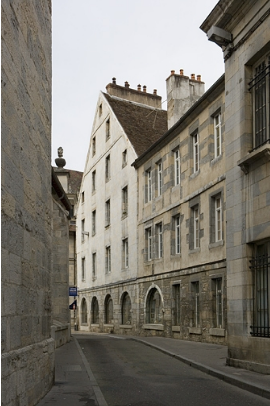
Détail de la façade latérale du logis principal et du logis secondaire depuis la rue de la Bibliothèque. 25, Besançon Grande Rue 119, lieudit : îlot Forum