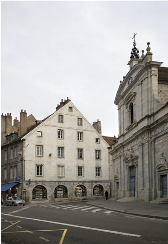
Vue d'ensemble de la façade latérale du logis principal de trois quarts droit.

25, Besançon Grande Rue 119, lieudit : îlot Forum