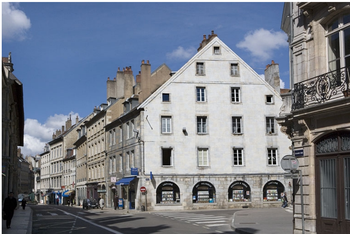
Vue d'ensemble du logis principal de trois quarts droit.

25, Besançon Grande Rue 119, lieudit : îlot Forum