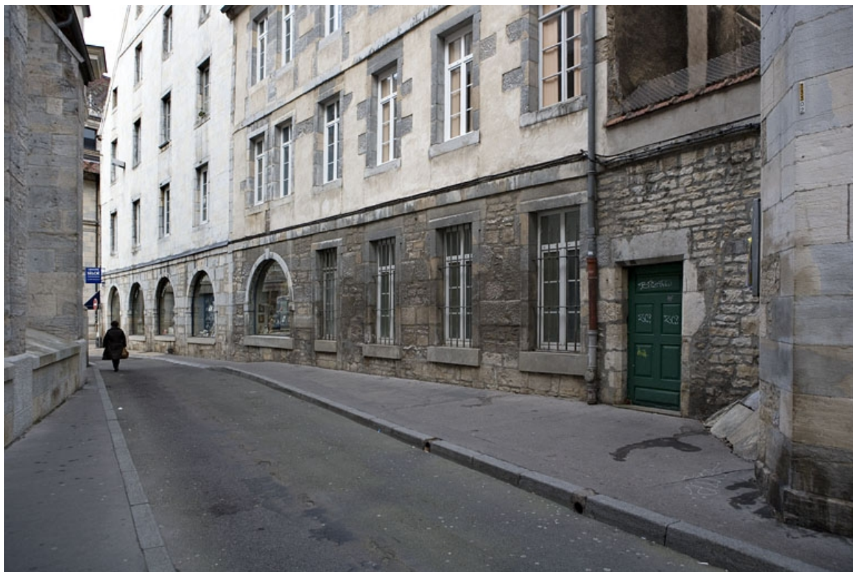
Détail des rez-de-chaussée de la façade latérale du logis principal et du logis secondaire depuis la rue de la Bibliothèque. 25, Besançon Grande Rue 119, lieudit : îlot Forum