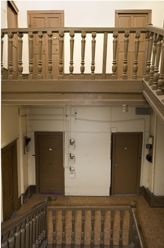
Détail de la rampe de l'escalier.

25, Besançon Grande Rue 119, lieudit : îlot Forum