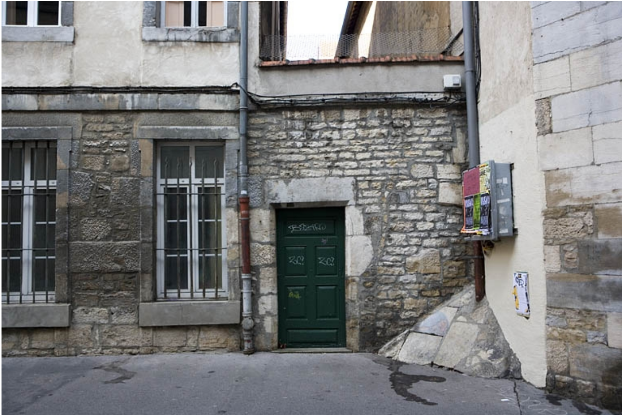
Détail de la porte secondaire située rue de la Bibliothèque.

25, Besançon Grande Rue 119, lieudit : îlot Forum