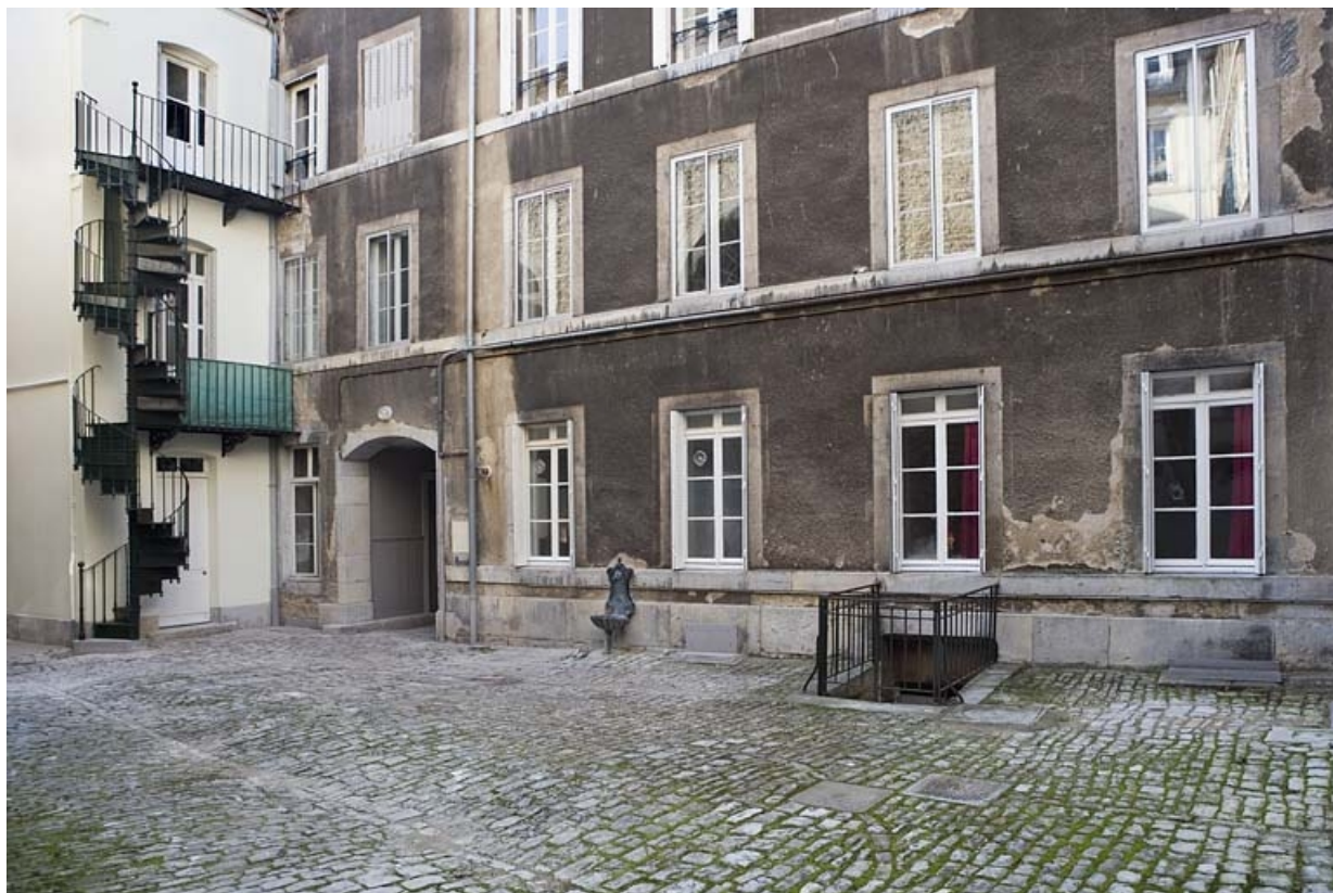
Deuxième cour : vue de la façade postérieure du logis secondaire, de trois quarts droit.

25, Besançon Grande Rue 117, lieudit : îlot Forum