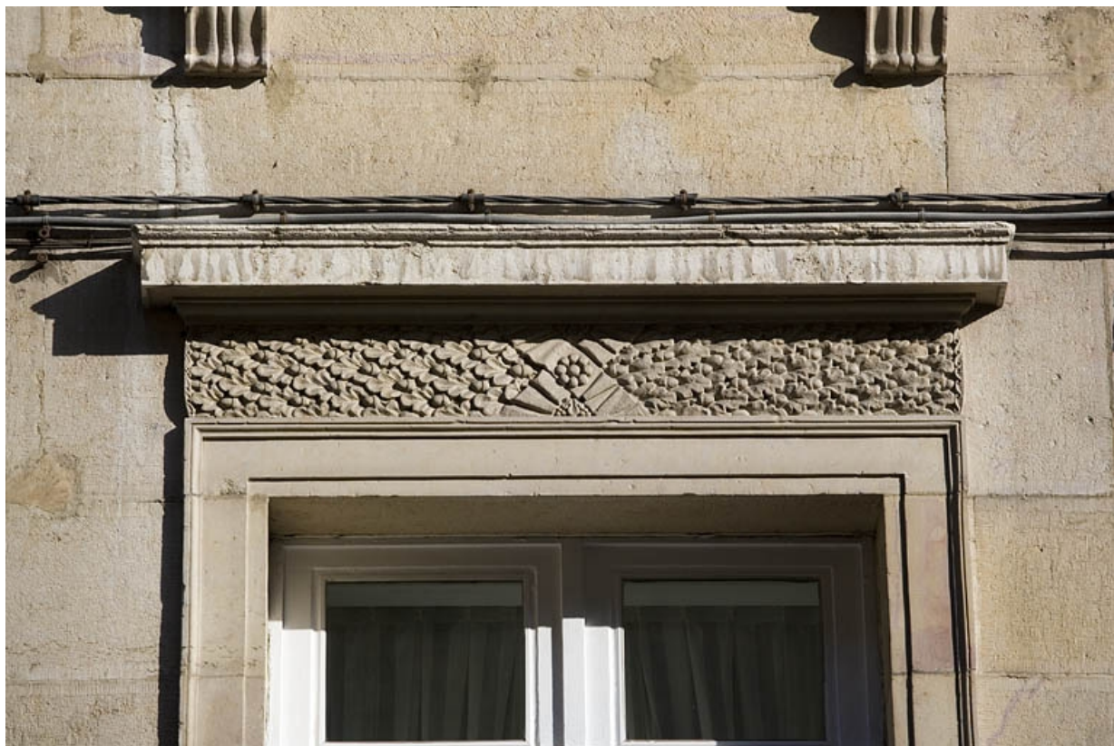
Détail d'un décor sculpté au-dessus d'une fenêtre du premier étage.

25, Besançon Grande Rue 117, lieudit : îlot Forum