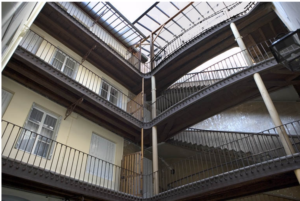
Première cour : vue de l'escalier à cage ouverte et des coursières sur la façade postérieure du logis principal.

25, Besançon Grande Rue 117, lieudit : îlot Forum