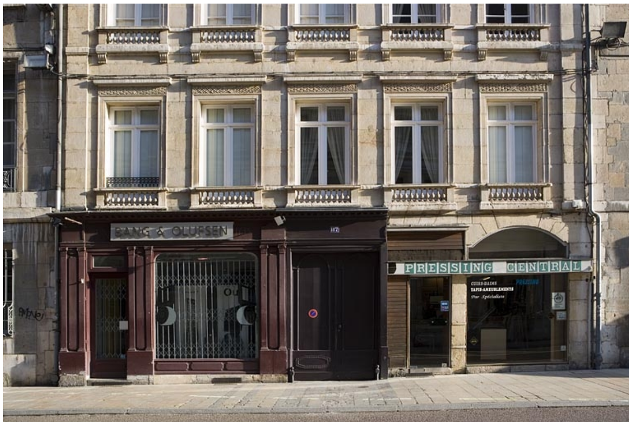
Logis principal, façade sur rue : détail du rez-de-chaussée.

25, Besançon Grande Rue 117, lieudit : îlot Forum