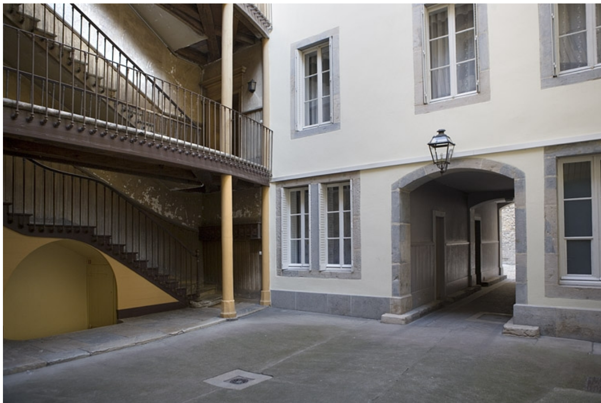
Première cour : vue de trois quarts droit avec le départ de l'escalier à cage ouverte.

25, Besançon Grande Rue 117, lieudit : îlot Forum