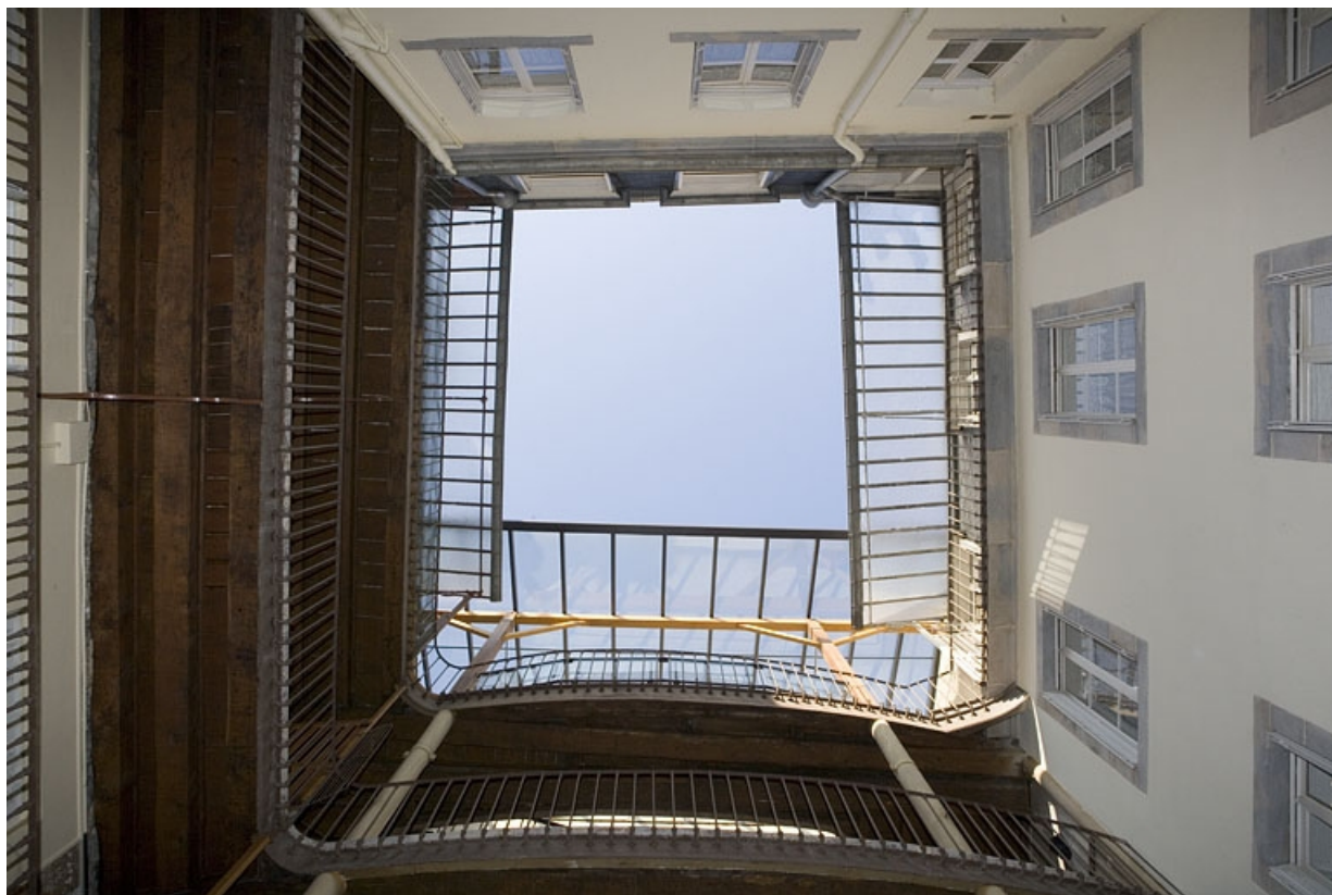
Première cour : vue en contre-plongée de l'escalier à cage ouverte.

25, Besançon Grande Rue 117, lieudit : îlot Forum