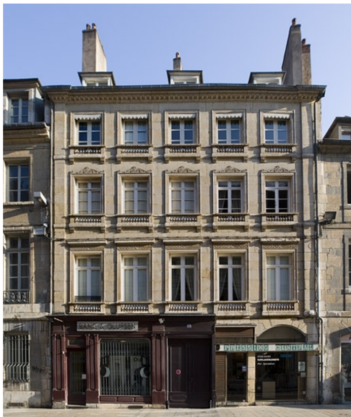
Logis principal, façade sur rue : vue d'ensemble de face.

25, Besançon Grande Rue 117, lieudit : îlot Forum