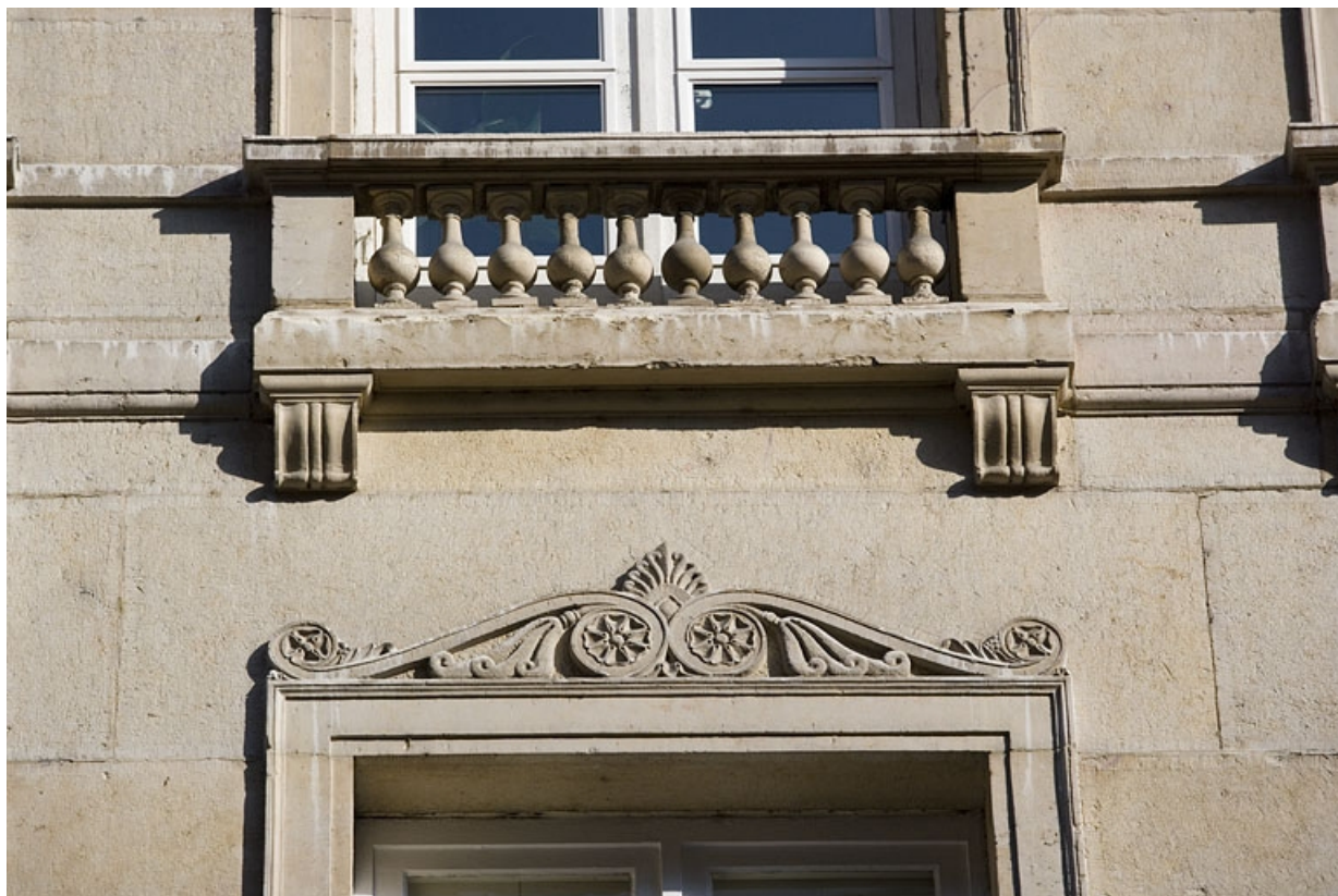
Détail d'un garde-corps d'une fenêtre du troisième étage.

25, Besançon Grande Rue 117, lieudit : îlot Forum