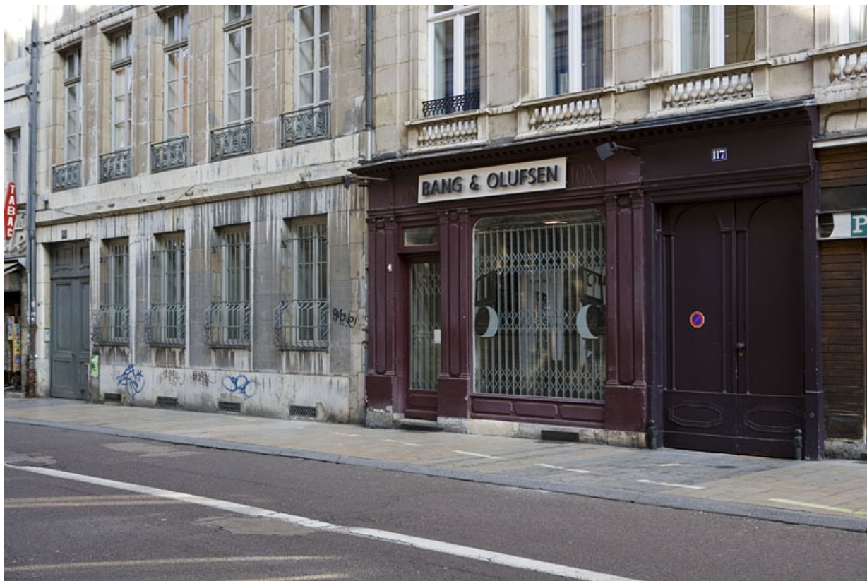
Logis principal, façade sur rue : détail de la devanture du magasin de trois quarts droit.

25, Besançon Grande Rue 117, lieudit : îlot Forum