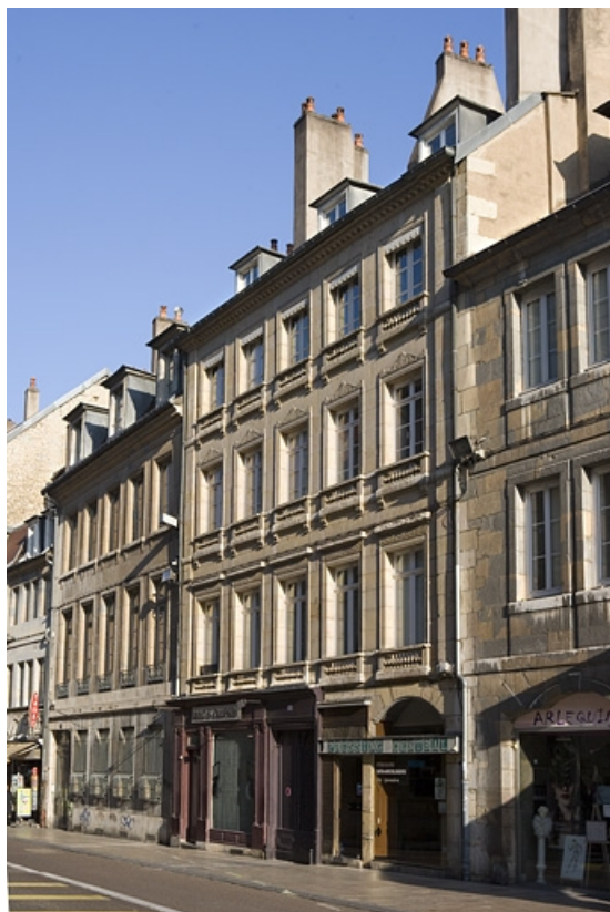
Logis principal, façade sur rue : vue d'ensemble de trois quarts droit. 25, Besançon Grande Rue 117, lieudit : îlot Forum