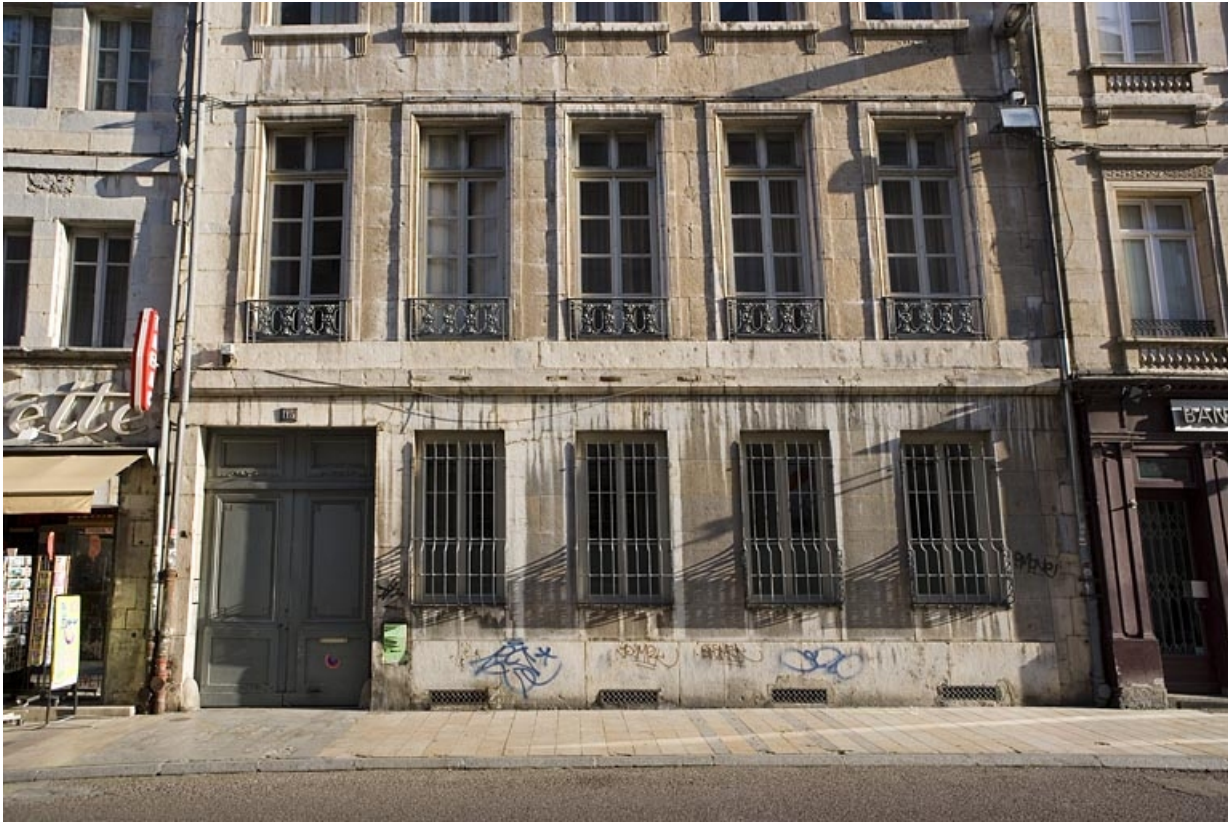
Logis principal sur rue : détail du rez-de-chaussée et du premier étage.

25, Besançon Grande Rue 115, lieudit : îlot Forum