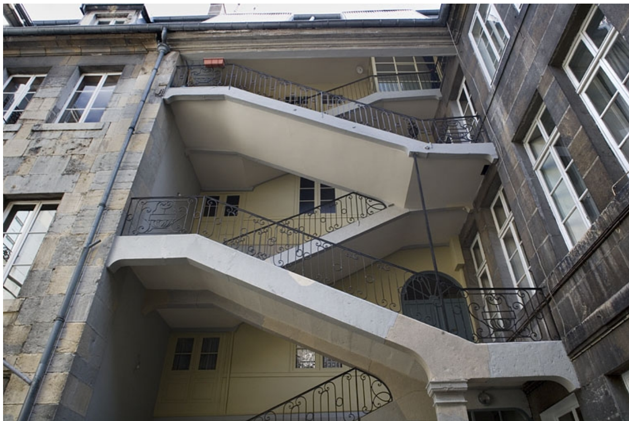
Détail de la partie supérieure de l'escalier à cage ouverte.

25, Besançon Grande Rue 115, lieudit : îlot Forum