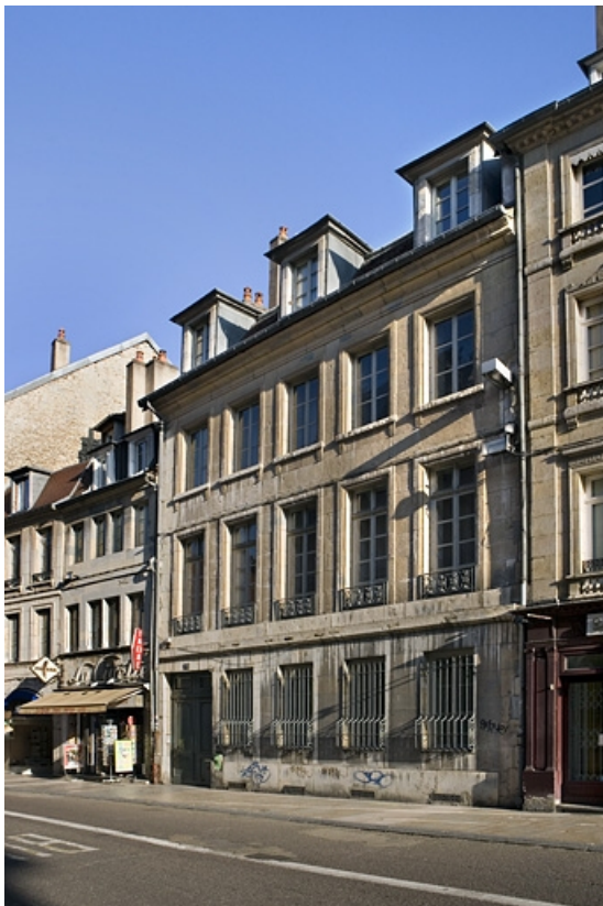
Vue d'ensemble du logis principal sur rue.

25, Besançon Grande Rue 115, lieudit : îlot Forum