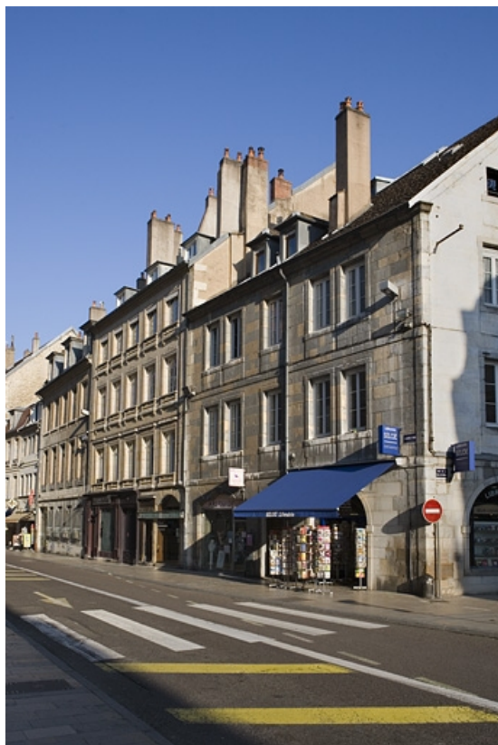
Logis principal sur rue : vue d'ensemble éloignée.

25, Besançon Grande Rue 115, lieudit : îlot Forum