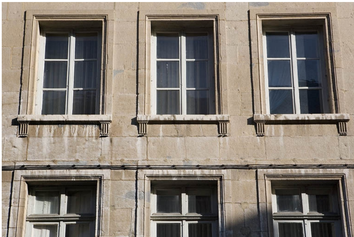
Logis principal sur rue : détail des fenêtres du deuxième étage.

25, Besançon Grande Rue 115, lieudit : îlot Forum