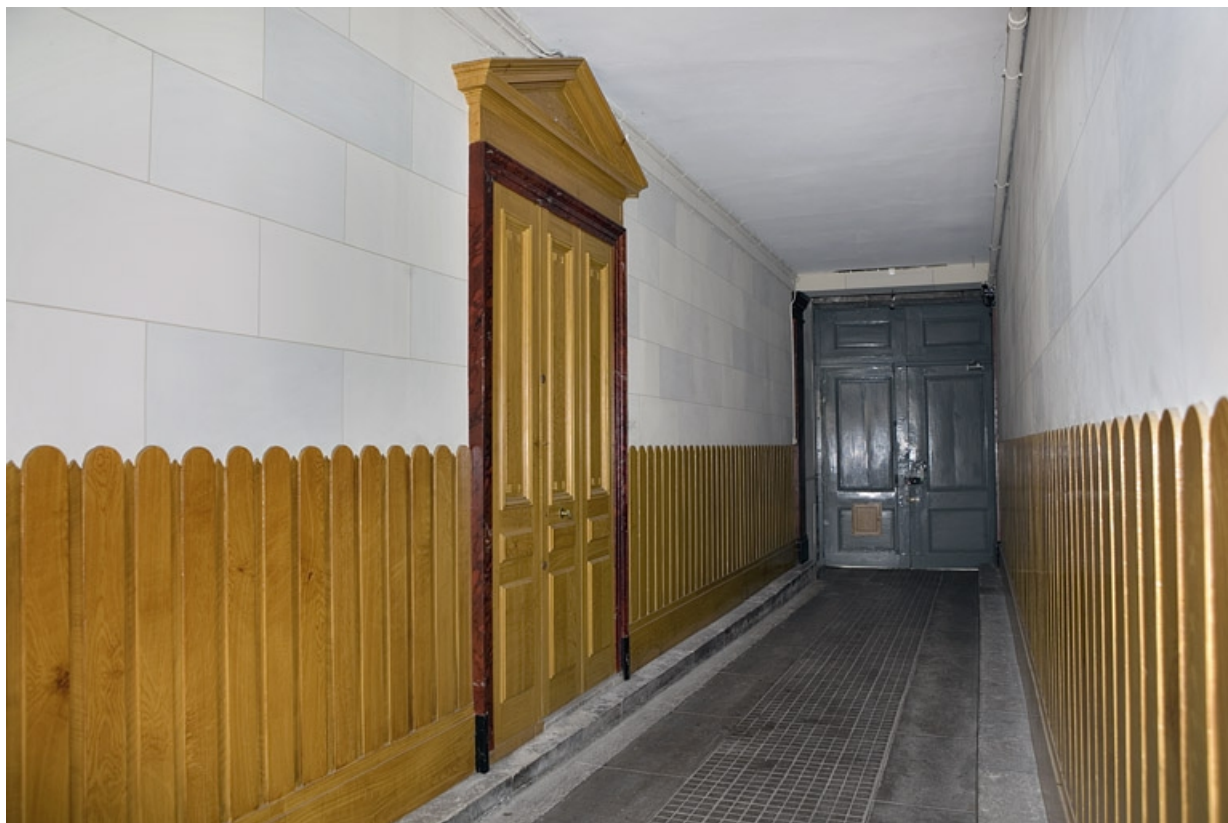
Détail du passage cocher depuis l'entrée de la cour.

25, Besançon Grande Rue 115, lieudit : îlot Forum