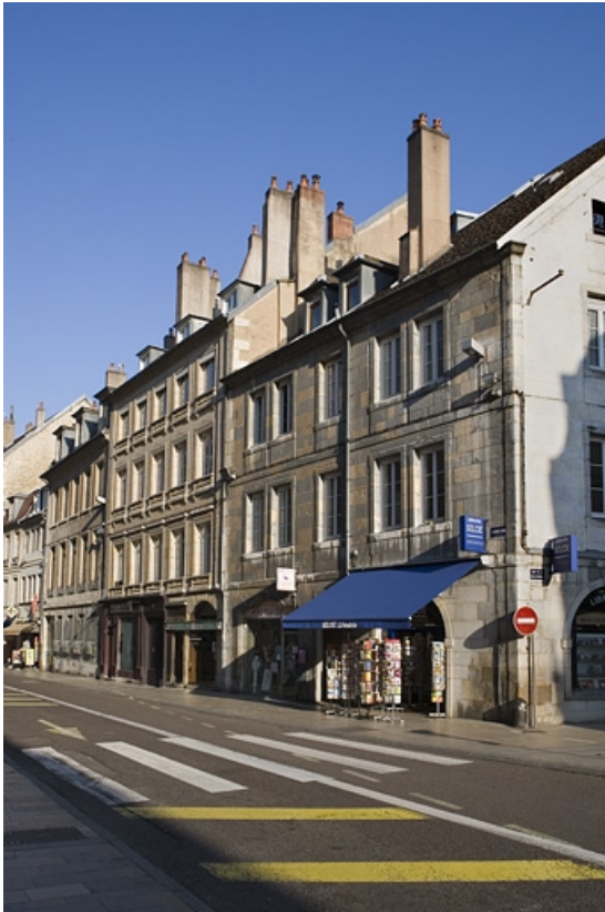
Logis principal sur rue : vue d'ensemble éloignée.

25, Besançon Grande Rue 115, lieudit : îlot Forum