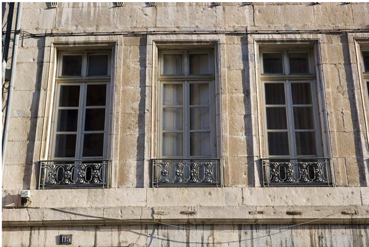
Logis principal sur rue : détail de fenêtres du premier étage.

25, Besançon Grande Rue 115, lieudit : îlot Forum