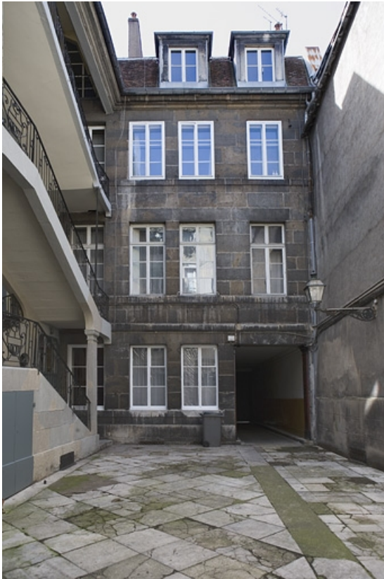
Vue d'ensemble de la façade postérieure du logis principal.

25, Besançon Grande Rue 115, lieudit : îlot Forum