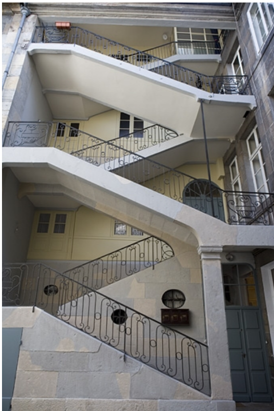
Vue d'ensemble de l'escalier à cage ouverte.

25, Besançon Grande Rue 115, lieudit : îlot Forum