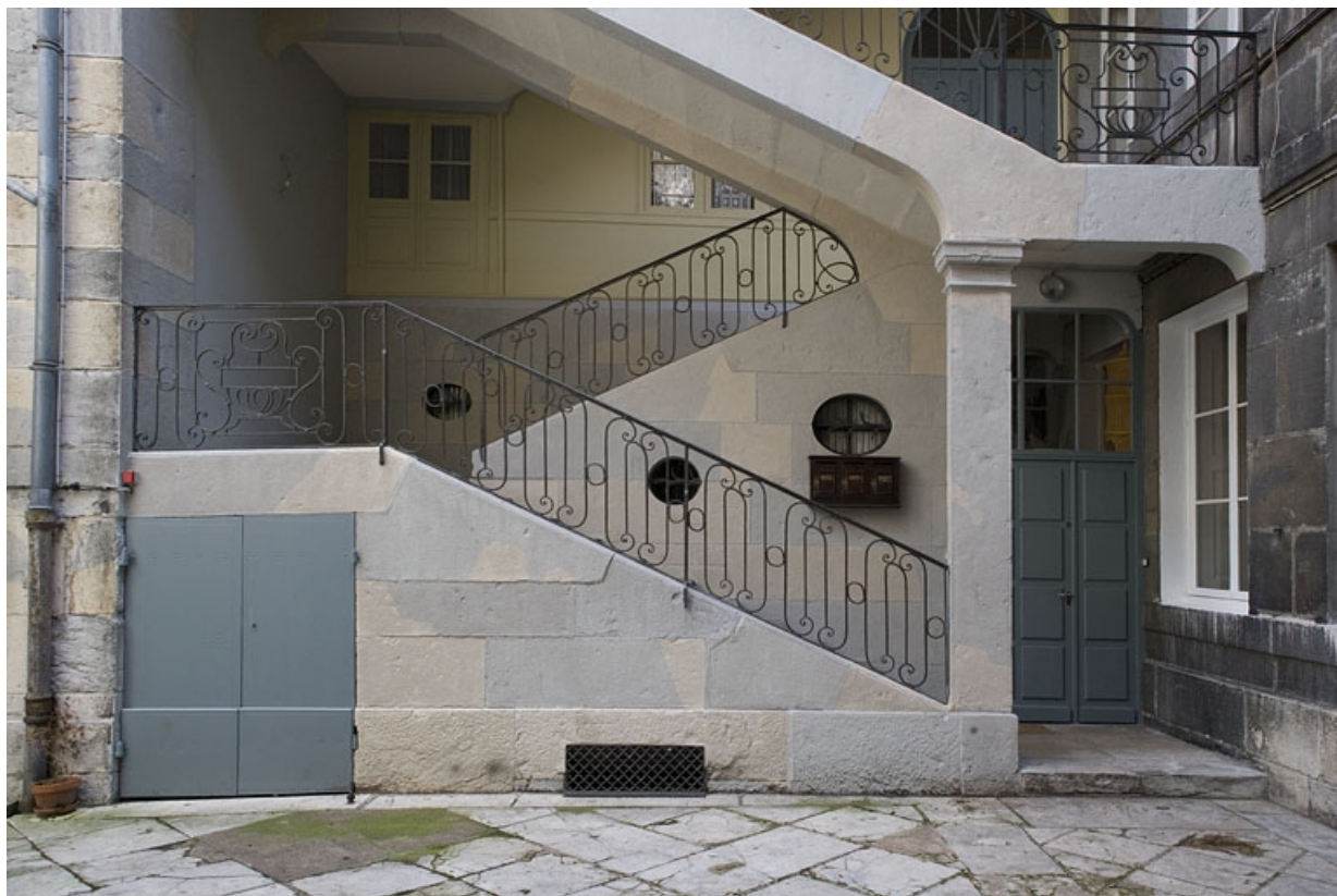
Détail des premières volées de l'escalier à cage ouverte.

25, Besançon Grande Rue 115, lieudit : îlot Forum