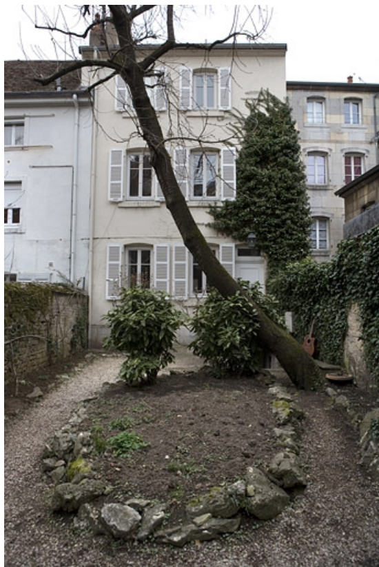
Vue d'ensemble du logis secondaire situé en fond de parcelle.

25, Besançon Grande Rue 109, lieudit : îlot Forum