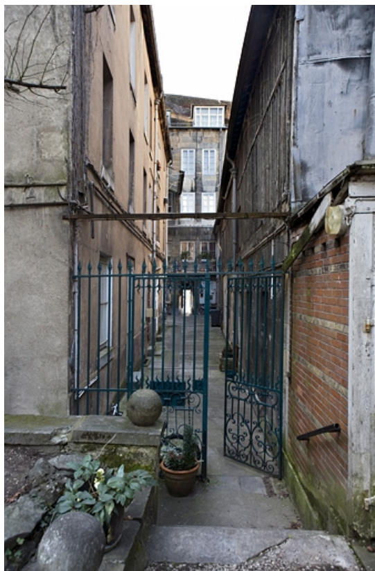
Vue d'ensemble des logis secondaires de la première cour, depuis la deuxième cour.

25, Besançon Grande Rue 109, lieudit : îlot Forum