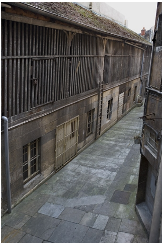
Vue d'ensemble du bûcher situé à gauche de la première cour.

25, Besançon Grande Rue 109, lieudit : îlot Forum