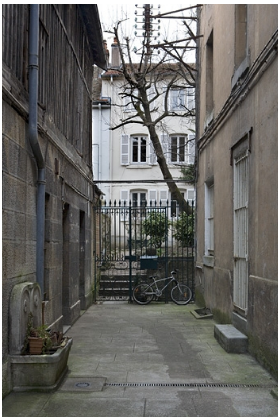
Vue d'ensemble du logis secondaire situé en fond de parcelle, depuis la première cour.

25, Besançon Grande Rue 109, lieudit : îlot Forum