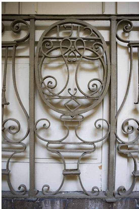
Détail de la ferronnerie de l'escalier à cage ouverte.

25, Besançon Grande Rue 109, lieudit : îlot Forum