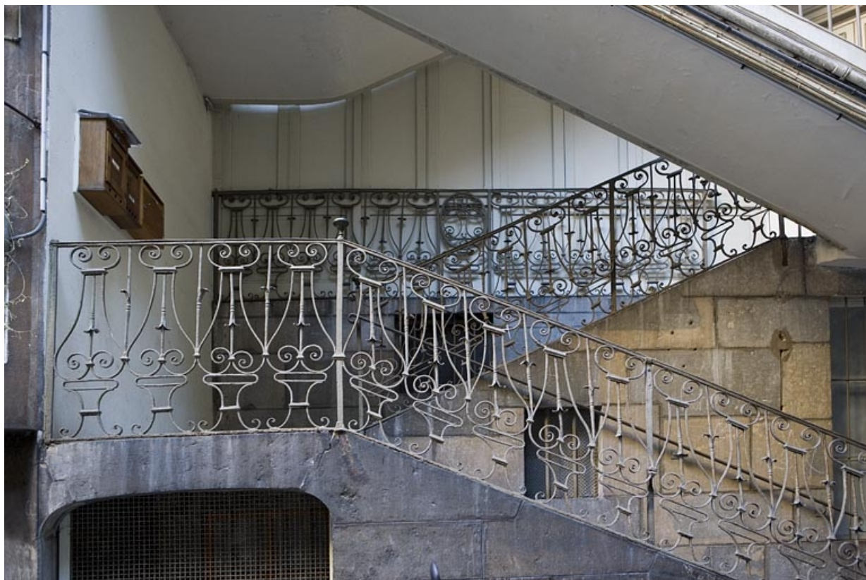
Détail de la ferronnerie de l'escalier à cage ouverte.

25, Besançon Grande Rue 109, lieudit : îlot Forum