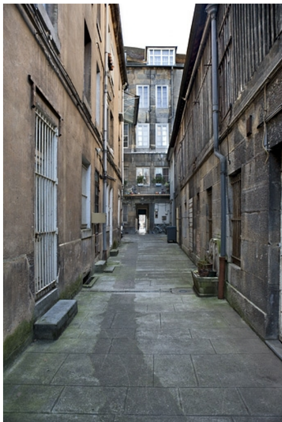
Vue d'ensemble des logis secondaires de la première cour, depuis le fond de cette cour.

25, Besançon Grande Rue 109, lieudit : îlot Forum