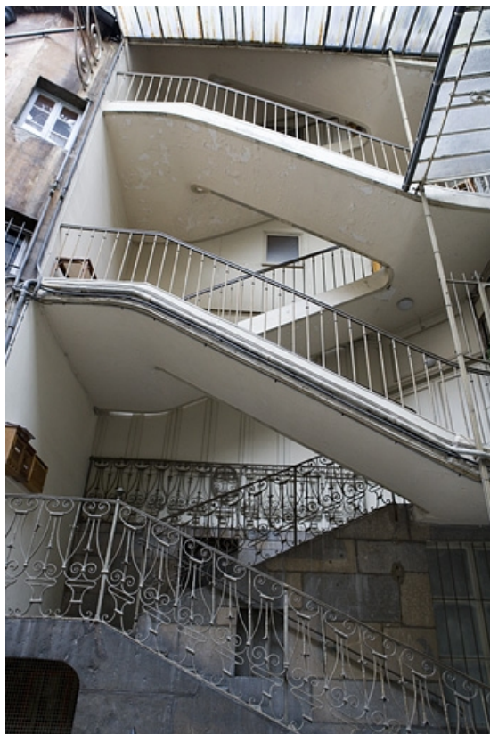
Vue d'ensemble de l'escalier à cage ouverte.

25, Besançon Grande Rue 109, lieudit : îlot Forum