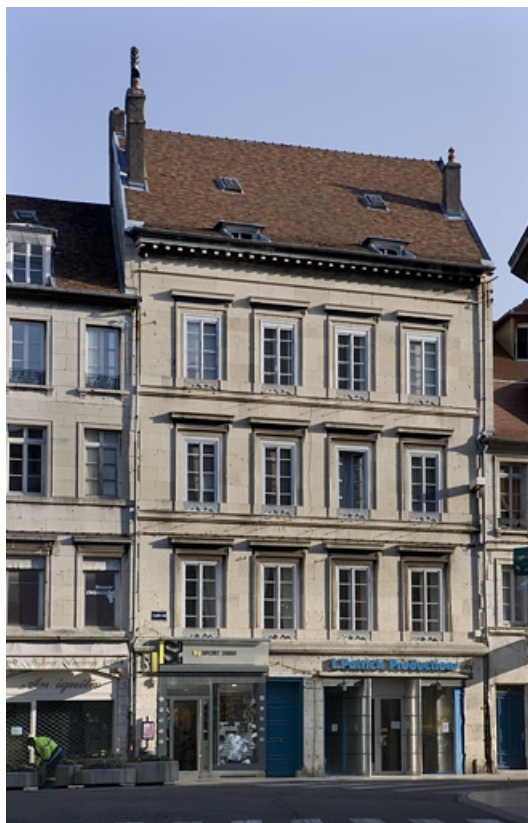
Vue d'ensemble de la façade sur rue.

25, Besançon Grande Rue 109, lieudit : îlot Forum