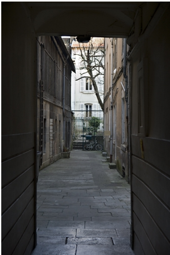
Vue d'ensemble de la première cour depuis l'entrée du couloir.

25, Besançon Grande Rue 109, lieudit : îlot Forum