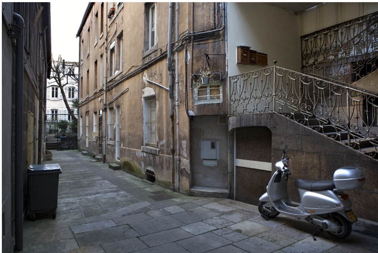
Vue d'ensemble du logis secondaire situé à droite de la première cour.

25, Besançon Grande Rue 109, lieudit : îlot Forum