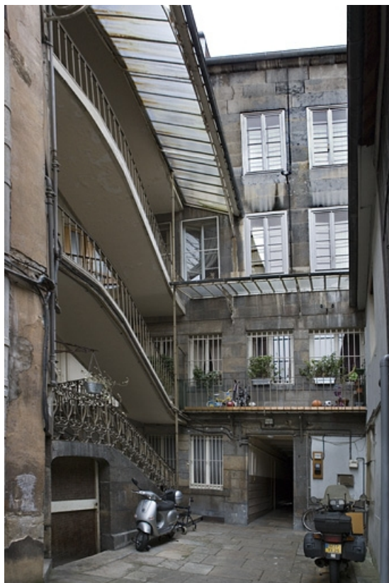
Vue d'ensemble de la façade postérieure du logis principal avec l'escalier à cage ouverte.

25, Besançon Grande Rue 109, lieudit : îlot Forum