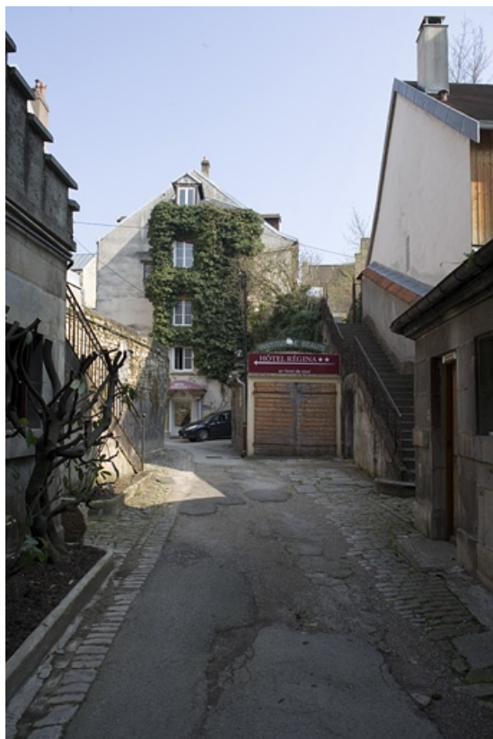
Vue d'ensemble du logis secondaire au fond de la deuxième cour.

25, Besançon Grande Rue 91, lieudit : îlot Forum