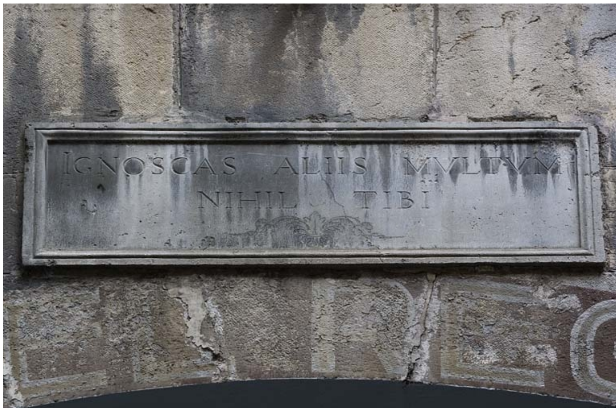
Première cour : détail d'une inscription latine.

25, Besançon Grande Rue 91, lieudit : îlot Forum