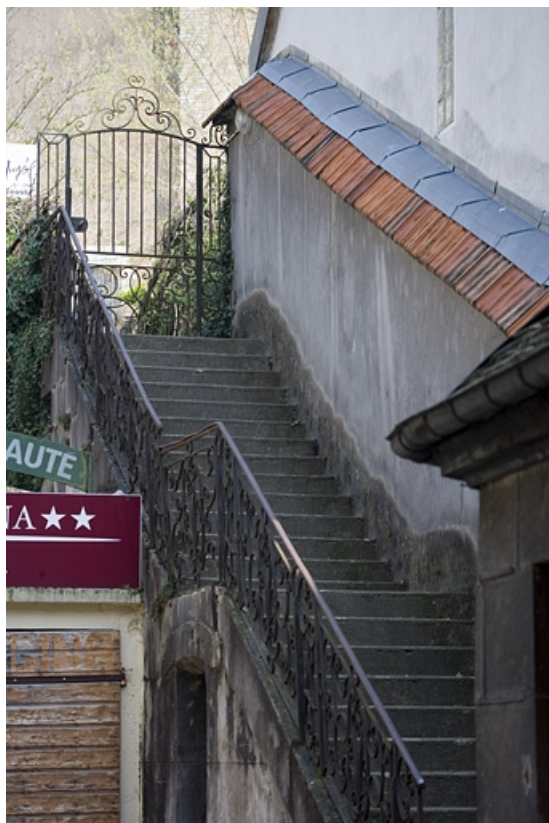
Vue de l'escalier isolé dans la deuxième cour conduisant à la terrasse gallo-romaine.

25, Besançon Grande Rue 91, lieudit : îlot Forum