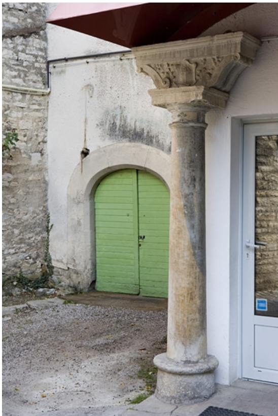
Détail de la colonne à gauche : entrée du logis secondaire au fond de la deuxième cour. 25, Besançon Grande Rue 91, lieudit : îlot Forum