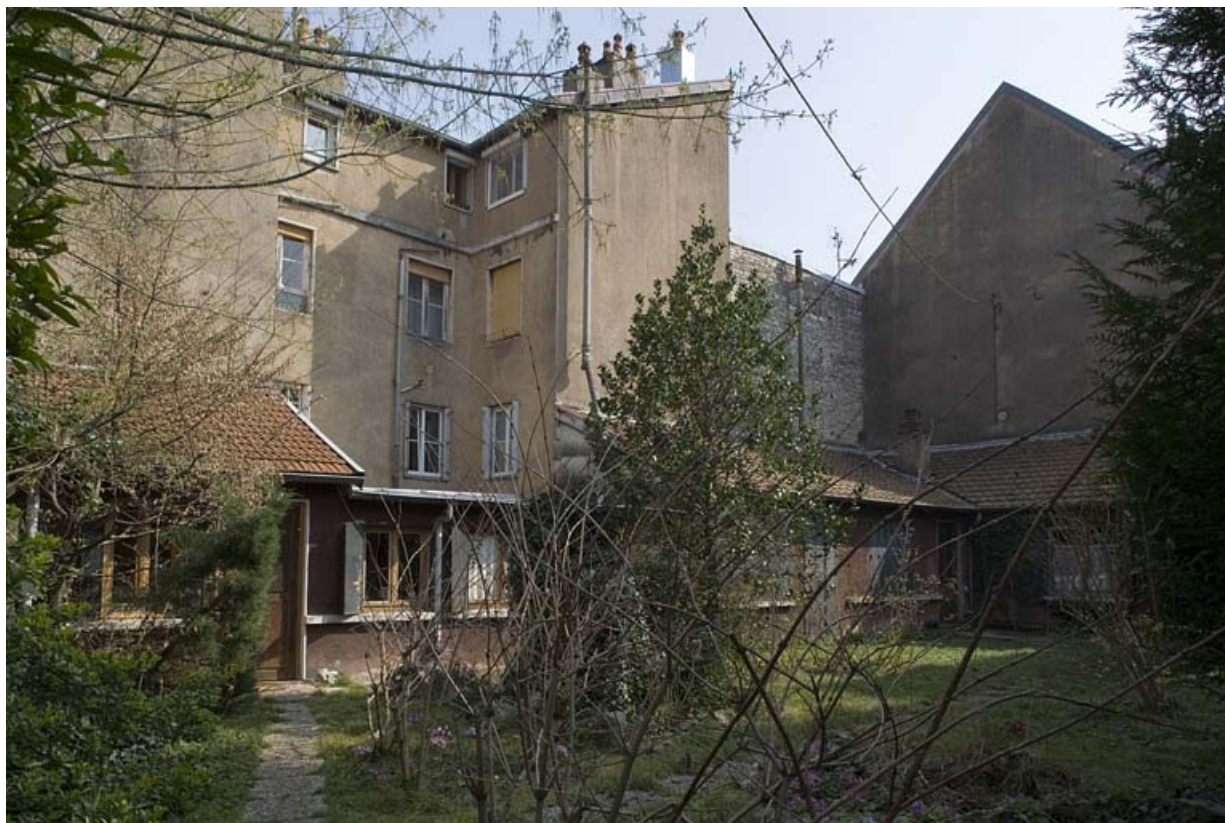
Vue d'ensemble de l'actuel institut de beauté sur la terrasse gallo-romaine.

25, Besançon Grande Rue 91, lieudit : îlot Forum