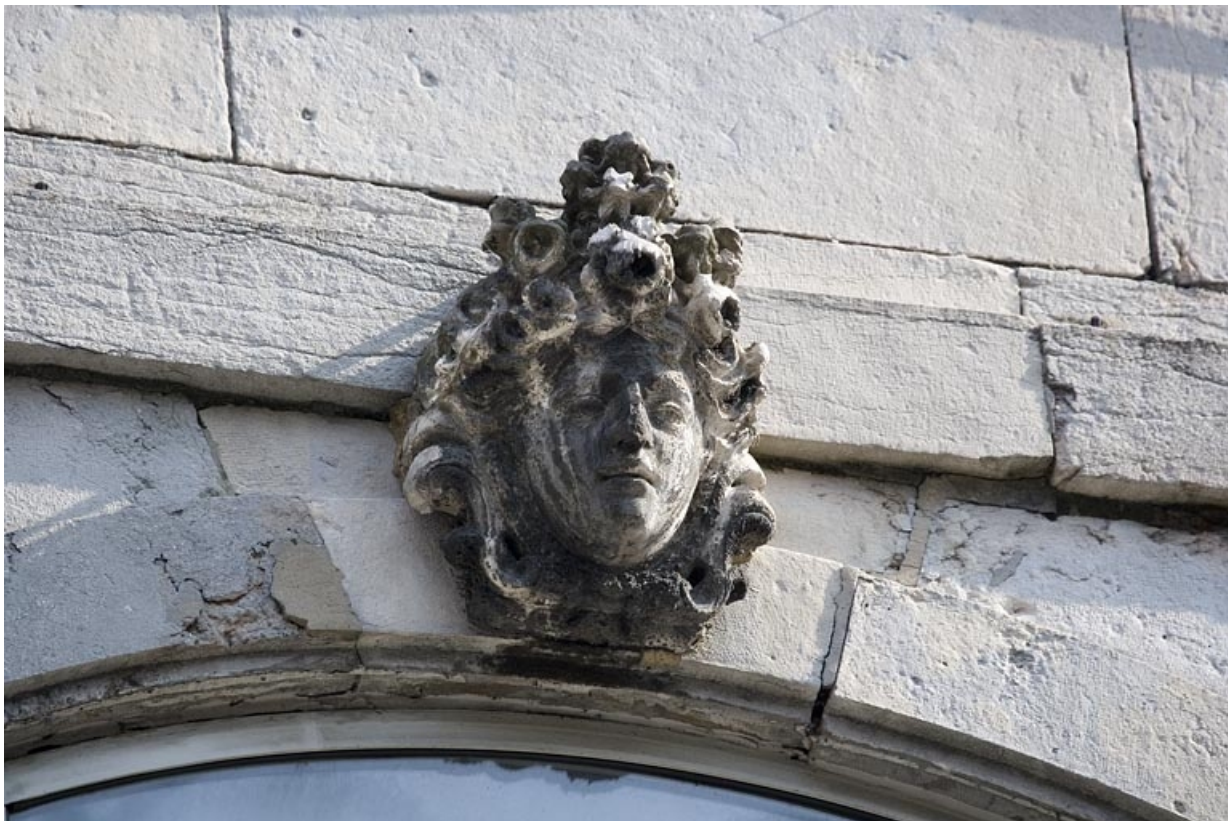
Détail de la clé d'une fenêtre au premier étage sur rue : figure coiffée d'un amas de fleurs.

25, Besançon Grande Rue 91, lieudit : îlot Forum