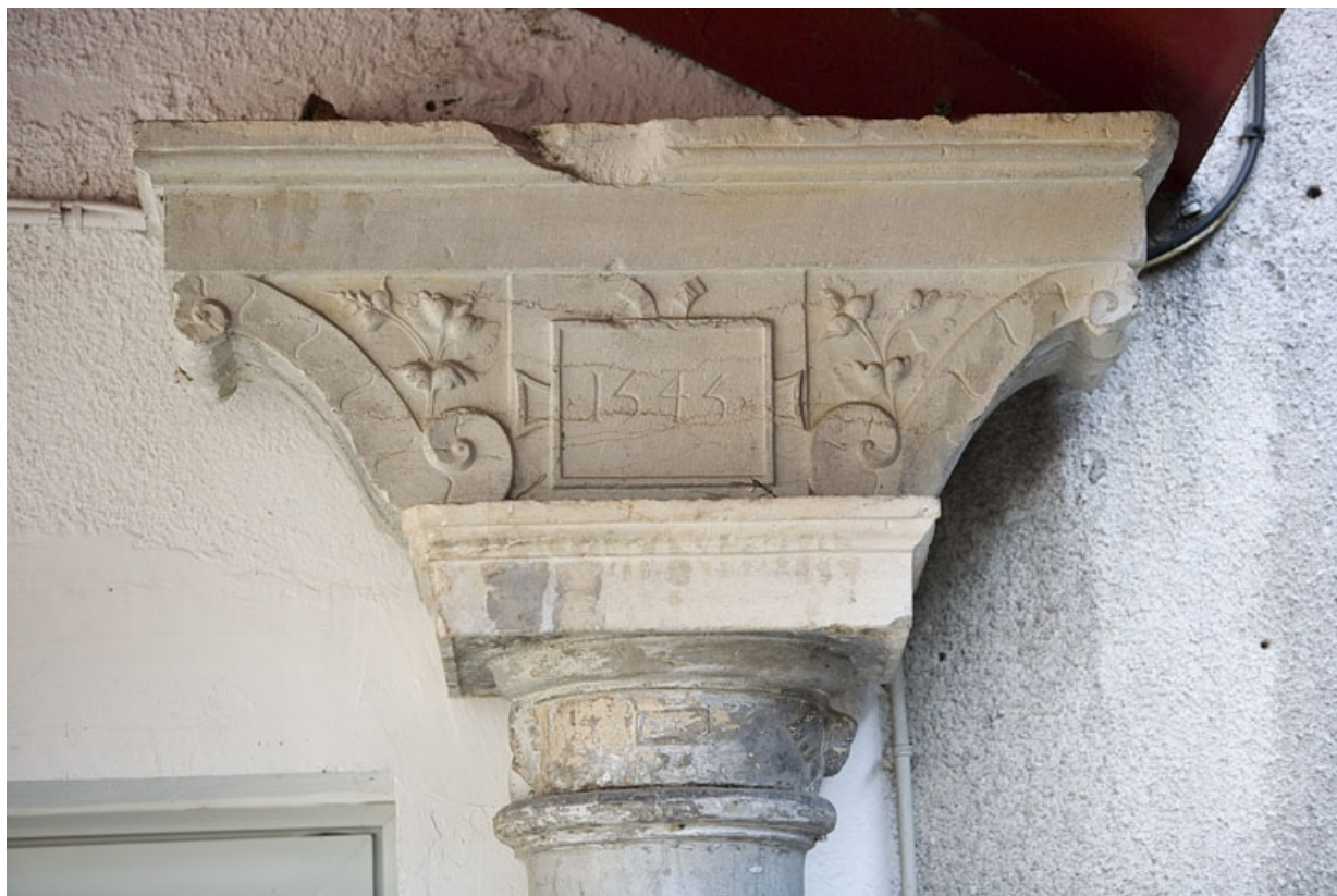
Détail du chapiteau de la colonne droite : entrée du logis secondaire au fond de la deuxième cour.

25, Besançon Grande Rue 91, lieudit : îlot Forum