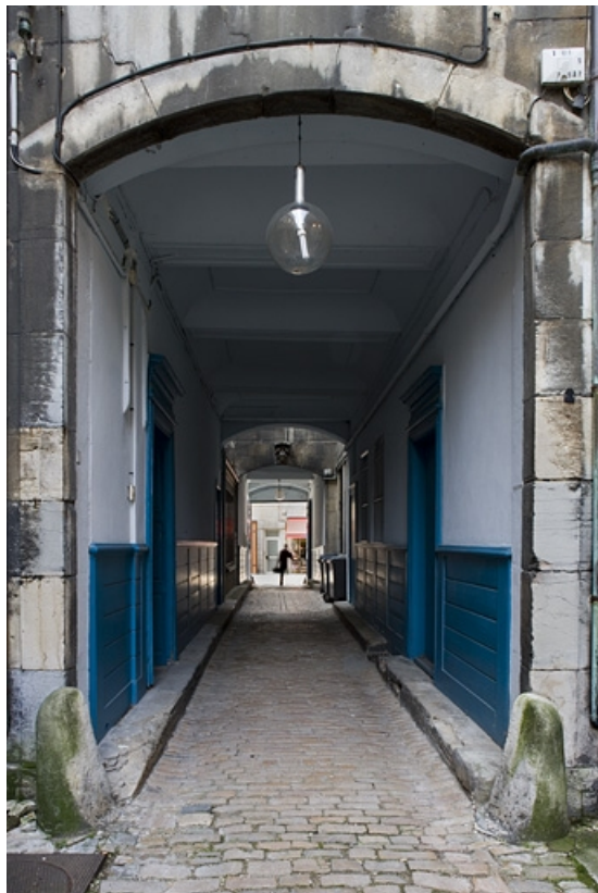
Détail du portail d'entrée dans la deuxième cour, avec le passage cocher en enfilade.

25, Besançon Grande Rue 91, lieudit : îlot Forum