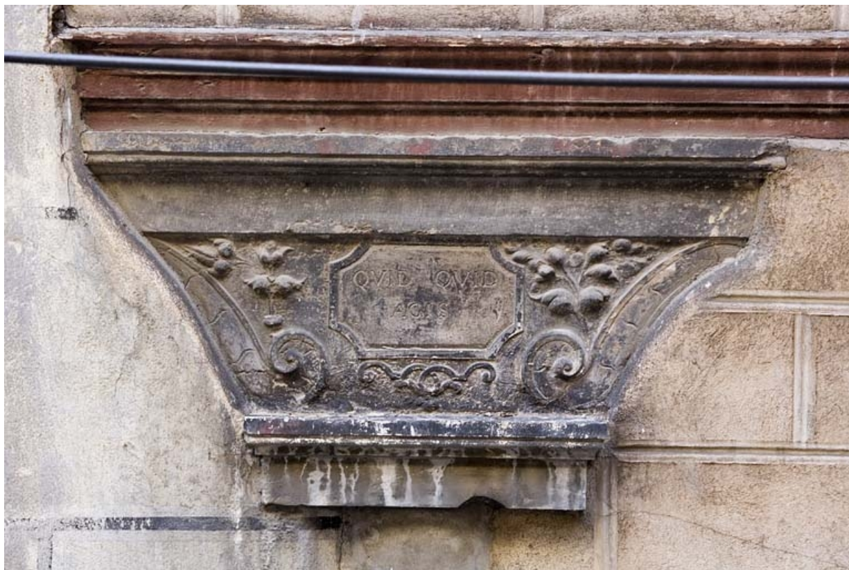
Détail du chapiteau du portique portant l'inscription latine "quoique tu fasses". 25, Besançon Grande Rue 91, lieudit : îlot Forum