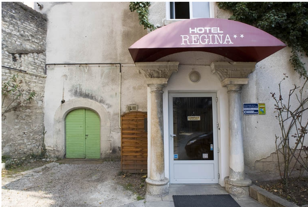
Détail du rez-de-chaussée du logis secondaire au fond de la deuxième cour. 25, Besançon Grande Rue 91, lieudit : îlot Forum