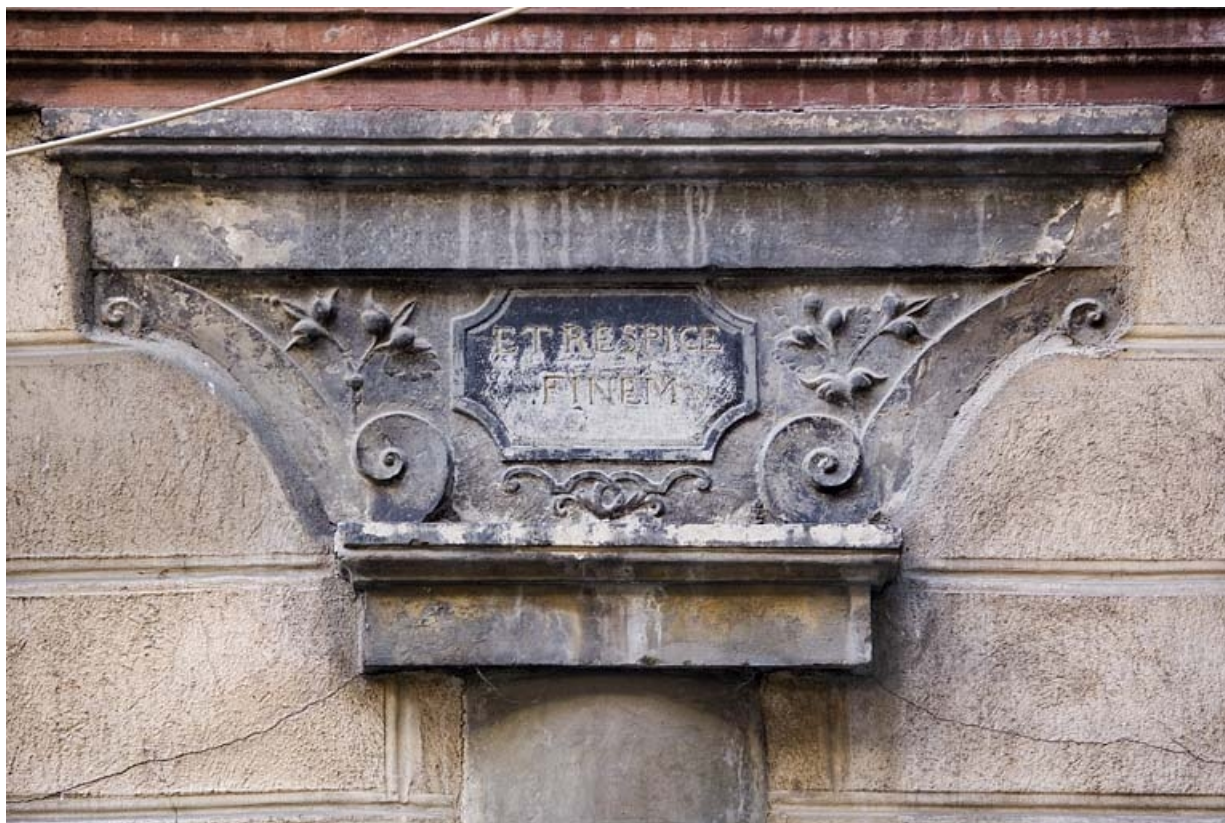
Détail du chapiteau du portique portant l'inscription latine "et considère la fin". 25, Besançon Grande Rue 91, lieudit : îlot Forum