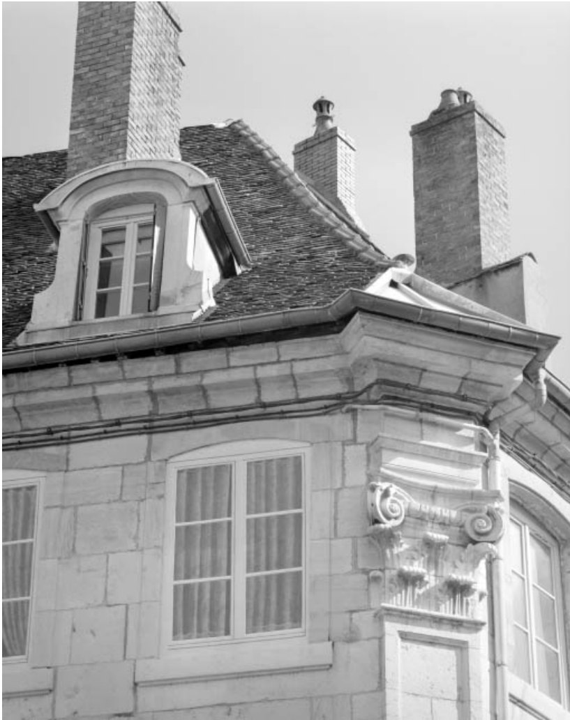
Détail du chapiteau à l'angle de la maison.

25, Besançon, 1 rue du Lycée, lieudit : îlot Pasteur