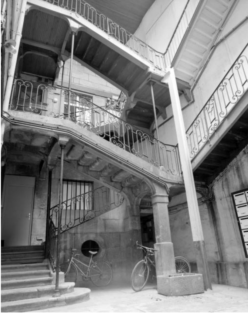
Vue d'ensemble de l'escalier à cage ouverte.

25, Besançon, 1 rue du Lycée, lieudit : îlot Pasteur