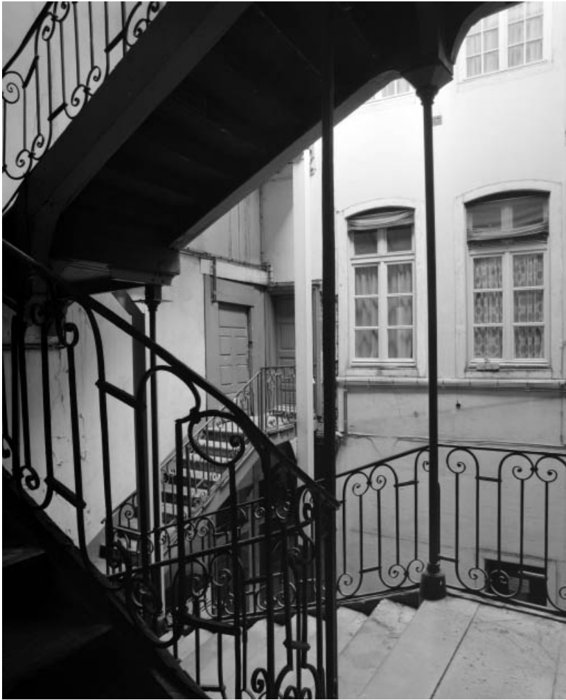
Vue du logis sur cour depuis l'escalier à cage ouverte.

25, Besançon, 1 rue du Lycée, lieudit : îlot Pasteur