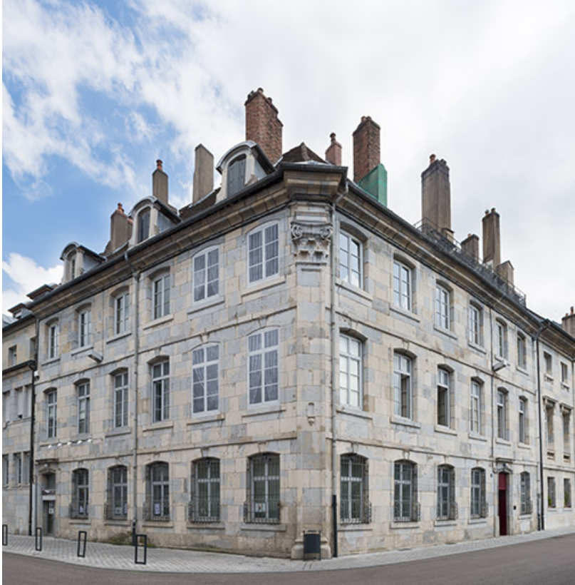
Vue d'ensemble depuis l'ouest. 25, Besançon