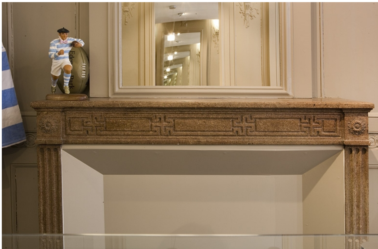
Détail de la tablette de la cheminée située au premier étage.

25, Besançon Grande Rue 80, lieudit : îlot Terrier de Santans