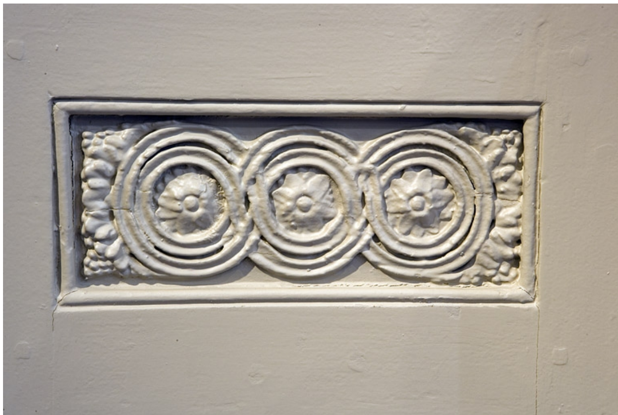
Détail d'un des décors de rosaces encadrant la cheminée située au premier étage.

25, Besançon Grande Rue 80, lieudit : îlot Terrier de Santans