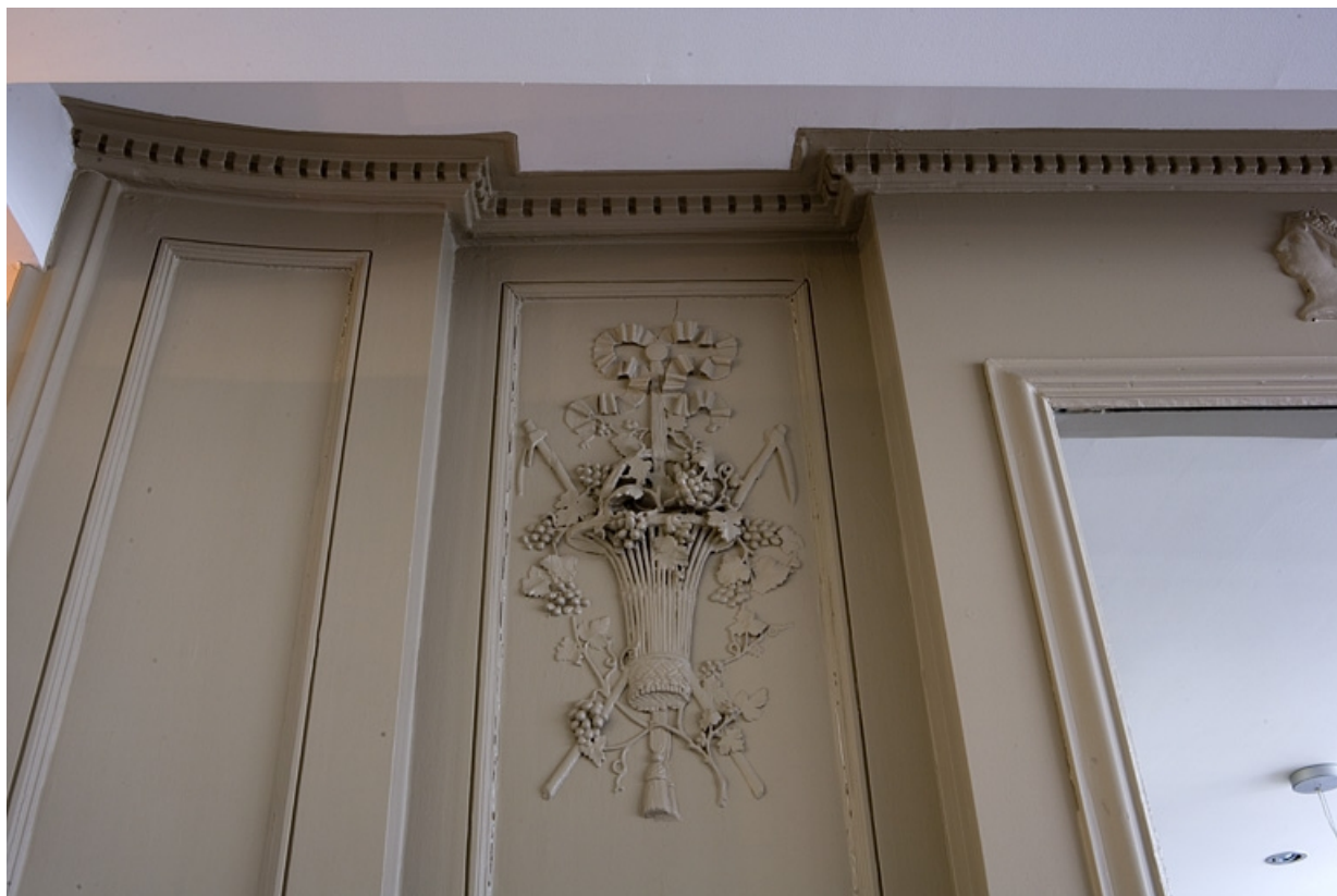
Détail d'un décor représentant l'automne ornant les lambris d'une pièce du premier étage.

25, Besançon Grande Rue 80, lieudit : îlot Terrier de Santans