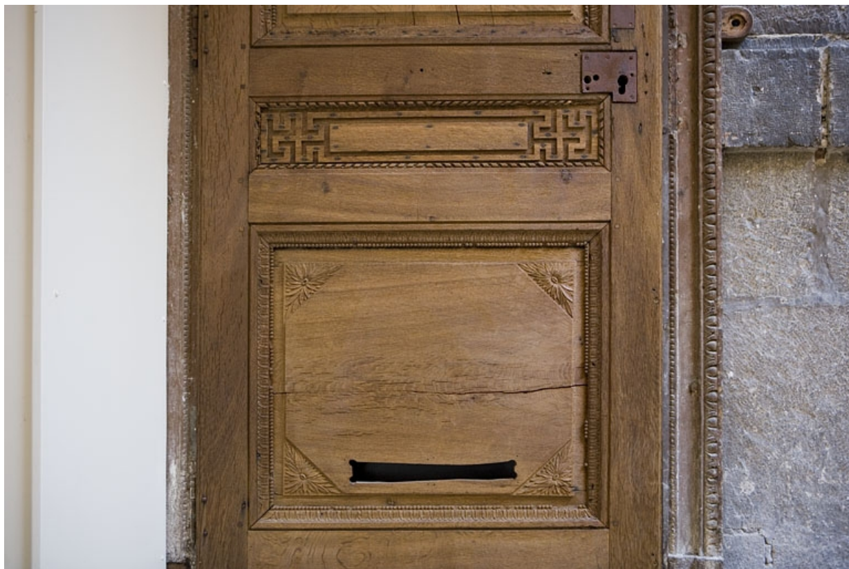
Détail des grecques ornant la porte d'entrée du logis secondaire.

25, Besançon Grande Rue 80, lieudit : îlot Terrier de Santans