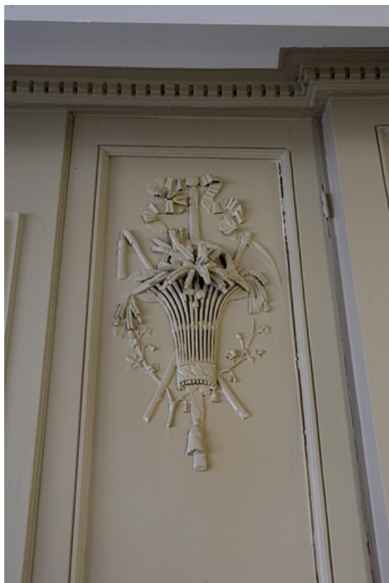
Détail d'un décor représentant l'été ornant les lambris d'une pièce du premier étage.

25, Besançon Grande Rue 80, lieudit : îlot Terrier de Santans