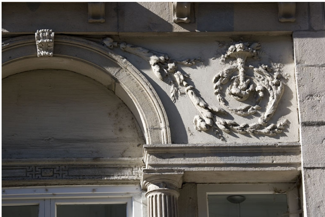
Détail d'un rinceau de feuillage encadrant l'arc de la serlienne.

25, Besançon Grande Rue 80, lieudit : îlot Terrier de Santans