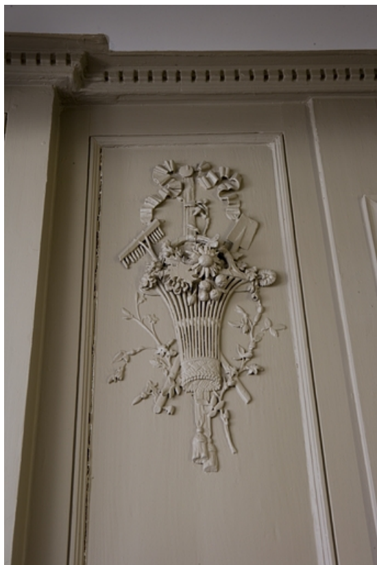
Détail d'un décor représentant le printemps ornant les lambris d'une pièce du premier étage. 25, Besançon Grande Rue 80, lieudit : îlot Terrier de Santans