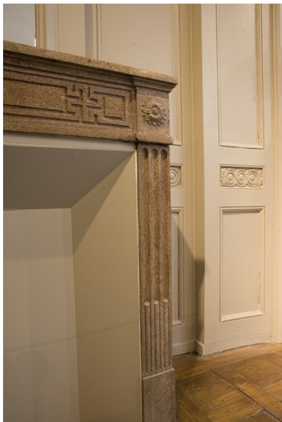
Détail de la partie droite de la cheminée située au premier étage.

25, Besançon Grande Rue 80, lieudit : îlot Terrier de Santans