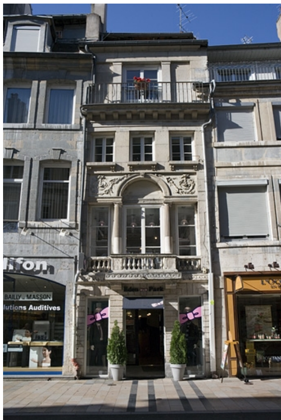
Vue d'ensemble de la façade sur rue, de face.

25, Besançon Grande Rue 80, lieudit : îlot Terrier de Santans