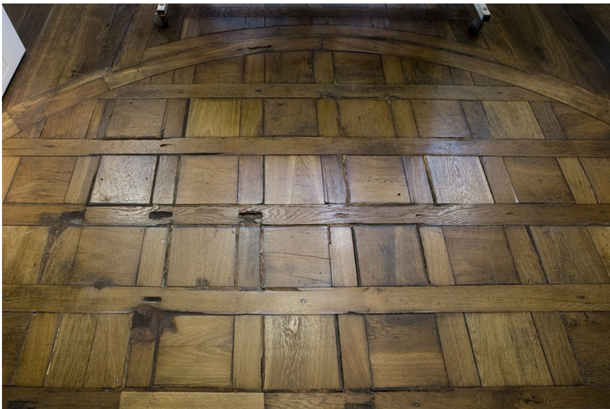
Détail du parquet d'une pièce située au premier étage, de face.

25, Besançon Grande Rue 80, lieudit : îlot Terrier de Santans