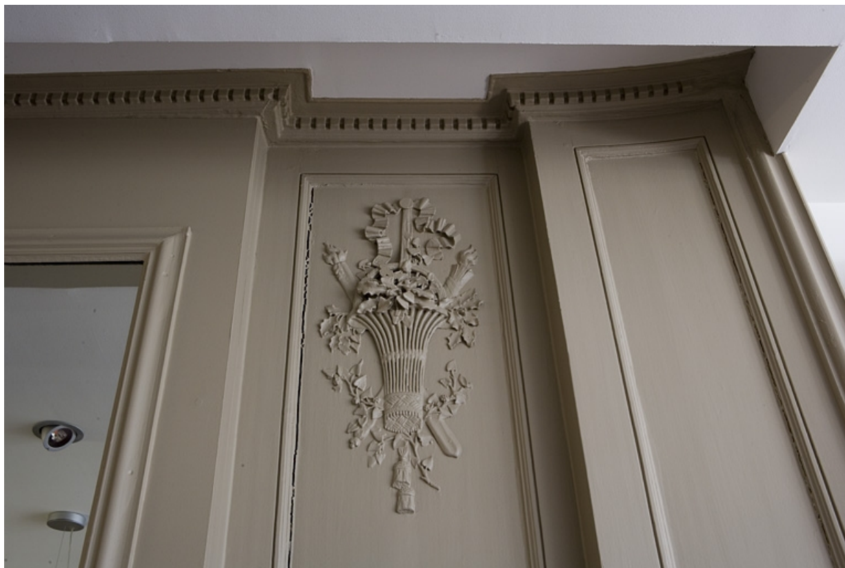
Détail d'un décor représentant l'hiver ornant les lambris d'une pièce du premier étage.

25, Besançon Grande Rue 80, lieudit : îlot Terrier de Santans