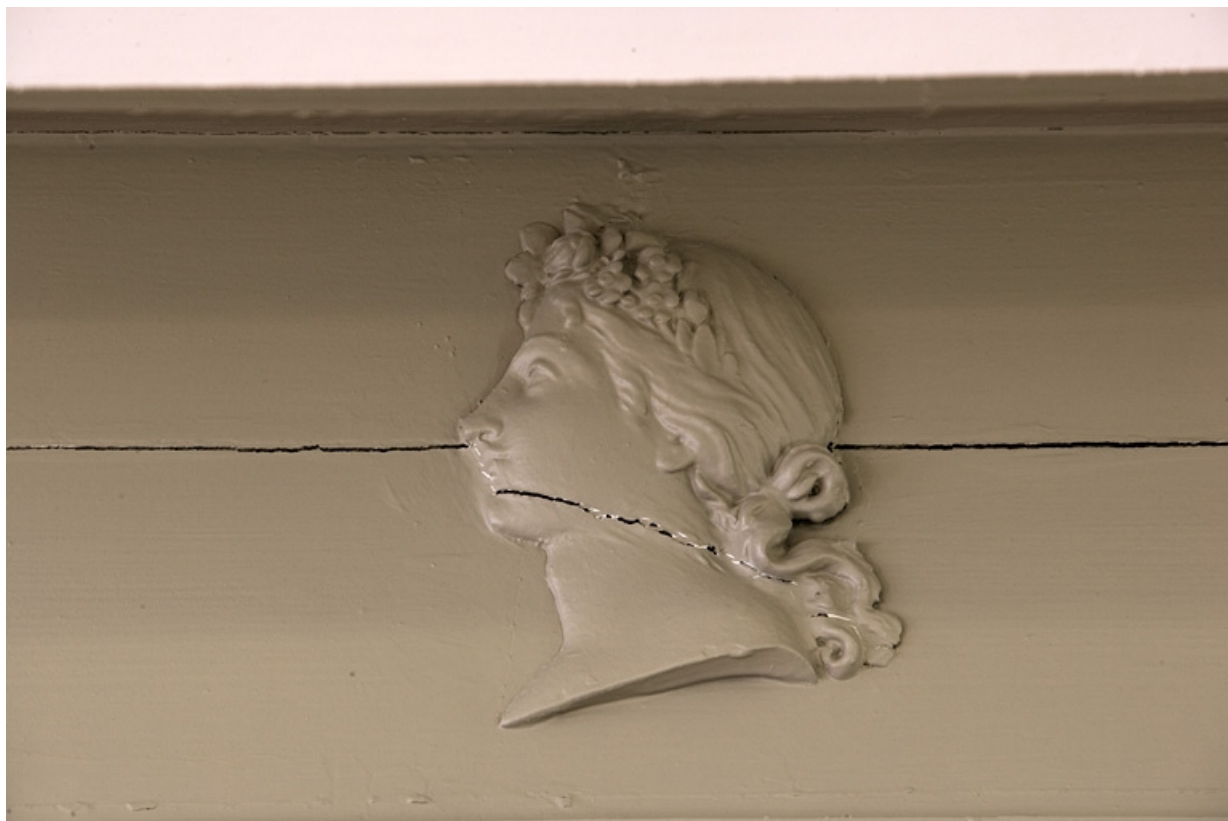
Détail d'une tête de femme de profil ornant les lambris d'une pièce située au premier étage.

25, Besançon Grande Rue 80, lieudit : îlot Terrier de Santans