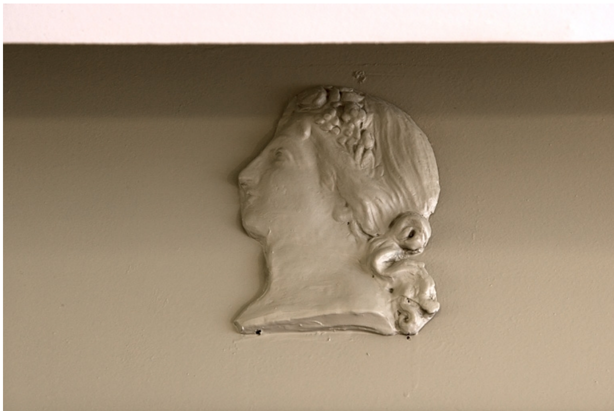
Détail d'une tête de femme de profil ornant les lambris d'une pièce située au premier étage.

25, Besançon Grande Rue 80, lieudit : îlot Terrier de Santans