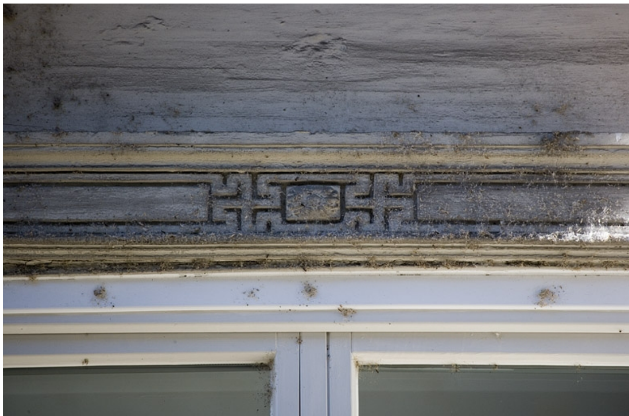
Détail des grecques ornant la base de l'arc de la serlienne.

25, Besançon Grande Rue 80, lieudit : îlot Terrier de Santans