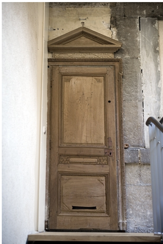
Détail de la porte d'entrée du logis secondaire.

25, Besançon Grande Rue 80, lieudit : îlot Terrier de Santans