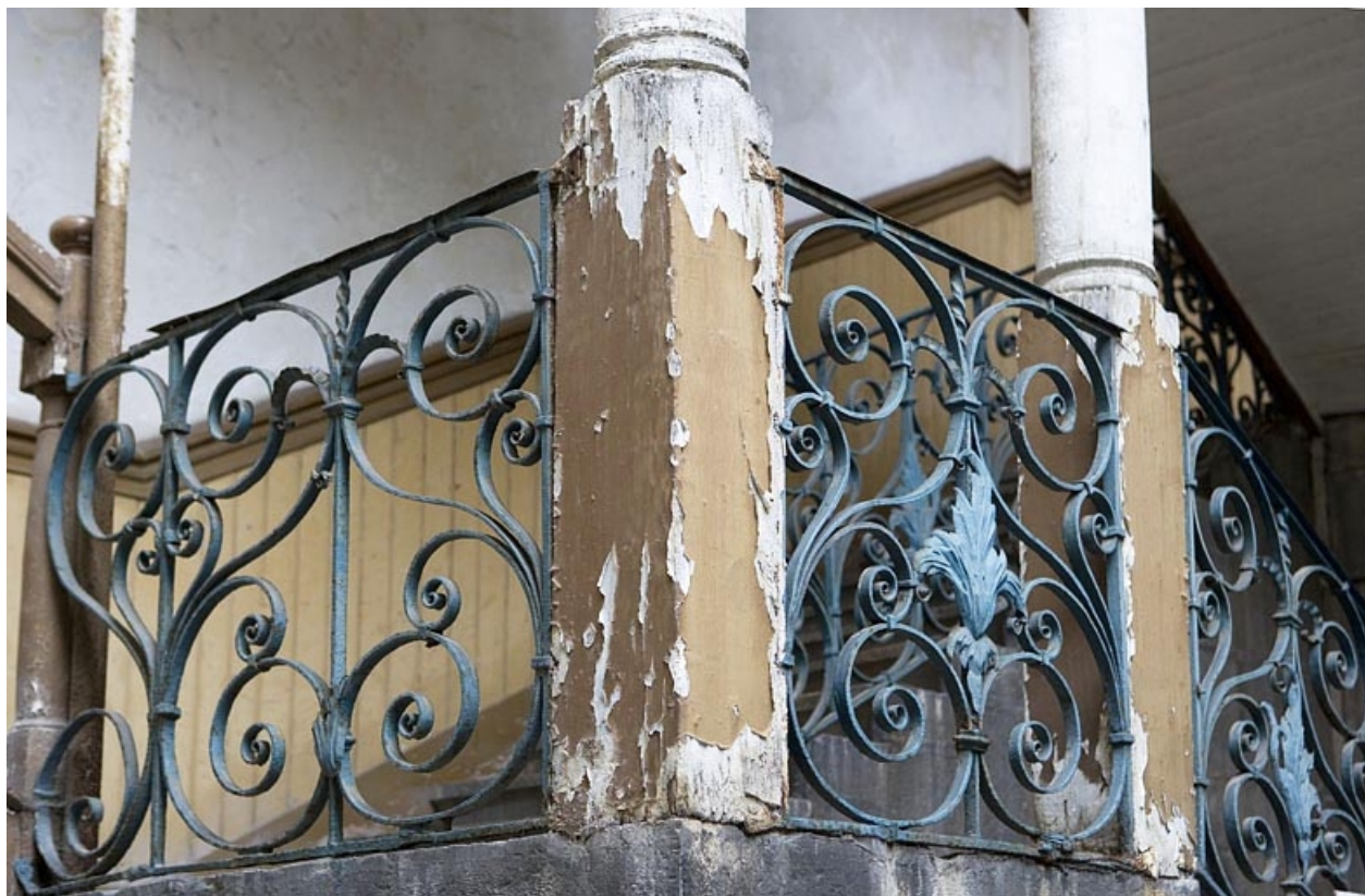
Détail de la rampe en ferronnerie de l'escalier à cage ouverte.

25, Besançon Grande Rue 17, lieudit : îlot Chevanney