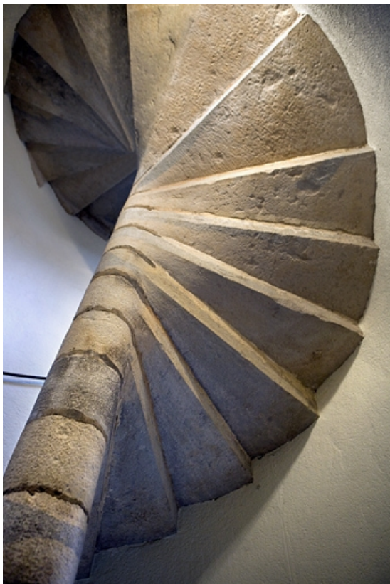
Détail de l'escalier en vis dans le premier logis secondaire : vue en contre-plongée.

25, Besançon Grande Rue 17, lieudit : îlot Chevanney