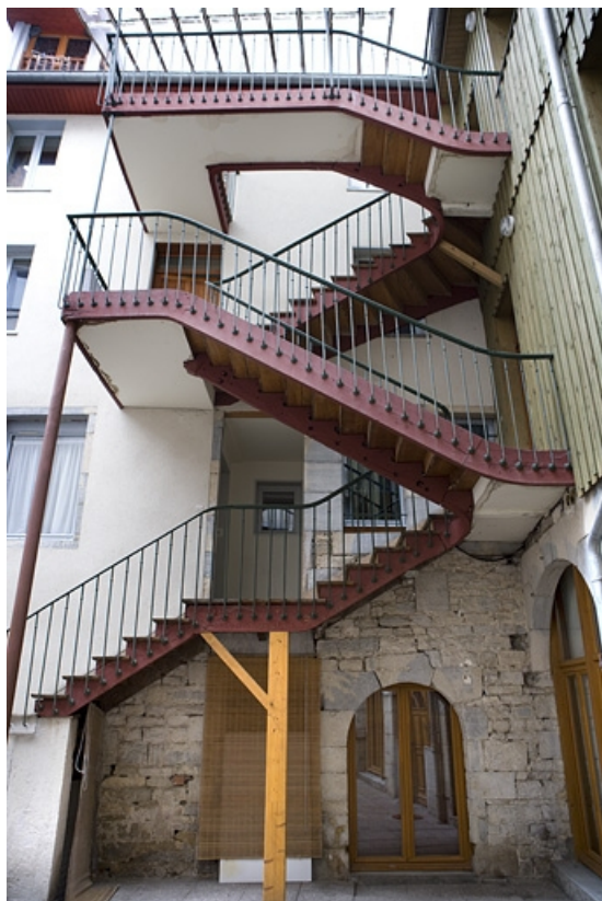
Deuxième cour : escalier extérieur récent.

25, Besançon Grande Rue 17, lieudit : îlot Chevanney