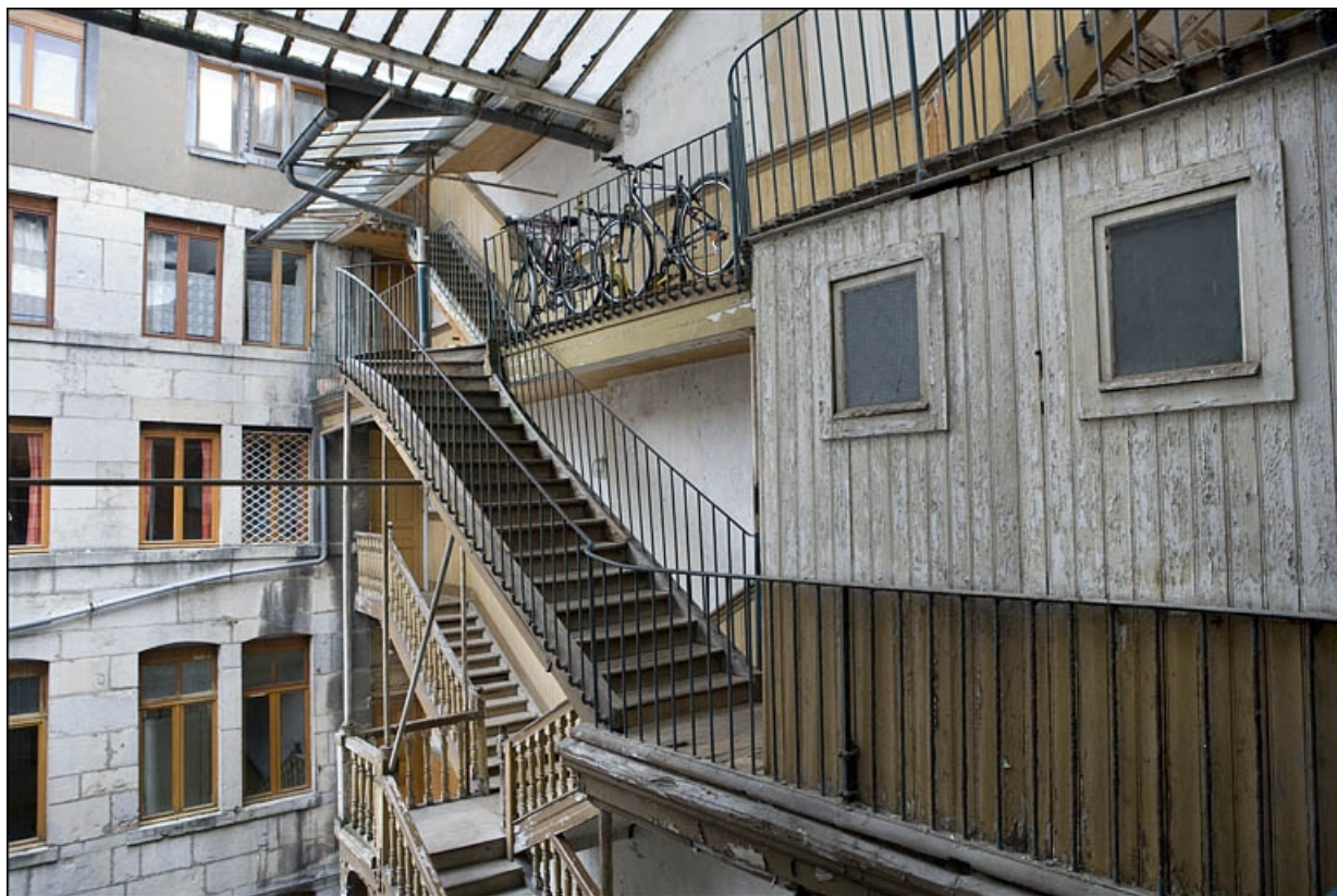
Détail des parties supérieures de la façade antérieure du premier logis secondaire et de l'escalier à cage ouverte. 25, Besançon Grande Rue 17, lieudit : îlot Chevanney