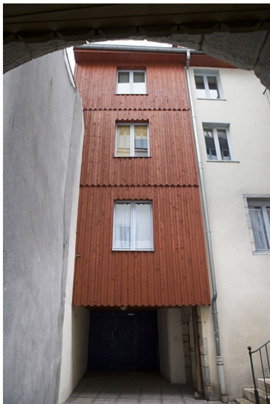
Logis secondaire au-dessus du portail d'entrée dans la deuxième cour.

25, Besançon Grande Rue 17, lieudit : îlot Chevanney