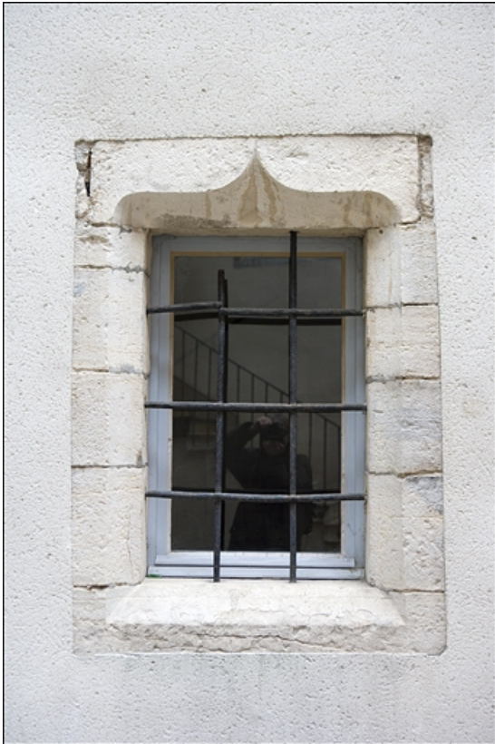
Premier logis secondaire, façade postérieure : détail d'une fenêtre en accolade. 25, Besançon Grande Rue 17, lieudit : îlot Chevanney