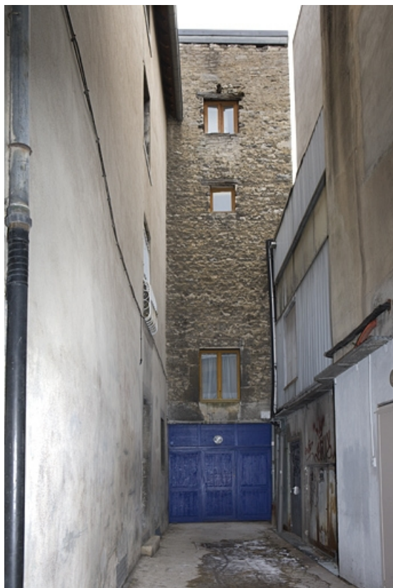
Deuxième cour : façade postérieure du logis secondaire donnant sur l'ancien trage. 25, Besançon Grande Rue 17, lieudit : îlot Chevanney