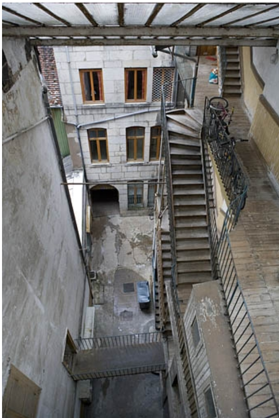
Vue d'ensemble de la façade antérieure du premier logis secondaire.

25, Besançon Grande Rue 17, lieudit : îlot Chevanney