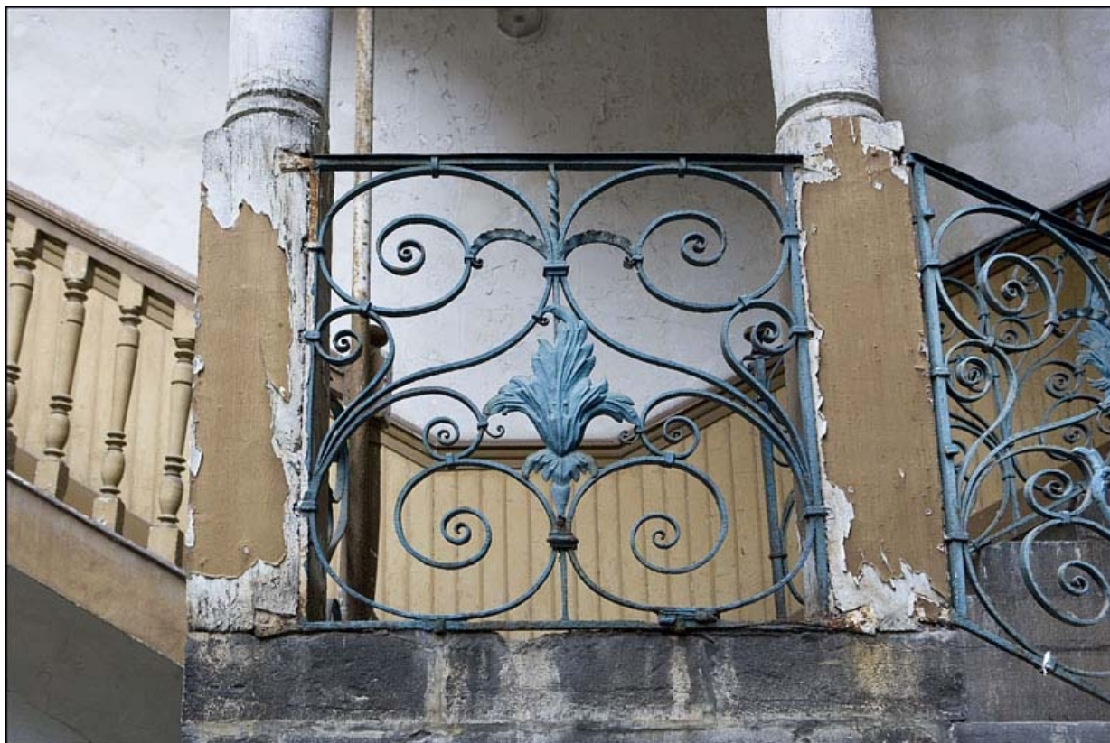
Détail d'une grille en ferronnerie du premier repos de l'escalier à cage ouverte.

25, Besançon Grande Rue 17, lieudit : îlot Chevanney