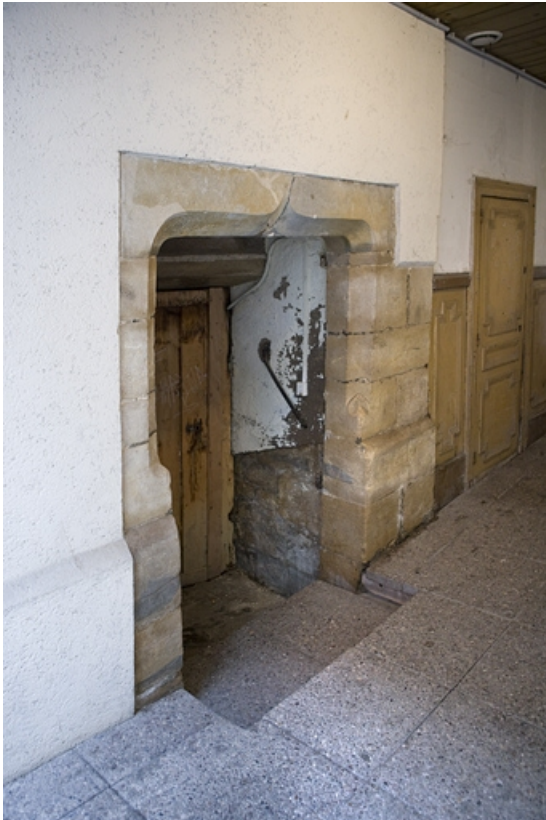
Premier logis secondaire : détail de la porte d'entrée de l'escalier en vis.

25, Besançon Grande Rue 17, lieudit : îlot Chevanney