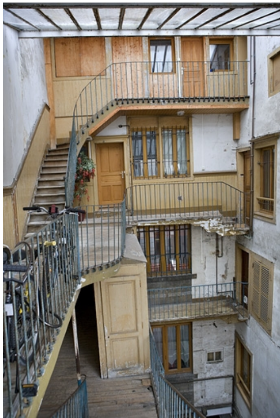
Vue d'ensemble de la façade postérieure du logis principal.

25, Besançon Grande Rue 17, lieudit : îlot Chevanney