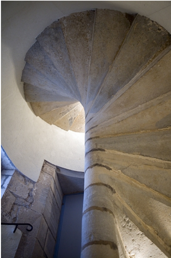
Premier logis secondaire : détail de l'escalier en vis avec la porte d'entrée.

25, Besançon Grande Rue 17, lieudit : îlot Chevanney