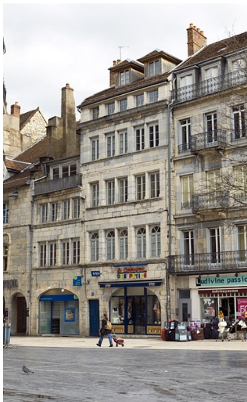
Vue d'ensemble de la façade antérieure du logis principal.

25, Besançon Grande Rue 17, lieudit : îlot Chevanney