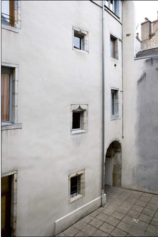
Façade postérieure du premier logis secondaire donnant sur la deuxième cour. 25, Besançon Grande Rue 17, lieudit : îlot Chevanney