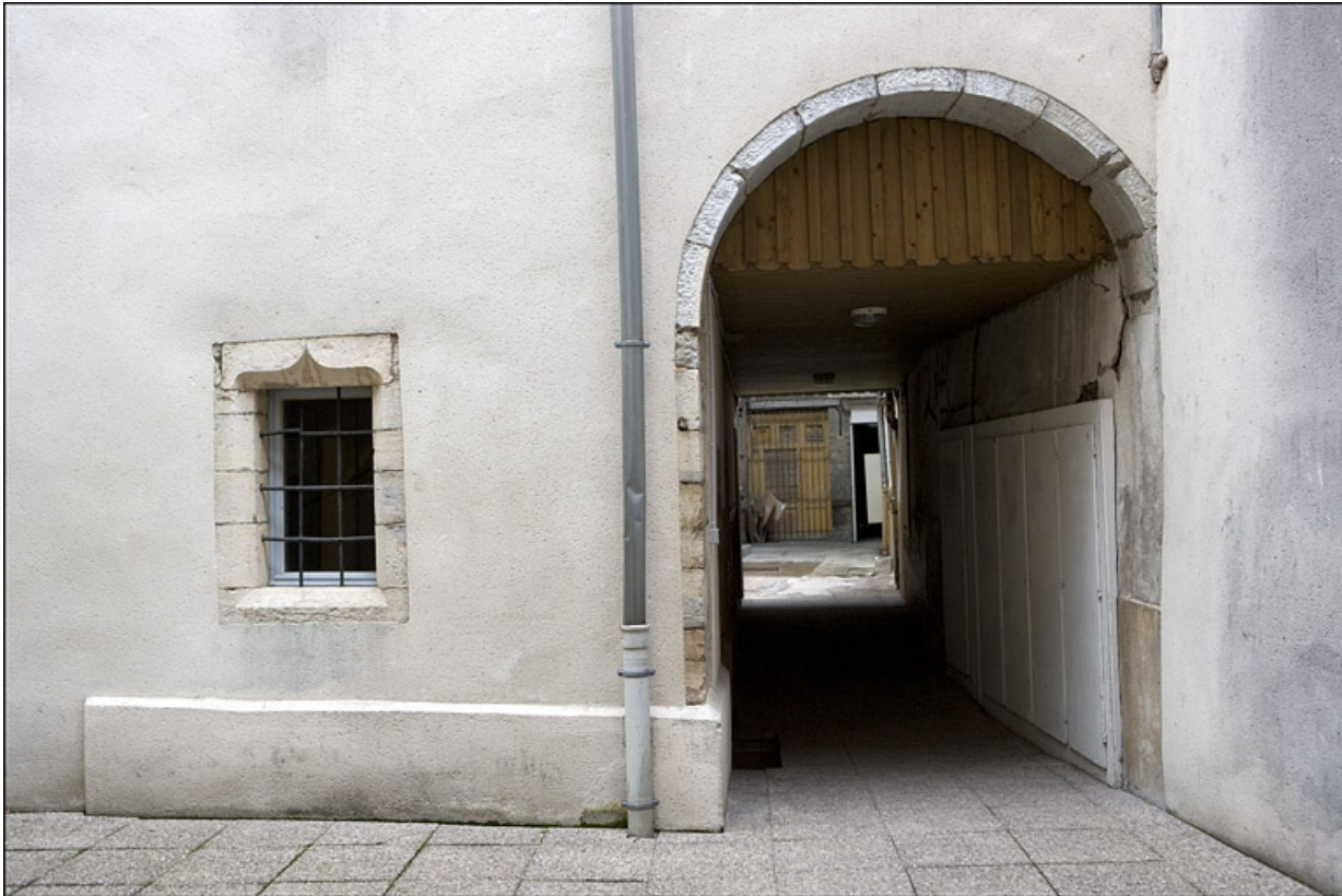
Premier logis secondaire, façade postérieure : détail du passage cocher.

25, Besançon Grande Rue 17, lieudit : îlot Chevanney