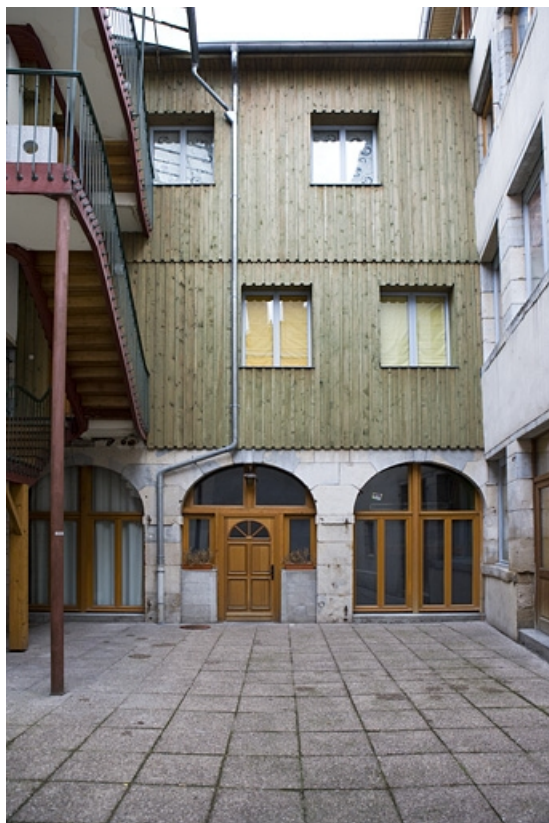
Deuxième cour : aile droite du logis secondaire avec d'anciennes dépendances artisanales au rez-de-chaussée. 25, Besançon Grande Rue 17, lieudit : îlot Chevanney