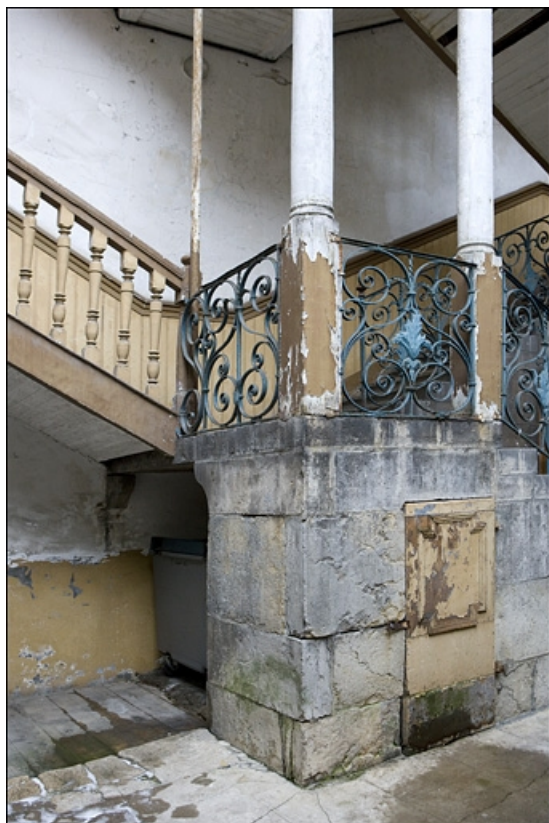
Détail du soubassement de l'escalier à cage ouverte et de l'entrée de cave.

25, Besançon Grande Rue 17, lieudit : îlot Chevanney