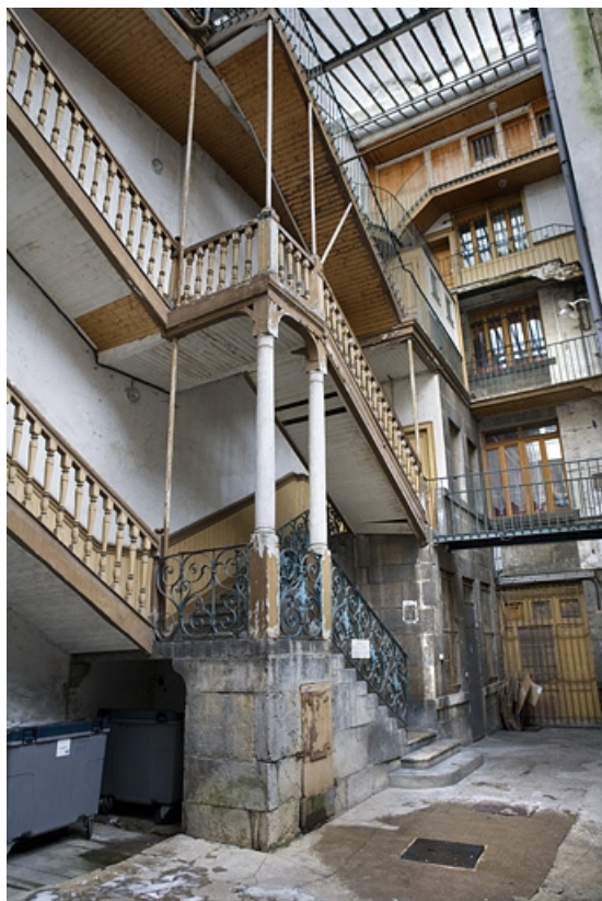
Vue d'ensemble de la façade postérieure du logis principal et de l'escalier à cage ouverte.

25, Besançon Grande Rue 17, lieudit : îlot Chevanney