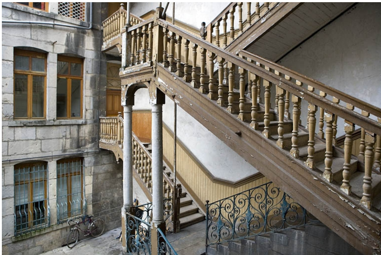
Détail de la partie inférieure de l'escalier à cage ouverte.

25, Besançon Grande Rue 17, lieudit : îlot Chevanney