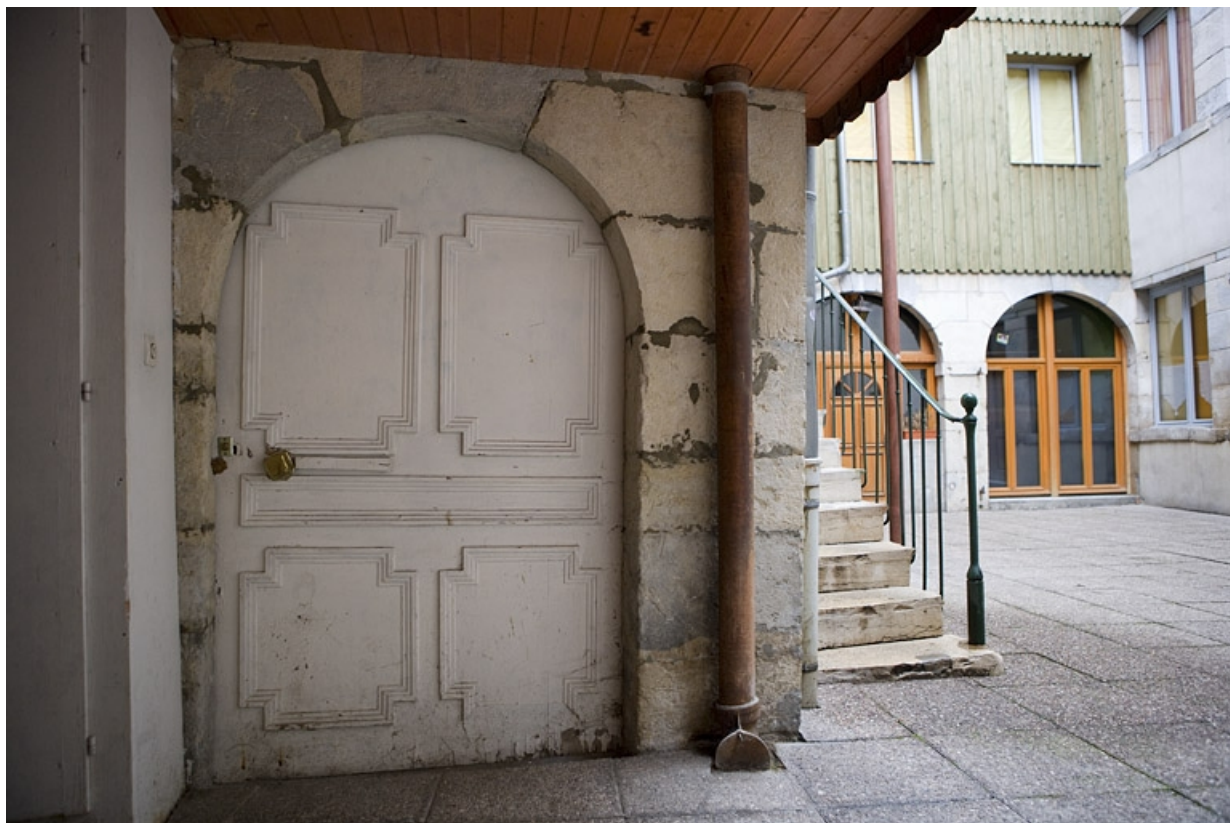
Logis secondaire dans la deuxième cour : détail d'une porte en plein cintre.

25, Besançon Grande Rue 17, lieudit : îlot Chevanney