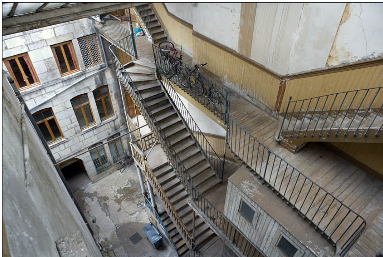
Vue d'ensemble de la façade antérieure du premier logis secondaire et de l'escalier à cage ouverte.

25, Besançon Grande Rue 17, lieudit : îlot Chevanney