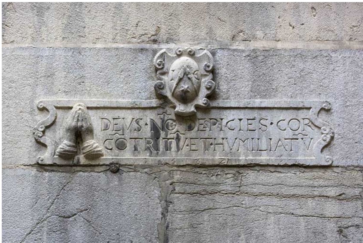
Façade antérieure du logis secondaire : détail d'une inscription.

25, Besançon, 11 Grande Rue, lieudit : îlot Chevanney