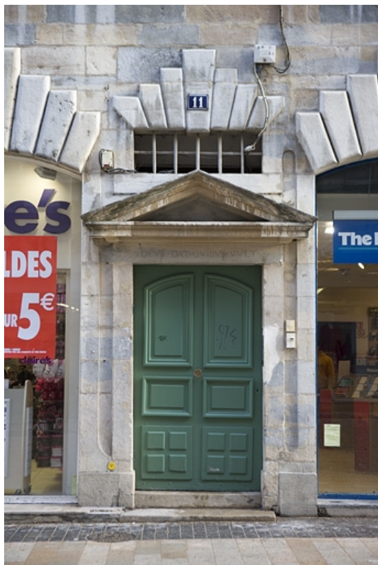
Façade antérieure du logis principal : détail de la porte d'entrée.

25, Besançon, 11 Grande Rue, lieudit : îlot Chevanney