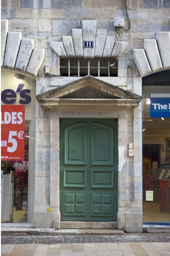
Façade antérieure du logis principal : détail de la porte d'entrée.

25, Besançon, 11 Grande Rue, lieudit : îlot Chevanney