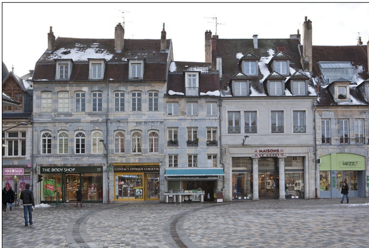
Vue d'ensemble de la façade antérieure, de face.

25, Besançon, 22, 24 place de la Révolution, lieudit : îlot Chevanney