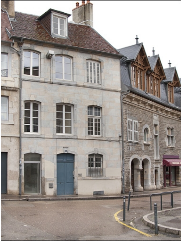
Vue d'ensemble de la façade donnant sur la rue Luc Breton.

25, Besançon, 22, 24 place de la Révolution, lieudit : îlot Chevanney