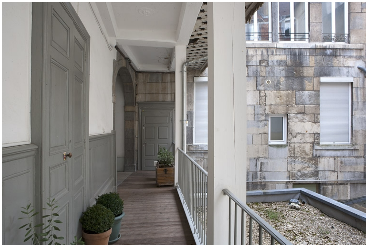
Détail d'une coursière au débouché de l'escalier.

25, Besançon, 22, 24 place de la Révolution, lieudit : îlot Chevanney