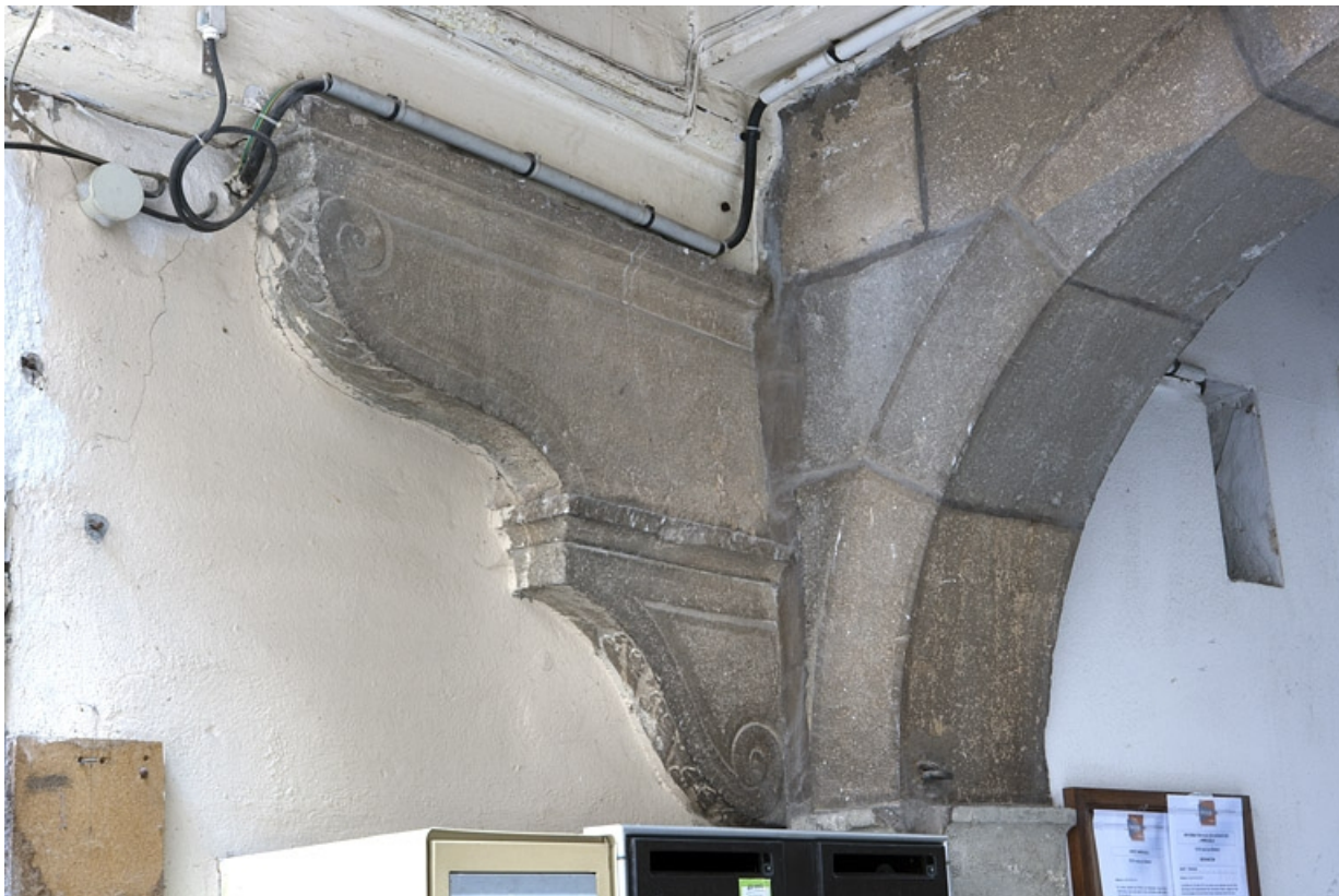
Détail d'une console soutenant la coursière.

25, Besançon, 22, 24 place de la Révolution, lieudit : îlot Chevanney