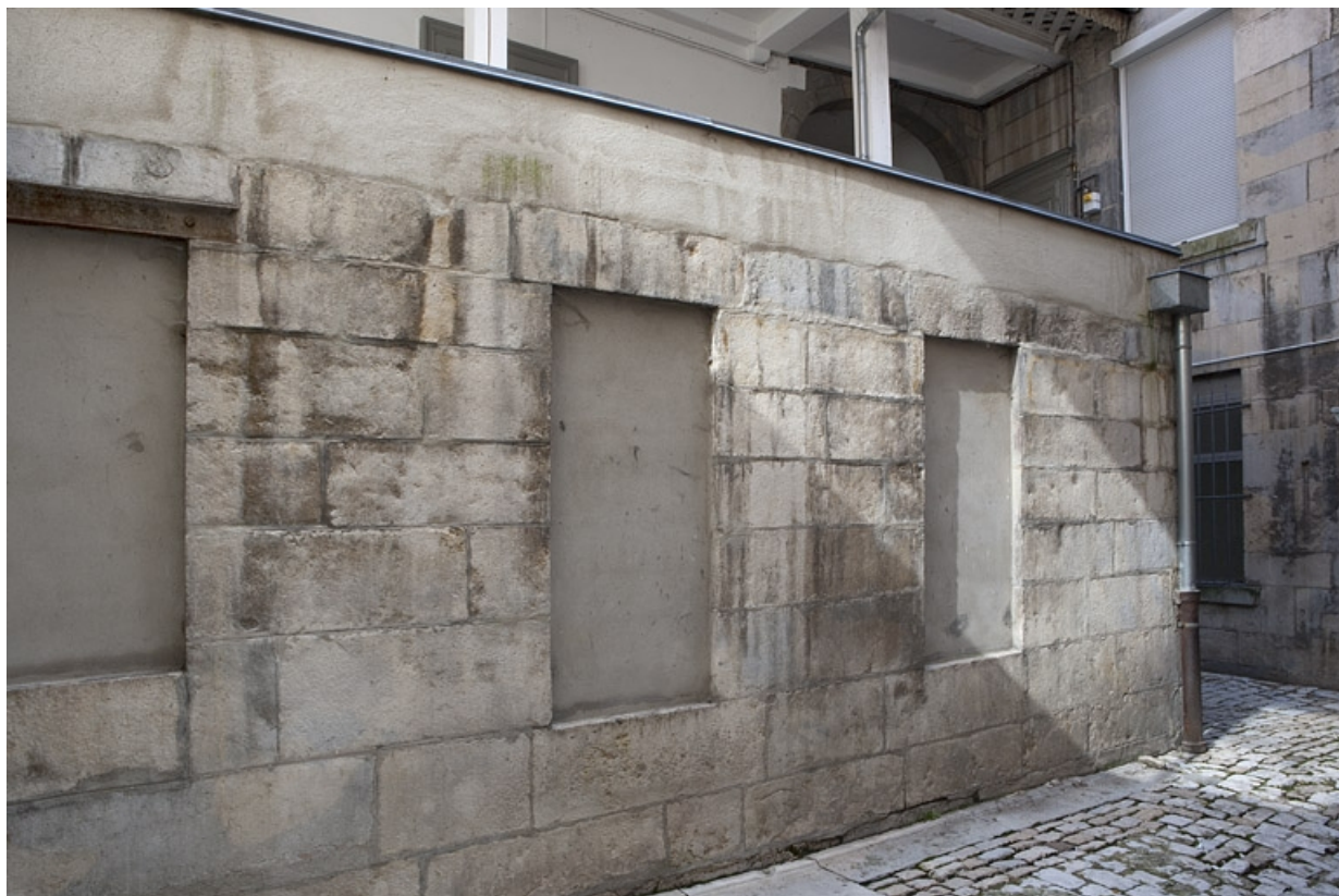
Détail d'une partie du rez-de-chaussée sur cour.

25, Besançon, 22, 24 place de la Révolution, lieudit : îlot Chevanney