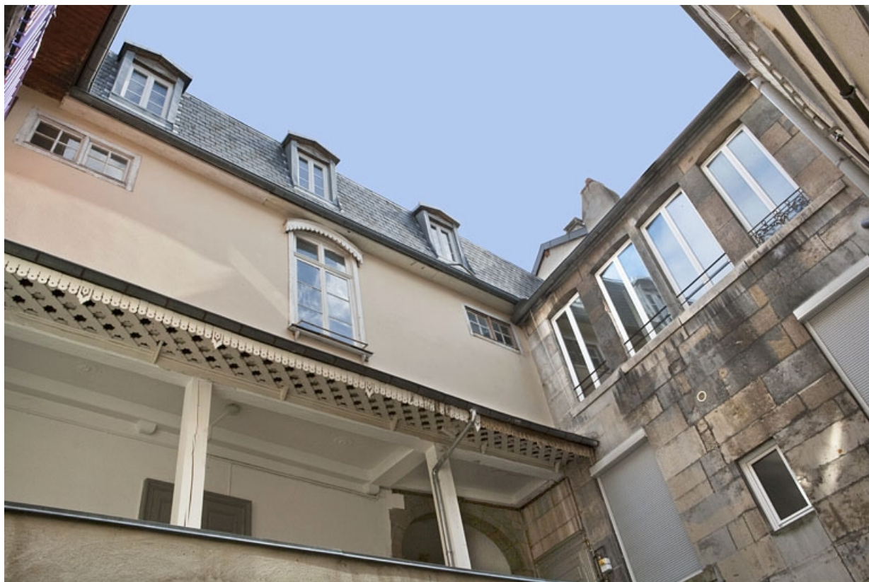
Détail d'une partie du dernier étage des façades sur cour.

25, Besançon, 22, 24 place de la Révolution, lieudit : îlot Chevanney