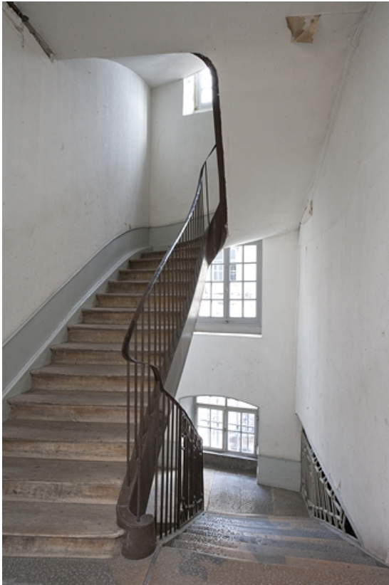
Détail de l'escalier : partie supérieure.

25, Besançon, 22, 24 place de la Révolution, lieudit : îlot Chevanney