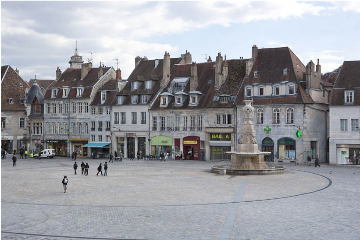
Vue d'ensemble éloignée dans l'alignement de la place.

25, Besançon, 22, 24 place de la Révolution, lieudit : îlot Chevanney