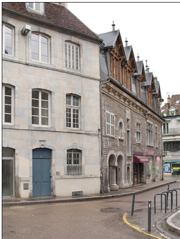
Vue d'ensemble de la façade située rue Luc Breton : de trois quarts gauche.

25, Besançon, 15 rue Luc Breton, lieudit : îlot Chevanney