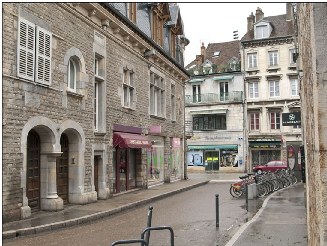
Vue d'ensemble de la façade située rue Luc Breton : de trois quarts gauche, vue rapprochée. 25, Besançon, 15 rue Luc Breton, lieudit : îlot Chevanney