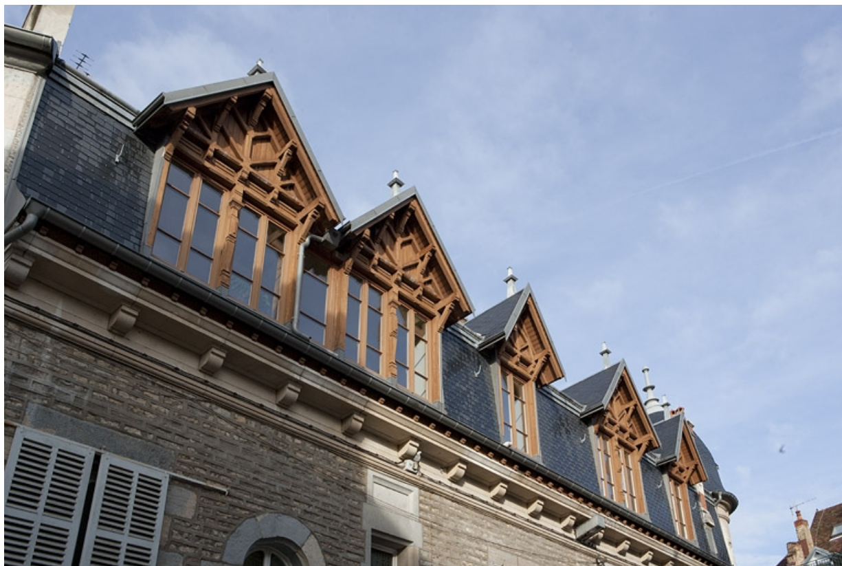
Toiture : détail des lucarnes donnant rue Luc Breton.

25, Besançon, 15 rue Luc Breton, lieudit : îlot Chevanney