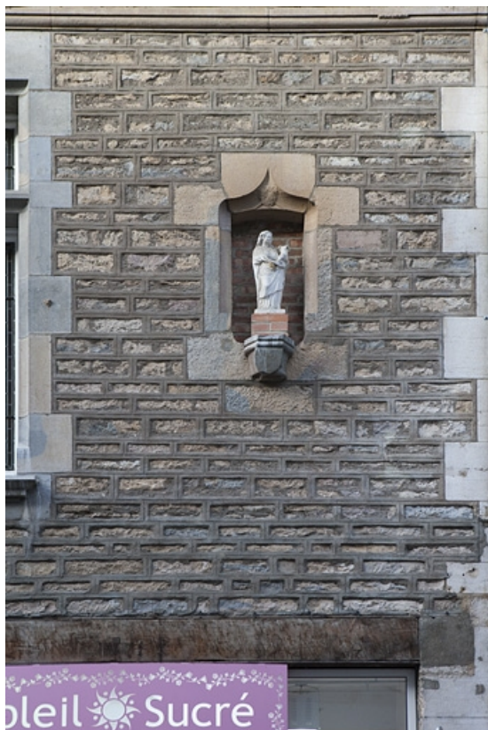
Façade rue Luc Breton : détail d'une niche.

25, Besançon, 15 rue Luc Breton, lieudit : îlot Chevanney