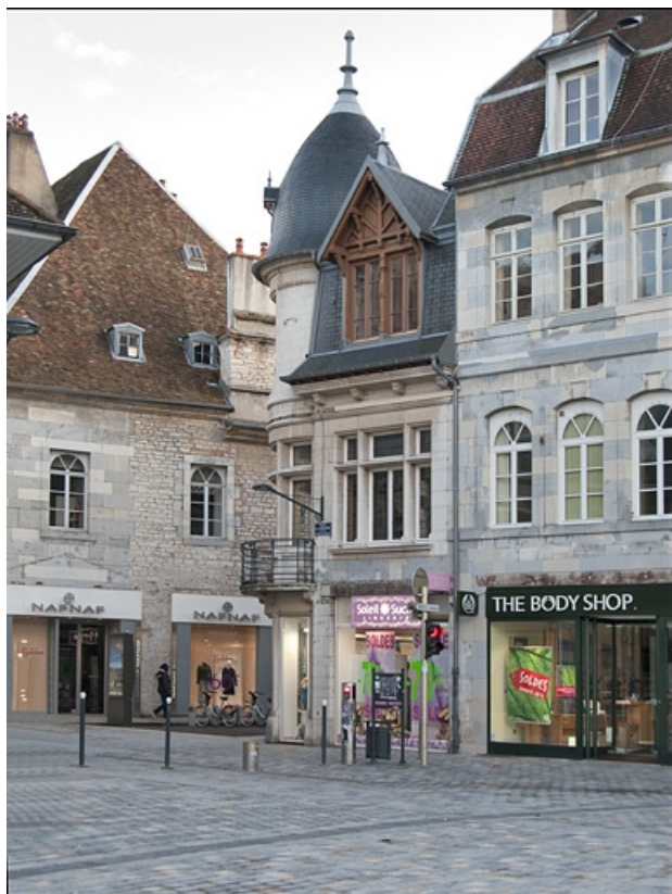
Vue d'ensemble de la façade située place de la Révolution : de trois quarts droit. 25, Besançon, 15 rue Luc Breton, lieudit : îlot Chevanney