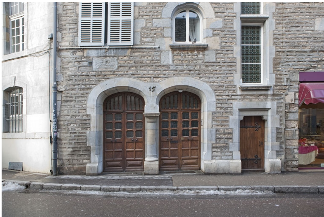
Façade rue Luc Breton : détail de l'entrée.

25, Besançon, 15 rue Luc Breton, lieudit : îlot Chevanney