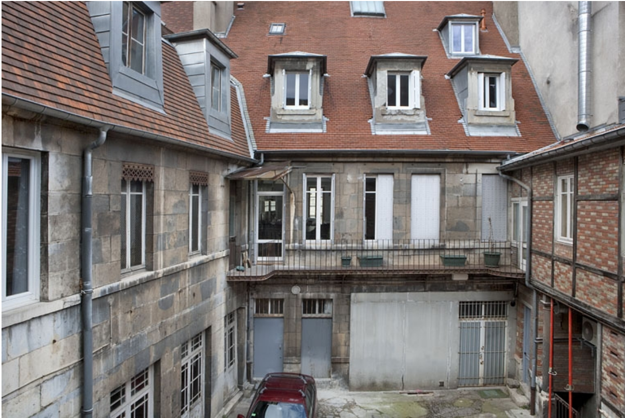
Vue d'ensemble de la façade postérieure du logis principal et d'une partie de l'aile droite.

25, Besançon, 16 place de la Révolution, lieudit : îlot Chevanney