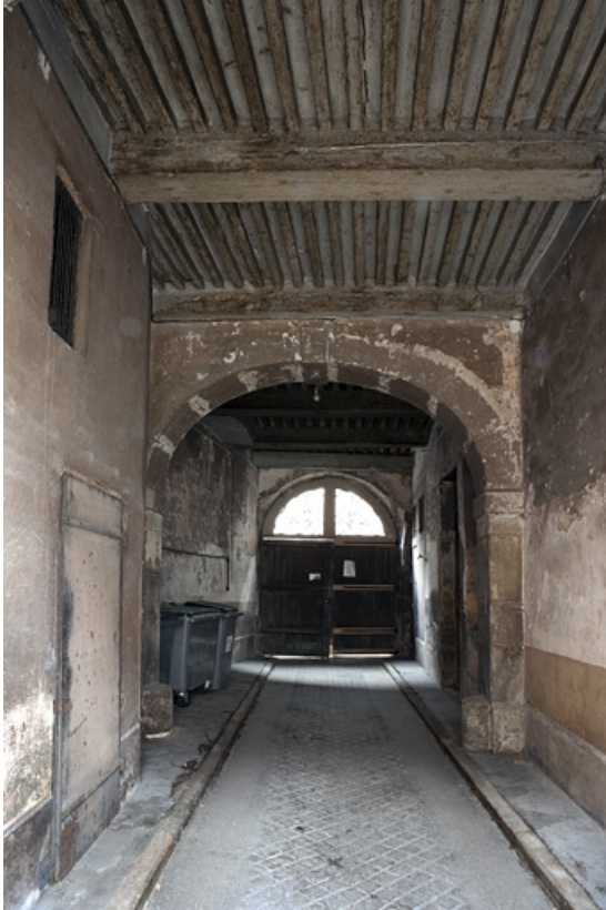
Vue d'ensemble du passage cocher, de face.

25, Besançon, 16 place de la Révolution, lieudit : îlot Chevanney