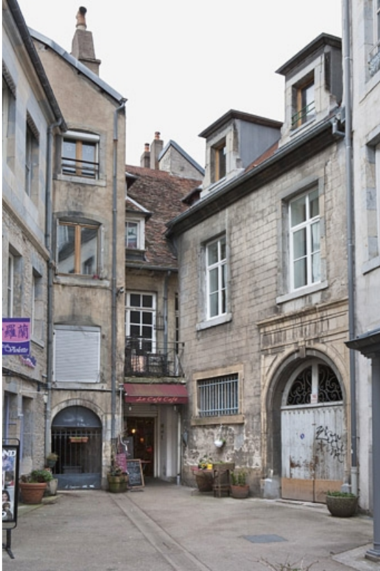
Façade postérieure des communs donnant sur l'impasse.

25, Besançon, 16 place de la Révolution, lieudit : îlot Chevanney