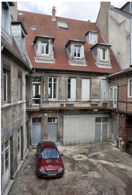
Vue d'ensemble de la façade postérieure du logis principal. 25, Besançon, 16 place de la Révolution, lieudit : îlot Chevanney