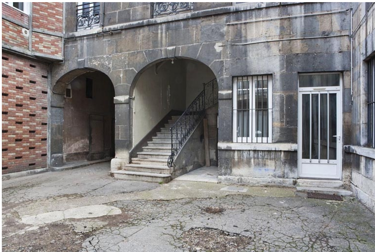
Détail de l'entrée du passage cocher et de l'escalier des communs.

25, Besançon, 16 place de la Révolution, lieudit : îlot Chevanney