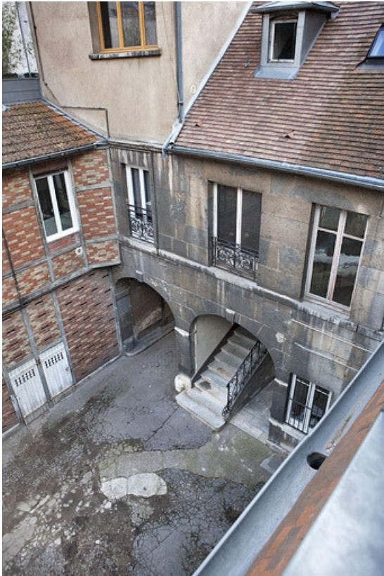
Vue d'ensemble de l'aile des communs en fond de cour.

25, Besançon, 16 place de la Révolution, lieudit : îlot Chevanney