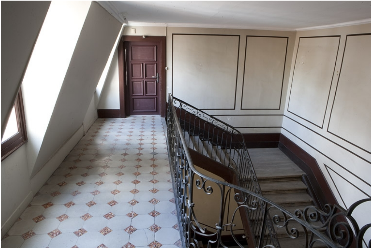
Détail du dernier palier de l'escalier principal.

25, Besançon, 16 place de la Révolution, lieudit : îlot Chevanney