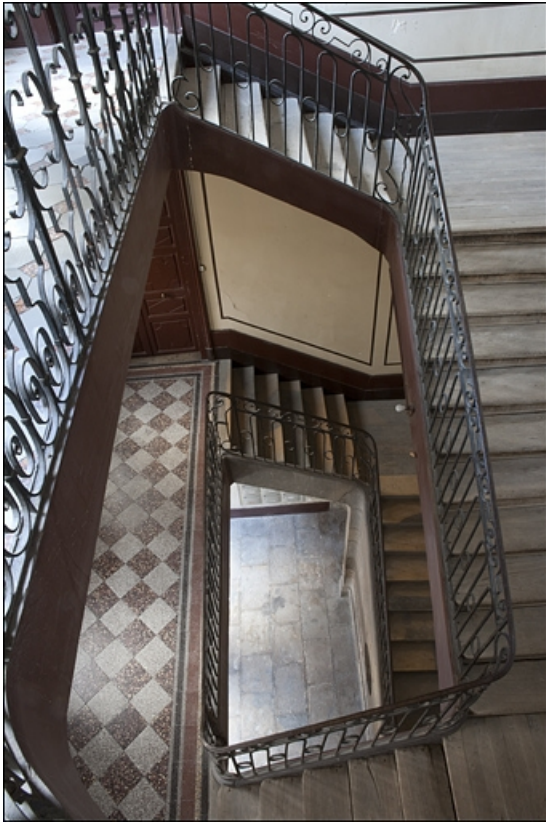
Vue d'ensemble de l'escalier principal depuis le dernier palier.

25, Besançon, 16 place de la Révolution, lieudit : îlot Chevanney