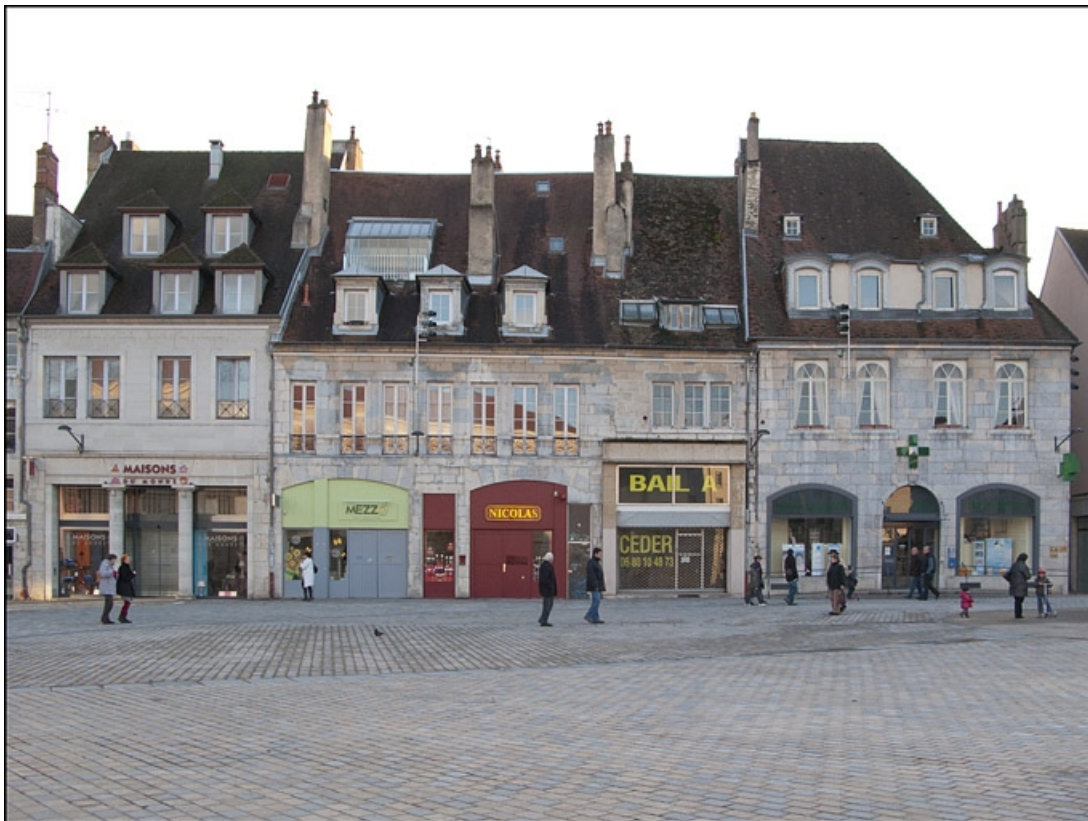
Vue d'ensemble de la façade antérieure dans l'alignement de la place.

25, Besançon, 16 place de la Révolution, lieudit : îlot Chevanney