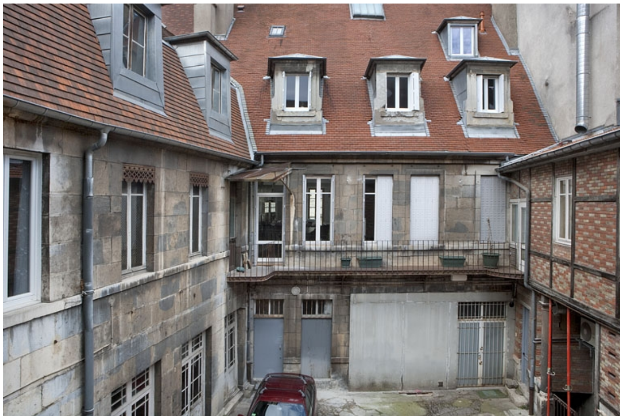
Vue d'ensemble de la façade postérieure du logis principal et d'une partie de l'aile droite.

25, Besançon, 16 place de la Révolution, lieudit : îlot Chevanney