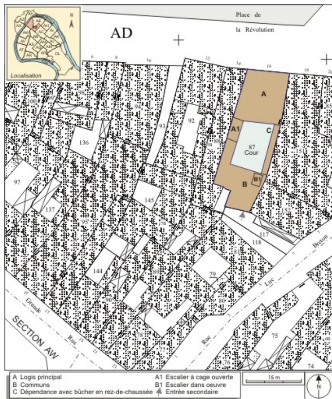
Plan masse et de situation. Extrait du plan cadastral, 1994, section AD. 25, Besançon, 16 place de la Révolution, lieudit : îlot Chevanney