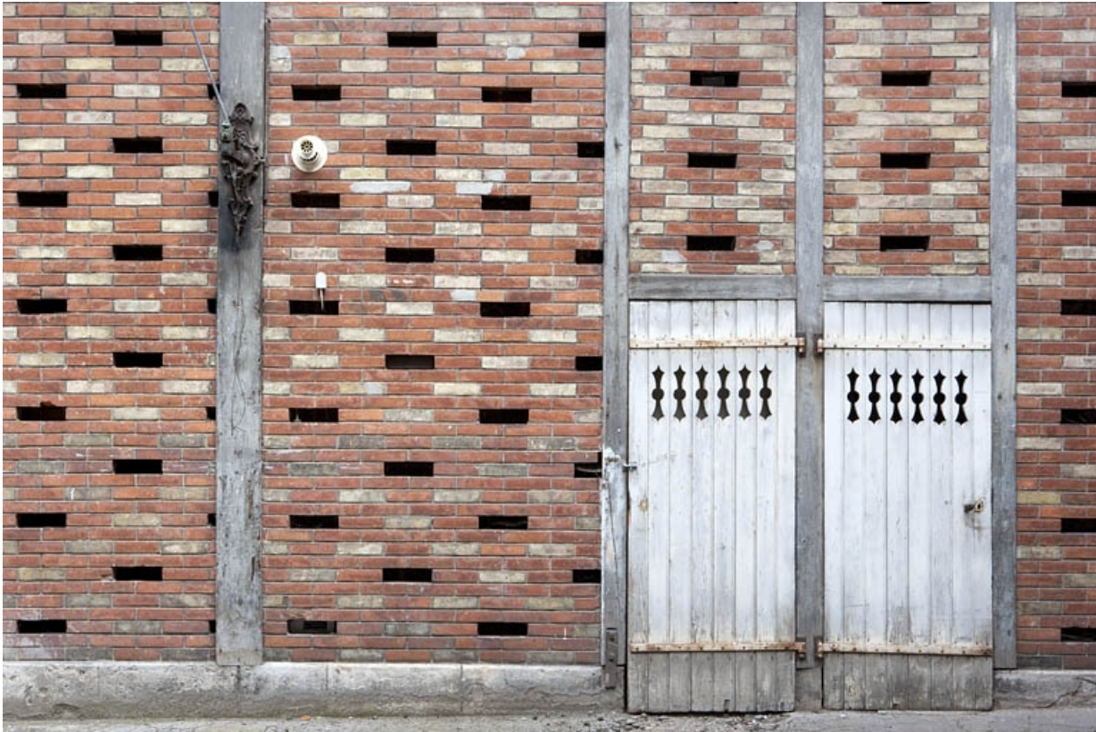
Détail de la façade en brique du bûcher.

25, Besançon, 16 place de la Révolution, lieudit : îlot Chevanney