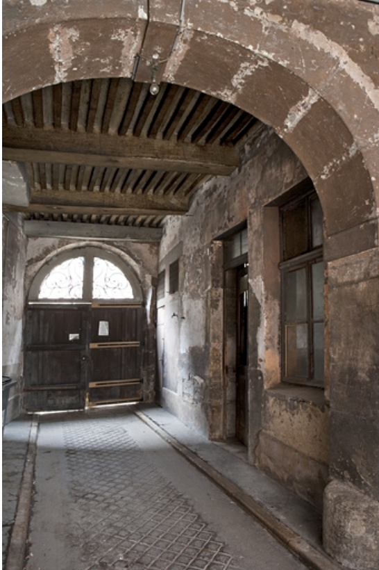
Vue d'ensemble du passage cocher, de trois quarts droit.

25, Besançon, 16 place de la Révolution, lieudit : îlot Chevanney