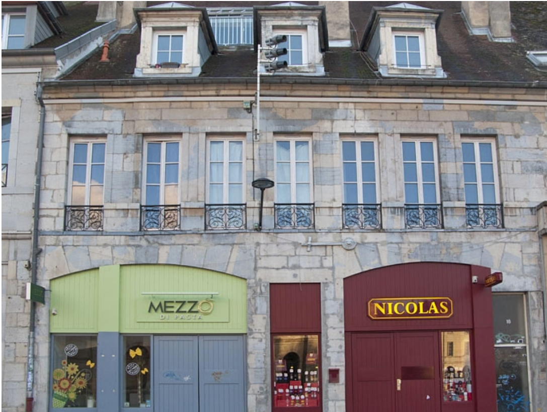
Vue d'ensemble rapprochée de la façade antérieure.

25, Besançon, 16 place de la Révolution, lieudit : îlot Chevanney