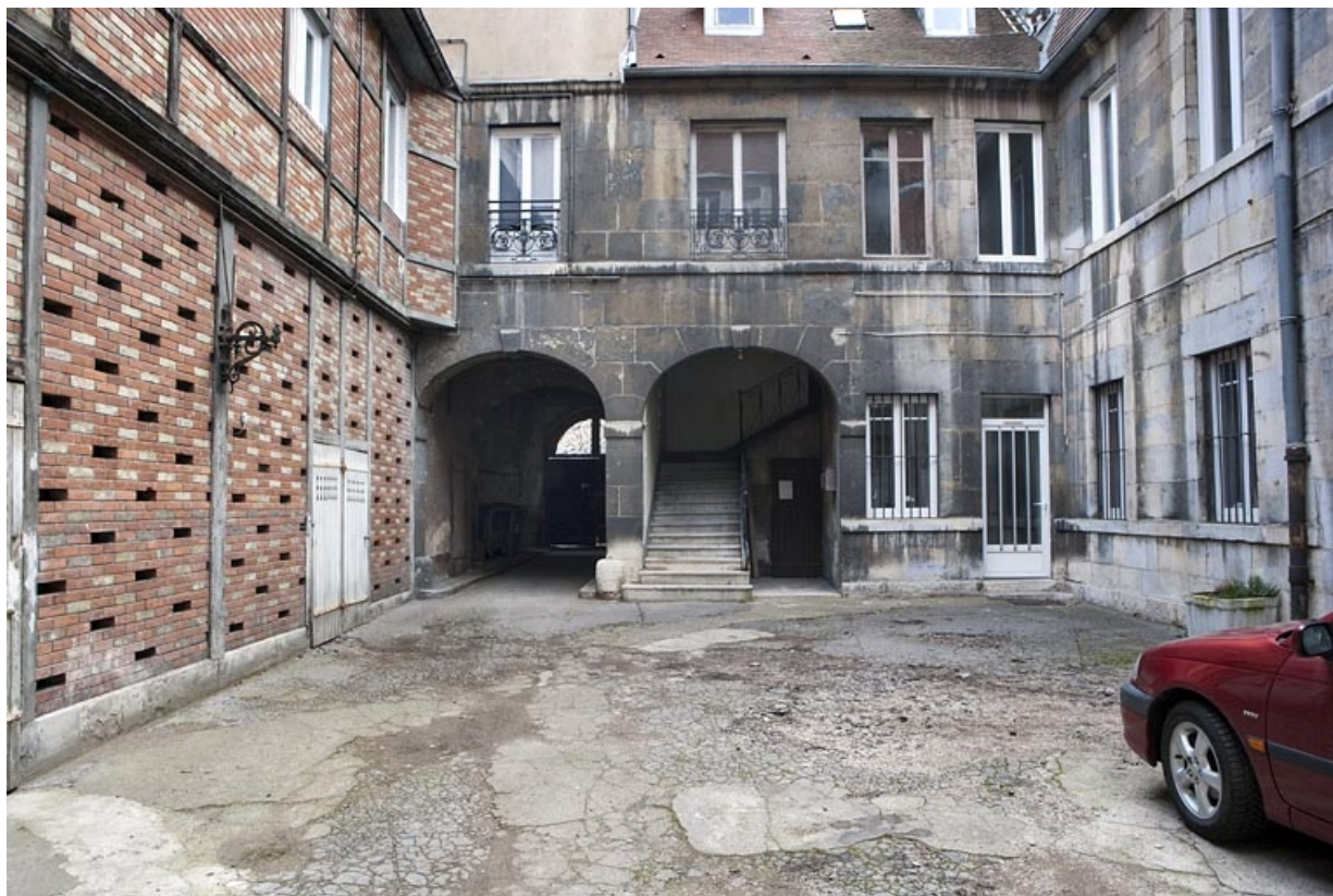
Vue d'ensemble des communs et du bûcher depuis l'entrée de la cour.

25, Besançon, 16 place de la Révolution, lieudit : îlot Chevanney