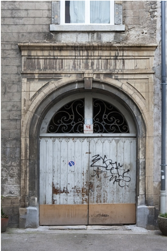
Détail de l'entrée du passage cocher donnant sur l'impasse : vue rapprochée. 25, Besançon, 16 place de la Révolution, lieudit : îlot Chevanney