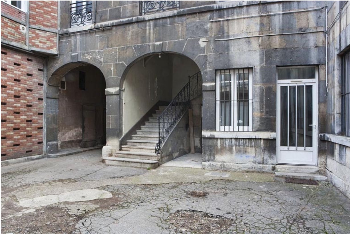
Détail de l'entrée du passage cocher et de l'escalier des communs.

25, Besançon, 16 place de la Révolution, lieudit : îlot Chevanney