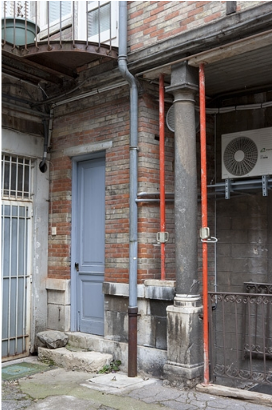
Détail d'une colonne en pierre à l'angle du bûcher.

25, Besançon, 16 place de la Révolution, lieudit : îlot Chevanney