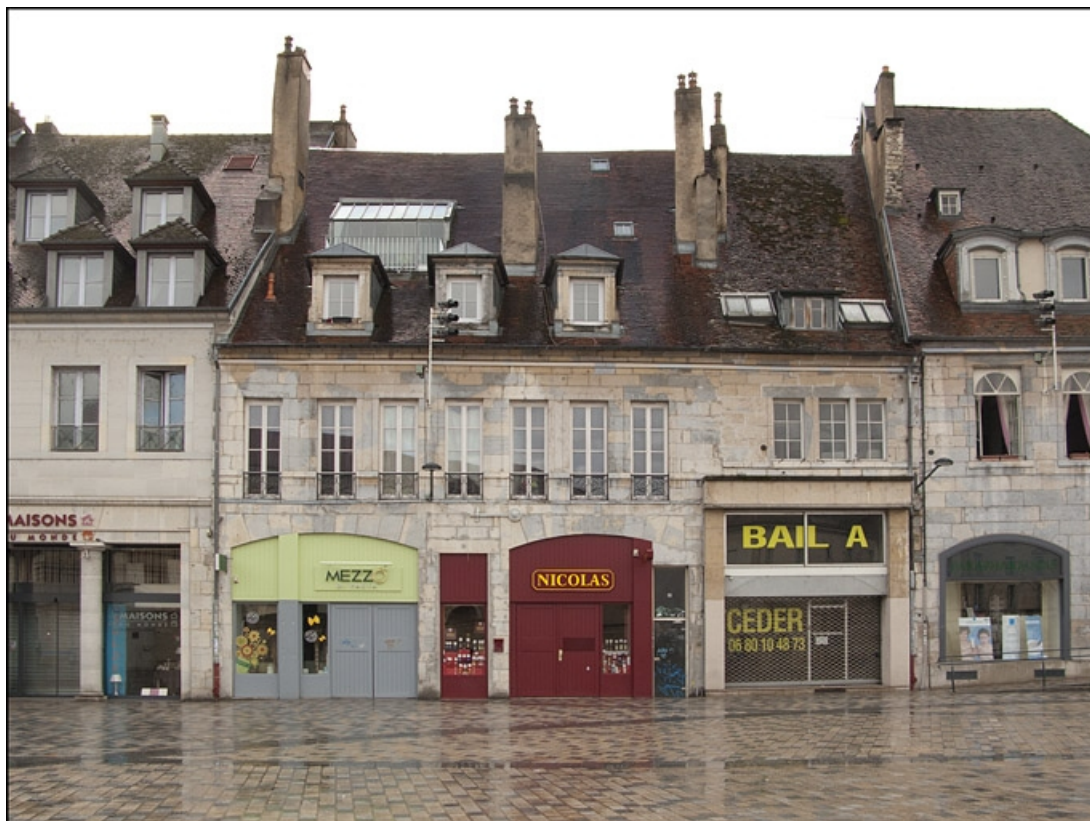
Vue d'ensemble de la façade antérieure, de face.

25, Besançon, 16 place de la Révolution, lieudit : îlot Chevanney