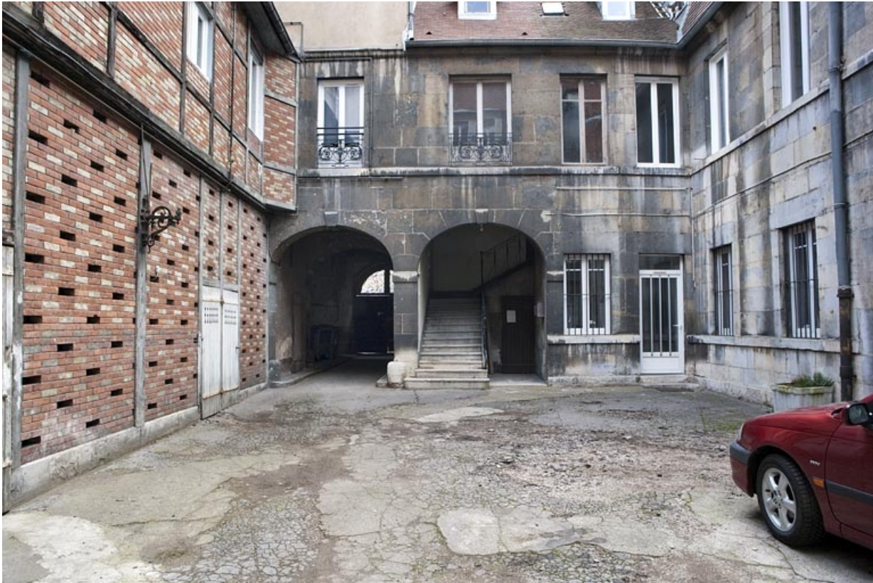
Vue d'ensemble des communs et du bûcher depuis l'entrée de la cour.

25, Besançon, 16 place de la Révolution, lieudit : îlot Chevanney