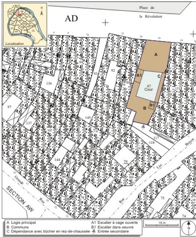
Plan masse et de situation. Extrait du plan cadastral, 1994, section AD. 25, Besançon, 16 place de la Révolution, lieudit : îlot Chevanney