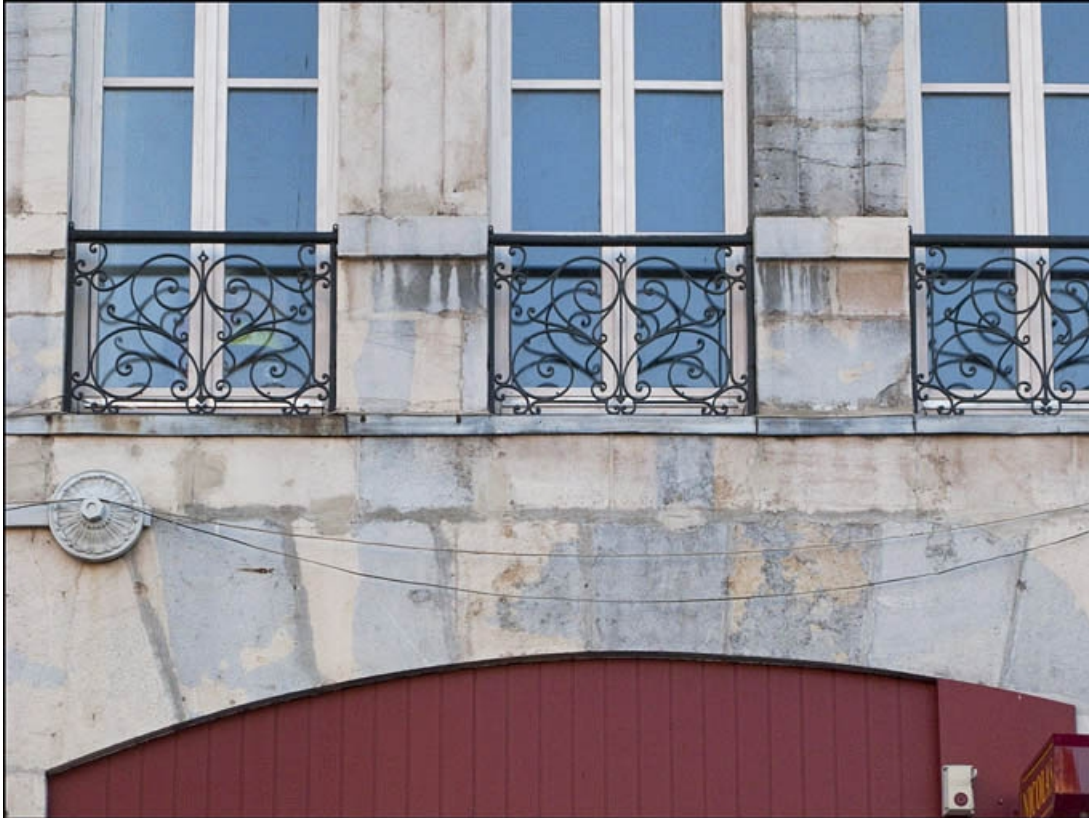
Façade antérieure : détail des garde-corps des fenêtres du premier étage.

25, Besançon, 16 place de la Révolution, lieudit : îlot Chevanney