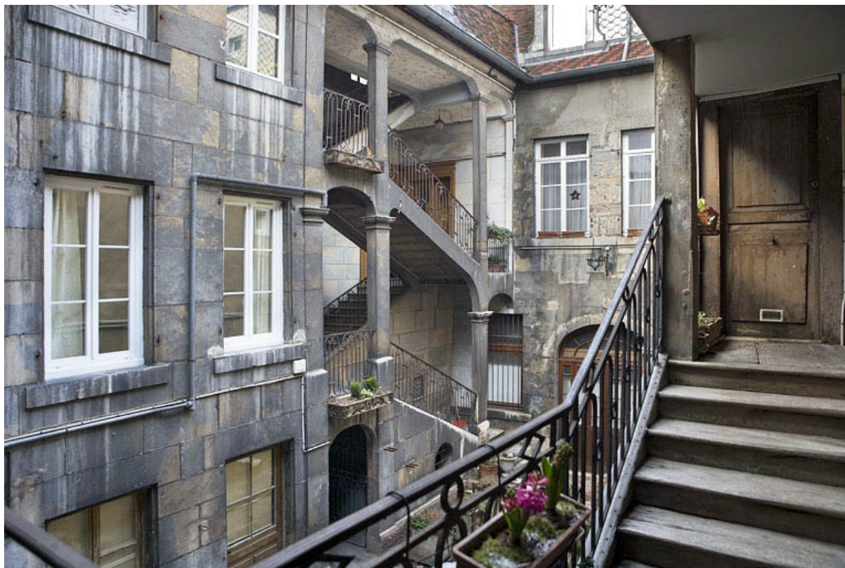
Vue de l'escalier à cage ouverte depuis celui des communs. 25, Besançon, 12 place de la Révolution, lieudit : îlot Chevanney