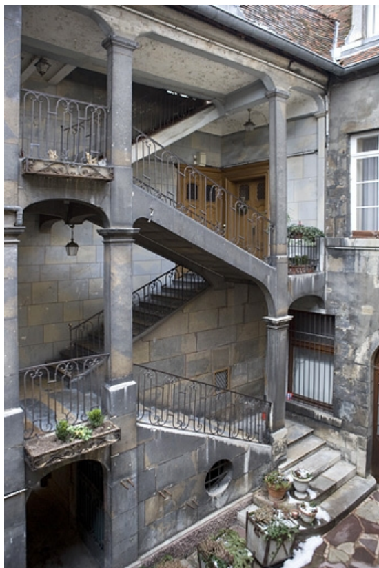
Détail de l'escalier à cage ouverte de trois quarts gauche.

25, Besançon, 12 place de la Révolution, lieudit : îlot Chevanney