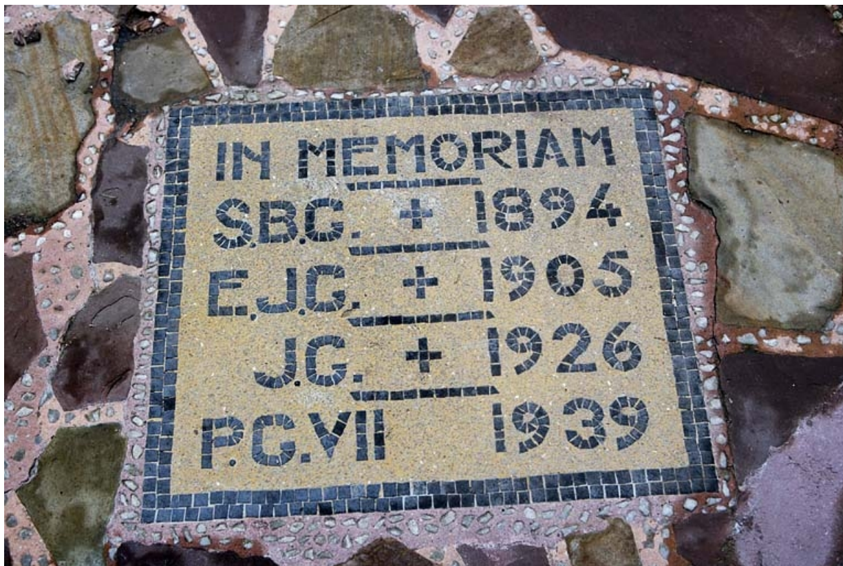
Détail d'une plaque commémorative, située dans la cour, en l'honneur des quatre derniers propriétaires de l'édifice. 25, Besançon, 12 place de la Révolution, lieudit : îlot Chevanney