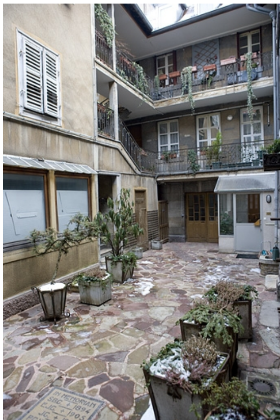
Vue d'ensemble des communs en fond de parcelle et du logis secondaire, à gauche de la cour. 25, Besançon, 12 place de la Révolution, lieudit : îlot Chevanney