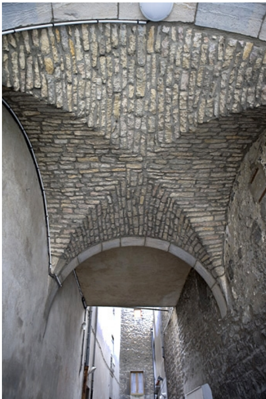
Détail de la voûte du passage au-dessus de l'ancien trage. 25, Besançon, 12 place de la Révolution, lieudit : îlot Chevanney