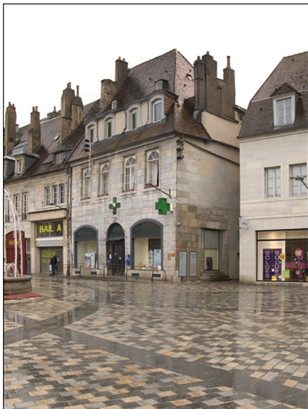
Vue d'ensemble du logis principal de trois quarts droit. 25, Besançon, 12 place de la Révolution, lieudit : îlot Chevanney