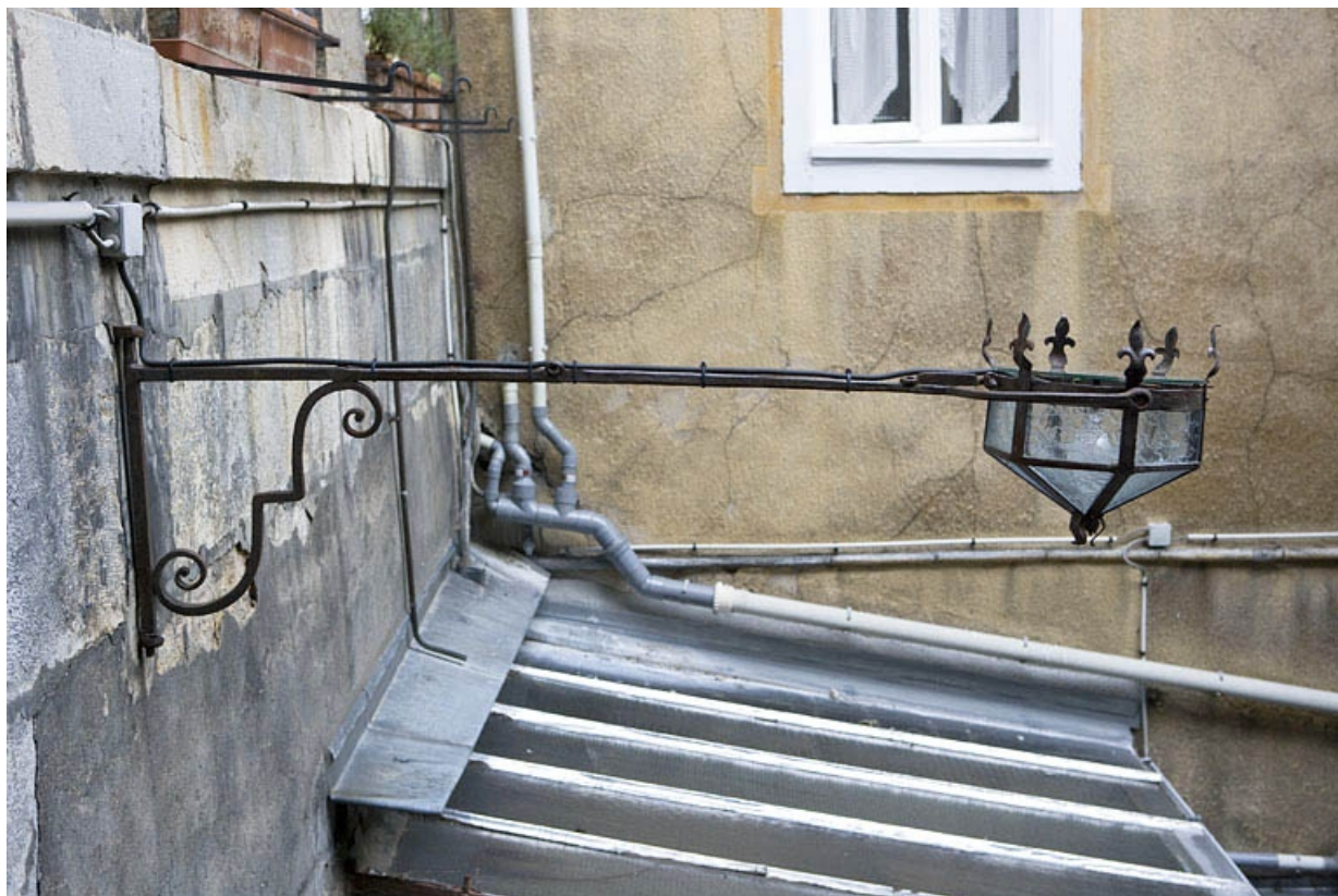
Détail du bras de lumière sur la façade postérieure du logis principal.

25, Besançon, 12 place de la Révolution, lieudit : îlot Chevanney