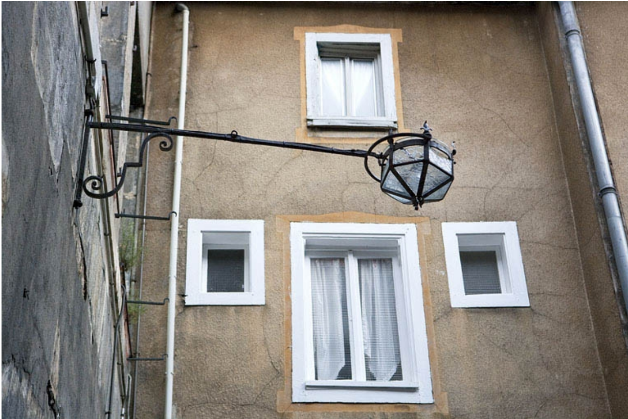
Détail du bras de lumière sur la façade postérieure du logis principal.

25, Besançon, 12 place de la Révolution, lieudit : îlot Chevanney