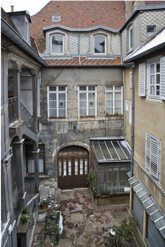
Façade postérieure du logis principal depuis les communs, de face. 25, Besançon, 12 place de la Révolution, lieudit : îlot Chevanney