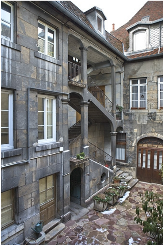
Vue d'ensemble de l'escalier à cage ouverte de trois quarts gauche.

25, Besançon, 12 place de la Révolution, lieudit : îlot Chevanney