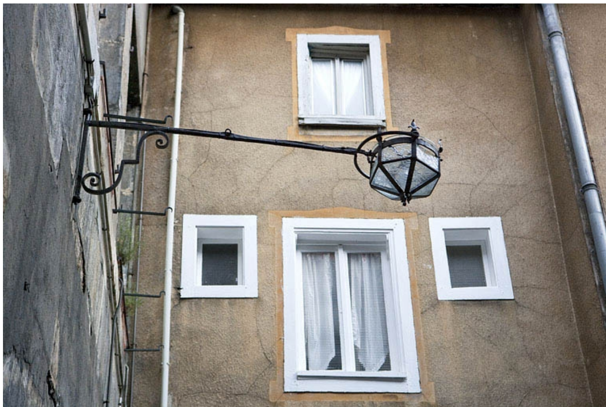
Détail du bras de lumière sur la façade postérieure du logis principal.

25, Besançon, 12 place de la Révolution, lieudit : îlot Chevanney