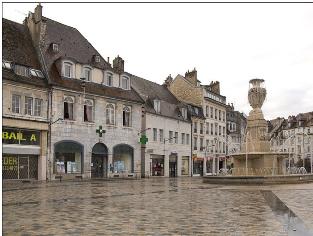
Vue d'ensemble du logis principal de trois quarts gauche dans l'alignement de la place.

25, Besançon, 12 place de la Révolution, lieudit : îlot Chevanney