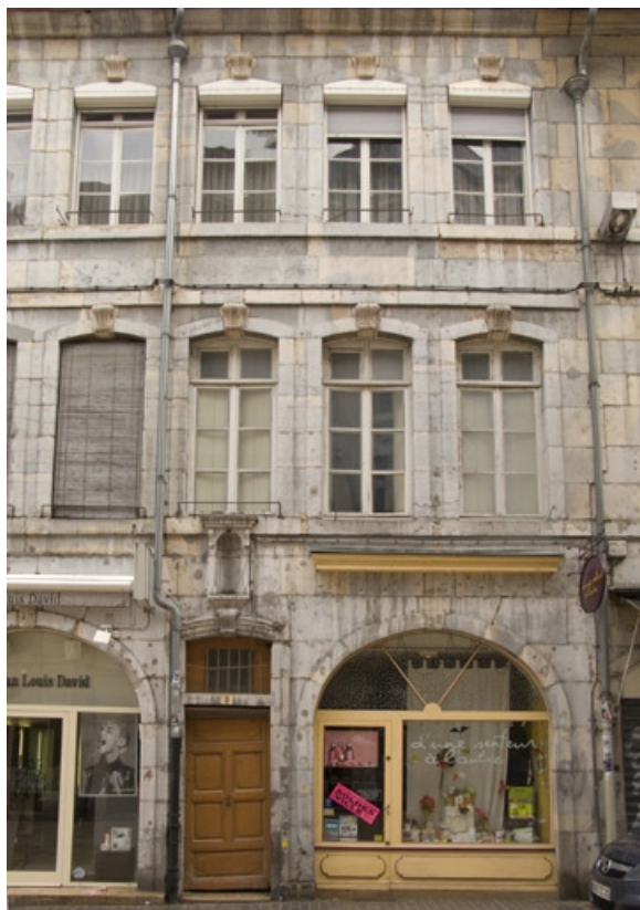
Vue d'ensemble de la façade antérieure du logis principal, de face.

25, Besançon Grande Rue 3, lieu dit : îlot Chevanney