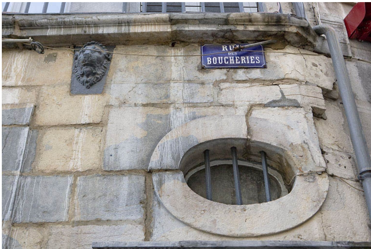
Détail de l'oculus au-dessus du linteau de porte du logis secondaire, rue des Boucheries. 25, Besançon Grande Rue 3, lieudit : îlot Chevanney