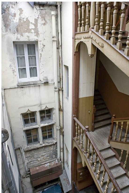
Façade sur cour du logis secondaire depuis l'escalier à cage ouverte.

25, Besançon Grande Rue 3, lieudit : îlot Chevanney