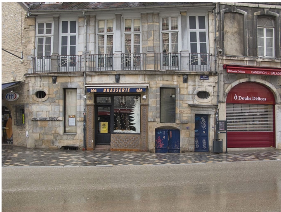
Détail de la façade antérieure du logis secondaire, rue des Boucheries.

25, Besançon Grande Rue 3, lieudit : îlot Chevanney