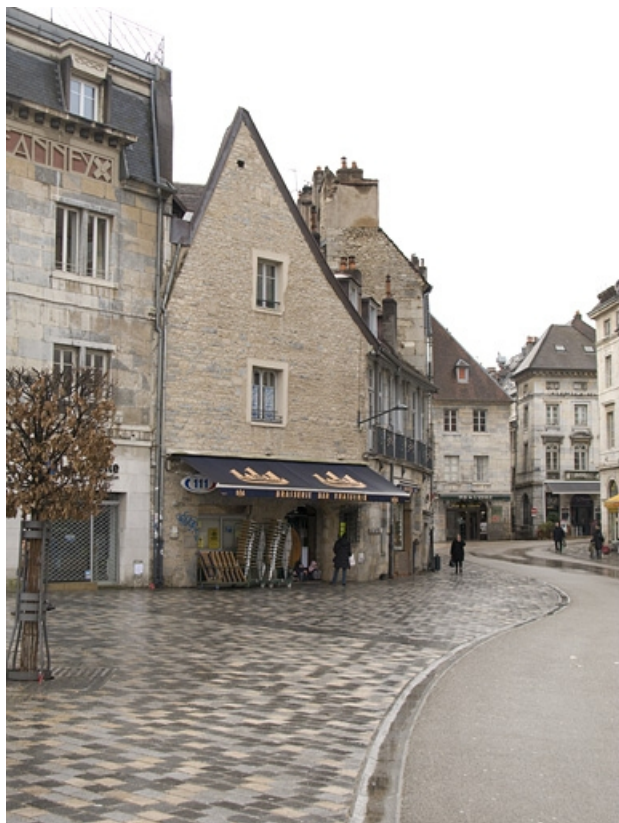
Vue d'ensemble de la façade sur pignon du logis secondaire, depuis la rue des Boucheries. 25, Besançon Grande Rue 3, lieudit : îlot Chevanney