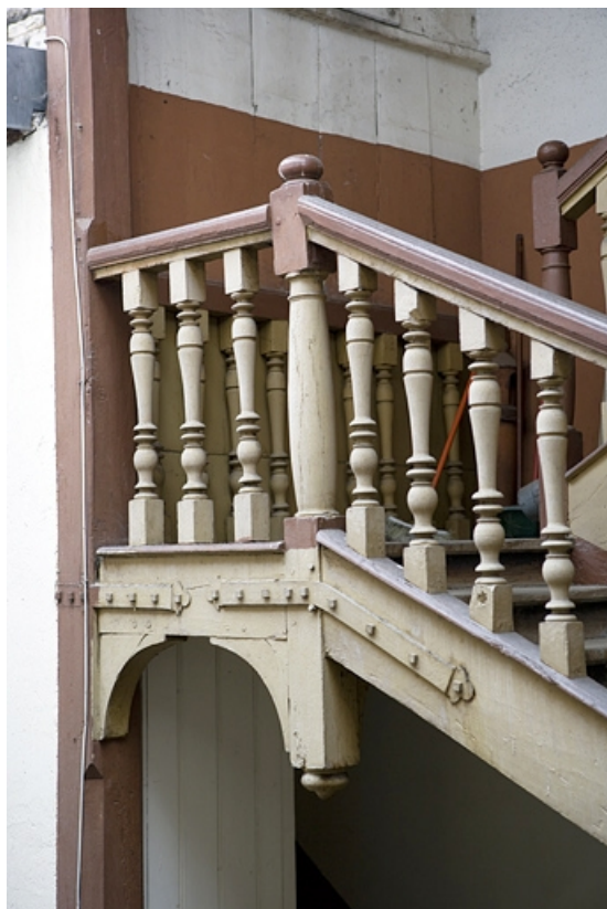
Détail des balustres de l'escalier à cage ouverte sur cour.

25, Besançon Grande Rue 3, lieudit : îlot Chevanney