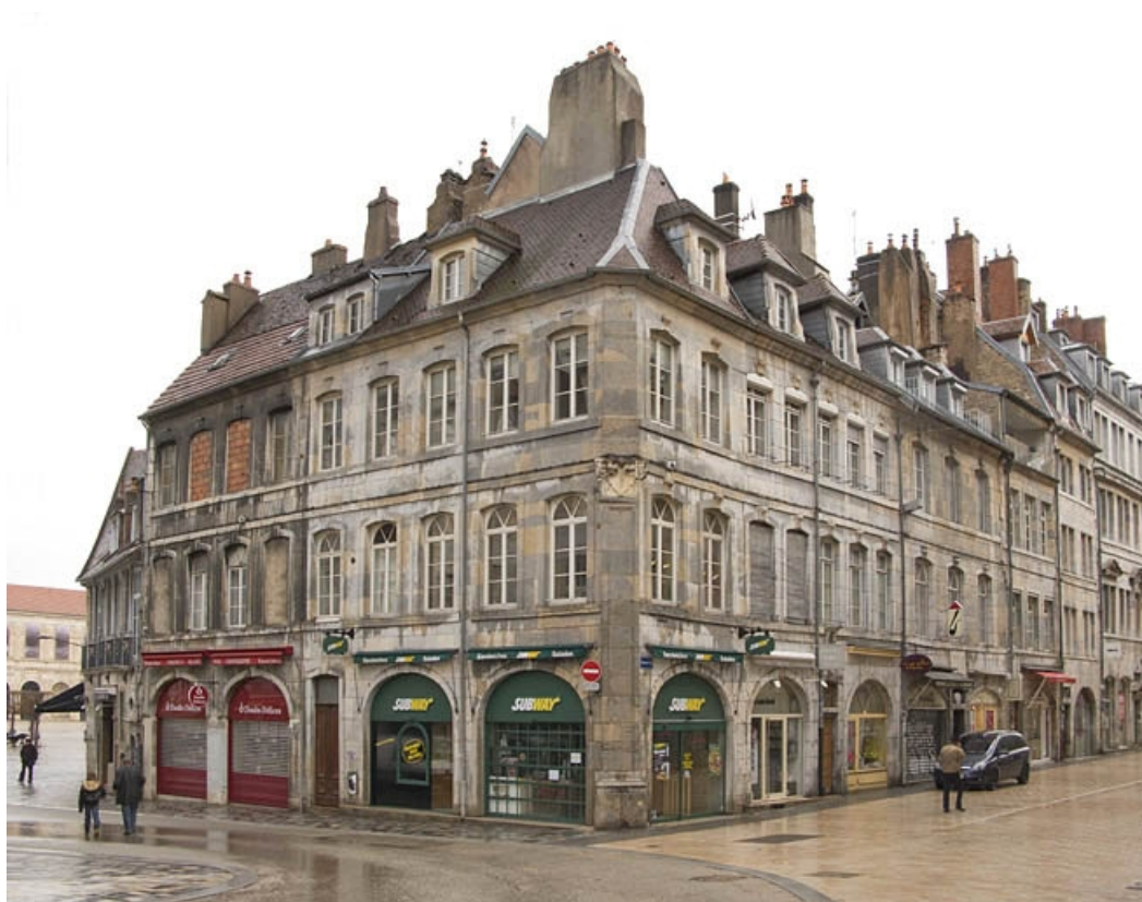
Vue d'ensemble depuis l'angle de la rue des Boucheries et de la Grande Rue.

25, Besançon Grande Rue 3, lieudit : îlot Chevanney