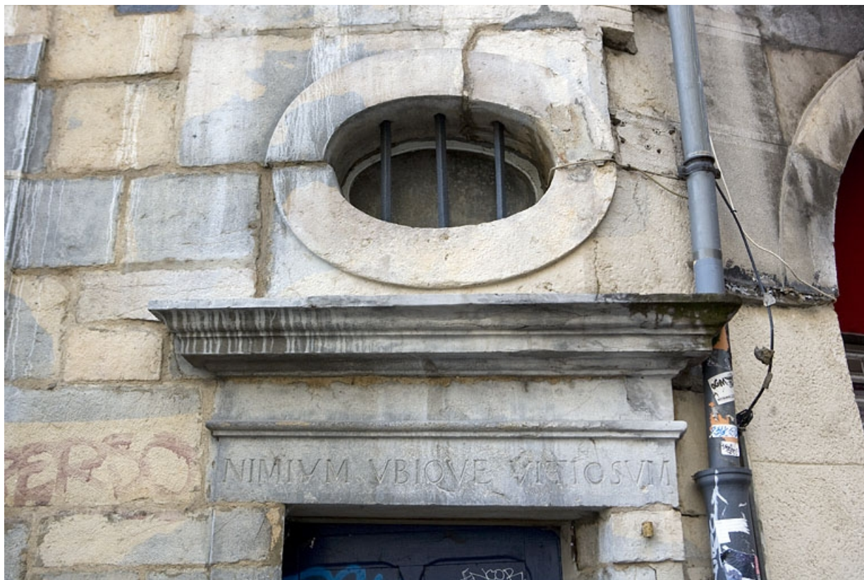
Détail du linteau de porte avec inscription du logis secondaire, rue des Boucheries.

25, Besançon Grande Rue 3, lieudit : îlot Chevanney