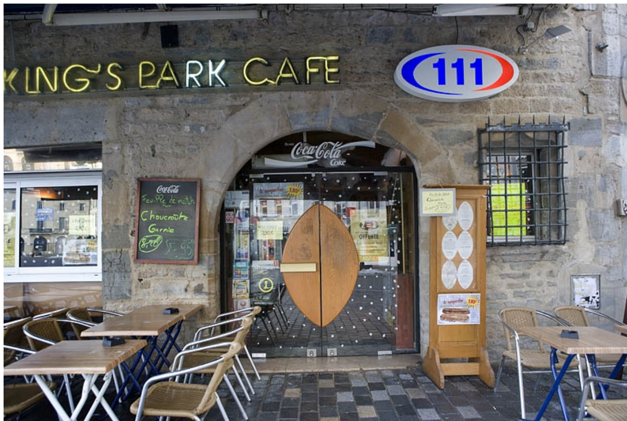
Détail de l'entrée : façade sur pignon du logis secondaire.

25, Besançon Grande Rue 3, lieu-dit : îlot Chevanney