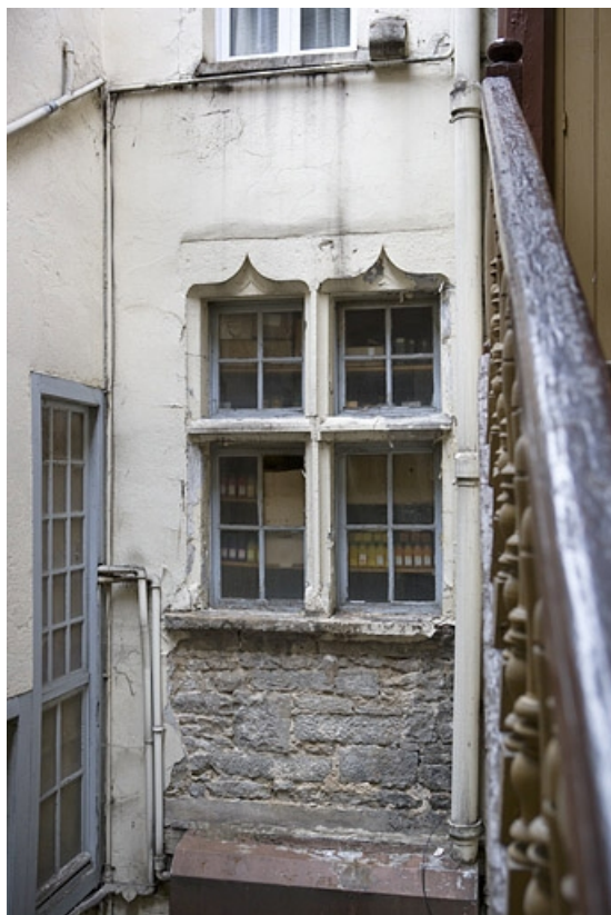
Logis secondaire : détail de la fenêtre en accolade sur cour.

25, Besançon Grande Rue 3, lieudit : îlot Chevanney