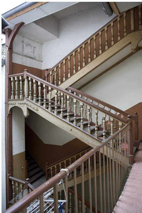
Vue d'ensemble de l'escalier à cage ouverte sur cour.

25, Besançon Grande Rue 3, lieudit : îlot Chevanney