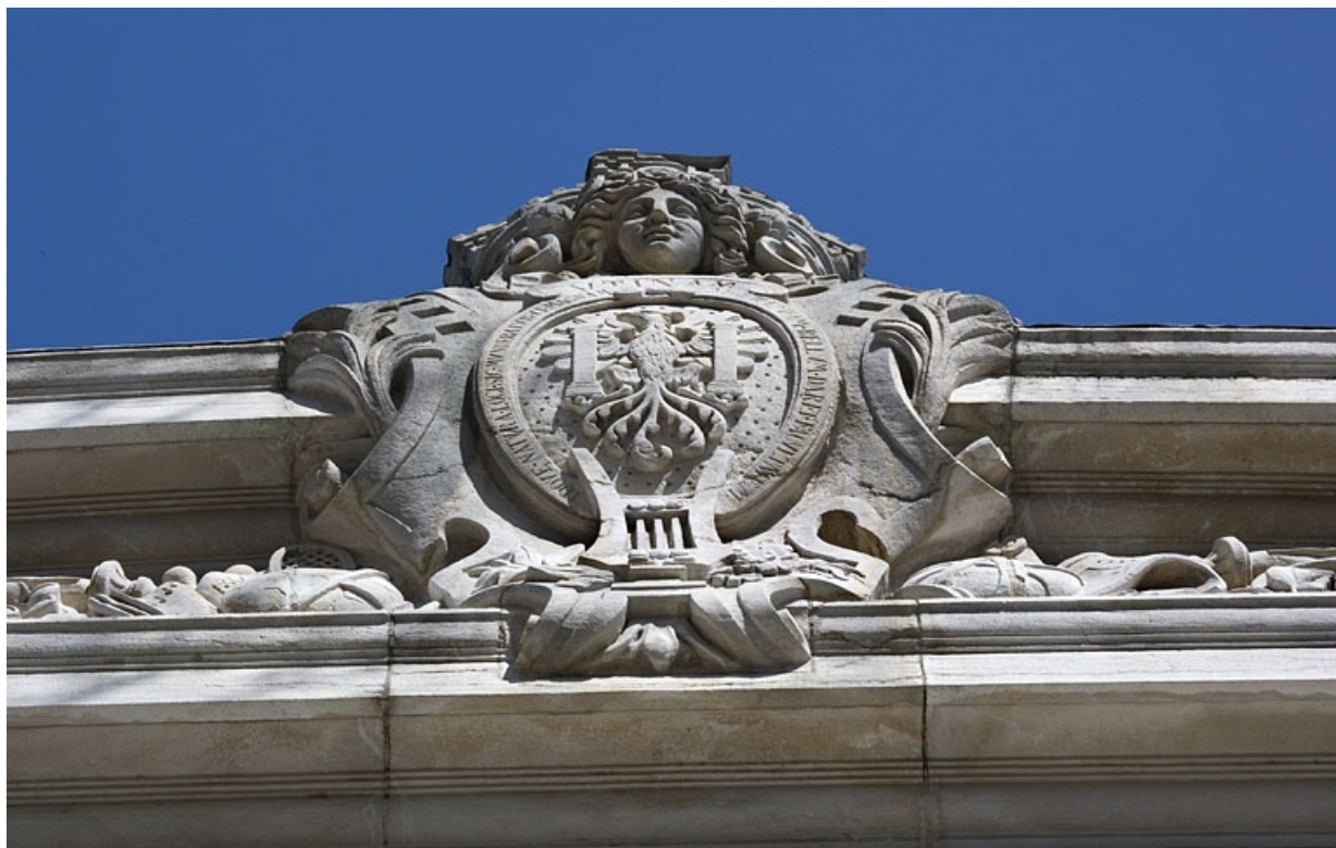
Détail de la partie centrale du fronton avec les armes de la ville, de face.

25, Besançon, 10 place du Théâtre, lieudit : îlot Granvelle