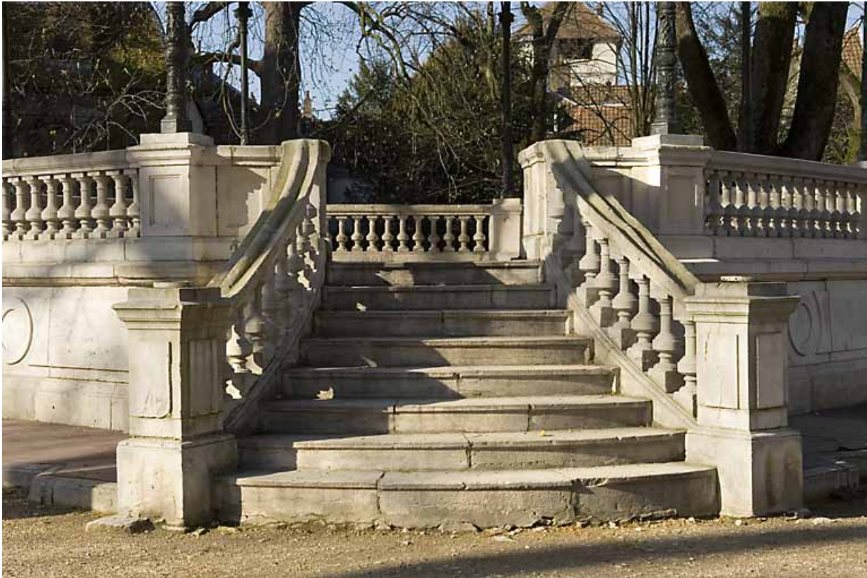
Kiosque : détail de la montée d'escalier.

25, Besançon rue de la Préfecture, lieudit : îlot Granvelle