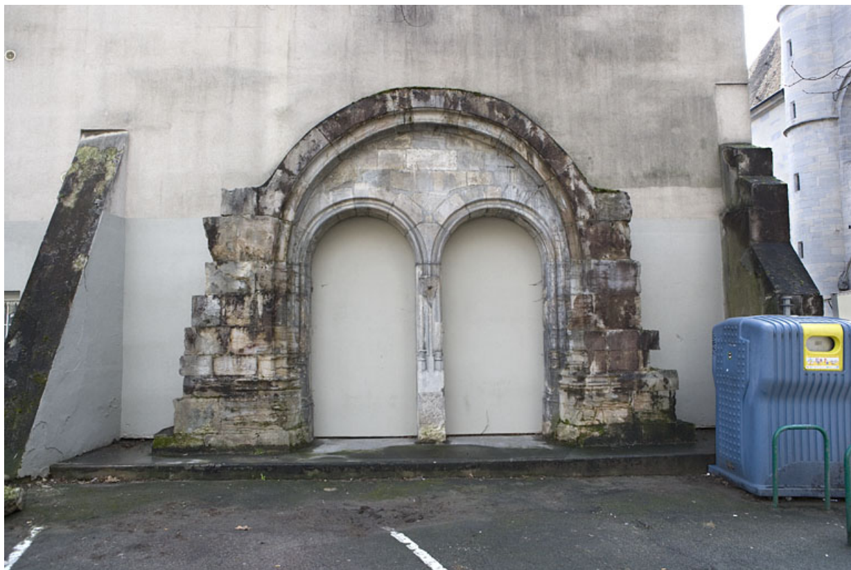
Détail de l'ancien portail d'entrée de l'église du couvent des Carmes, de face. 25, Besançon rue de la Préfecture, lieudit : îlot Granvelle