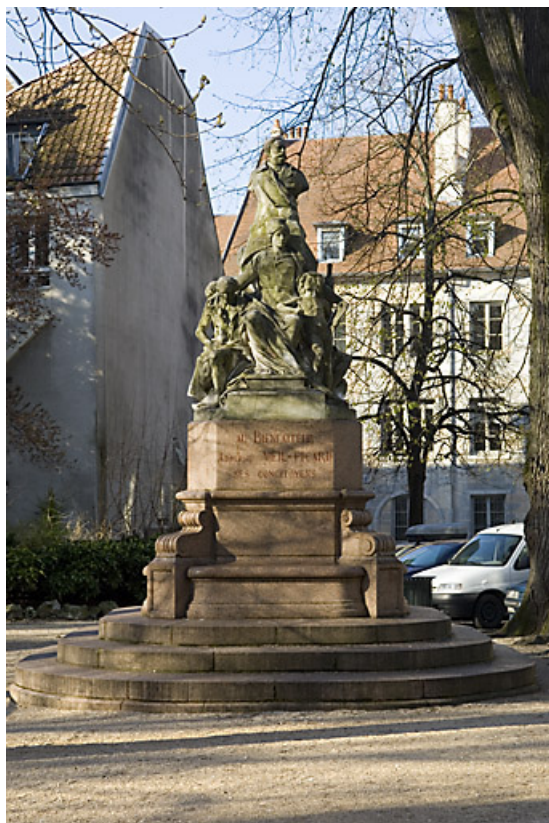
Monument dédié à Adolphe Viel-Picard : vue d'ensemble, de face. 25, Besançon rue de la Préfecture, lieudit : îlot Granvelle