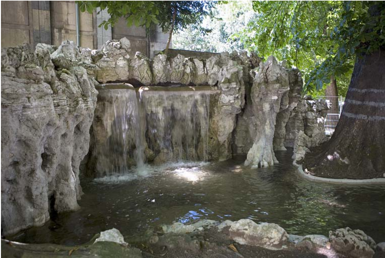
Vue rapprochée de la grotte artificielle.

25, Besançon rue de la Préfecture, lieudit : îlot Granvelle