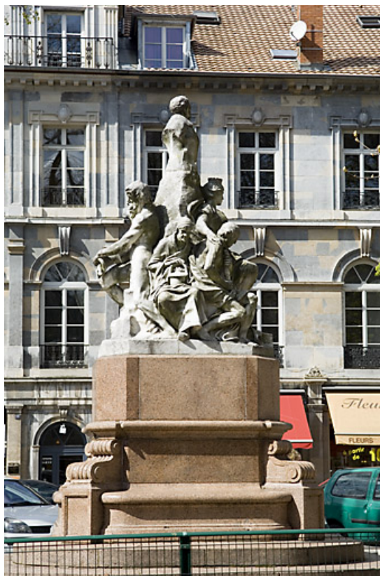
Monument dédié à Adolphe Viel-Picard : vue d'ensemble du côté du jardin public. 25, Besançon rue de la Préfecture, lieudit : îlot Granvelle