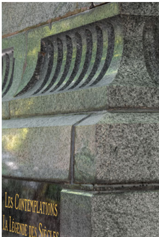
Porphyre vert de la graniterie du Pont de Miellin : socle du monument dédié à Victor Hugo, Besançon (promenade Granvelle).