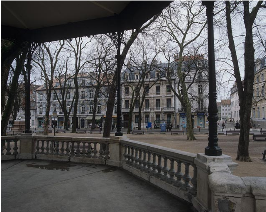
Vue d'ensemble depuis le kiosque à musique.

25, Besançon rue de la Préfecture, lieudit : îlot Granvelle