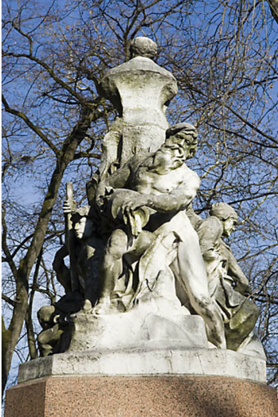
Monument dédié à Adolphe Viel-Picard : vue du personnage situé au revers du buste, de face. 25, Besançon rue de la Préfecture, lieudit : îlot Granvelle