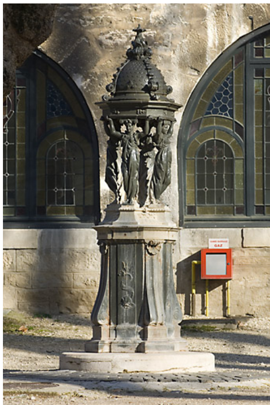
Borne fontaine dite fontaine wallace : vue d'ensemble. 25, Besançon rue de la Préfecture, lieudit : îlot Granvelle