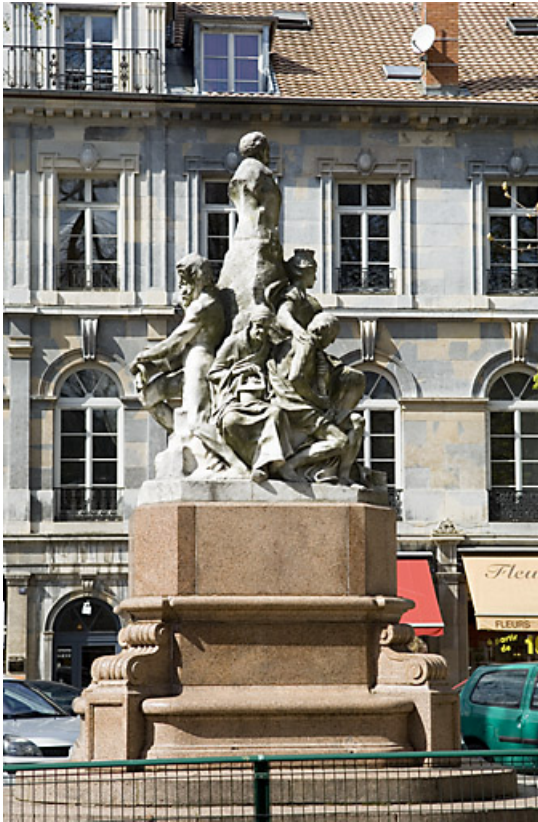
Monument dédié à Adolphe Viel-Picard : vue d'ensemble du côté du jardin public. 25, Besançon rue de la Préfecture, lieudit : îlot Granvelle