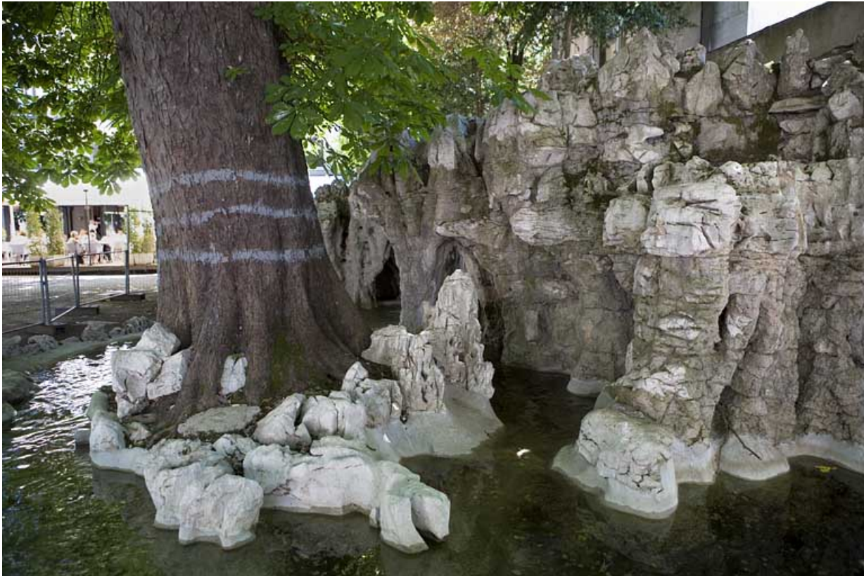
Détail de la grotte artificielle.

25, Besançon rue de la Préfecture, lieudit : îlot Granvelle