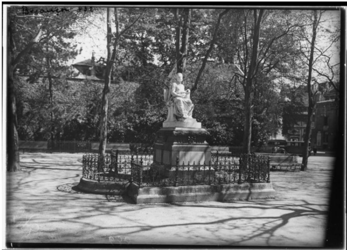
Monument dédié à Victor Hugo [1re moitié 20e siècle]. 25, Besançon rue de la Préfecture, lieudit : îlot Granvelle