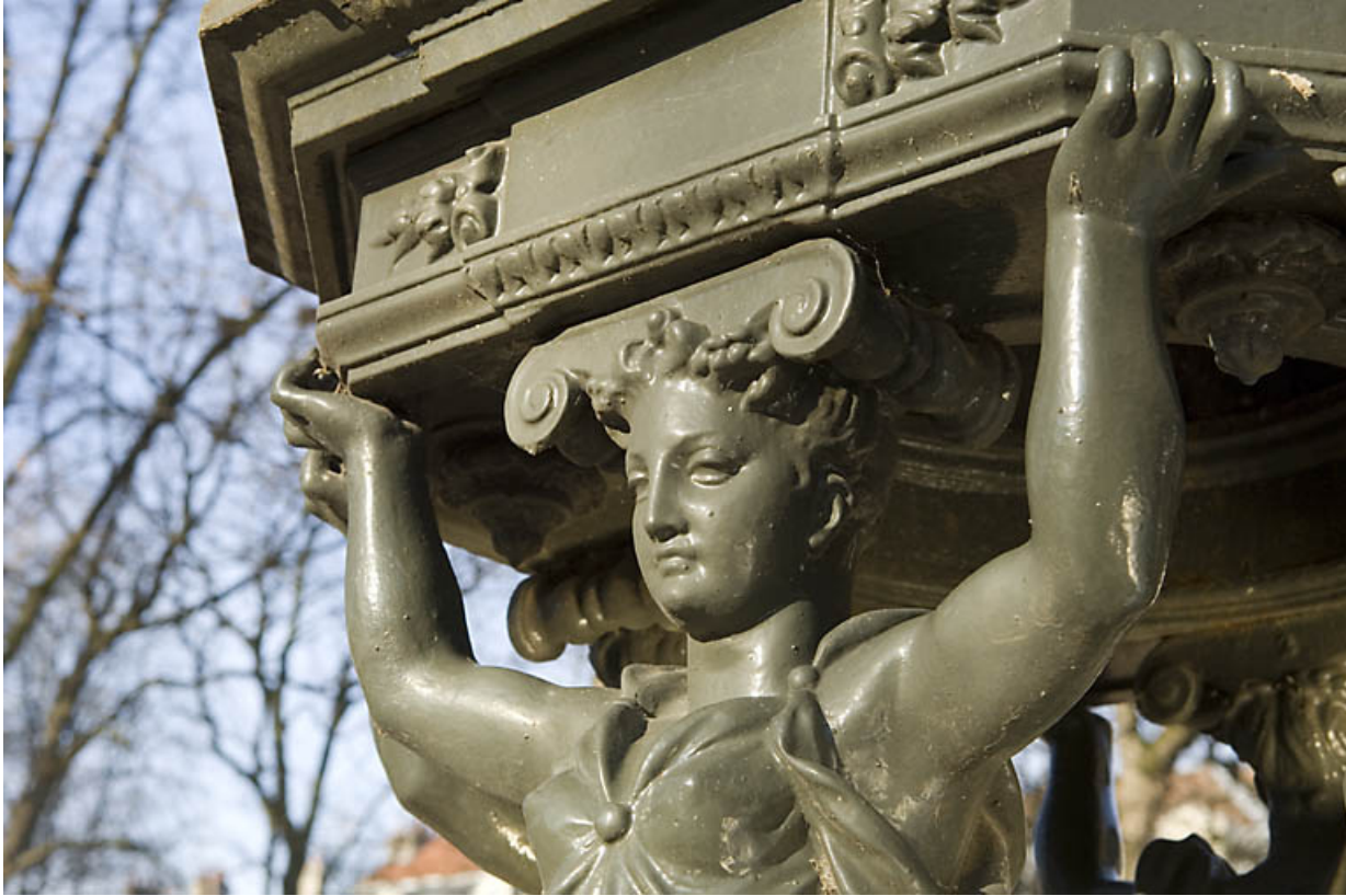
Borne fontaine dite fontaine wallace : détail d'une tête de cariatide. 25, Besançon rue de la Préfecture, lieudit : îlot Granvelle