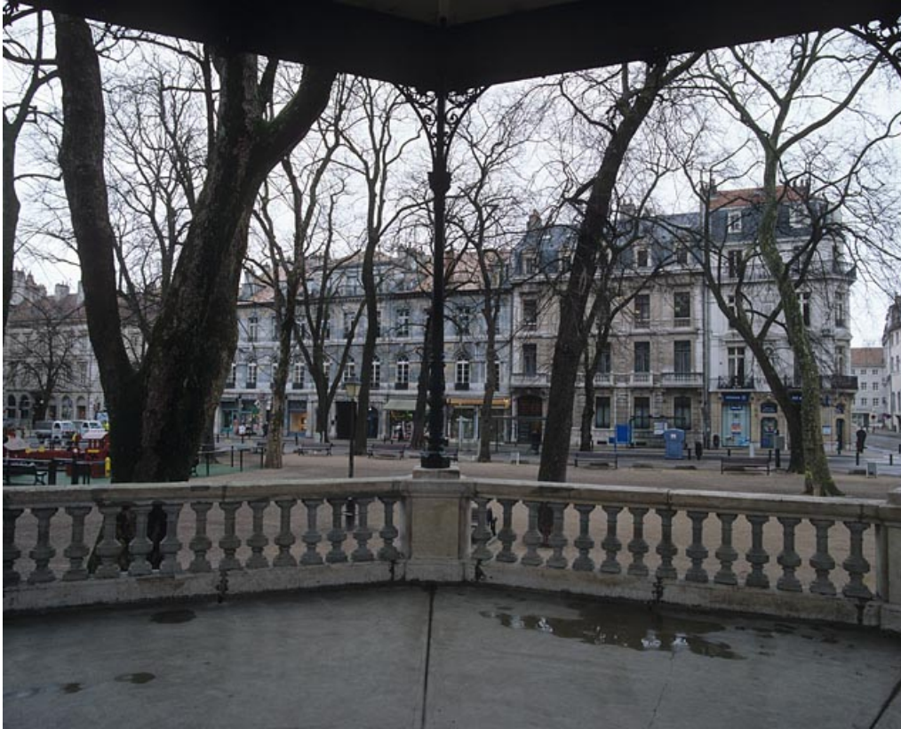
Vue d'ensemble depuis le kiosque à musique.

25, Besançon rue de la Préfecture, lieudit : îlot Granvelle