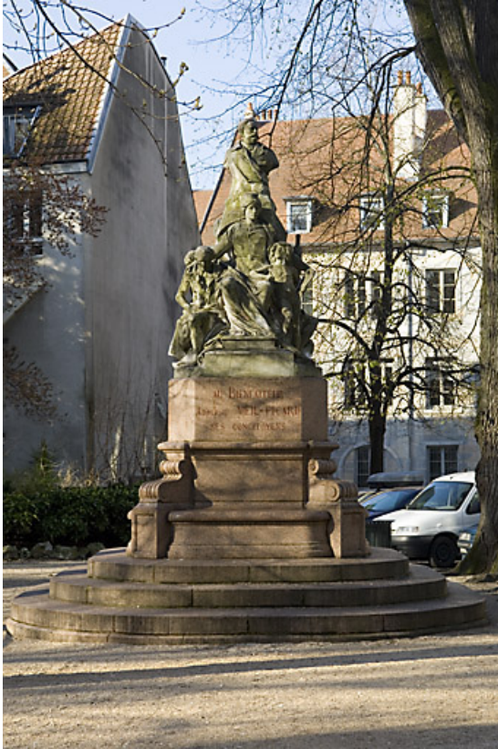
Monument dédié à Adolphe Viel-Picard : vue d'ensemble, de face.

25, Besançon rue de la Préfecture, lieudit : îlot Granvelle