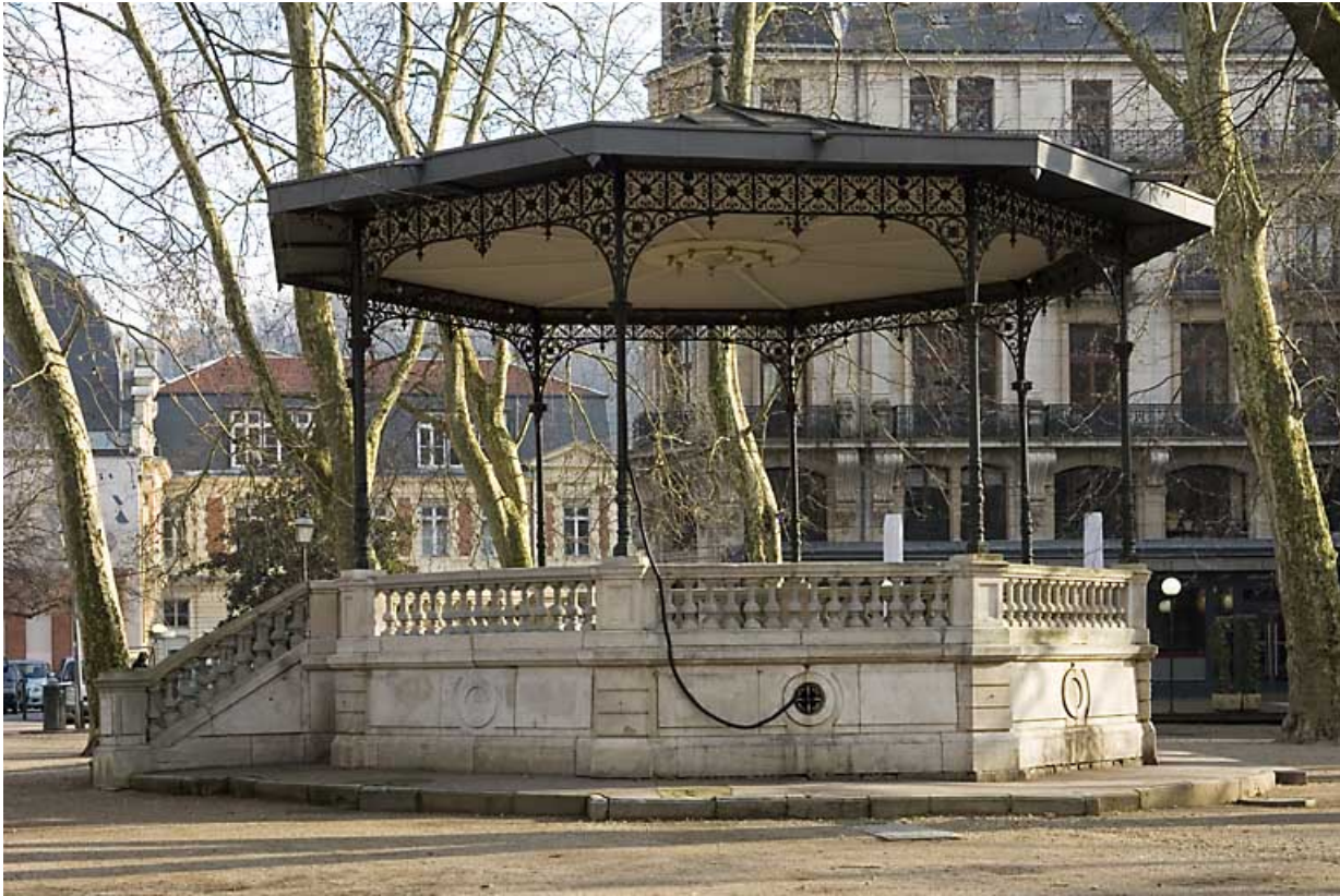
Vue d'ensemble du kiosque depuis la droite.

25, Besançon rue de la Préfecture, lieudit : îlot Granvelle