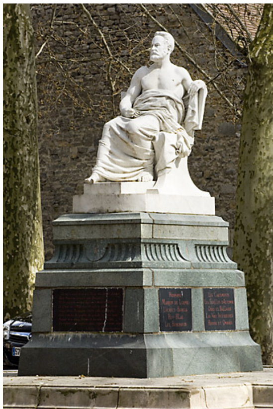
Monument dédié à Victor Hugo : de trois quarts droit, vue rapprochée.

25, Besançon rue de la Préfecture, lieudit : îlot Granvelle