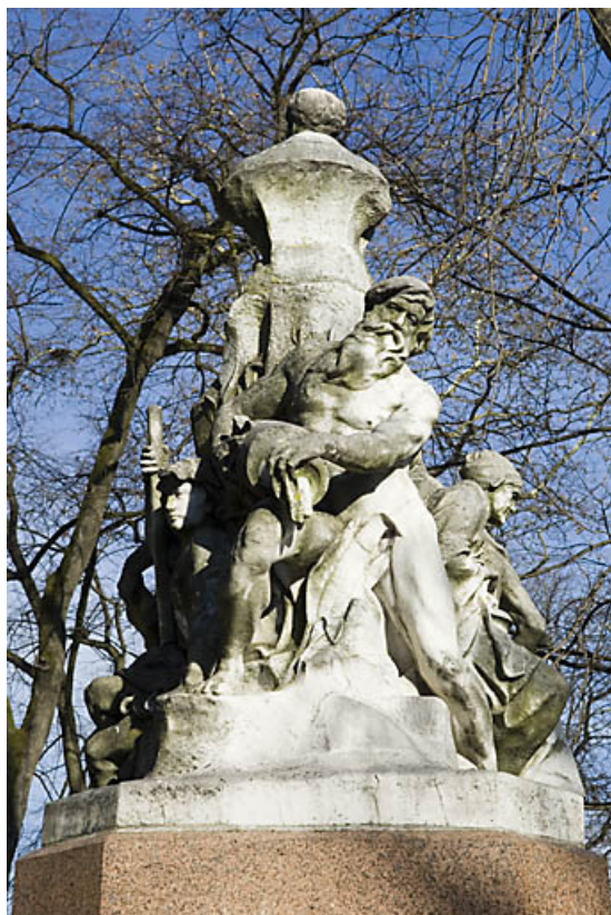
Monument dédié à Adolphe Viel-Picard : vue du personnage situé au revers du buste, de face. 25, Besançon rue de la Préfecture, lieudit : îlot Granvelle