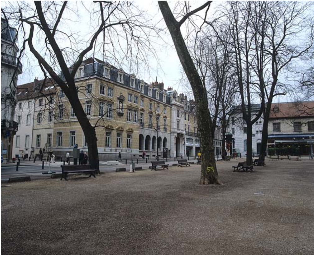
Vue d'ensemble avec la partie haute de la rue de la Préfecture.

25, Besançon rue de la Préfecture, lieudit : îlot Granvelle