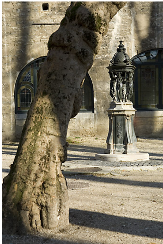
Borne fontaine dite fontaine wallace : vue d'ensemble éloignée.

25, Besançon rue de la Préfecture, lieudit : îlot Granvelle