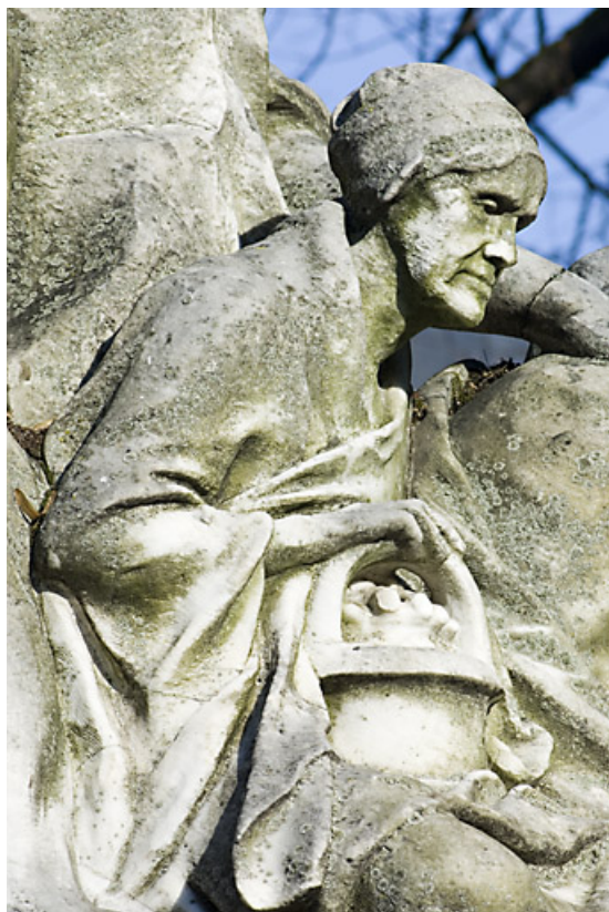
Monument dédié à Adolphe Viel-Picard : vue de la vieille femme située à gauche du buste, de profil. 25, Besançon rue de la Préfecture, lieudit : îlot Granvelle