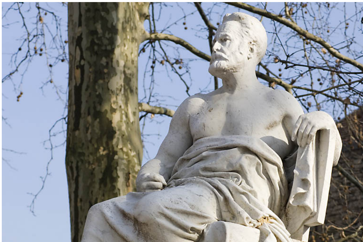
Monument dédié à Victor Hugo : détail du buste de la statue de trois quarts droit. 25, Besançon rue de la Préfecture, lieudit : îlot Granvelle