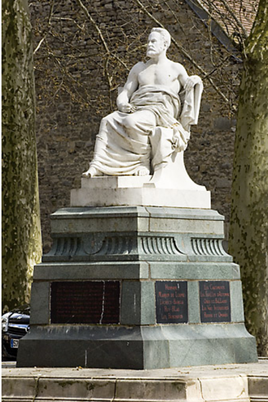
Monument dédié à Victor Hugo : de trois quarts droit, vue rapprochée.

25, Besançon rue de la Préfecture, lieudit : îlot Granvelle