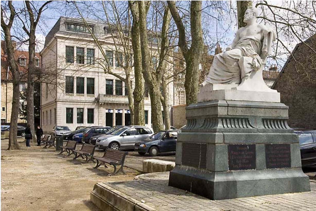
Monument dédié à Victor Hugo : vue d'ensemble de trois quarts droit.

25, Besançon rue de la Préfecture, lieudit : îlot Granvelle