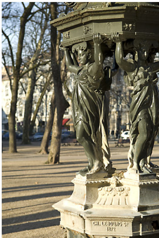
Borne fontaine dite fontaine wallace : détail de deux cariatide.

25, Besançon rue de la Préfecture, lieudit : îlot Granvelle