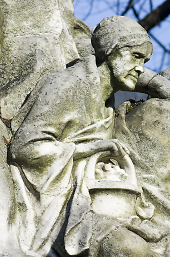
Monument dédié à Adolphe Viel-Picard : vue de la vieille femme située à gauche du buste, de profil. 25, Besançon rue de la Préfecture, lieudit : îlot Granvelle