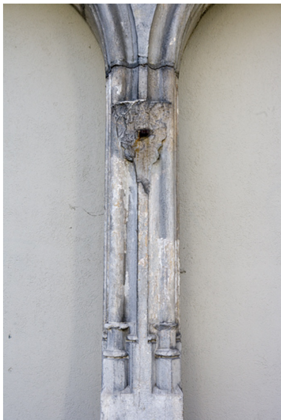
Détail du pilier central de l'ancien portail d'entrée de l'église du couvent des Carmes. 25, Besançon rue de la Préfecture, lieudit : îlot Granvelle