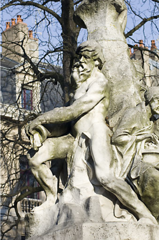
Monument dédié à Adolphe Viel-Picard : vue du personnage situé au revers du buste, de profil. 25, Besançon rue de la Préfecture, lieudit : îlot Granvelle