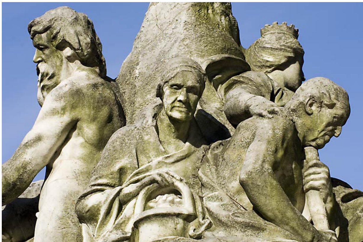
Monument dédié à Adolphe Viel-Picard : vue du groupe de personnages situé à gauche du buste, de face. 25, Besançon rue de la Préfecture, lieudit : îlot Granvelle