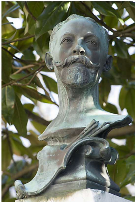
Monument dédié au peintre Théobald Chartran : détail du buste.

25, Besançon rue de la Préfecture, lieudit : îlot Granvelle