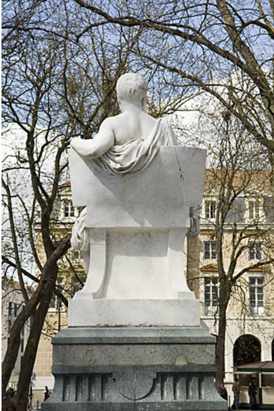
Monument dédié à Victor Hugo : de dos.

25, Besançon rue de la Préfecture, lieudit : îlot Granvelle