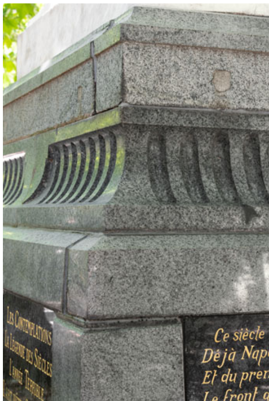
Monument dédié à Victor Hugo : détail du socle en porphyre vert fourni par la graniterie du Pont de Miellin. 25, Besançon rue de la Préfecture, lieudit : îlot Granvelle