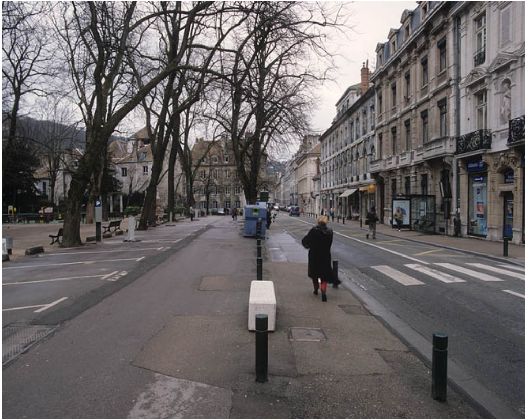
Vue d'ensemble depuis la partie haute de la rue de la Préfecture.

25, Besançon rue de la Préfecture, lieudit : îlot Granvelle