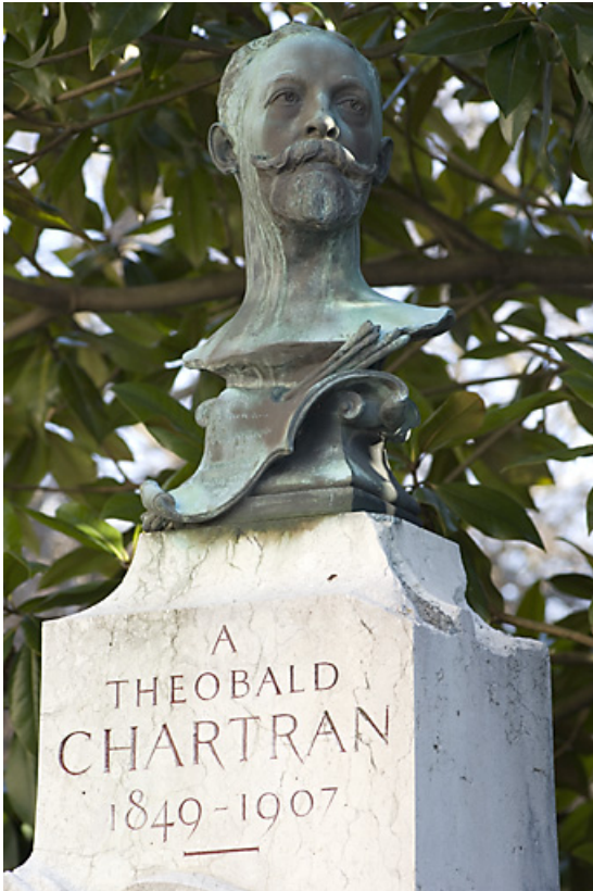
Monument dédié au peintre Théobald Chartran : détail du buste et de l'inscription. 25, Besançon rue de la Préfecture, lieudit : îlot Granvelle