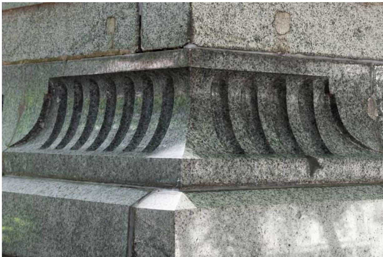
Monument dédié à Victor Hugo : détail du socle en porphyre vert fourni par la graniterie du Pont de Miellin. 25, Besançon rue de la Préfecture, lieudit : îlot Granvelle