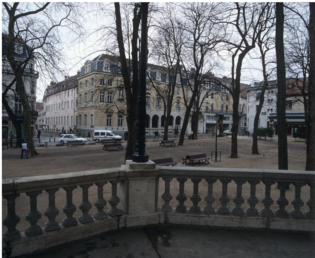
Vue d'ensemble depuis le kiosque à musique avec la partie haute de la rue de la Préfecture. 25, Besançon rue de la Préfecture, lieudit : îlot Granvelle