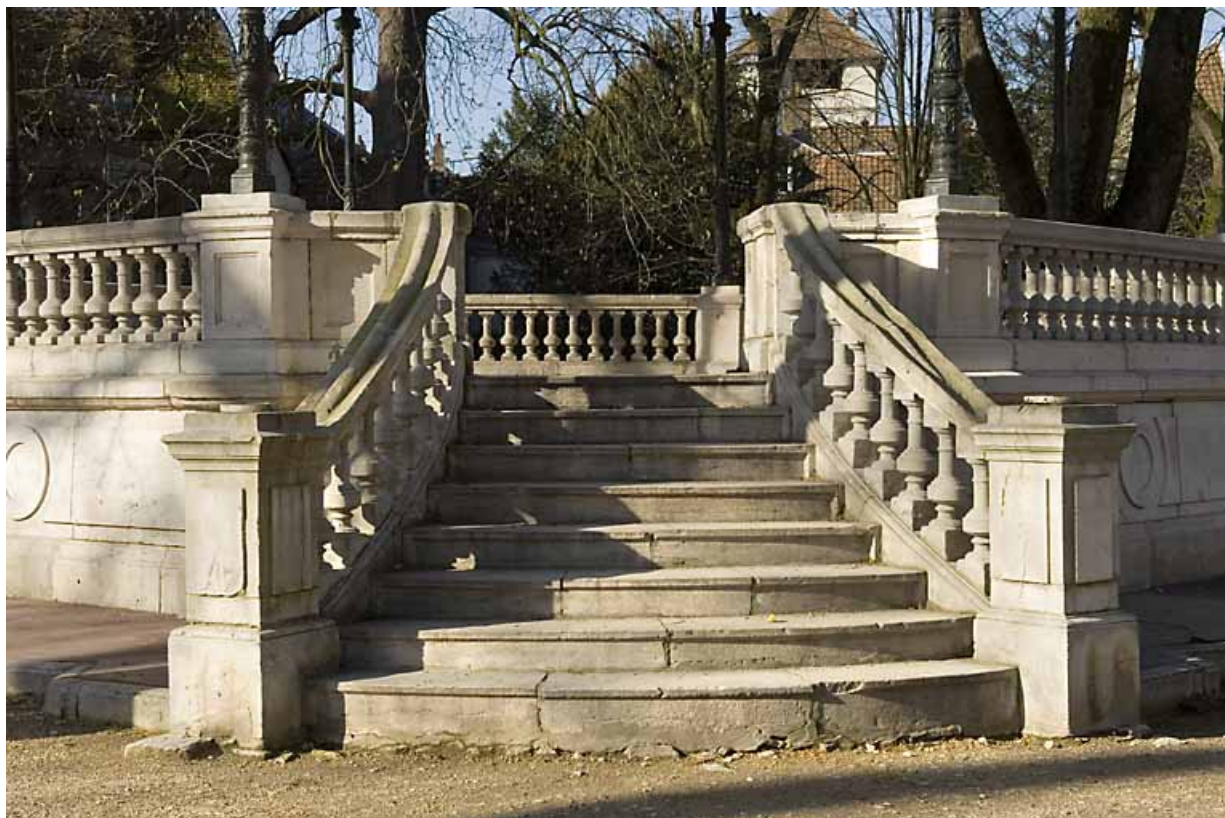
Kiosque : détail de la montée d'escalier.

25, Besançon rue de la Préfecture, lieudit : îlot Granvelle