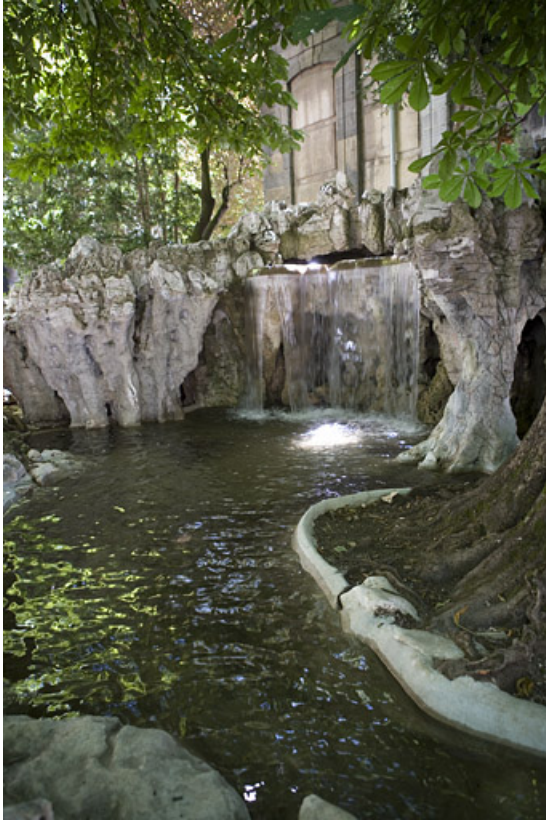
Détail de la grotte artificielle de trois quarts droit.

25, Besançon rue de la Préfecture, lieudit : îlot Granvelle