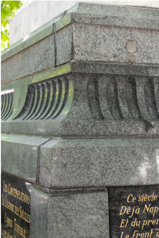
Monument dédié à Victor Hugo : détail du socle en porphyre vert fourni par la graniterie du Pont de Miellin. 25, Besançon rue de la Préfecture, lieudit : îlot Granvelle