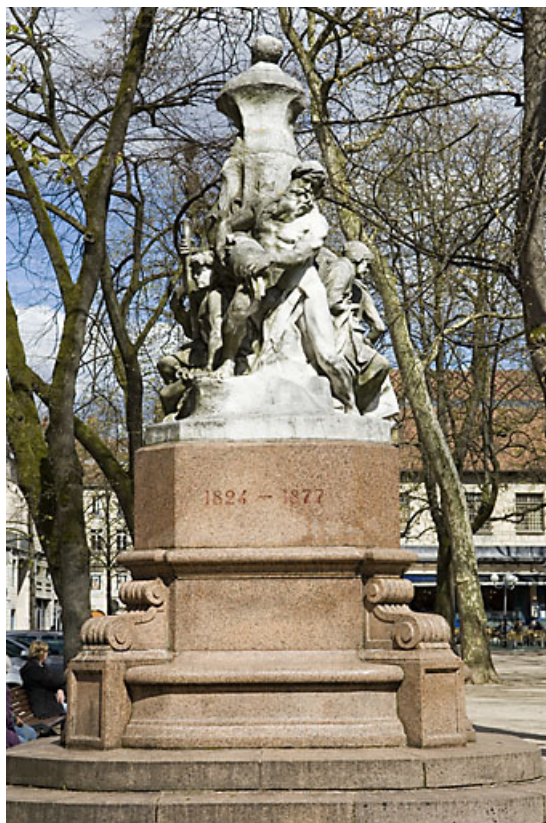
Monument dédié à Adolphe Viel-Picard : vue d'ensemble du côté de la rue. 25, Besançon rue de la Préfecture, lieudit : îlot Granvelle