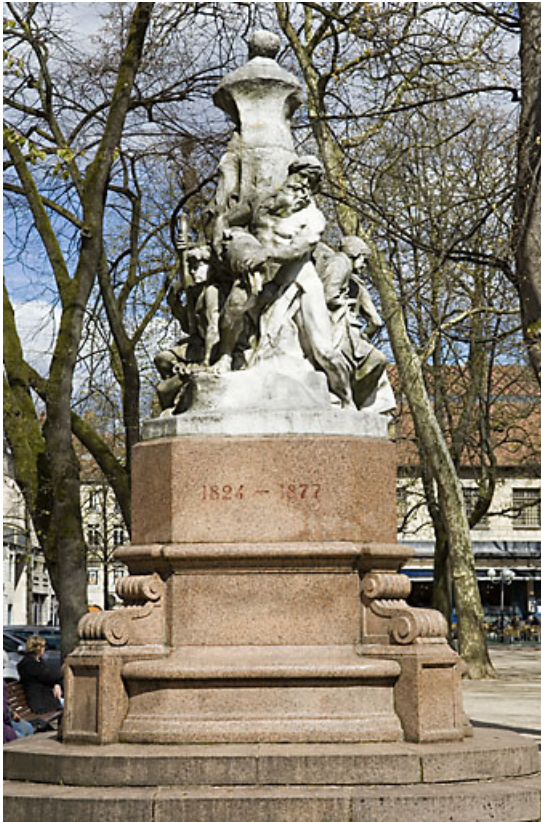
Monument dédié à Adolphe Viel-Picard : vue d'ensemble du côté de la rue.

25, Besançon rue de la Préfecture, lieudit : îlot Granvelle