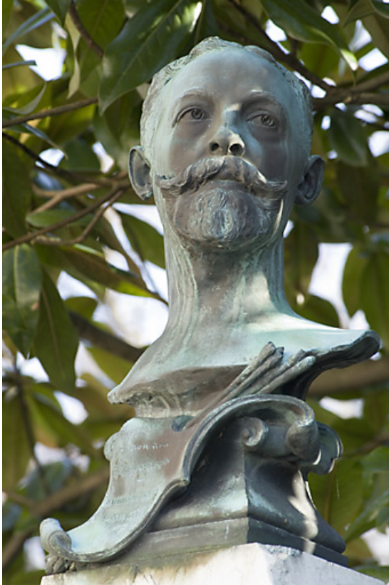
Monument dédié au peintre Théobald Chartran : détail du buste.

25, Besançon rue de la Préfecture, lieudit : îlot Granvelle