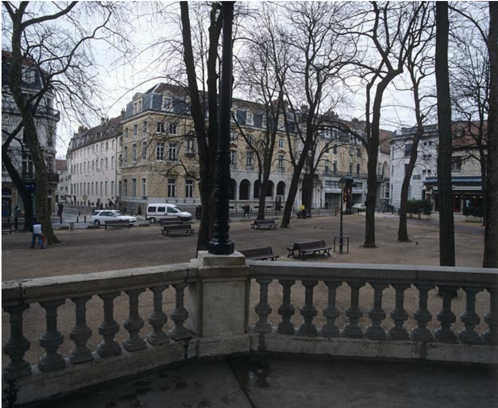
Vue d'ensemble depuis le kiosque à musique avec la partie haute de la rue de la Préfecture. 25, Besançon rue de la Préfecture, lieudit : îlot Granvelle