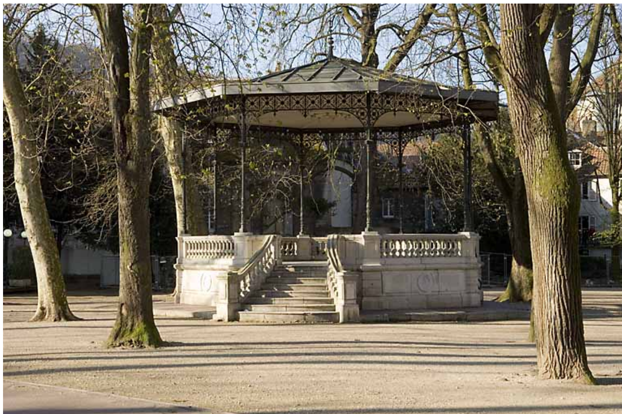
Kiosque : vue d'ensemble, de face.

25, Besançon rue de la Préfecture, lieudit : îlot Granvelle