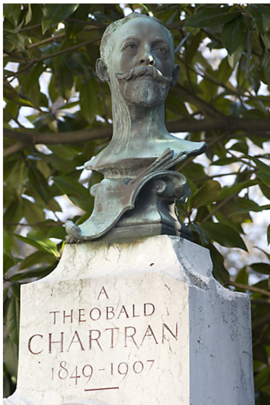
Monument dédié au peintre Théobald Chartran : détail du buste et de l'inscription.

25, Besançon rue de la Préfecture, lieudit : îlot Granvelle