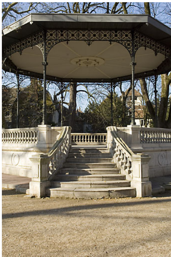
Kiosque : vue de face avec la montée d'escalier.

25, Besançon rue de la Préfecture, lieudit : îlot Granvelle