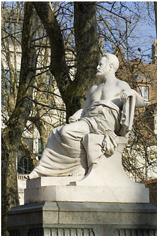
Monument dédié à Victor Hugo : vue de la statue de trois quarts droit. 25, Besançon rue de la Préfecture, lieudit : îlot Granvelle