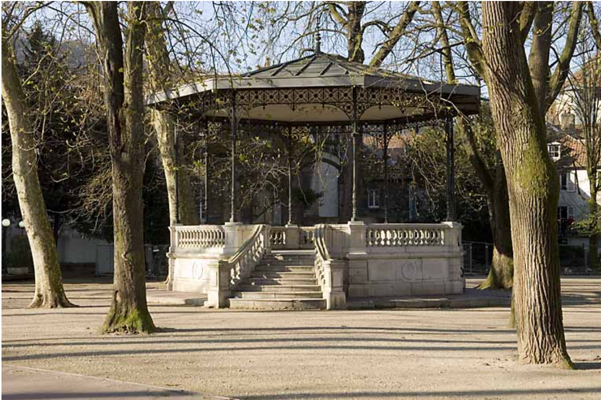
Kiosque : vue d'ensemble, de face.

25, Besançon rue de la Préfecture, lieudit : îlot Granvelle