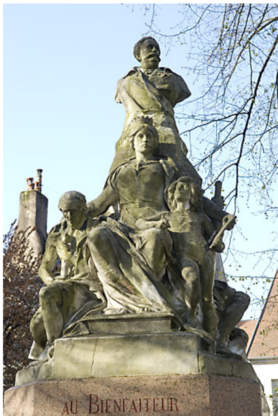
Monument dédié à Adolphe Viel-Picard : vue du groupe de statues, de face. 25, Besançon rue de la Préfecture, lieudit : îlot Granvelle