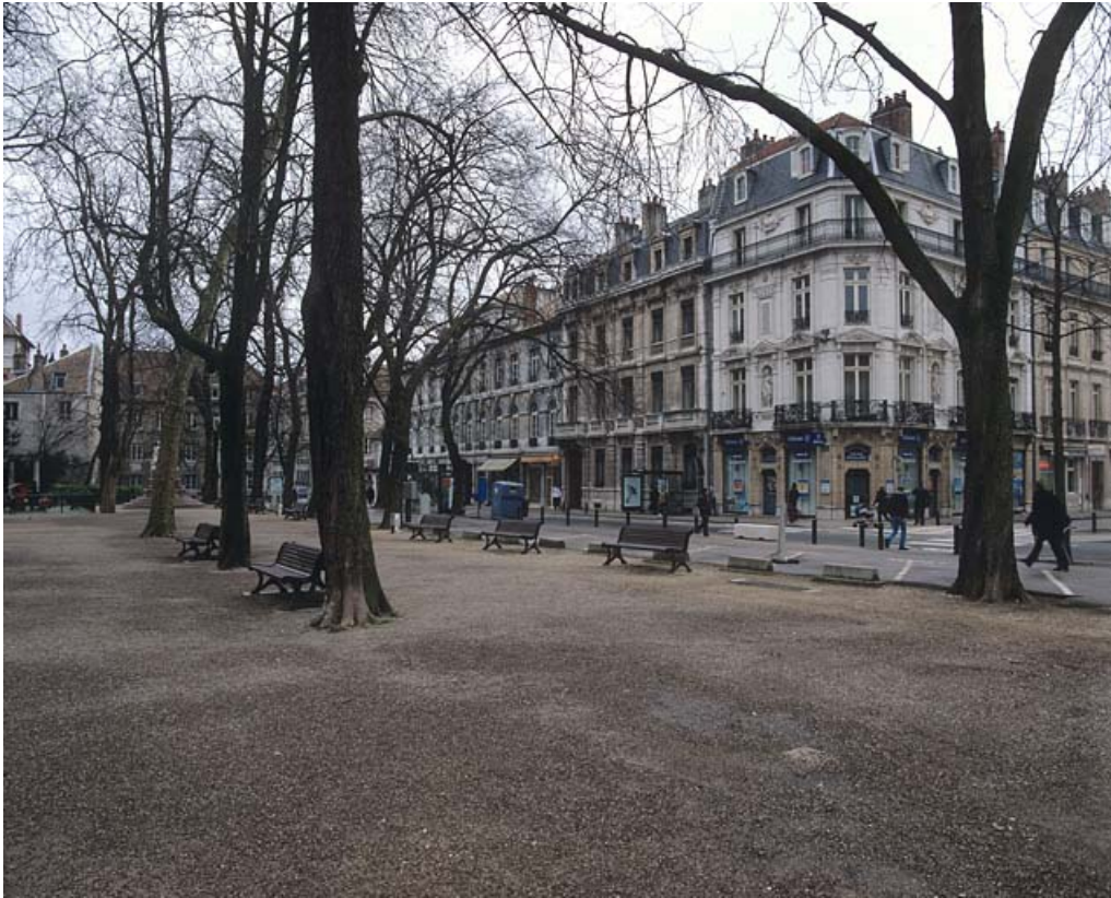
Vue d'ensemble de la partie située le long de la rue de la Préfecture.

25, Besançon rue de la Préfecture, lieudit : îlot Granvelle