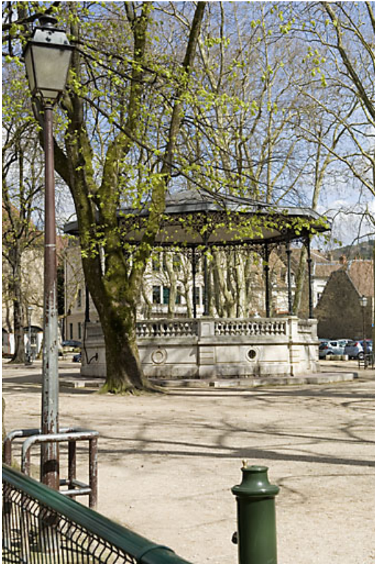
Kiosque : vue éloignée.

25, Besançon rue de la Préfecture, lieudit : îlot Granvelle