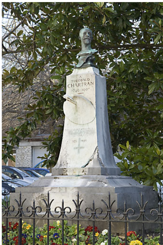
Monument dédié au peintre Théobald Chartran : vue d'ensemble.

25, Besançon rue de la Préfecture, lieudit : îlot Granvelle