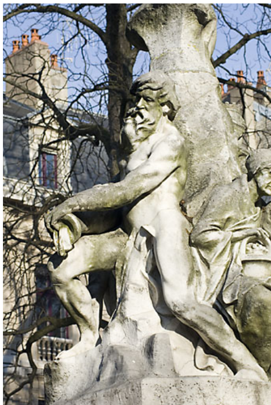
Monument dédié à Adolphe Viel-Picard : vue du personnage situé au revers du buste, de profil. 25, Besançon rue de la Préfecture, lieudit : îlot Granvelle