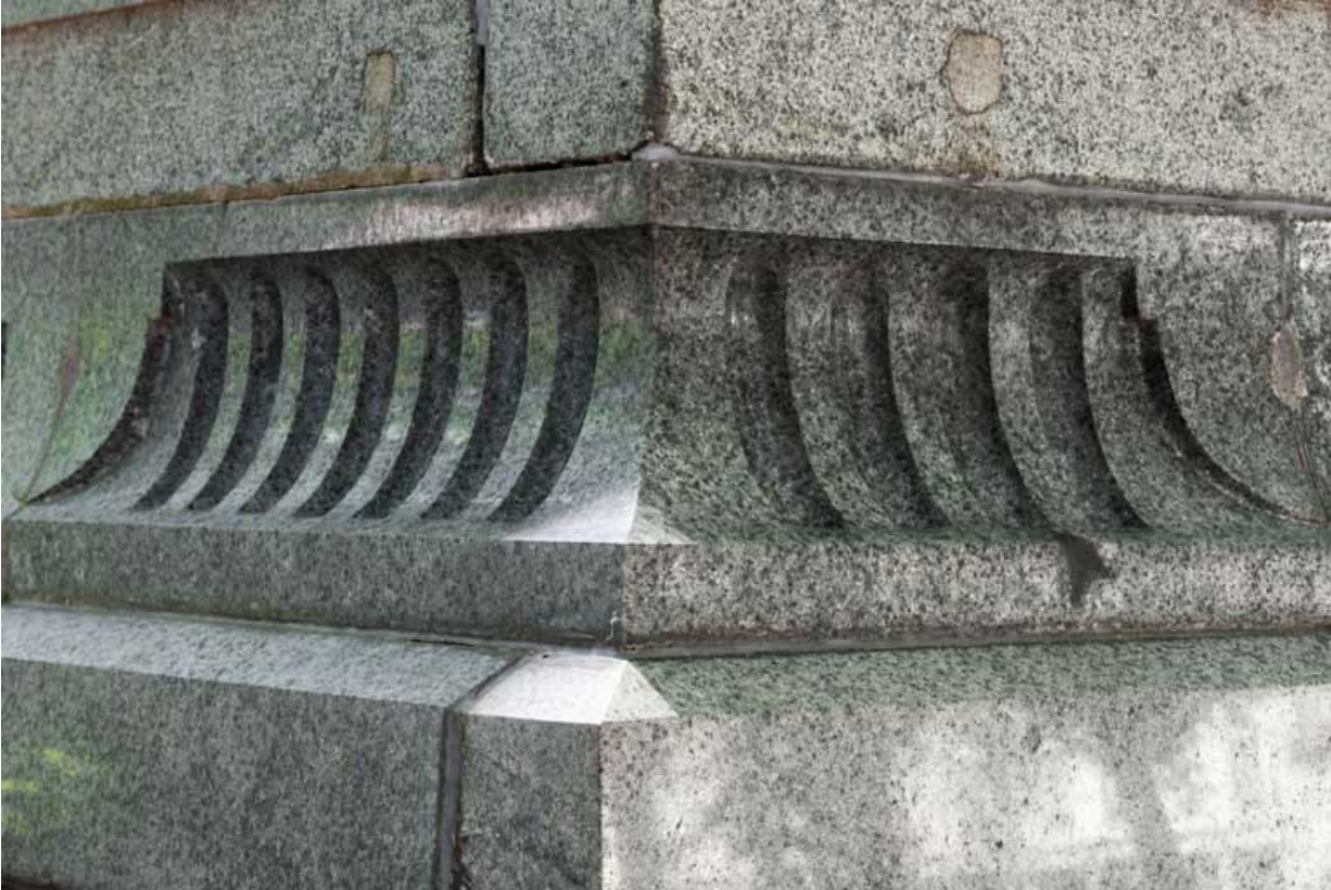
Monument dédié à Victor Hugo : détail du socle en porphyre vert fourni par la graniterie du Pont de Miellin. 25, Besançon rue de la Préfecture, lieudit : îlot Granvelle