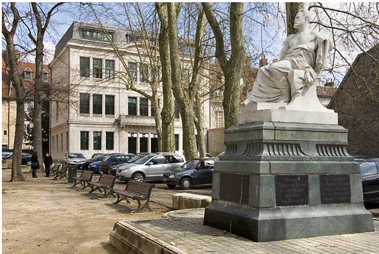
Monument dédié à Victor Hugo : vue d'ensemble de trois quarts droit.

25, Besançon rue de la Préfecture, lieudit : îlot Granvelle