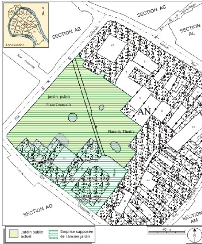
Plan masse et de situation. Extrait du plan cadastral, 1974, section AN. 25, Besançon rue de la Préfecture, lieudit : îlot Granvelle