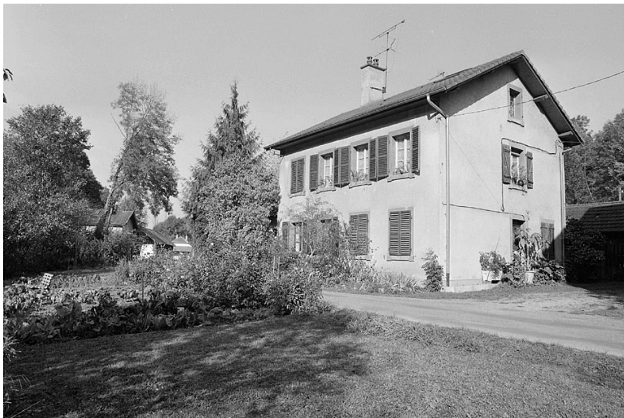
Vue de trois quarts du logement collectif ouest.

25, Baume-les-Dames, 9, 11 rue des Pipes, lieudit : Gondé