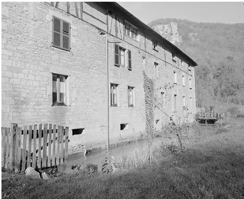
Façade sur le canal depuis le sud.

25, Baume-les-Dames, 6 à 10 rue des Pipes, lieudit : Gondé