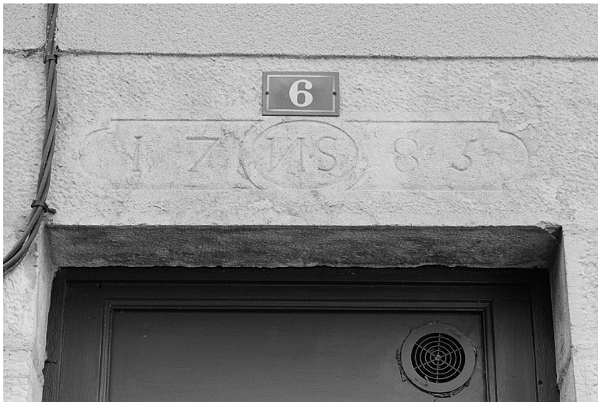
Façade ouest. Détail d'un linteau de porte.

25, Baume-les-Dames, 6 à 10 rue des Pipes, lieudit : Gondé