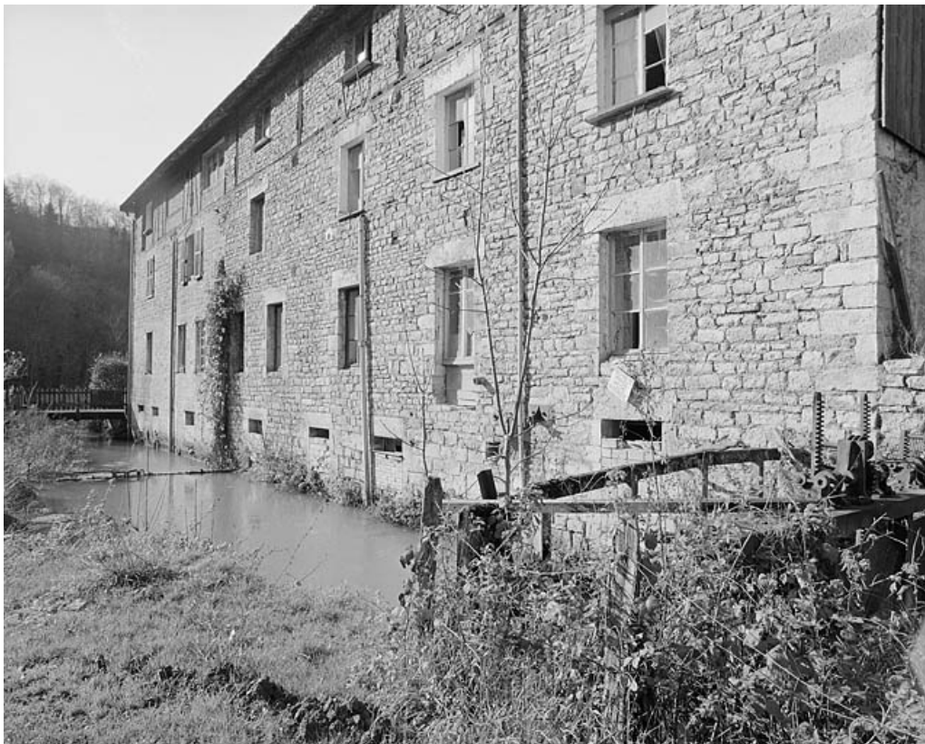
Façade sur le canal.

25, Baume-les-Dames, 6 à 10 rue des Pipes, lieudit : Gondé