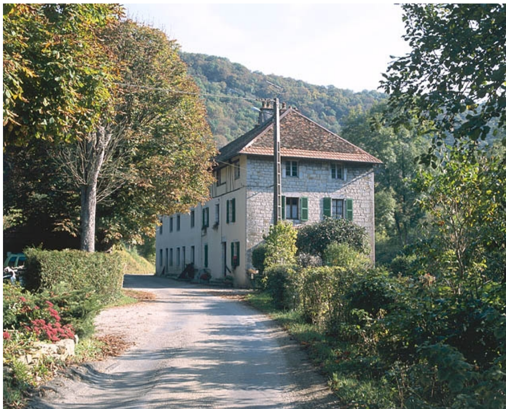
Vue depuis l'ouest.

25, Baume-les-Dames, 6 à 10 rue des Pipes, lieudit : Gondé