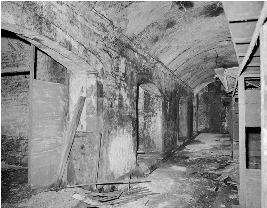
Rez-de-chaussée, sous la grande salle, pièce transversale à l'est. 25, Montbéliard, 12 rue des Huisselets