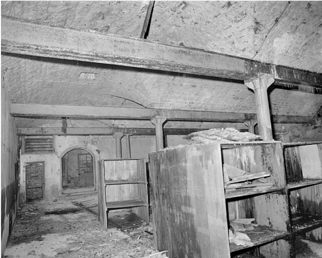
Premier étage, grande salle, côté sud.