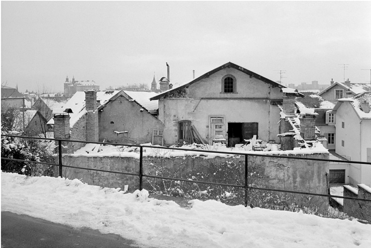
Pignons, côté nord.