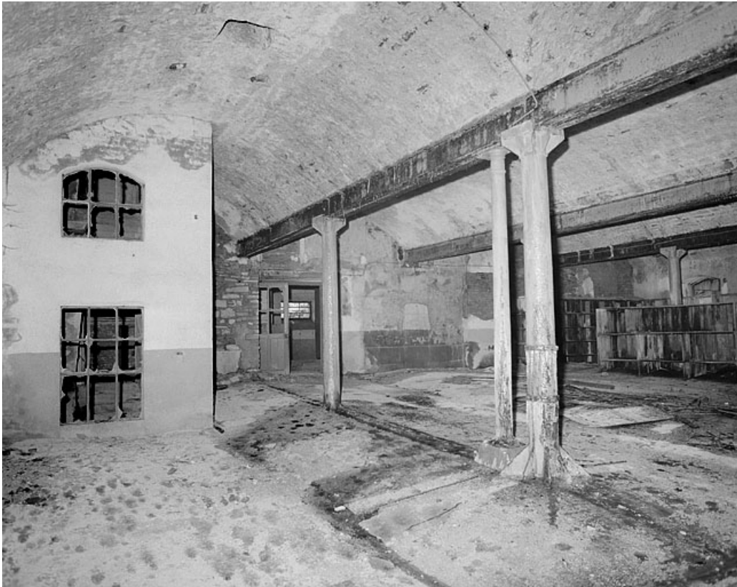
Premier étage, grande salle, côté ouest.