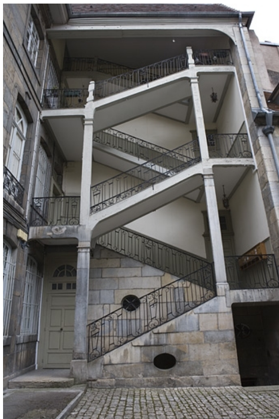
Vue d'ensemble de l'escalier à cage ouverte de face. 25, Besançon, 51 rue Mégevand, lieudit : îlot Granvelle