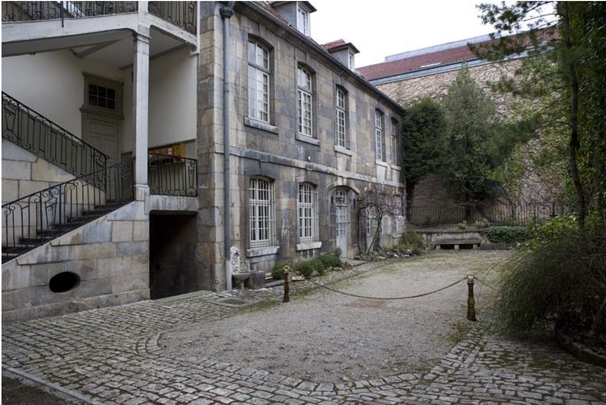
Vue d'ensemble de l'aile gauche sur cour.

25, Besançon, 51 rue Mégevand, lieudit : îlot Granvelle