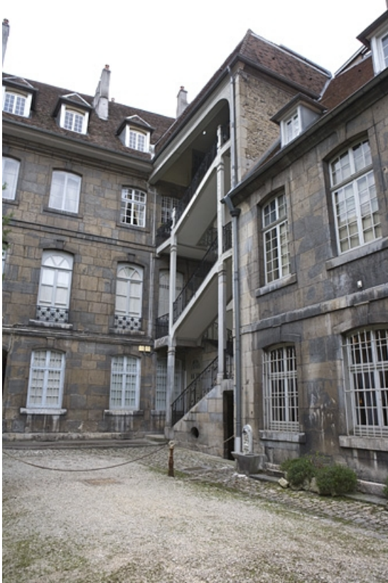
Vue d'ensemble de l'escalier à cage ouverte de trois quart droit.

25, Besançon, 51 rue Mégevand, lieudit : îlot Granvelle