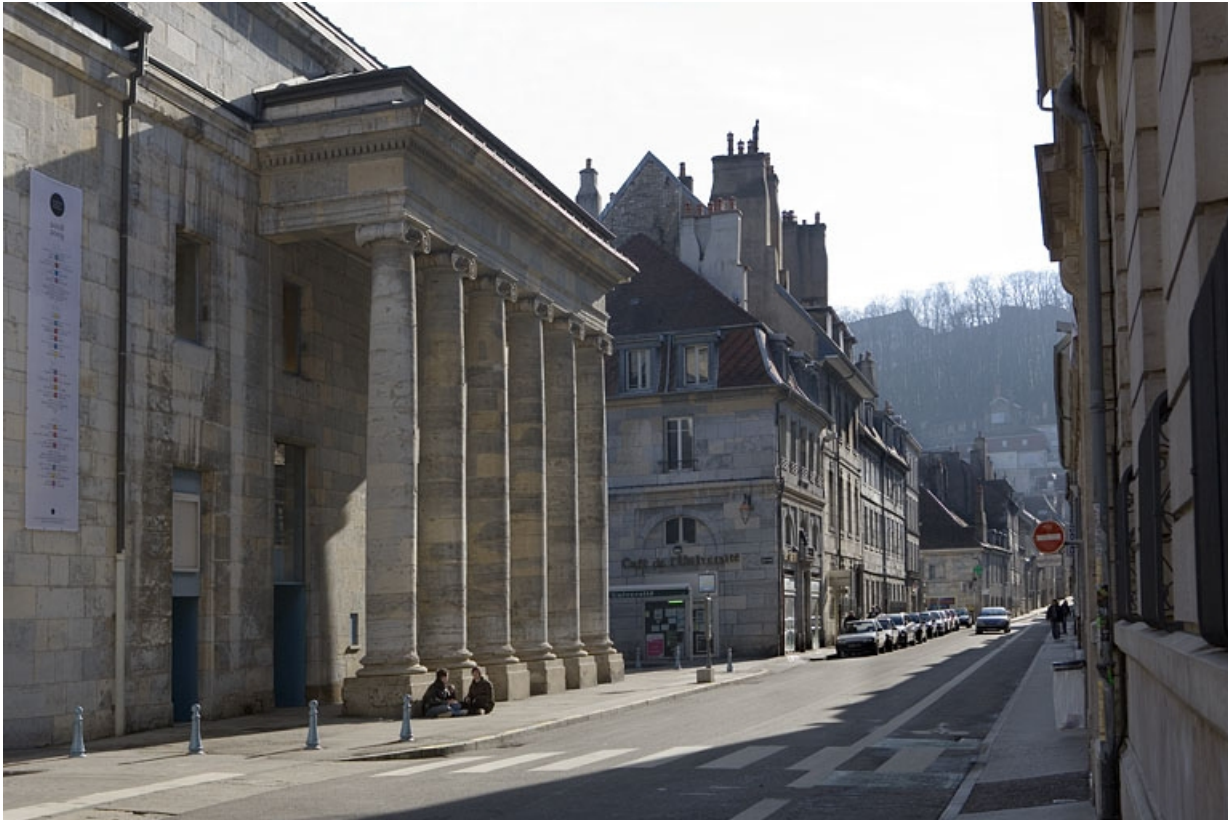
Vue éloignée avec la colonnade du théâtre.

25, Besançon, 51 rue Mégevand, lieudit : îlot Granvelle