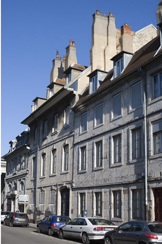
Vue d'ensemble de trois quarts droit.

25, Besançon, 51 rue Mégevand, lieudit : îlot Granvelle