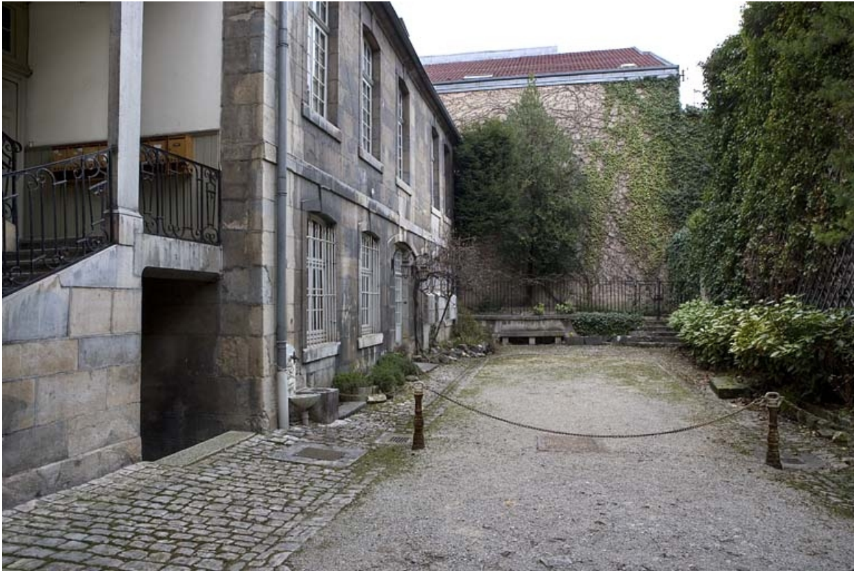
Vue d'ensemble rapprochée de l'aile gauche sur cour.

25, Besançon, 51 rue Mégevand, lieudit : îlot Granvelle