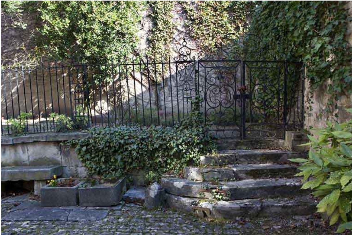
Détail de la grille du jardin en fer forgé.

25, Besançon, 51 rue Mégevand, lieudit : îlot Granvelle