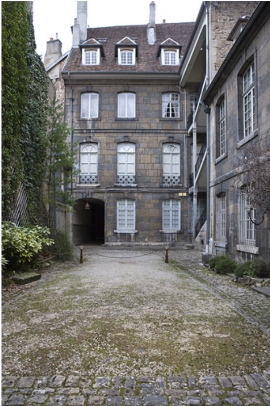
Vue d'ensemble de la façade postérieure du logis sur rue depuis le fond de la cour. 25, Besançon, 51 rue Mégevand, lieudit : îlot Granvelle