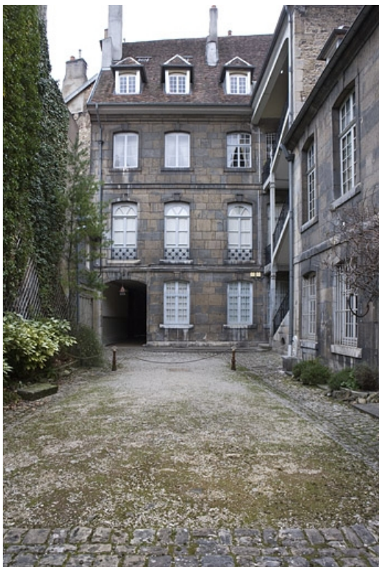
Vue d'ensemble de la façade postérieure du logis sur rue depuis le fond de la cour.

25, Besançon, 51 rue Mégevand, lieudit : îlot Granvelle