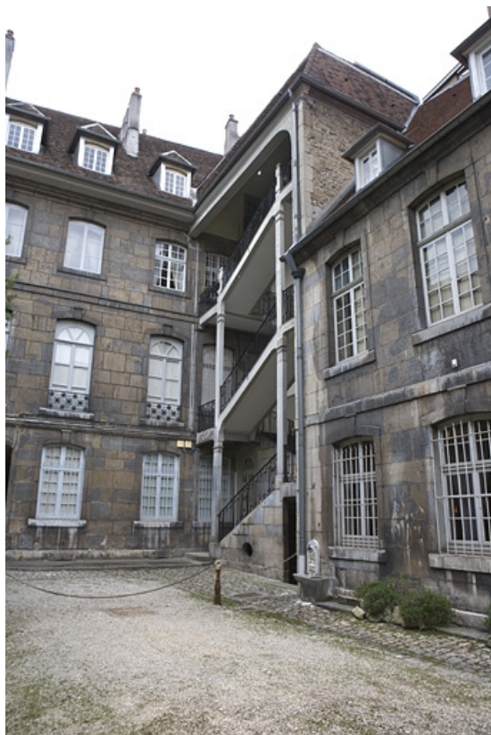
Vue d'ensemble de l'escalier à cage ouverte de trois quart droit.

25, Besançon, 51 rue Mégevand, lieudit : îlot Granvelle