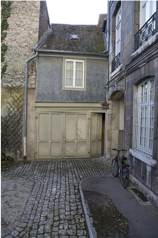
Détail d'une remise à droite de la cour.

25, Besançon, 51 rue Mégevand, lieudit : îlot Granvelle