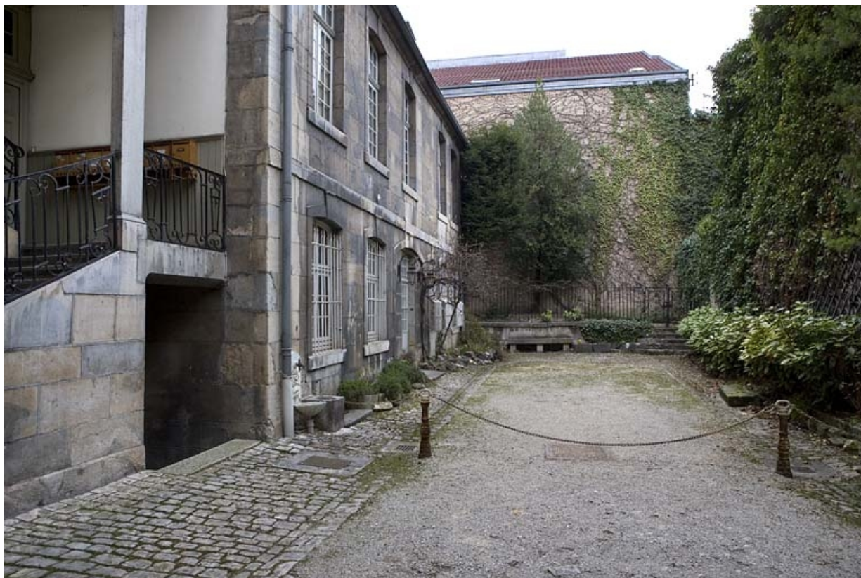
Vue d'ensemble rapprochée de l'aile gauche sur cour.

25, Besançon, 51 rue Mégevand, lieudit : îlot Granvelle